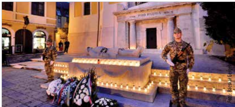
Az első világháborús hősökért égtek a gyertyák

kezdődtek, majd a Vörösmarty téren folytatódtak a Császári és Királyi 69-es Gyalogezred emlékművénél. Emlékeztek a Zichy ligetben, a Magyar Királyi 17-es Honvéd Gyalogezred emlékművénél, majd a Városház téren a 10-es Huszárezred emlékművénél és a Fekvő katona szobránál, hogy a csatatereken maradt déd- és ükapák hősi katonai helytállása, küzdelme ne merüljön feledésbe!