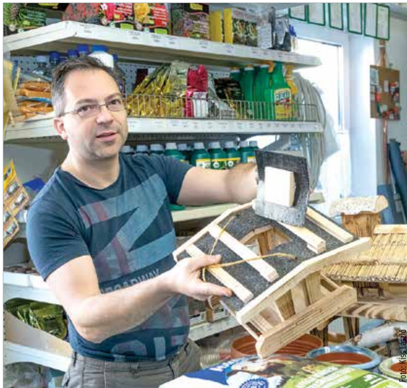
A madáretetővel megmenthetjük a madarakat