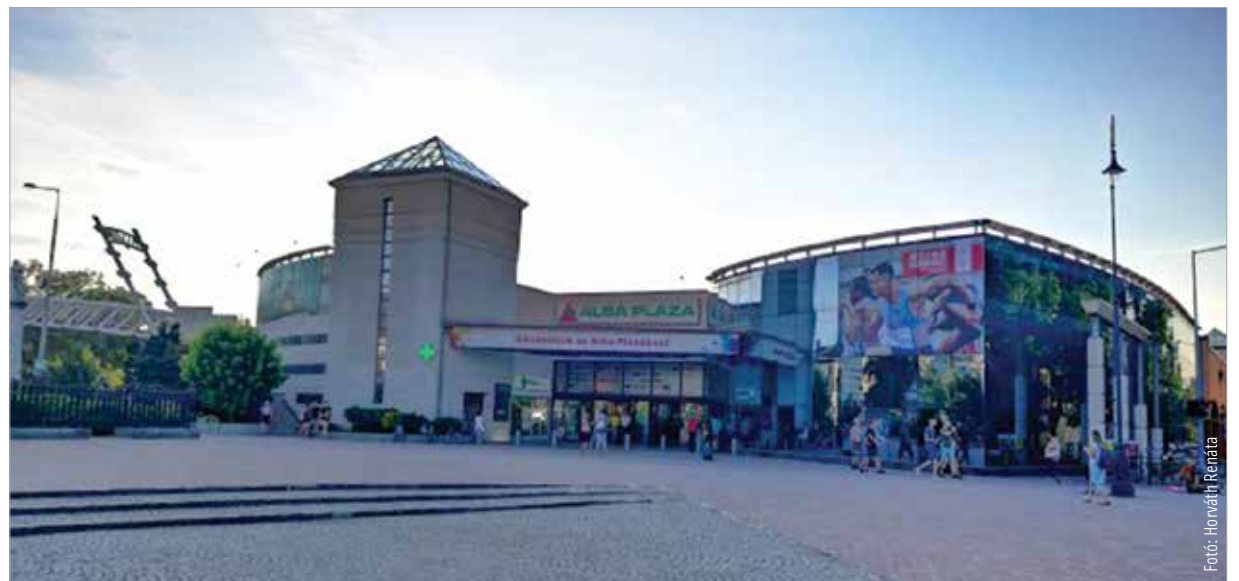
Jövőre felújítják és bővítik a fehérvári pláza épületét