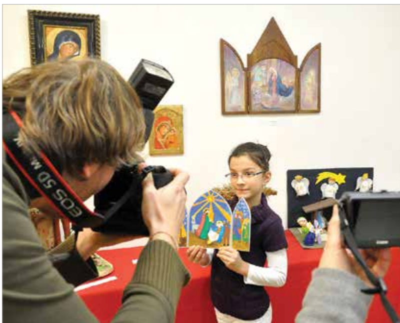
A legkisebbek munkáit is várják

A pályázat célja, hogy segítse a Jézus születésének ünnepére való méltó felkészülést, éltesse és felmutassa a magyar szakrális népművészet gazdag hagyományait, ösztönözze a gyermekek és felnőttek alkotókedvét.