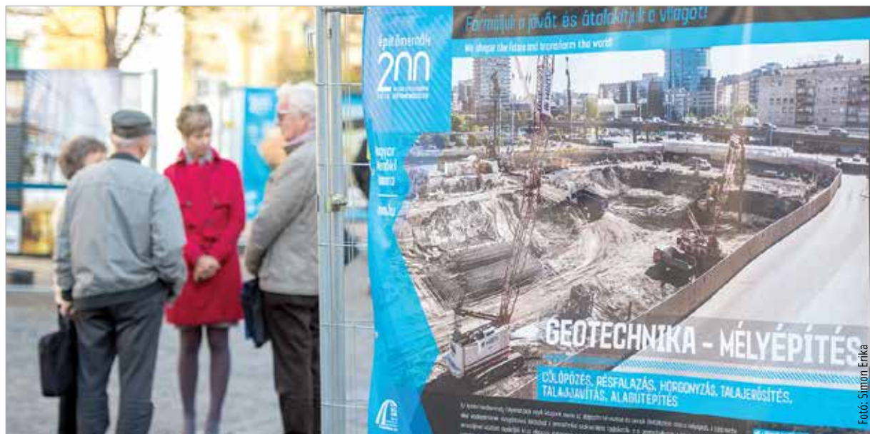
A Városház téren megismerhetjük az utóbbi évek magyar mérnöki alkotásait

A vándorkiállítás november 11-ig látható városunkban, majd Békéscsabán, Kecskeméten, Győrben, Szolnokon és Baján is bemutatják a következő hetekben.