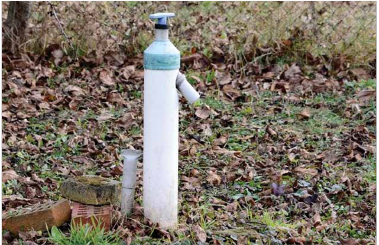
Nem csak az ásott kúthoz, a fúrt kutakhoz is kell engedély!