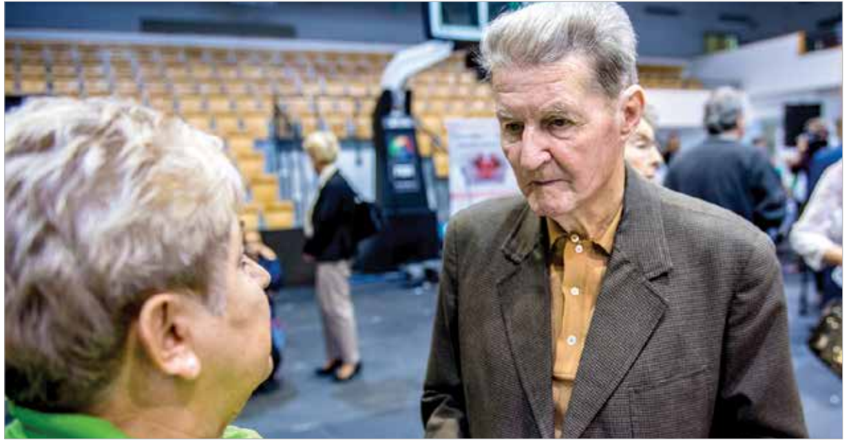
A szűrőnapra érkezőket közel száznegyven kórházi szakember segítette a vizsgálatok alatt

A szűrőnapra érkezőket közel száznegyven kórházi szakember segítette a vizsgálatok alatt. A betegségek felszínre kerülése