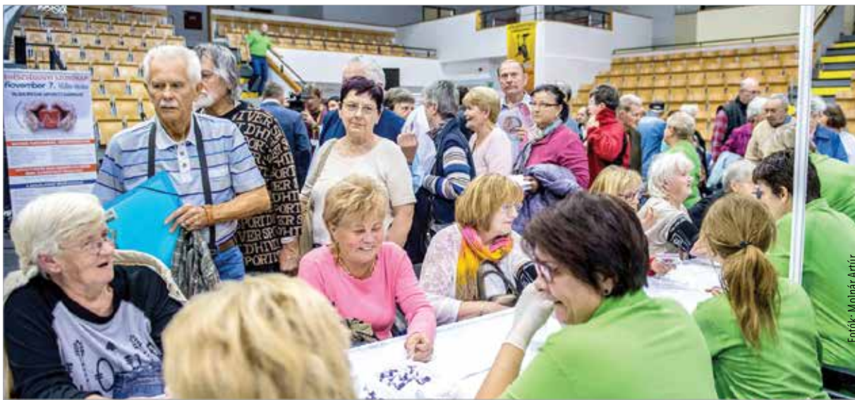
A legkülönbébb vizsgálatokon, tanácsadásokon vehettek részt az ötödik alkalommal életre hívott szűrőnapon