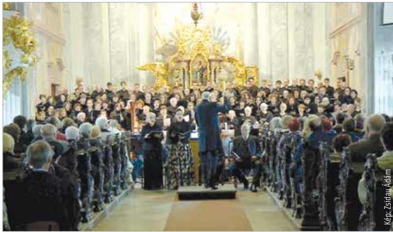
Koncert a tisztelet hangján