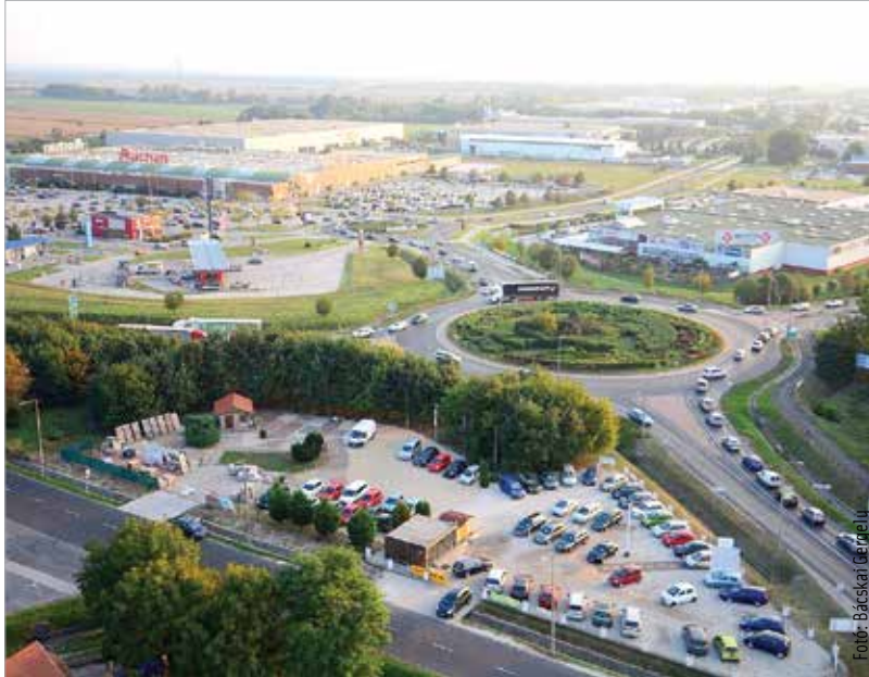
Az Auchan melletti körforgalom hatalmas forgalmat bonyolít le, csúcsidőben minden irányban visszaduzzasztja a forgalmat, jelentős dugókat okozva. Ezen enyhíthet a tervezett átalakítás.

Az Innovációs és Technológiai Minisztérium felé több jelzés érkezett Székesfehérvár részéről is, hogy a jelentős forgalomműködés miatt feltorlódnak a sor az M7-es autópálya lekanyarodó sávjában, aminek oka az „Auchan-körforgalom”, azaz a 8. számú főút, a 63-as számú főút és a Sárkeresztúri út csomópontjának visszaduzzasztó hatása.