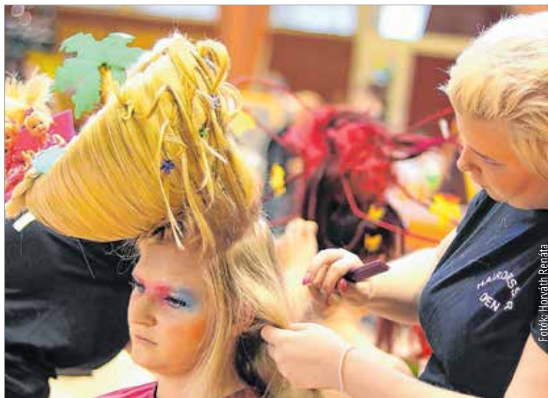
Lazulnak Barbie kistesói, a Chelsea-k

Persze azokat a frizurákat senki nem fogja egy álmos hétköznap reggelen, karikás szemekkel pár perc alatt a tükör előtt összedobni, amiket a Hairdresser Open 2018-on készítettek a fodrásztanulók. A nemzetközi fodrászverseny leglátványosabb része ugyanis nem az utca divatját, hanem az haute couture-t helyezte előtérbe – vagyis