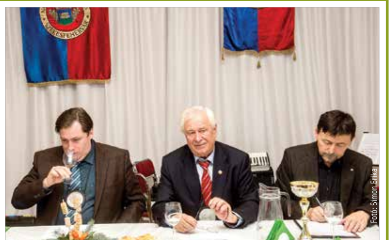
A zsűri ezúttal is megtalálta a legméltóbb nedűt Szent Márton napjára

8000 SZÉKESFEHÉRVÁR, BALATONI ÚT 10. ☎ +36 30 758 3136 WWW.JANCSARKERT.HU INFO@JANCSARKERT.HU FACEBOOK.COM/JANCSARKERT