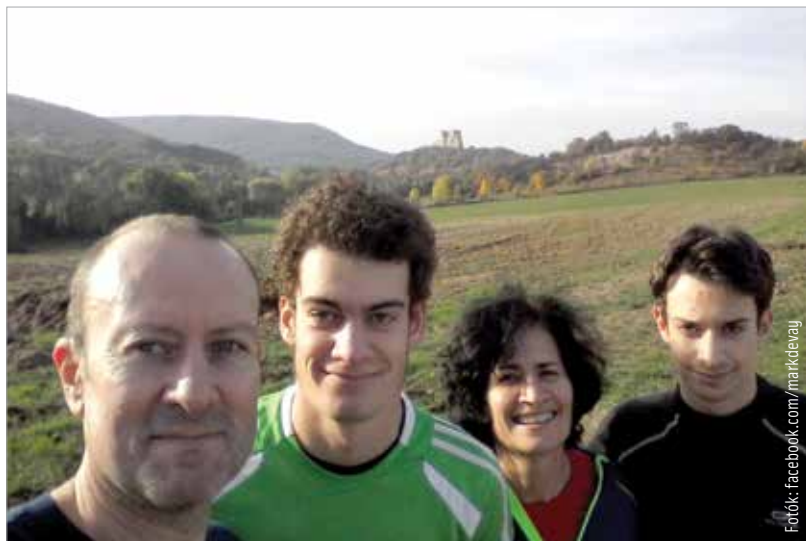
Igazi sportos, összetartó család a Dévay

Valahol a legjobb eredmények között! Miután tavaly kilencedik lettem a sorozatban, ez nagy előrelépés! Főleg úgy, hogy a pontszámok tekintetében legértékesebb versenyek is nagyon jól sikerültek, köztük a glasgow-i Európa-bajnokság vagy a sprint Eb. És persze a nagydöntőn, Madeirán is nagyon jól ment, volt egy jó ki szökés kerékpáron, így pedig előnnyel tudtunk kimenni futni. Végül negyedik lettem, az Európa-kupát pedig megnyertem! Azért mentem, hogy megnyerjem az összetettet, a mezőny pedig elég erős volt, mert ott volt többek között egy belga srác, aki már volt olimpián hatodik is. Így pedig különösen értékes ez a győzelem!