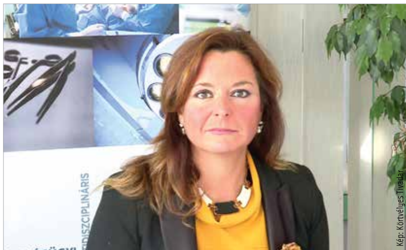
Vitályos Eszter európai uniós fejlesztéspolitikáért felelős államtitkár

Vitályos Eszter, az európai uniós fejlesztéspolitikáért felelős államtitkár szerint a fejlesztés nemcsak a betegek, hanem az orvosok helyzetét is könnyítheti. Csökken a pszichés nyomás, ami a betegre nehezedik azáltal, hogy nem otthoni körülmények között tud gyógyulni, hanem kórházban kell több időt töltenie. Nő a betegbiztonság, ami azt is jelenti, hogy kevesebb kórházban töltött idővel csökken annak a veszélye, hogy bármiféle kórházi fertőzést elkapjon a beteg – hangsúlyozta az államtitkár.