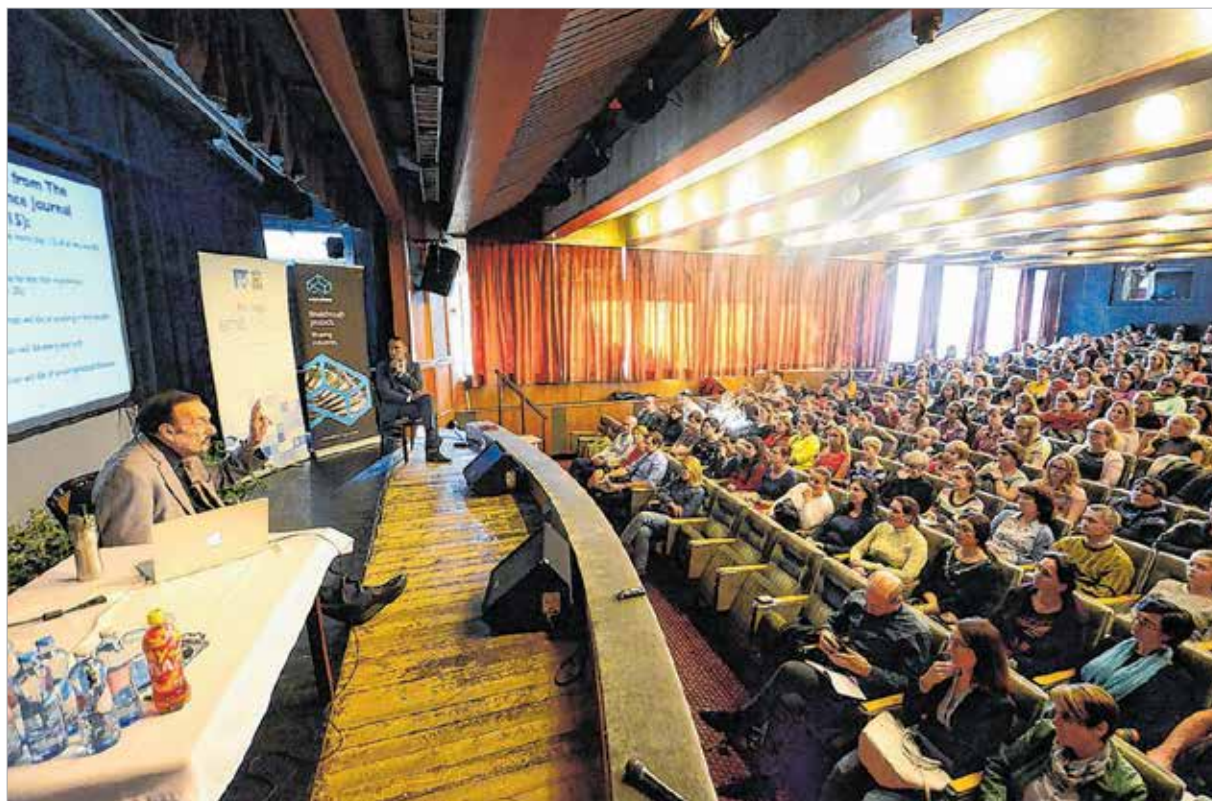
Az előadásban a huszonegyedik századi szegénylőségről is szó volt

Zimbardo beszélt a félnépséggel kapcsolatos kutatásairól és a 2016-ban megjelent Nincs kapcsolat – hová lettek a férfiak? című könyvéről is, ami a fiatal férfiak videojáték- és onlinepornó-függőségével foglalkozik.