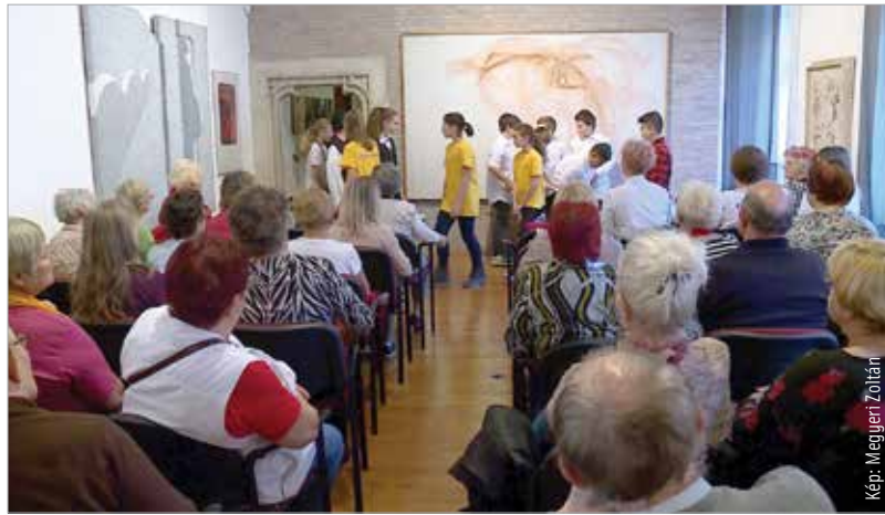
A hagyományokhoz hűen a Fehérvári Polgárok Egyesületének ünnepségén a Felsővárosi Általános Iskola diákjai adtak műsort

A Fehérvári Polgárok Egyesülete a hagyományokat tisztelve ebben az esztendőben is meghívta a székesfehérváriakat Szent Márton ünnepségére. A Szent István Múzeum Megyeház utcai épületében a város polgárainak apraja-nagyja megismerhette Szent Márton életét. „Tizenkét éve rendezzük meg a Márton-napokat, számunkra ez a hagyományörzés. Ilyenkor a családok, nagyszülők, szülők és gyermekek is szívesen látogatják rendezvényünket.