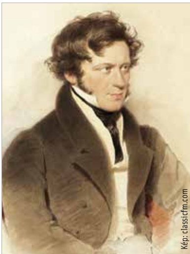
Franz Grillparzer (1791-1872) osztrák író

Boldog békeidők című sorozatunk befejező számában az adventi időszak kulturális eseményeiből válogattunk majd, de azért olvashatnak más izgalmas, a karácsony szellemiségéhez kevésbé illeszkedő történekekről is.