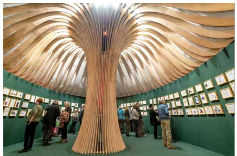
A kiállítási anyagot egy sok tekintetben újszerű, innovatív installáció foglalja keretbe