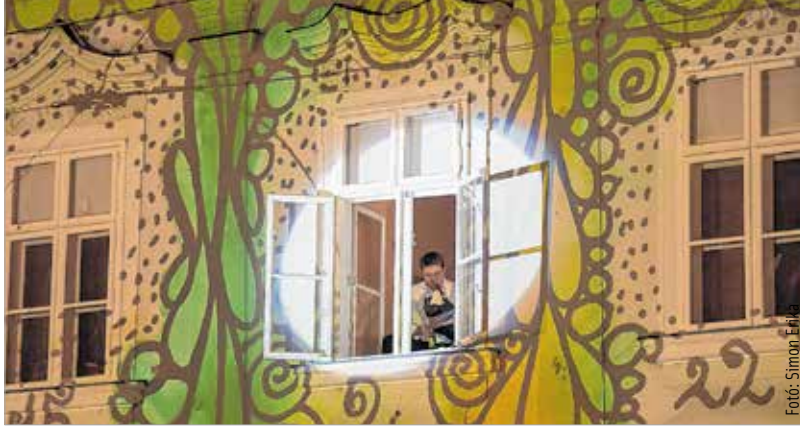
Az adventi kalendárium ablaka is kitérült a városházán