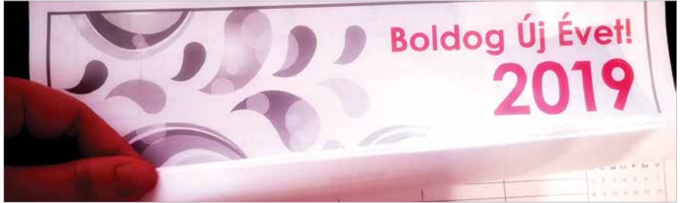
Tele a jövő évi naptár hosszú hétvégékkel

Ez azt jelenti, hogy 2019-ben háromszor lesz háromnapos (március 15-17., június 8-10. és november 1-3.), két alkalommal négynapos (április 19-22. és augusztus 17-20.) a hétvége, míg a karácsonyi időszakban egy rekord hosszúságú, hatnapos hétvége (december 24-29.) is vár ránk. Jó hír, hogy mindezekért cserébe csak három szombatra esik munkanap jövőre: augusztus 10., december 7. és december 14.