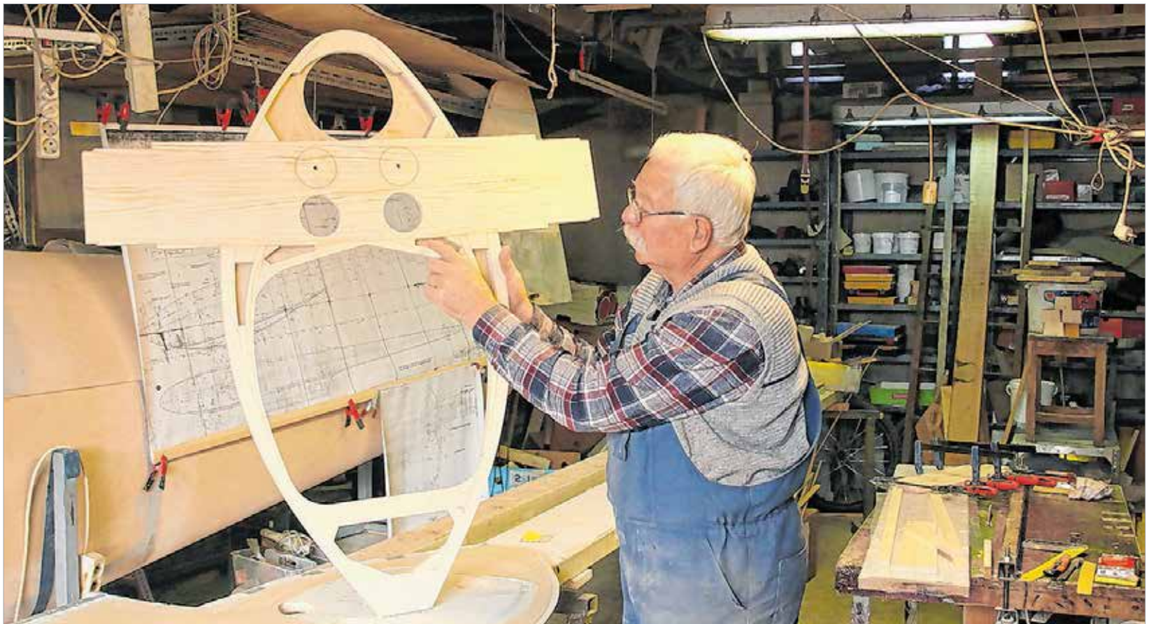
A fa minőségén rengeteg múlik

Azóta számtalan oldtimer repülőgép légszavaráján bukkannak fel szerte Európában a Révny névvel ellátott kis réztáblák. És már nincs messze a nap, amikor egy székesfehérvári gépen is láthatjuk!