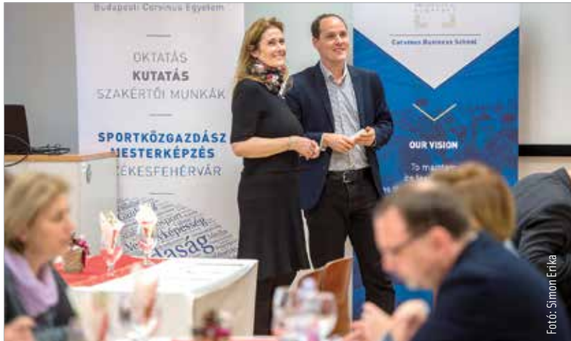
Folyamatosan növekszik a képzésben résztvevő partnercégek száma