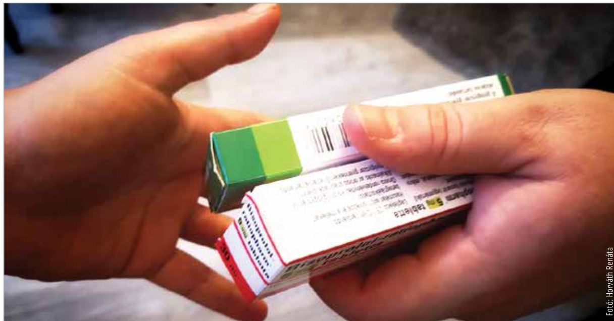
Több gyógyszerészre lenne szükség!

Ráadásul – akárcsak az orvosoknál, a gyógyszerészeknél is – kevés a fiatal. A jelenleg a szakmában dolgozók hatvanhat százalékában negyvenhat évesnél idősebb, és itt is hiányzik a középgeneráció, vagyis a harminchat és negyvenöt