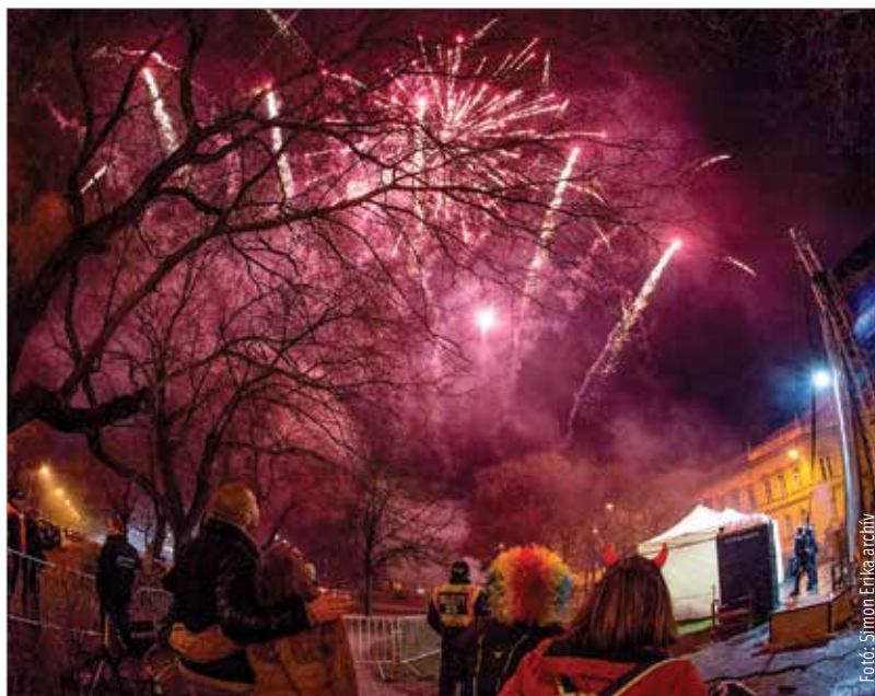
Utcabál vagy szállodai pihenés? Válassza mindenki a testhezállót!

Ez szintén olyan műfaj, amit nem tömegszíveseknek találtak ki. Mégis kényelmesebb program, mint az utcabál: fűtött helyen vagyunk, beadhatjuk a kabátunkat