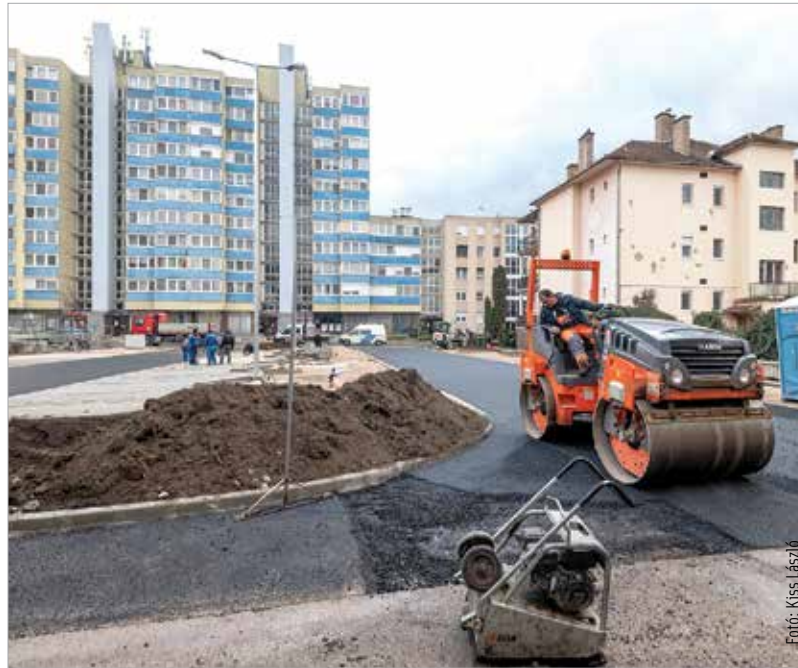
Újabb ötvenhárom parkolóhelyet építenek a színház mögött