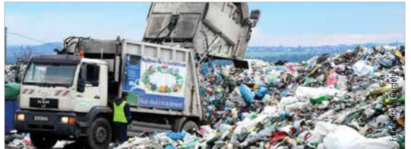
A harminckét új gépjárműből huszonkettő kukásautó lesz

évben egy tizenötmilliárd forintos projektnek köszönhetően. Ebből az összegből hét-hét és fél milliárd forintos beruházás valósul meg Székesfehérváron, ahol a jelenlegi hulladékvalóító helyett egy sokkal korszerűbb, már elsősorban gépi úton történő válogatást biztosító szelektív válogató épül. A mostani hétezer tonna helyett így várhatóan hússzezer tonna szelektív hulladékot tudnak feldolgozni. Ezenkívül lesz egy vegyeshulladék-válogató is, ami azt jelenti, hogy a teljes, beérkező hulladékot válogatják, és ennek jelentős részét energia előállítására használják majd fel. A harminckét darab új gépjárműből huszonkettő kukásautó lesz. A teljes szolgáltatási területen megvalósul a kétkukás rendszer, valamint négy új hulladékudvar épül majd. Ebből egy Székesfehérváron, az Újváralja soron, ami egy nagyon régóta várt beruházás.