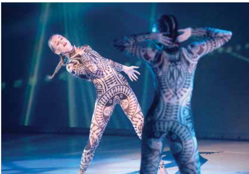
Az előadók látványos kosztümökkel is készültek

A döntőn Cser-Palkovics András polgármester is gratulált a fiataloknak: „A Versímep és a Fehérvár Hangja után jó pillanatban indult el a Fehérvár Táncosa tehetségkutató. Nemcsak azért, mert idén megalapította a város a balettszínházat vagy mert jövőre hetvenéves lesz az Alba Regia Táncgyűlés, hanem azért is, mert nagyon szép múltja és jövője is van a táncnak Székesfehérváron. Ez a fiataloknak köszönhető, akik a különböző fehérvári műhelyekben tanulnak.”