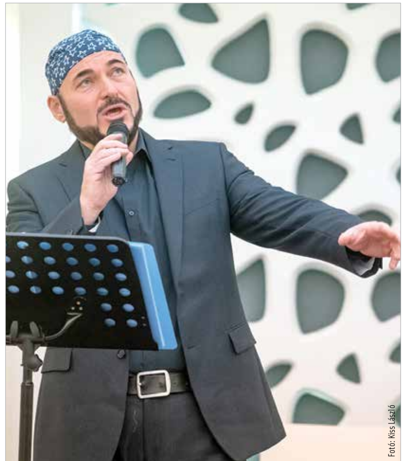
A Városháza Dísztermében ünnepélyes keretek között nyílt meg múlt csütörtökön az első Székesfehérvári Zsidó Napok rendezvénysorozata, hanuka ünnepének négynapos kulturális és kulináris fesztiválja. A találkozón vasárnap estig koncertek, előadások, gasztronómiai találkozók várták a látogatókat.