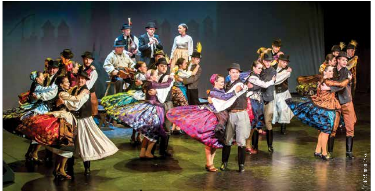
Jövőre a jubileum jegyében az egész évszaktól felölő programsorozattal szeretné méltó módon emlékeztetni és megünnepelni a hetven év sikertörténetét az Alba Regia Táncegyüttes