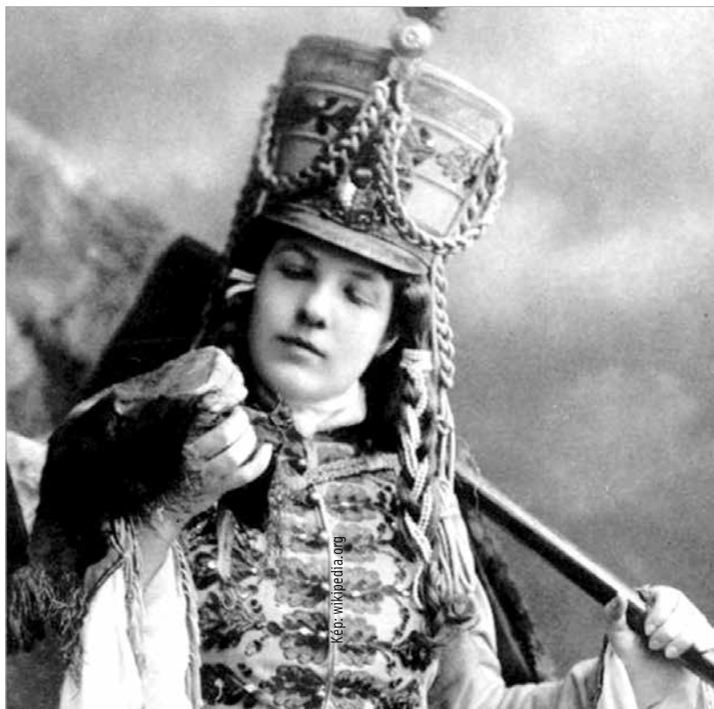
Fedák Sári (1879–1955) a János vitézben, 1904-ben