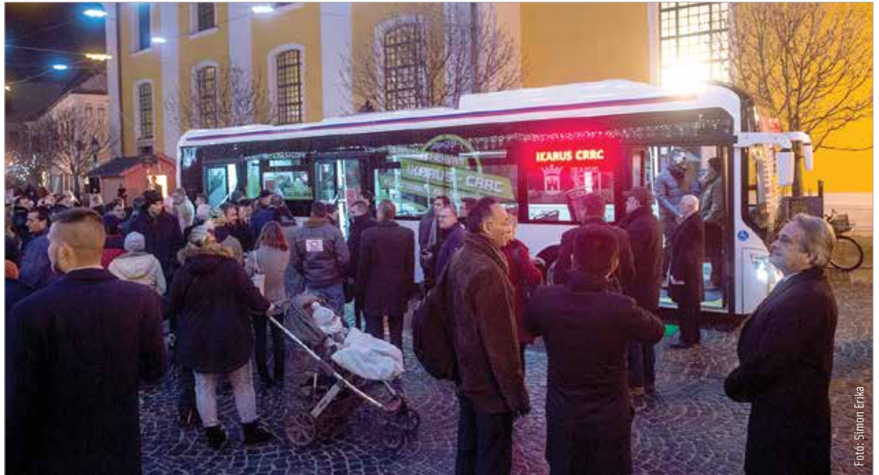
Az első elektromos busz tesztelési céllal már a jövő év elején közlekedni fog Székesfehérvár útjain, majd ezt követően csatlakozhat be az utasforgalomba az arra legalkalmasabbnak ítélt vonalakra

„Az Ikarus és a CRRC egy hosszú együttműködés után komoly eredményt ért el. A Kínában készülő világszínvonalú elektromos hajtású busz Európában is alapként szolgálhat.”