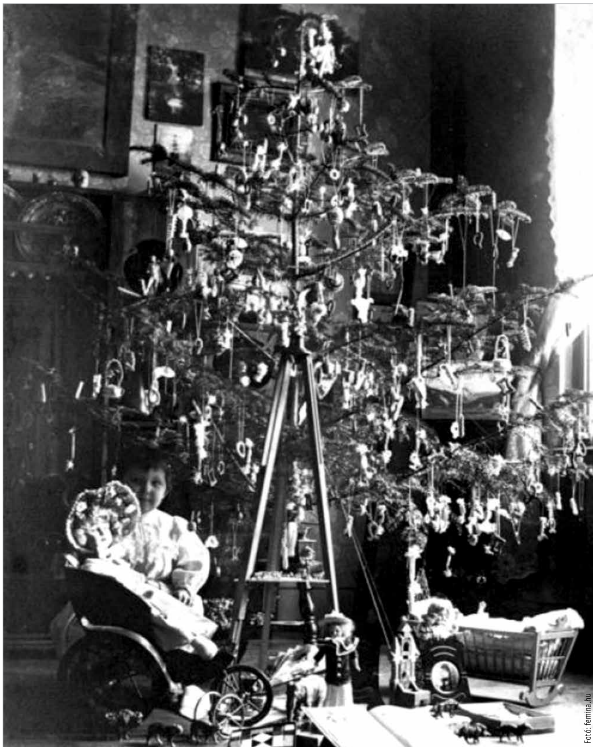
Karácsonyi pillanatkép az 1900-as évekből

baltát-fűrészelt ragadva kihajtottak a pentelei erdőbe, hogy olyan fát válasszanak, amelyiknek sudara éppen megpöccint az ebédlő mennyezetét és féloldalt bokrosodik, hogy silányabb oldalát jobban belé lehessen szorítani a sarokba. A mennyei karácsonyfáról szóló mesének többé már a gyermek nem adhatott hitelt. Egyszerre négy fát vágtak ez