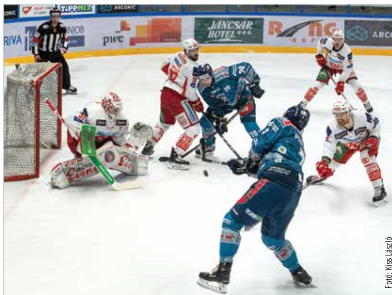
Kilencgólos meccset nyert a Volán