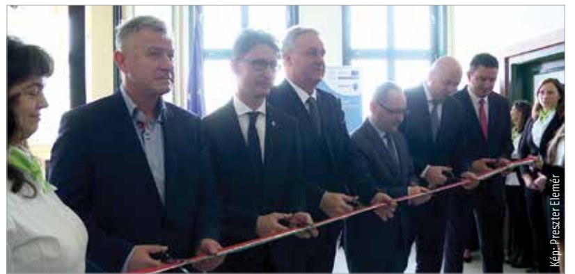
A legújabb fehérvári kormányablak a vasútállomás épületének első emeletén várja azokat, akik szeretnék gyorsan, könnyen elérhető helyen intézni hivatalos ügyeiket R. H.