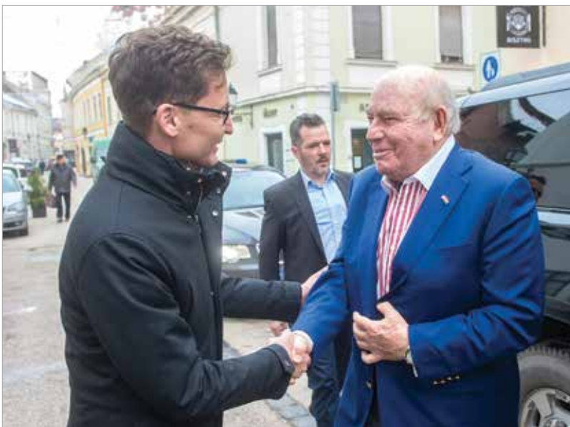
Az amerikai nagykövettel folytatott megbeszélésen gazdasági és katonai témák is szóba kerültek

közép-európai kínai befektetések mintegy fele Magyarországon található, ahol nagyon előnyös befektetési környezet van, és ez vonzó, nagy lehetőség a kínai vállalatoknak. Szólt arról is, hogy jövőre lesz a kínai-magyar diplomáciai kapcsolatok felvételének hetvenedik évfordulója.