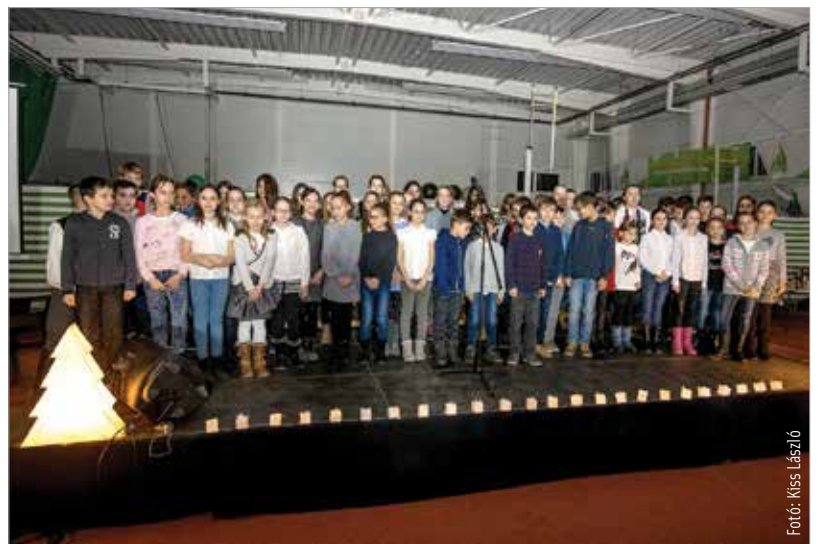
A legfiatalabb korosztály alig fért el a színpadon – biztosított a sikeres jövő is az ARAK-nál!