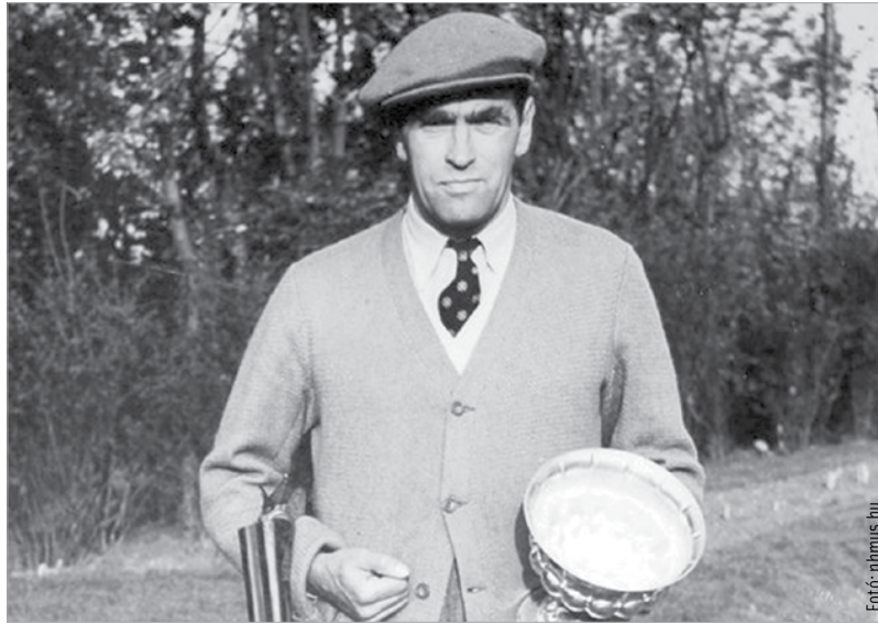
Széchényi Zsigmond, aki Csordapásztorok című írásában emlékezik vissza gyermekora karácsonyaira