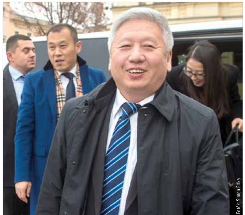
A kínai nagykövet szerint Magyarországon előnyös a befektetési környezet

Délután aztán Duan Jielong, a Kínai Népköztársaság magyarországi nagykövete érkezett a városba. A küldöttség megnézte a Városház téren az új elektromos meghajtású autóbust. Ezt megelőzően Székesfehérvár, az Ikarus és egy kínai cég között ünnepélyes aláírásra