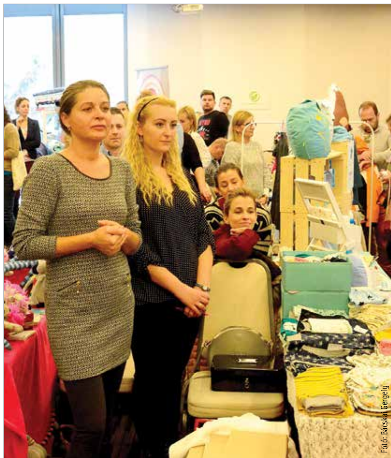
Először rendeztek Székesfehérváron baba-mama-gyermek dizájner vásárt: a Pici piac hazai termékekkel várta a vásárlókat december tizenötödikén, vasárnap a Csónakázó-tó melletti hotelben. A helyszínen a Fejér Megyei Gyermekvédelmi és Gyermeksegítő Alapítvány javára gyűjtöttek adományokat.