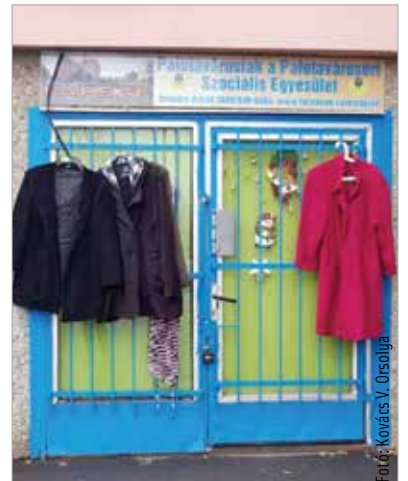
Elvihető kabátok a PAPSZE Egyesületnél