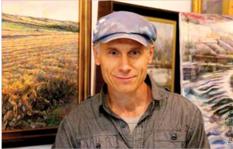
Kovács Árpád festőművész

Kislányként a beszéd iránti késztetése nagyon erős, szinte folyamatosan beszél, sőt inkább dalol. Versekre, rímekbe, saját maga által kreált kis szónoklatokba szövi a mondandóját. Nem mondom, hogy ez időnként nem zavaró, de igen jópofa poénokat alkot és gyakran megnevettet minket. Emellett elég kitartóan rajzol. El tud mélyülni ezekben a kreatív folyamatokban. Nem