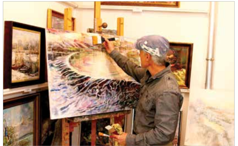
Néha a galériában, máskor útközben alkot

Sokszor eszembe jut, hogy az akkori tanárain, mentoraim sokkal kevesebb instrukciót adtak, és nem beszéltek ennyit a lelkeimre, mint én most némelyik diákomnak. Lehet, hogy azért, mert nem volt divat a közvetlen tanár-diák stílus, vagy csak nekem nem volt rá