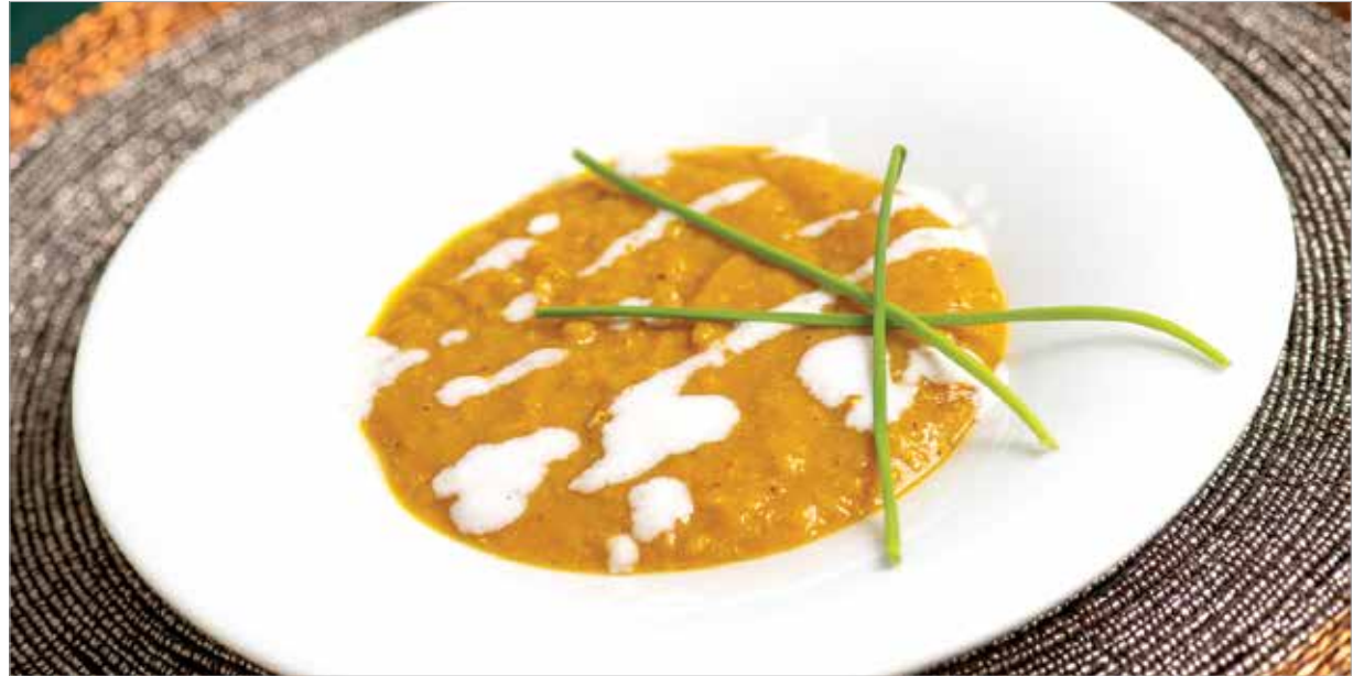
A vöröslencsét nem kell áztatni, könnyebben emészthető, és különleges újévi fogás készíthető belőle

A dahl (vagy dal, daal, esetleg dhal) egy sűrű indiai leves, mely rántás nélkül valamilyen hüvelyesből (például sárgaborsó, vörös lencse, csicseriborsó, kis szemű bab stb.) készül. Ezen kívül lehet bele rakni paradicsomot, zellert, sütőtököt, cukkinit, padlizsánt, de édesburgonyát és hagyományos krumplit is. Viszont hús sosincs benne. Indiában rizszel vagy naan-kenyérrel fogyasztják.