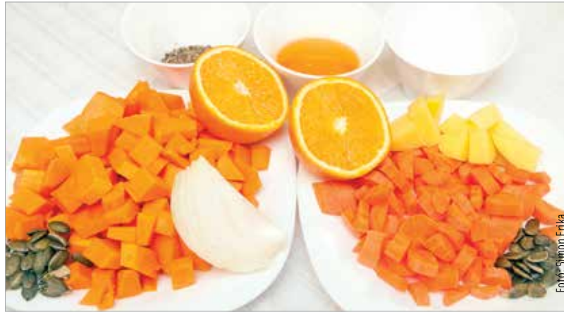
Azokat az étkezéseket, amik nem a nagy eszem-izom jegyében telnek, oldjuk meg minél egészségesebb ételekkel!

Az ünnepek alatt jóval több zsíros, szénhidrátban dús ételt, süteményt, édességet fogyasztunk, bevallhatjuk bátran, hogy ilyenkor igazán nehéz ellenállni a csábító illatoknak és ízeknek. Fontos, hogy ilyenkor se rúgjuk fel teljesen a helyes táplálkozási szabályait! Például a többszöri