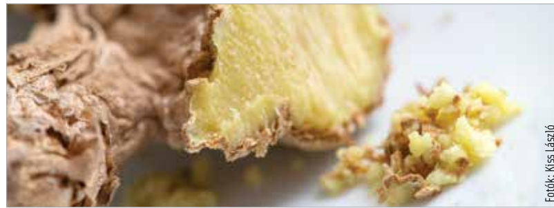
A gyömbérből karakteres lesz a dahl

(Ezeket a fűszereket ma már nem reménytelen fellelni a nagyobb fehérvári élelmiszer-áruházak „nemetközi” polcain, de ha biztosra akarunk menni, a Vámház körüli Ázsia boltig vagy más budapesti orientális élelmiszerüzletig kell utaznunk.) A befűszerezett alapanyagokat fedő alatt negyedórán keresztül