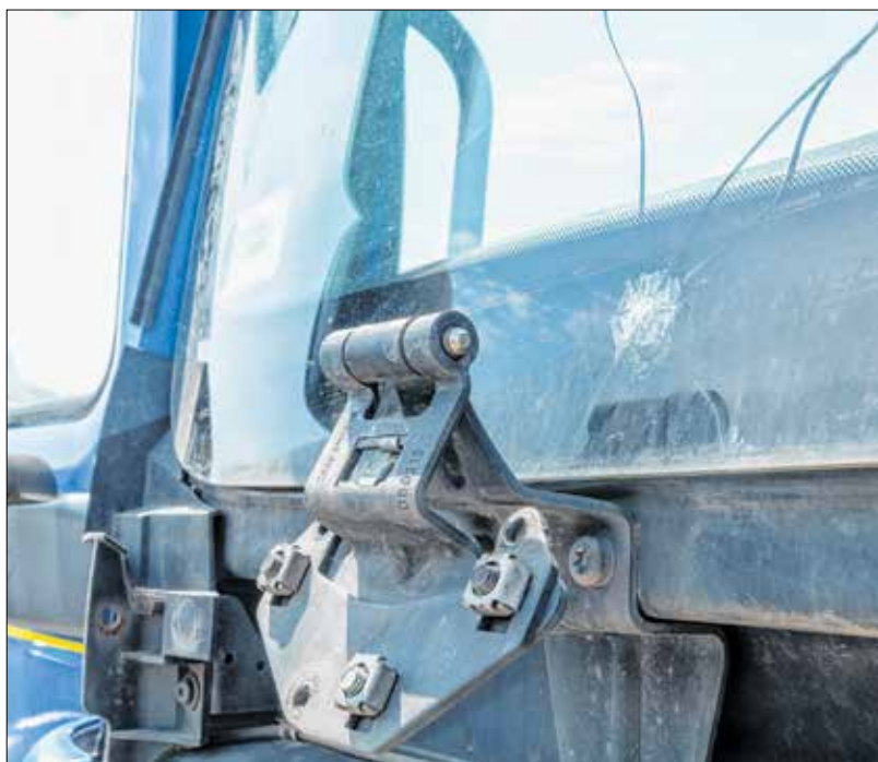
Az elrepedt szélvédőt rövid időn belül cserélni kell!

A beszerelt szélvédő minőségén nem érdemes spórolni – ezt fogja tanácsolni minden magára valamit adó szakember. A gyanús „sufnituningokat” és a gyenge minőségű utángyártott üvegeket kerüljük, ha nem akarunk néhány hónap múlva újra szélvédőt cseréltetni. Megbízható, komoly szakemberekkel dolgozó műhelyekben érdemes érdeklődni a javítási lehetőségekről. Ilyen helyen biztosan olyan márkájú üveget szerelnek be, amelynek minősége és egyéb adottságai megegyeznek a gyárral.