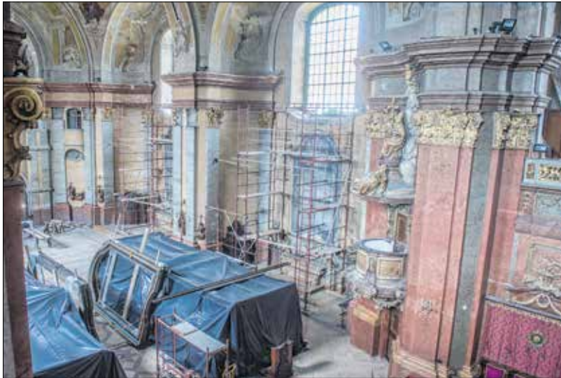
A belső tereket már előkészítették, a munkák megindítására.

Az egyházmegye és a város közös elhatározása, hogy a bazilika felújítása elkerülhetetlen és elengedhetetlen. Melyek voltak az első lépések a felújításhoz vezető úton?