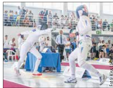
Először szerepelt a versenyhelyszínek között a Széna téri új sportcsarnok, itt rendezték hét napon át a vívást. Az uszoda és a Bregyó-közi sportcentrum pedig már ismerős lehetett a külföldieknek is.