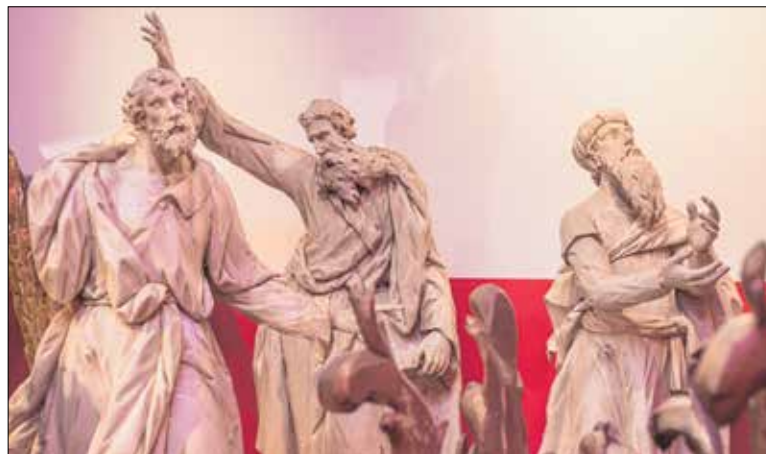
Rövidesen megkezdődhet a szakrális műtárgyak restaurálása.

a kiállításnak, bemutatjuk, hogyan történik a restaurálás. Az együttes eddig halmozott művészetként jelent meg a bazilikában, most műtárgyként kívánjuk kiállítani őket. A legfontosabb számunkra a mondanivalója. Nem véletlenül ez lesz a címe: Barokk mennyország. A transzcendentális világkép most leköltözik a földre, és ennek a részleteit, összefüggés rendszerét, liturgikus, vallási hátterét, és az ezt kiegészítő Szent István kultuszt szeretnénk bemutatni. Történeteket, attribútumokat ismerhet meg a látogató. Ilyen módon izgalmas, összetett, komoly kihívást jelentő,