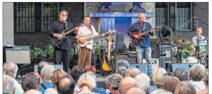
A nagyszínpad ezúttal is a Bartók Béla téren kap helyet

Tudjon meg többet a témáról! Keresse Paletta kulturális magazinnak július 24-i adását Youtube-csatornánkon! Részletes programért pedig lapozzon a 11. oldalra!