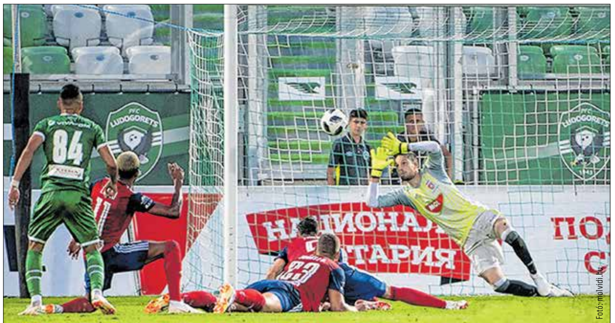
Razgradban kapott gól nélkül hozta le a Vidi a meccset

Nagyt változott a magyar bajnok játéka a múlt héten kikínálódott Dudelange elleni továbbjutás óta. A fehérváriak villámrajtot vettek a hétvégén a bajnokságban. Gyakorlatilag átgyalogoltak a nyolcvan percen keresztül ember-