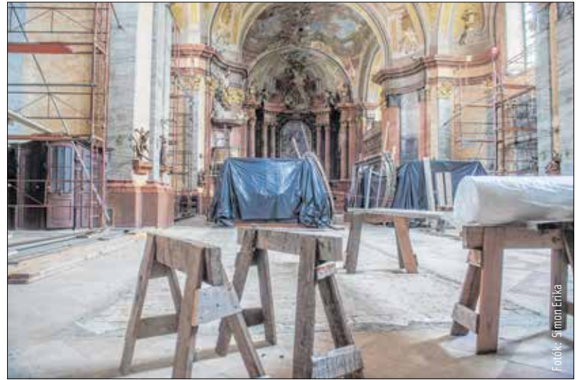
A padozat alatt, a középkori kapcsolat megerősítését várják a régészek

Az épület a XVIII. és részben a XIX. században nyerte el jelenlegi formáját. A székesfehérvári polgárok, sok-sok pénz-, idő-, energiáfordítással plébánia templomukat gyönyörű templommá varázsolták. Ezt 1768-ban egy dedikációs feliratban örökítették meg az utókornak. Ez pontosan kétszázötven éve történt. A templom megépítése a város történeté-