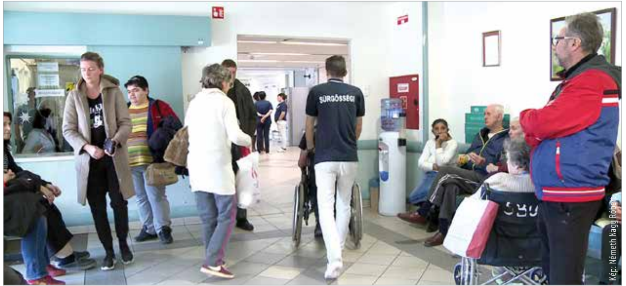
A kórház három sürgősségi betegellátó pontján összesen naponta több száz beteget látnak el. A Triage rendszer és a diszpécser segítségével a páciensek gyorsabban juthatnak orvosi segítséghez.

A kórház sürgősségi osztályain naponta több száz jelentkezőnek ellátásra. A páciensek minél gyorsabb ellátása érdekében vezetett be január elsejétől a kormány az úgynevezett Triage rendszert. Csernavölgyi István, a Szent György Kórház főigazgatója elmondta: „A betegeket, amikor megérkeznek egy egészségügyi ellátóintézménybe, a panaszaik és az állapotuk súlyossága alapján egy állapotfelmérést követően osztályozzák. Ennek az az értelme, hogy azon betegek ellátása, akik azonnali beavatkozást igényelnek, nagyon súlyos esetnek minősülnek, még csak véletlenül se késlekedjék. Azok a páciensek pedig, akik könnyebb panaszokkal kevésbé súlyos besorolást kapnak, egy megfelelően időzített útemrendszer szerint kerüljenek ellátásra.” A pácienseket kiírás is tájékoztatja arról, hogy nem érkezési sorrendben, hanem az állapot súlyosságát