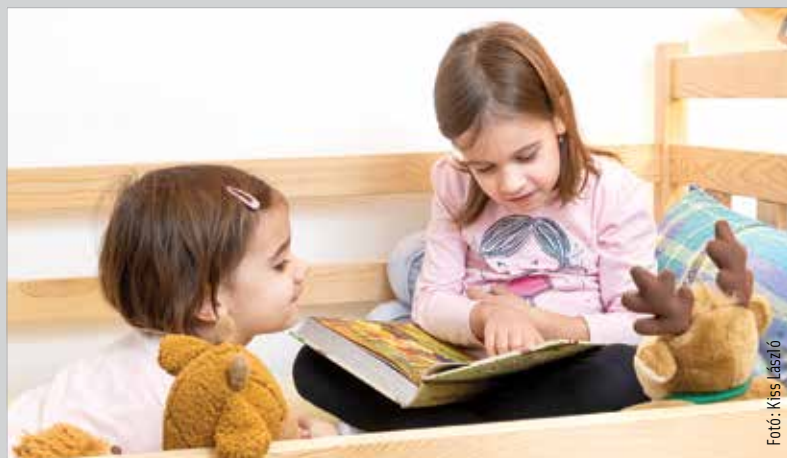
A mese ma is a világ megértését segíti

Történetésséggel születünk, s a kapott történetek vezetnek bennünket át az életünkön. Nem csupán gyermekként, hanem felnőttként és idős korunkban is. Éppen ezt használják ki a televíziós csatornákon vagy az interneten látható sorozatok. Régen a meséken keresztül – melyek nem elsősorban a szórakoztatást szolgálták – ismerték meg az emberek az őket körülvevő és önmagukban megta-