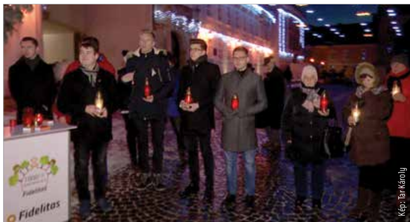
A keresztényüldözés áldozataira emlékeztek