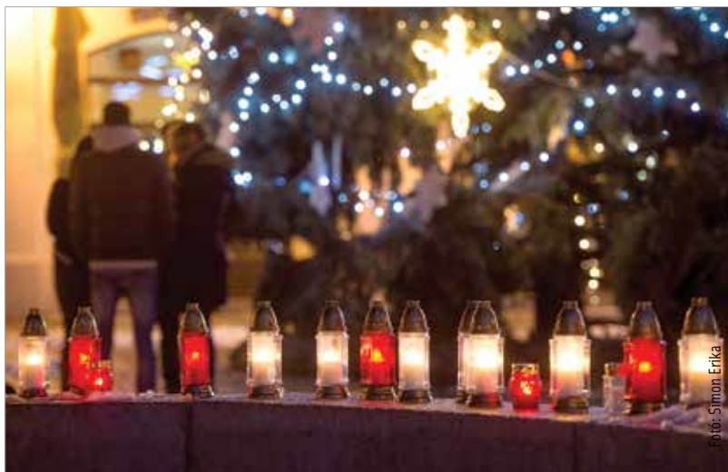
A világban havonta több száz erőszakos cselekményt követnek el hívók, döntően keresztények ellen

A világban havonta több mint háromszáz keresztényt gyilkolnak meg hitéért, több mint kétszáz templomot és keresztény műemléket pusztítanak el valamint közel nyolcszáz erőszakos cselekményt követnek el hívó emberek ellen.