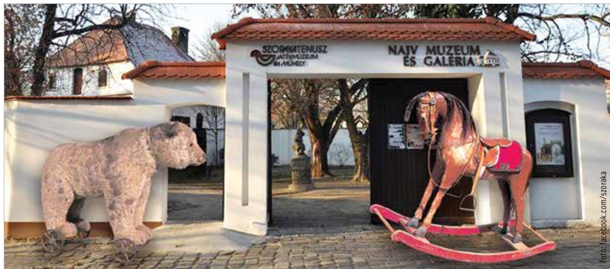
A Szókraténusz Játékmúzeum Kecskeméten várja a látogatókat

Sokan leginkább a tavaszi, nyári hónapokban szeretik felkeresni az állatkerteket, amikor jó idő van. Pedig érdemes valamelyik állatkertbe szervezni egy kiadós sétát télen is. Az ország több állatkertje, köztük a pécsi és a veszprémi is az év minden napján, még ünnepeken is várja a látogatókat. A Pákozdsukorói Arborétum és Szabadidőparkban a vadállatok téli etetését is megtekinthetjük. A Fővárosi Állat- és Növénykertben pedig igazán szívhez szóló családi programot kínálnak a közeljövőben: hagyományosan február első hétvégéjén