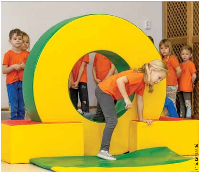
A mozgásfejlesztés elengedhetetlen a megfelelő tanulási készségek kialakulásához

Természetesen ez nem a legoptimálisabb döntés, de kifejezetten káros ritkán lesz. Fordított helyzetben sokkal nagyobb nehézségek lehetnek, ha éretlenül kerül egy gyermek iskolába. Fontos lehet az ok, ami miatt a szülők így döntenek, például van-e valami a család életében, ami éppen nehezíti az életüket vagy csak általános félelmek tartják őket vissza. Az óvodában „unatkozó” gyermek jó esetben könnyen felalálja magát, és tágabb környezetéből is szívja magába az információkat, azaz nem fog „visszafejlődni”. Szociálisan pedig sokat nyerhet a „legidősebb gyerek” státuszából. Iskolában is hallhatunk unatkozó gyerekekről, ők amúgy inkább a tehetségesek, de ezt pedagógiai feladat (lenne) kezelni, differenciálni, szintűgy, mint a lassabban fejlődő gyerekeknél. Mindemellett arra biztatunk mindenkit, hogy engedje a gyermekét iskolába, amennyiben iskolaérett!