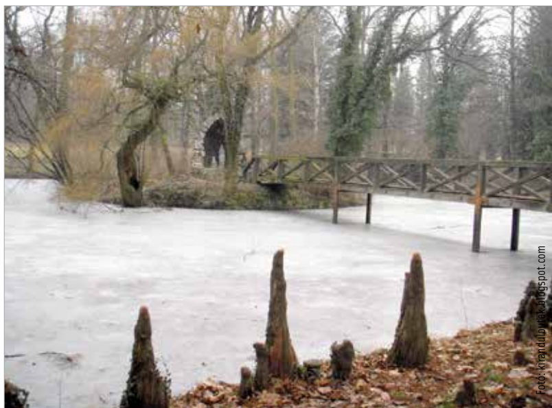
Az Alcsúti Arborétum télen is gyönyörű

fákkal. Egy hétfégi kiruccanás érdekes ellátogatni akár oda is. Ha közelebbi célpontot szemelünk ki, mehetünk a télen is gyönyörű Alcsúti Arborétumba, ahol az ország egyik legrégebbi, angolpark jellegű kertje várja negyven hektáron a frissítő sétára vágyó látogatókat.