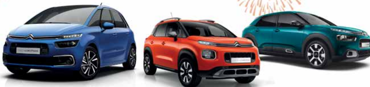
CITROËN C4 SPACETOURER