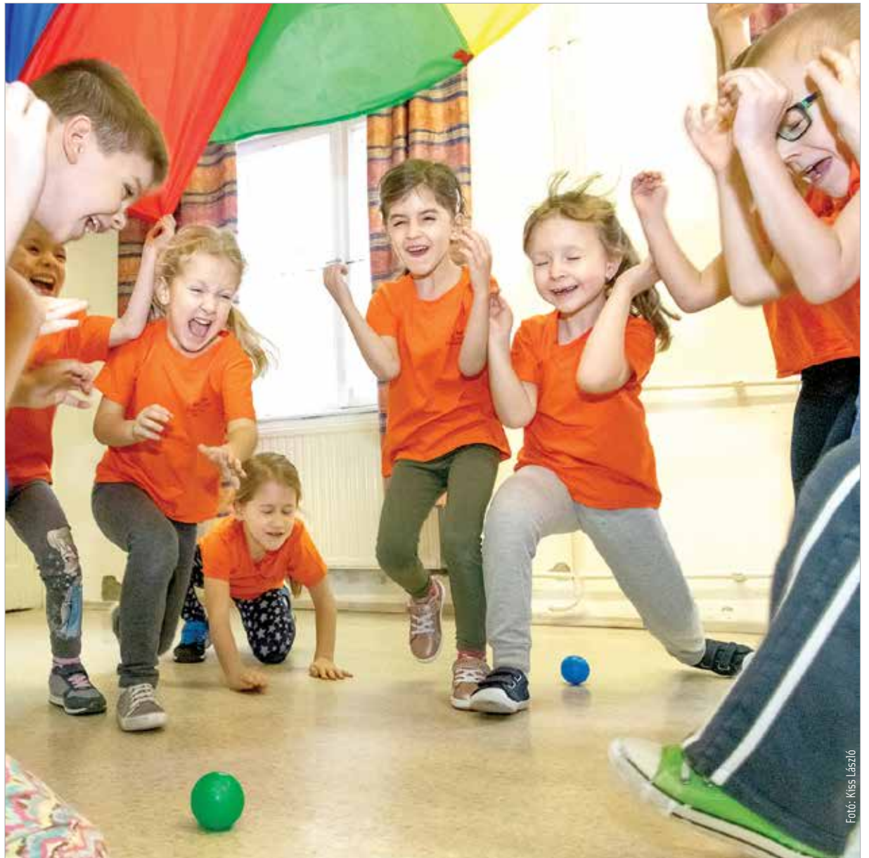
Az óvodában ugyan még játékosan, de már komoly feladatokra készítik fel a gyermekeket

megújulás nagyon fontos. Ebben segíti a digitális megújulás pályázata a székesfehérvári iskolákat.” A tankerületi igazgató a beiratkozás időszakának közeledtével arról is beszélt, hogy mindenképpen szükséges a gyermek nevére kiállított személyi igazolvány, a laccímkartya valamint az iskolaérettséget tanúsító igazolás az intézménybe kerüléshez. Megemlítette a Klebelsberg Képzési Ösztöndíj Programot is, mely az öt éven belül induló nyugdíjazási hullám után jelentkező tanárhiányt orvosolhatja: „Ez egy olyan ösztöndíjrendszer, ami az osztatlan pedagógusképzésben résztvevő leendő tanároknak ad havi rendszeres pénzösszeget. Tanulmányi eredménytől függően huszonöt-, ötven-, illetve hetvenötezer forintot kaphat havonta egy hallgató akár öt éven keresztül azért, mert vállalja, hogy a diploma megszerzése után pedagógus lesz, és az általunk felajánlott álláslehetőségek közül egyet kötelezően elvállal. Optimista vagyok, mert egyre több ösztöndíjas van az országban.”