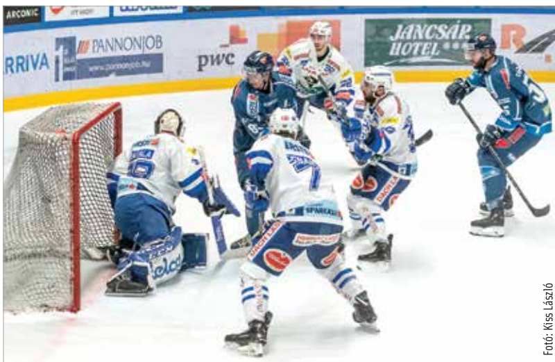
Kevesebbet lőtt kapura, de hatékonyabb volt a Volán a Villachnál