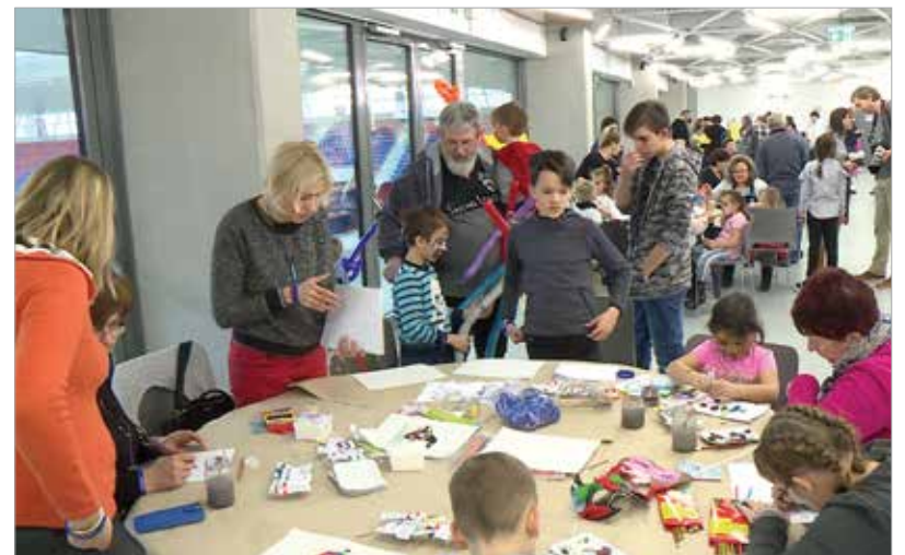
Kézműves foglalkozásokkal, arcfestéssel várták a nevelőszülőket és a gyermekeket

tevékenység is. Fejér megyében jelenleg kétszáz, Székesfehérváron pedig nyolc olyan család van, ahol különböző okok miatt rászoruló gyermekek élnek – hangzott el a program tájékoztatóján.