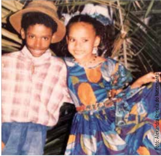
Fotó: Alexandra Priscila do Nascimento