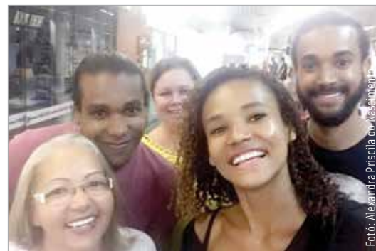
A reptéren mindig a családja várja