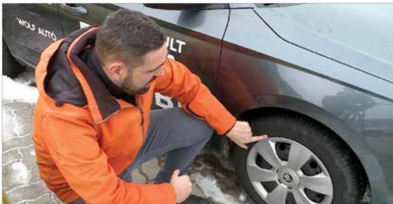
A téli gumi váltómérete is fontos

A biztonságos közlekedés sosem lehet elhanyagolható szempont. Ezzel nemcsak a saját, hanem utastársaink, a többi autós és a gyalogosok testi épségére vigyázhatunk!