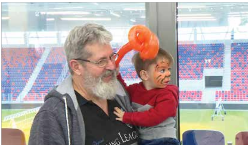
Vannak, akik több gyermeket is gondoznak, nevelnek. Mégis ma Magyarországon mintegy nyolcezer gyermek vár szerető családra.

Az országban jelenleg ötezer-kétszáz nevelőszülő gondoz tizenötezer gyermeket, de további mintegy nyolcezer gyermek vár szerető családra. A kormány célja, hogy a nevelőszülők száma növekedjen.