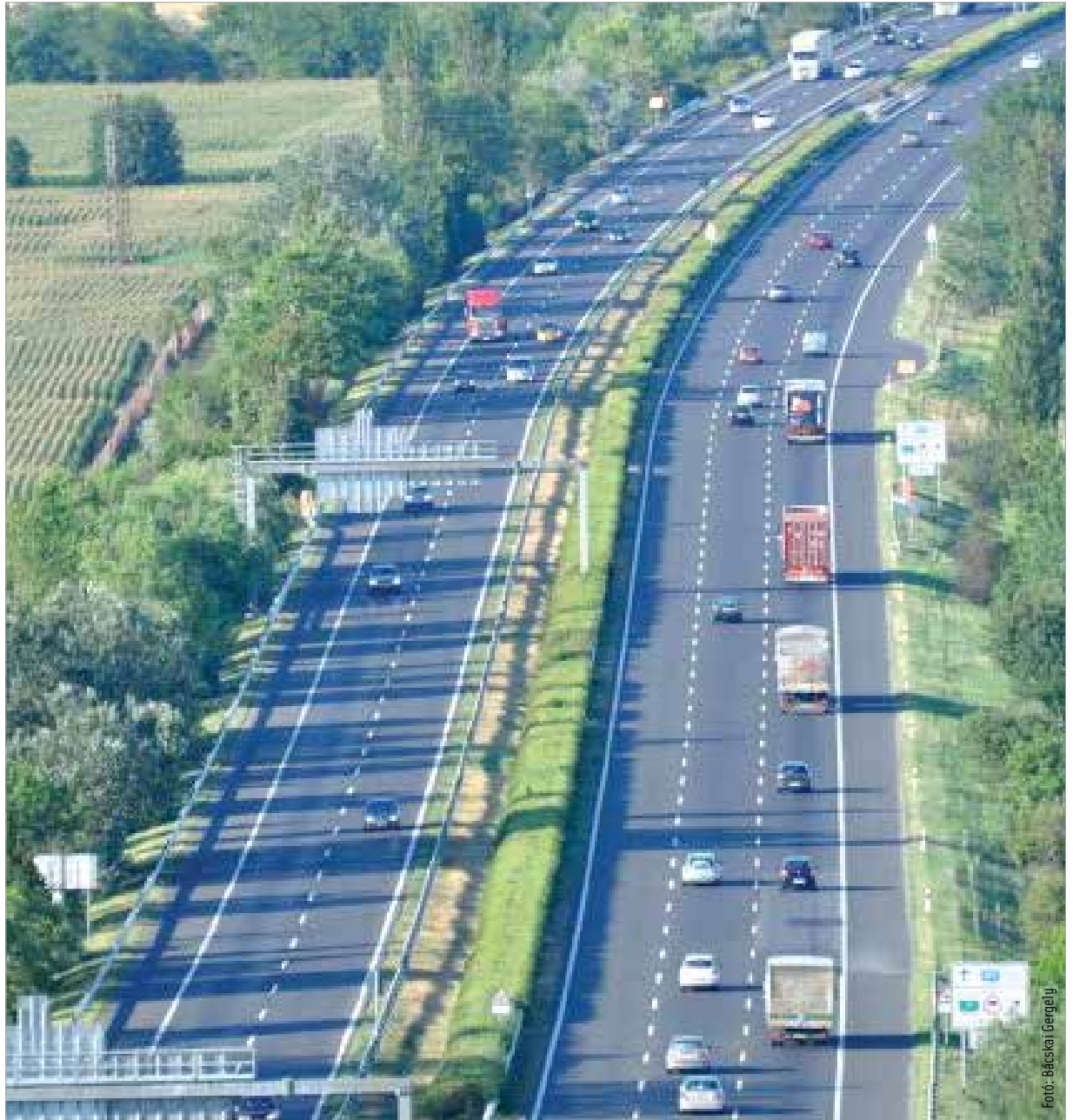
Gondoljuk át, mely útszakaszokat szeretnénk az év során használni!

Az online vásárlás lehetőséget ad arra, hogy mérlegeljük, melyik matricatípussal járunk a legjobban. Ha még az utazás előtt számításokat végzünk, megtervezünk és átgondoljuk