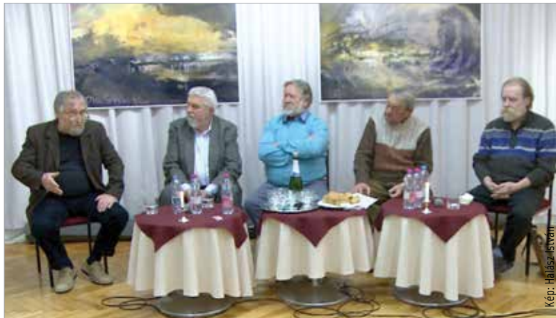
A felhívás nem szólam: figyeljünk a közművelődés legendáinak tanácsaira!

„Ez egy régi ötlet. Amikor művelődési-ház-igazgató voltam, rendszeresen találkoztunk, egyeztetünk, megbeszéljük ügyes-bajos dolgainkat. Az jó is tett akkor a város kulturális életének! Hiányoztak az akkori kollégáim, függetlenül attól, hogy gyakran találkozunk a városban, és felidézünk néhány emlékezetes dolgot, de igazából azt, hogy mit csinálnak nyugdíjba vonulásuk után, csak kivonatossan tudtam. Legendás igazgatókról van szó, akik nehéz időszakban