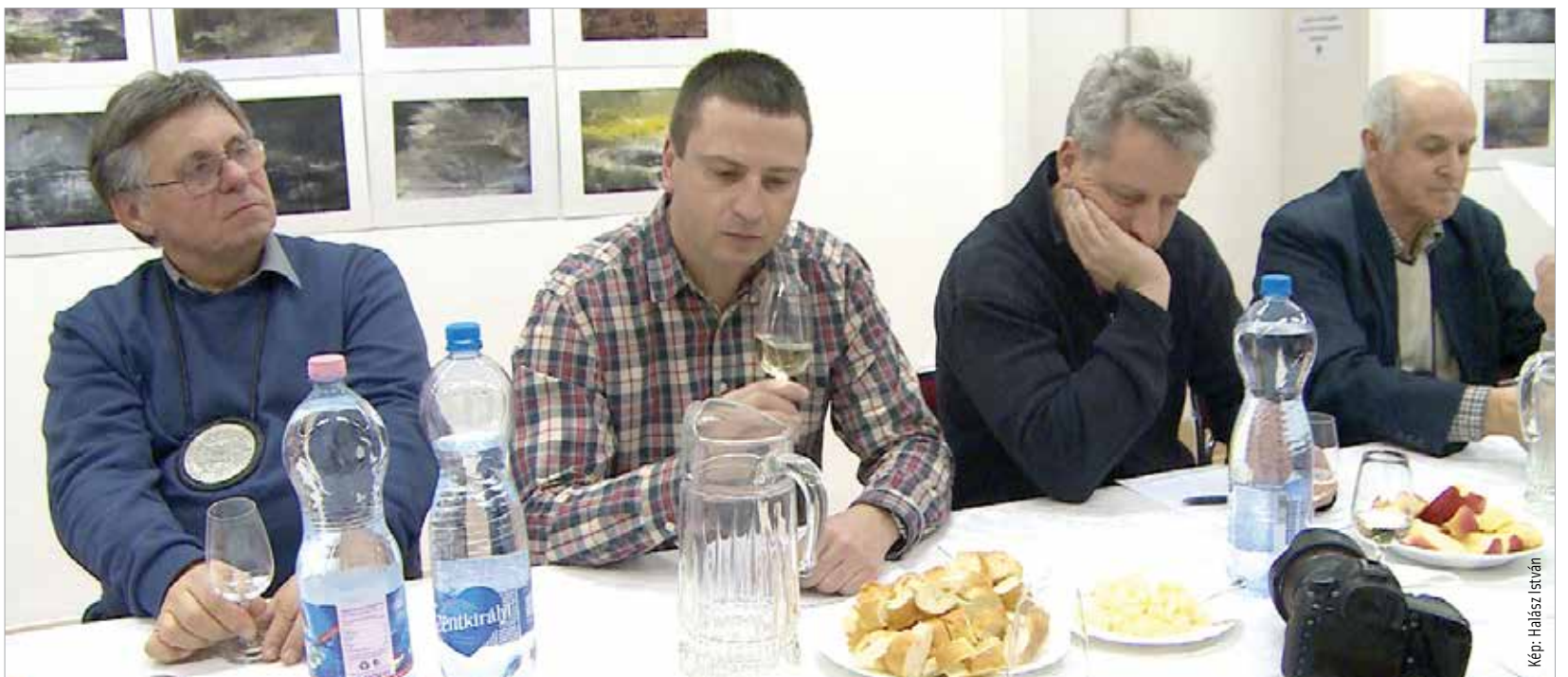
Idén is nagy érdeklődés kísérte a Vince-napi mustrát

gazdák számára az év elején ez ad alapot a termésbecsléshez. Kiválasztottuk a zászlósbor és kísérőborait is. Az eredményt február 16-án, a Szent István Hitoktatási és Művelődési Házban megrendezendő hagyományos borbálon jelentjük be.”