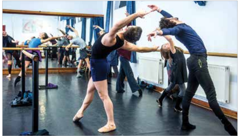
Egyáltalán nem egyszerűek az alapmozdulatok sem

„Új színházi műfaj a táncszínház illetve az a műfaj, amit a Székesfehérvári Balettszínház képvisel. Új műfaj