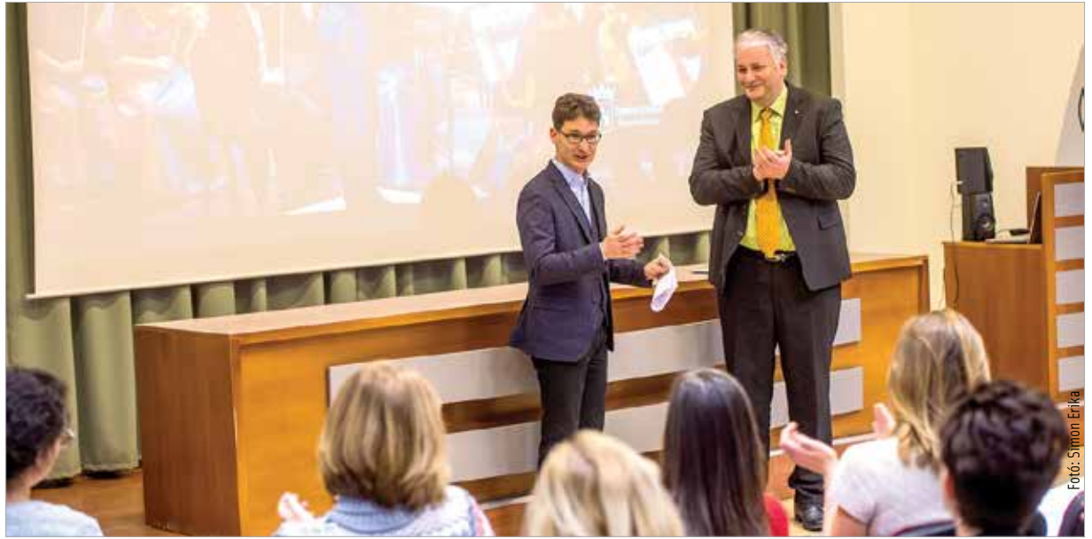
Az önkormányzat elkötelezettsége töretlen a zenekar terveinek megvalósításában

Az eseményen Cser-Palkovics András polgármester megköszönte a zenekarnak azt a színvonalas programsorozatot, amely segítette megismertetni és megszerettetni a székesfehérváriakkal a klasszikus muzsikát, majd tájékoztatta a zenekar tagjait és munkatársait a