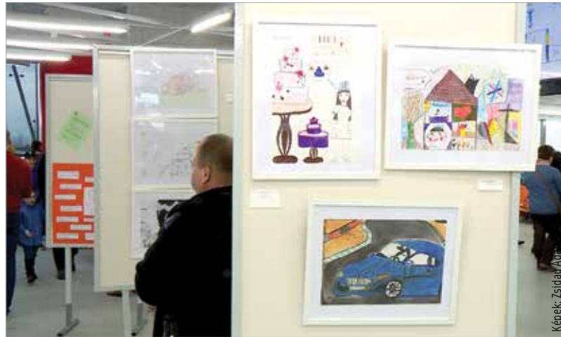
A rendezvényen kiállítás várta a látogatókat: a gyerekek a Lehetetlen nincs! című rajzpályázatra küldhettek be műveket

„Fontos számunkra, hogy kiszélesítsük a nevelőszülői programot, hiszen minden gyermeknek az a legjobb, ha családban nő fel. A programnak köszönhetően akik eddig nem jelentkeztek nevelőszülőnek, ám érdekelné őket ez a hivatás, mindenféle tájékoztatást és támogatást megkapnak.” – mondta Fülöp Attila. Az államtitkár azt is hangsúlyozta, hogy a nevelőszülői GYED bevezetése is ezt a célt szolgálja. Ennek érdekében indul el a nevelőszülői program weboldala is,