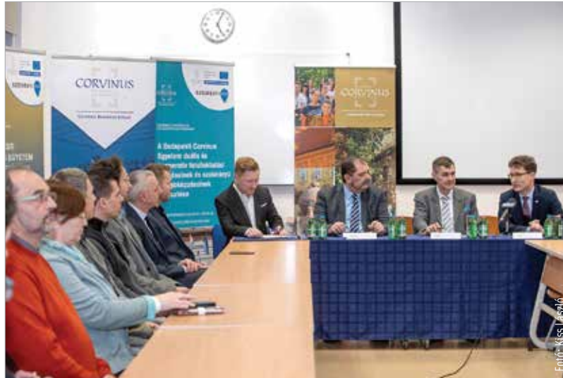
A rendezvényen a város és az egyetem vezetői a terveikről beszéltek

A 2018-as esztendő mérföldkő volt a Budapesti Corvinus Egyetem