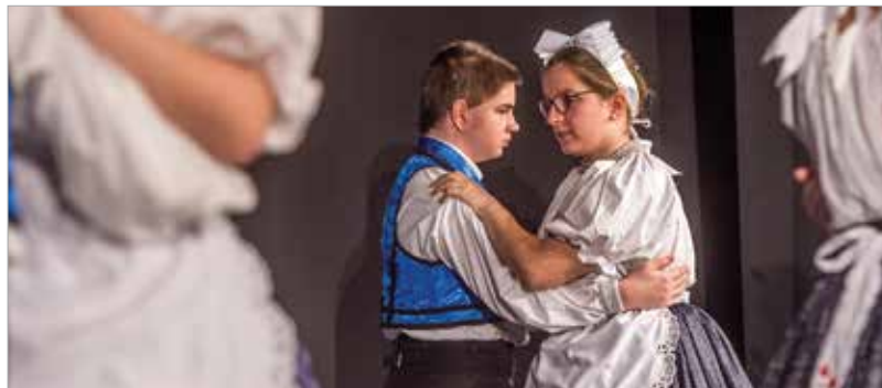
A város és a megye általános illetve középiskolásai által alkotott Free Spirit, Black Squad és Bokréta néptáncgyűttes is bemutatkozott