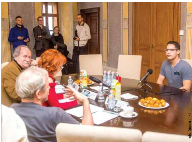
Tizenötven jutottak tovább a márciusi döntőbe

folytatott improvizatív társalgásból kiderüljön: kik vetélkedhetnek márciusban a győzelemért. A zsűri tagjai a jó kommunikációs adottságok mellett figyelték a mondanivaló mélységét, a személyiséget és az értékteremtő készségeket is. A verseny kapcsán Bakonyi István irodalomtörténész elmondta: egy ilyen bajnokság alkalmas lehet arra, hogy a fiatalok kilépjenek a virtuális valóságból. A versenyen szóval kell győzni és nem más eszközzel. Mint mondja: a jelöltek egytől egyig alkalmasak arra, hogy ezt megvalósítsák. A finálét március 8-án rendezik.