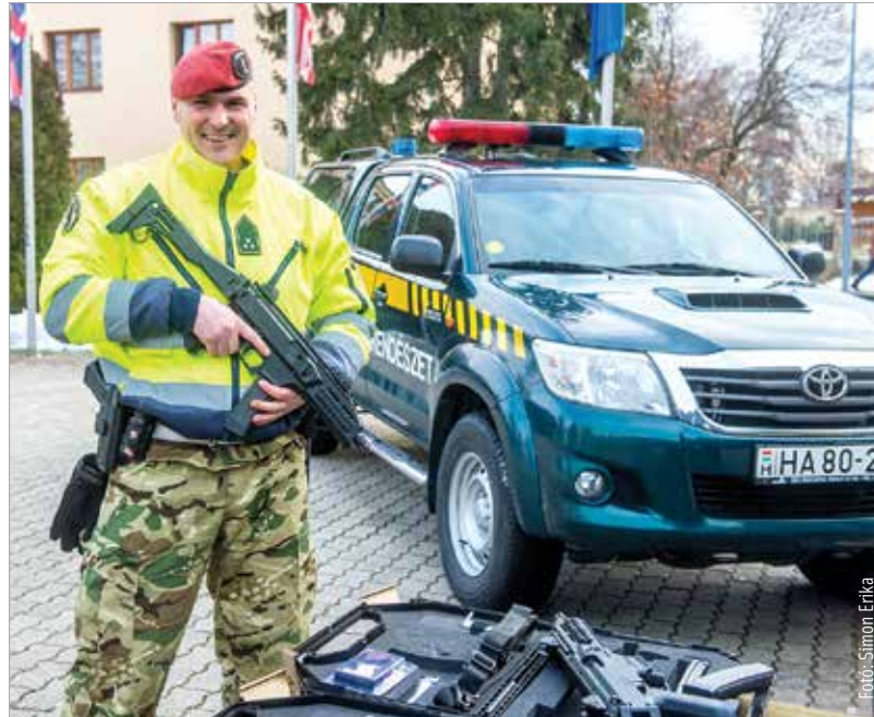
Az új géppisztolyt hamarosan Magyarországon kezdik gyártani

A fejlesztési program mellett a honvédség szervezeti átalakulásáról is szó esett. Január elsejével a honvéd vezérkar kivált a Honvédelmi Minisztérium egységéből, és összeolvadt a műveleti felada-