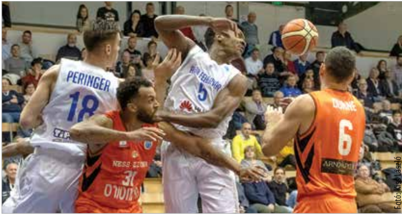
Nem jár kézről kézre, és nem is engedelmeskedik mindig a labda a fehérváriaknak

Európa-kupában, a FIBA pedig úgy oldotta meg a helyzetet, hogy helyettük továbbjuttatja azokat is, akik amúgy nem jutnának... Így aztán nem a kiesés miatt bosszankodtunk a Nesz Ciona ellen, a 96-80-as újabb sima vereségnek inkább a játék képe miatt volt rossz üzenete. A második féléldőben nem védekezett az Alba, fegyelmezetlenek voltak a játékosok, ez pedig megengedhetetlen, amikor amúgy is nehéz helyzetben van a csapat. A bajnokságban pénteken Szegeden játszanak Freemanék, utána három hét szünet következik. Talán az utolsó lehetőség, hogy összeszedje magát az Alba és hagyományaihoz méltó játékkal küzdjön utána céljaiért.