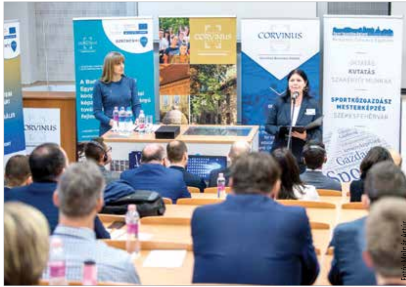
A konferencia témája a sport és a település XXI. századi kapcsolata volt

„A mai fiataloknak nyelvtudásukkal, ismereteikkel kinyílt a világ. Ők nem ez alapján fogják eldönteni, hogy hol fognak élni. Ők az alapján döntenek majd, hogy milyen életminőséget kapnak az adott helyen. Sok más mellett ehhez hozzátartozik az, hogy mit csinálnak a szabadidejükben. A sportba investált források tehát az önkor-