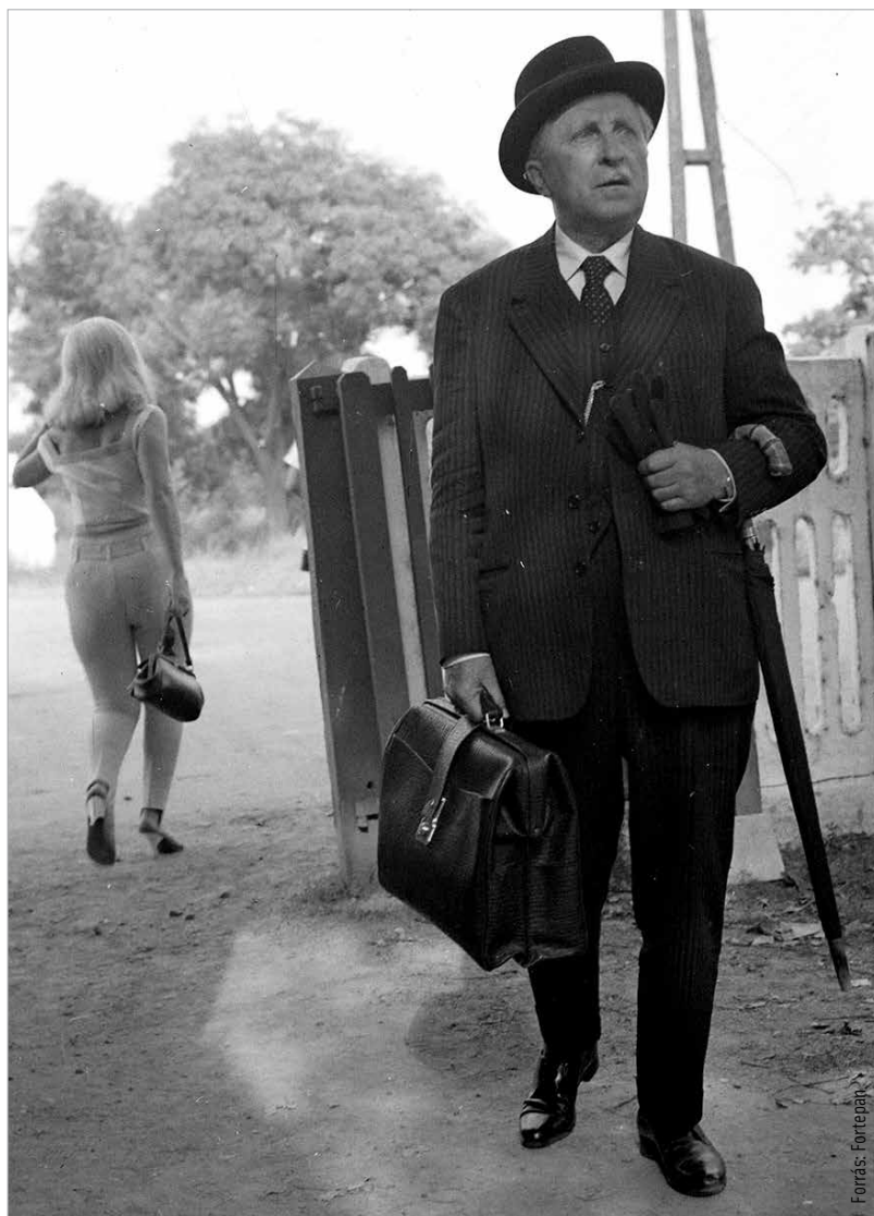
Páger Antal az első világháborút is megjárta