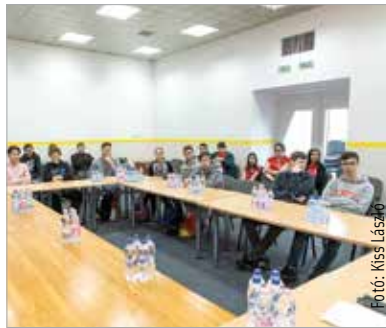
A fiatalok egy kerekasztal beszélgetés keretében ismerkedhettek a nonprofit szektorral

A Civilek Napja alkalmából Székesfehérvárra látogatott Szalay-Bobrovicz Vince, a Miniszterelnökség Civil és Társadalmi Kapcsolatokért Felelős Helyettes Államtitkárság helyettes államtitkára. Az államtitkár kiemelte, hogy a kormány támogatja és segíti a helyi közösségekért tevékenykedő civil szervezeteket, egyrészt azzal, hogy évről