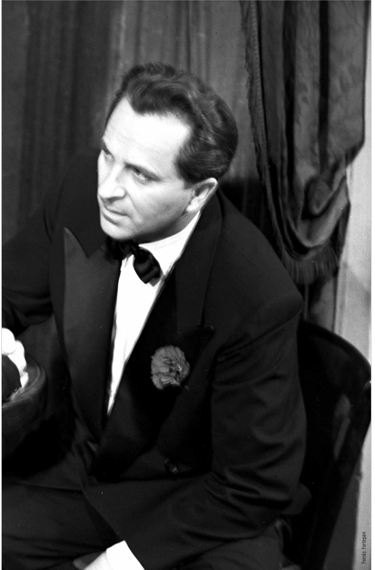
A színész több szállal kötődött Fehérvárhoz

Az 1961-ben készült, Osztrák-Magyar Monarchiában ját-