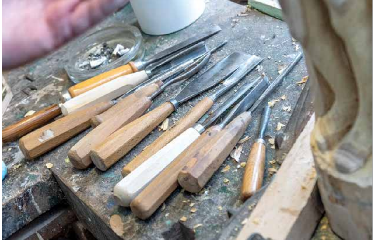
Szerszámok pihenés közben

Ehhez kellett a szükséglet piramis ismerete is, amely a legfontosabb hét szükségletet sorolja