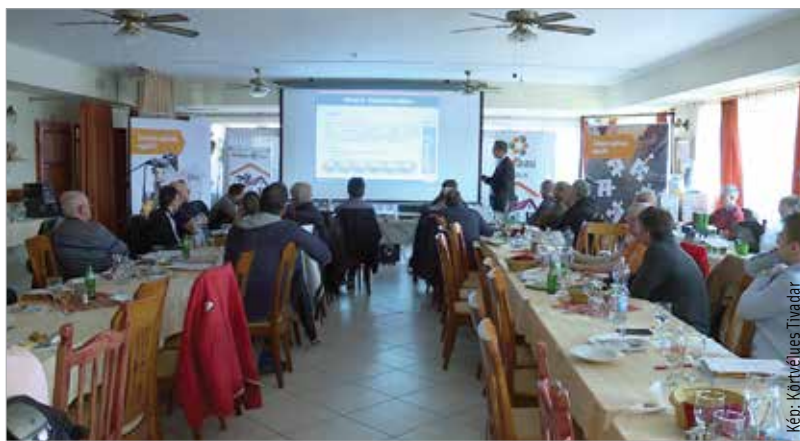
A kivitelezők a szakmai találkozó első napján a tetőt érintő újdonságokról tájékozódhattak

katársainak előadásában. Az első nap, február 6-án, a tetővel kapcsolatos újdonságok kapták a főszerepet. Az egyik legfontosabb újítás a felhasználás helyében van. Most a tetőn kívüli hőszigetelés az, ami reneszánszát éli. Ez egy hőhídmentes, tartós, időálló megoldás. A találkozón a szarufák feletti hőszigeteléssel, az ásványgyapot termékek magas tetős alkalmazásával, a lapos és magas tetők segédanyagaival ismerkedhettek meg a résztvevők. A konferencia második napján, február 7-én, csütörtökön a homlokzat hőszigetelési újdonságairól, a fallal kapcsolatos innovatív technikákról hallhattak az érdeklődők.