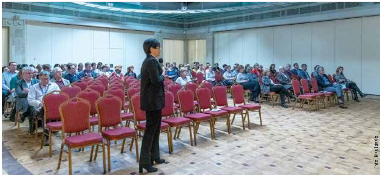
A megnyitót követően szekciósülésekkel folytatódott a program

„Tényszerű adatokkal tudom megerősíteni azt a folyamatot, amelyről polgármester úr beszélt. A kórházfejlesztés, amelyet az utóbbi esztendőkből realizálhattunk infrastruktúrában, eszközökben a célegyeneséhez érkezett. Ezt ahhoz be kell, hogy fejezzük, hogy a kórház hosszú évtizedekre minden szempontból európai színvonalon feleljen meg a kihívásoknak” - emelte ki a tanácskozást