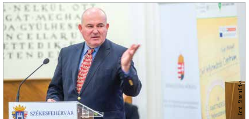
Elősorban az érték- és közösségteremtő pályázatokat honorálják

2018-ban Székesfehérváron kétszázharmincnyolc szervezet részesült több mint háromszáz-huszonhatmillió forintos önkormányzati támogatásban. Cser-Palkovics András polgármester arra hívta fel a szervezetek figyelmét, hogy használják ki az állami pályázati lehetőségeket is, melyekben jóval több lehetőség van, mint amivel a fehérváriak eddig éltek.