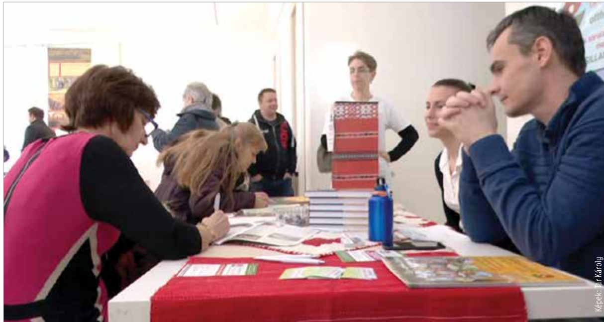
Sokan több rövidebb utat terveznek