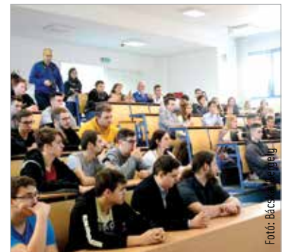
A januári nyílt nap az Óbudai Egyetemen

A pontszámítás alap- és osztatlan képzésen valamint felsőoktatási szakképzésen ötszáz pontos rendszerben történik: a tanulmányi és érettségi pontok (maximum negyszáz pont) mellé különböző jogcímenek legfeljebb száz többletpontot lehet kapni. Mesterképzésen legfeljebb száz pont szerezhető, a pontszámítás szabályait a fel-