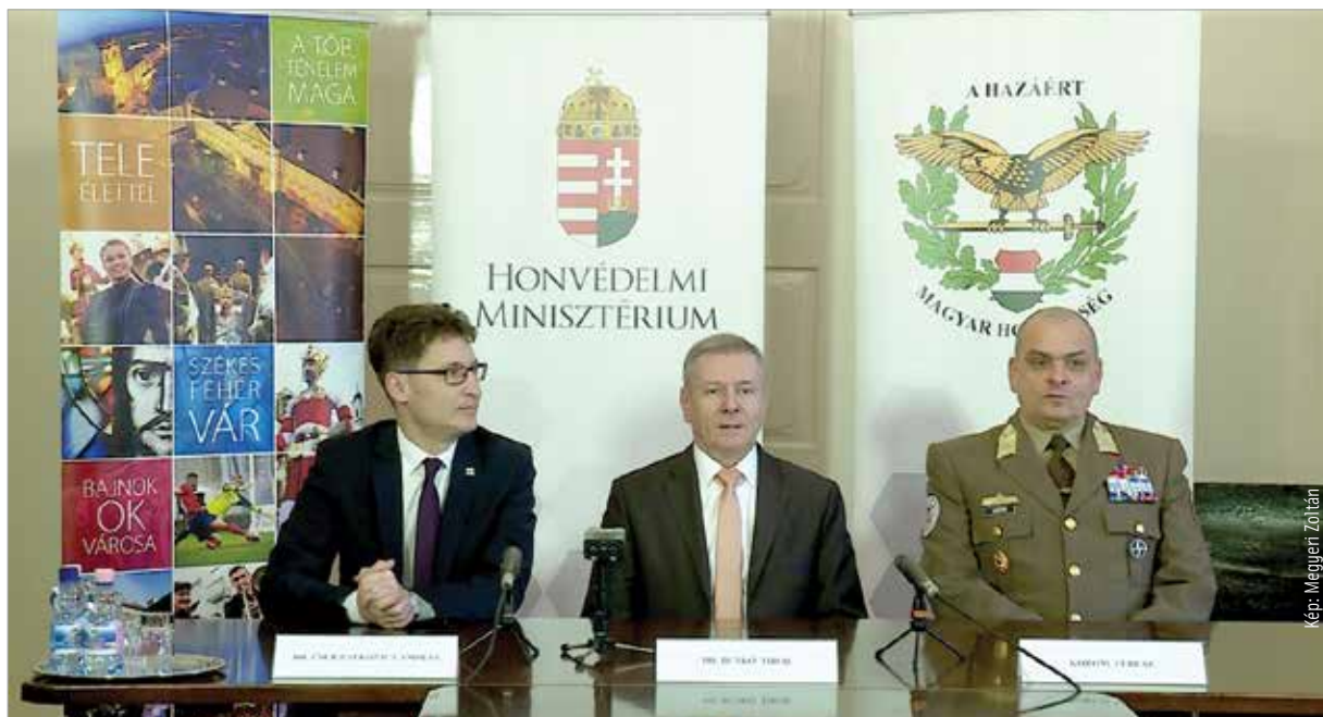
A Magyar Honvédség Parancsnoksága, vagyis a honvédség szakmai irányítása a városba költözik. A részletekről Cser-Palkovics András polgármester valamint Benkő Tibor honvédelmi miniszter és az új szervezet parancsnoka, Korom Ferenc altábornagy tartott tájékoztatót.

A közgyűlés egyhangúlag fogadta el azt a határozatot, melyben a város vezetése kifejezi nyitottságát, hogy szövetséges országokkal történő nemzetközi katonai együttműködésből adódó feladatokkal bővüljön a Székesfehérvár Helyőrség feladatköre, és a város katonai szerepe ezáltal tovább erősödjön. Ezek érdekében az önkormányzat áttekinti tervezett fejlesztéseit és megvizsgálja azok illeszkedését és esetleges integrálhatóságát a katonai célú fejlesztésekbe. A közgyűlés felkérte a polgármestert, hogy az esetlegesen ebből eredő, a várost terhelő többletkiadásokra vonatkozó javaslatot terjessze a közgyűlés elé. Ennek fedezetéül a költségvetésben kerüljön tervezésre tartalék. A közgyűlés felkérte a polgármestert, hogy többletkiadások felmerülése esetén kezdeményezzen tárgyalásokat azok állami forrásból történő biztosítására.