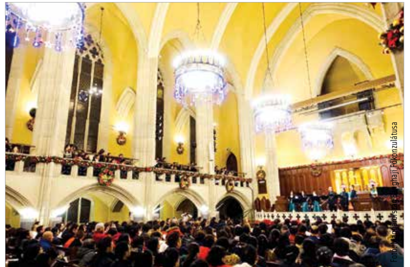
Telt házas koncertet adtak

„Sanghajban egy nyolcszáz férőhelyes templomépületben énekelünk, ahová állítólag nyolcszázötven személy zsúfolódott be.” – mesélte