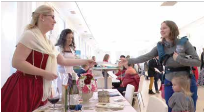
Idén is színes programokkal várták a fehérváriakat a kiállításon

Nem is bízunk a véletlenre a jó képek készítését: a standon fotósok gondoskodnak a maradandó emlék elkészítéséről és elküldéséről. Az itt készített képeket érdemes lesz megosztani az internet közösségi felületein, ezzel is népszerűsítve Székesfehérvárt."