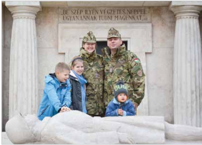
Hisznek a következetesség erejében

Rendkívül tettezre készek vagytok, strapabírók, és a napirendet is példás következetességgel tartjátok be. Mindez a hivatásotokból is adódik. Melyikötök miatt döntötté úgy, hogy katona lesz?