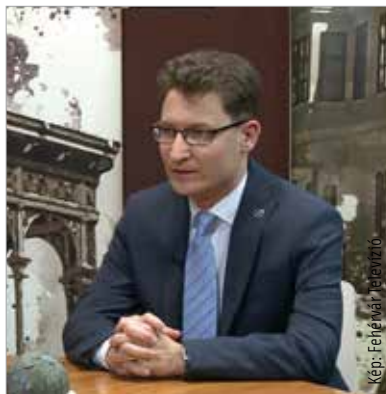
A 2019-es költségvetésről készült polgármesteri beszélgetést megnézhetik a Fehérvár Média centrum Youtube-csatornáján!

Az utóbbi években folyamatosan nő Székesfehérvár adóbevétele, a 2018-as 25,1 milliárdos bevétel idén több mint a költségvetés harmadát jelenti. Ezek a bevételek az utóbbi években folyamatosan nőttek, mintegy évi tíz százalékkal. „A több mint húszmilliárdos iparűzési-adó-bevételt tekintve leegyszerűsítve elmondhatjuk, hogy ennyivel növekedett Székesfehérvár gazdasága, és ez jóval nagyobb növekedést jelent, mint a szintén szépen növekvő országos adatok. Ez egyrészt jóval magasabb foglalkoztatási szintet is jelent, ami uniós összehasonlításban is nagyon szép eredmény. Másrészt pedig növeli az önkormányzat adóbevételeit úgy, hogy nem kell hozzá adót emelni. Tehát nem azért emelkedik az adóbevétel, mert növeljük az