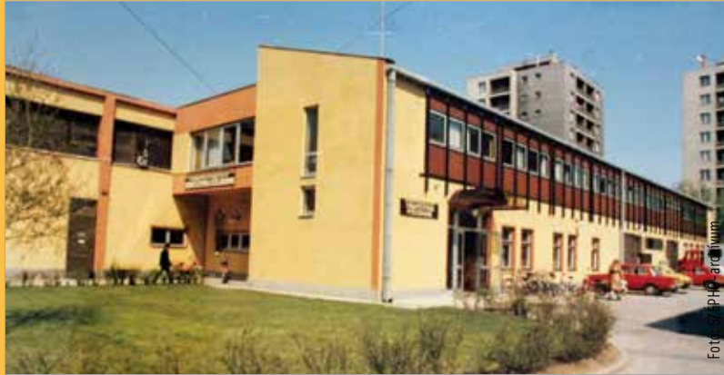
A Távfűtési Főüzem a Lövölde úton

Mozgalmas volt ez a hetven év. Akár ingatlankezelésről, akár távhőszolgáltatásról beszélünk, mindig igyekeztünk a lehetőségeinkhez mérten magas szintű szolgáltatást nyújtani. Ebben elsődleges szerepük van a kol-