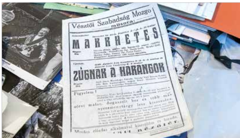
A vésztői moziban szilveszterkor még újévi malacot is sorsoltak