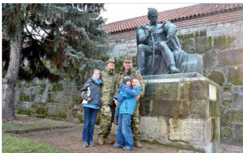
Szeretik a kihívásokat