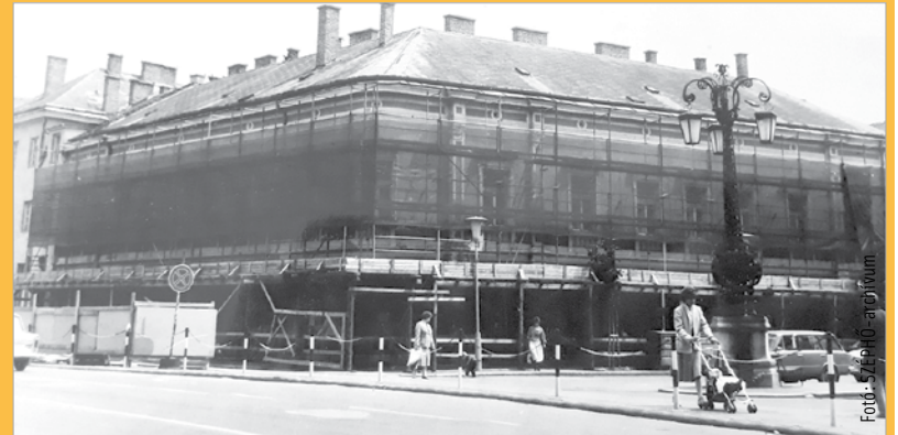
Számos belvárosi épület megújulása, rendbehozatala a vállalathoz köthető

Különböző rendezvényekkel készülünk, sokféleképp szeretnénk megszólítani részben a felhasználóinkat, de azokat is, akik a távhővel semmilyen kapcsolatban nincsenek. Az irodaházunk előterében kialakítottunk egy retrósarkot, ahol