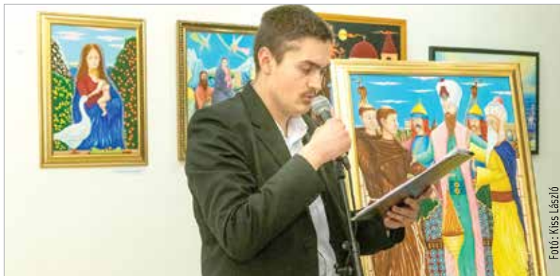
A magyar naiv festészet egyik legkiválóbb alkotója, Vollein Ferenc újra Székesfehérvár vendége volt. A Szabadművelődés Házában rendezett tárlatán megcsodálhattuk egyedi színvilágát, különleges ecsetkezelését.