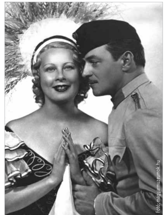
Erdélyi Mihály Legyen úgy, mint régen volt! című operettjében Jávor Pál volt Honthy Hanna partnere. A darabot az Erzsébetvárosi Színház játszotta a Városligetben.