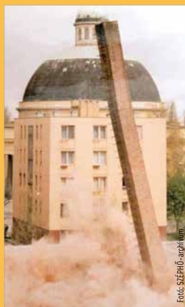
Kéményrobbantás a Prohászán