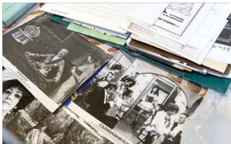
Moziplakátok a múltból