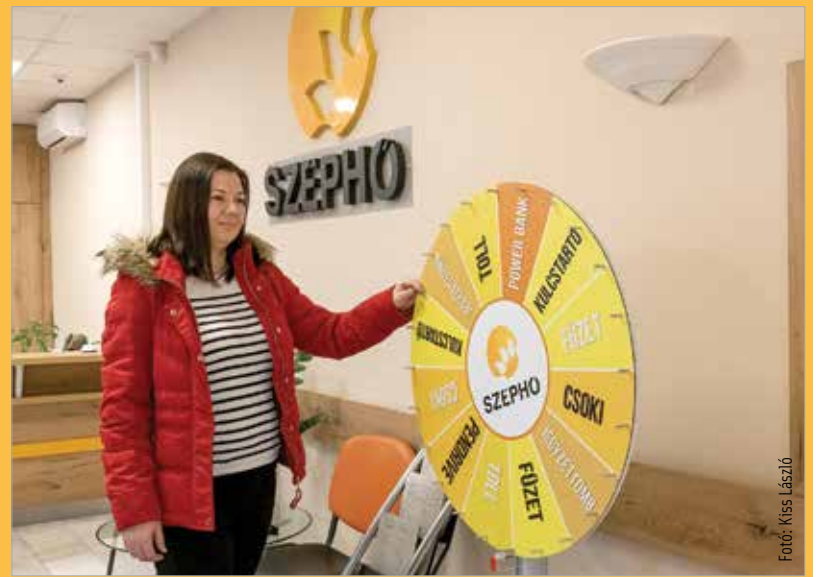
Az ügyfelekkel együtt ünnepel a SZÉPHŐ: minden hónap hetedikén szerencsekerék várja a fogyasztókat

a tevékenységünket. Az idei társadalmi felelősségvállalási akciónkat is összekapcsoljuk a cég hetvenéves jubileumával. Fontosnak tartjuk, hogy ne csak kifelé mutassuk meg magunkat, hanem együtt, közösen is tudjunk ünnepelni. Aki valaha nálunk dolgozott illetve most dolgozik, annak része van a cég elmúlt hetven évében, és erre joggal lehet, lehetünk büszkéek!