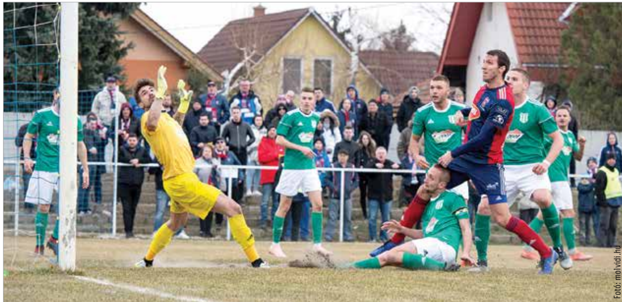
Sok helyzetet dolgozott ki a Vidi a Taksony elleni Magyar Kupa-meccsen, de csak egy gólt szerzett

A szerda délutáni mérkőzésen a sziréna akár a fehérváriakat is figyelmeztethette volna, mert ziccerek egész sorát alakították ki – eredménytelenül. Az NB III-as ellenfél helytállása elsősorban kapusán múlott, de a közel harminc fehérvári kapura lövésből talán többre számítottunk volna. A hetvennyolcadik percig kellett várni a győztes gólig, ekkor egy gyors