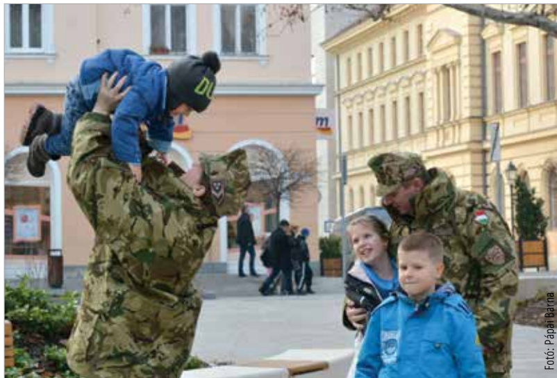
Családi körben lazaság van!