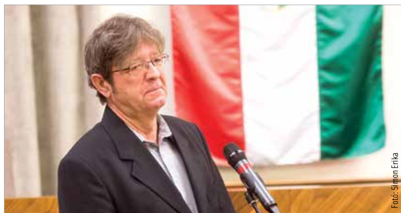
Burján Zsigmond filmje Siklósi Gyula régészprofesszornak állít emléket

Pető Zsuzsa Eszter régész a Lakatos utca és a Püspöki palota kertje közötti területen folytatott ásátásról is beszél, ahol egy nagy várfalszakasz került elő. Szabados György történész István koronázásáról, a korabeli Fehérvár szerepéről értekeznek, és kimondja, hogy racionálisan gondolkodva valószínűtlen, hogy Istvánt Esztergomban koronázták volna, mint ahogy az is, hogy ne Székesfehérvár lett volna az ország fővárosa.