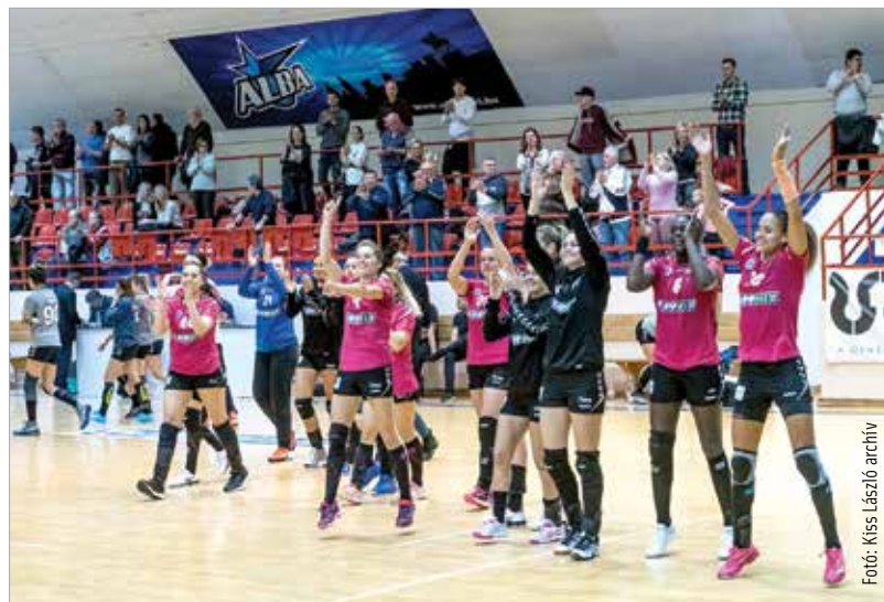
Szombaton is együtt ünnepelnének a fehérvári játékosok szurkolóikkal

Ha így lesz, elmondható, hogy hozta a csapat a fontos, kötelező meccseit a hónapban, ami a végelszámolásnál fontos lesz majd. Az Alba Fehérvár KC jelenleg 18 ponttal hatodik helyen áll a női kézilabda-bajnokság tabelláján.