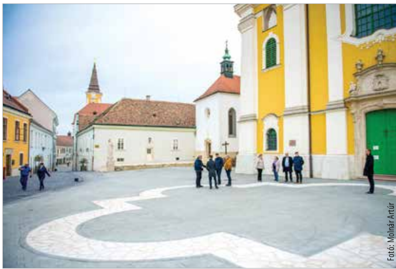
A tér a magyar nemzet történelmének egyik legfontosabb helyszíne

régészeti feltárást követően kezdődött. A belvárosban zajló felújítási program újabb állomása ez, aminek eredményeként az egykori négykaréjos templom alaprajza valamint a feltárt középkori sírok helye is kövel kirakott mintázattal bemutatathatóvá vált. A területre még ládákban virágok és cserjék kerülnek, de tájékoztató táblákat is terveznek a szakemberek, melyek az egykori bazilikáról és az ásatások eredményeiről számolnak be. Ezt követően teljesen bejárható lesz a tér és környéke. A terület teljes megújulása 2022-re várható, hiszen a Géza nagyfejedelem tér a bazilika belső felújítását követően készül majd el.