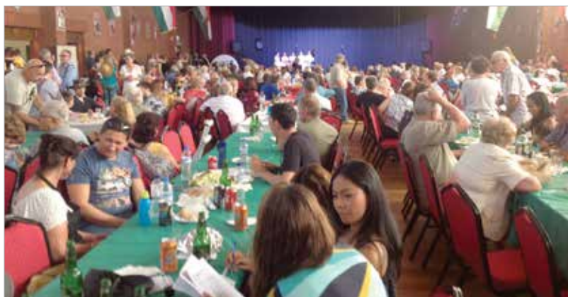
Mindkét helyszínen telt ház előtt ünnepelt a magyarság

magyarság megmaradását és nemzeti identitásának megőrzését mi sem segítené jobban, ha fiataljait is delegálnák a diák bajnokságra.