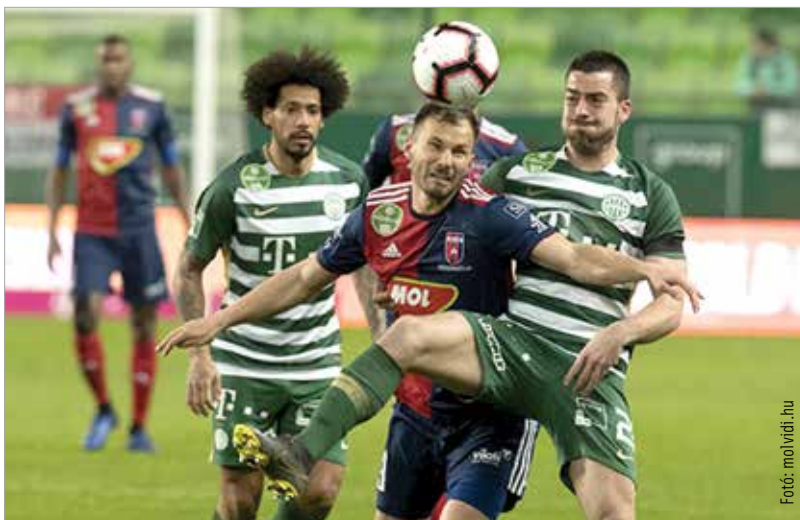
Parázs csata, három fejesgöl, Vidi-győzelem – ezek jellemezték a szerda esti Magyar Kupa-derbit