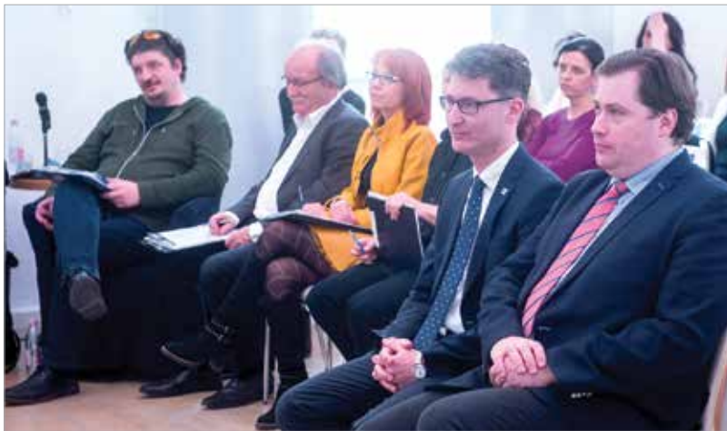
A zsűrinek, a mentoroknak és a városvezetésnek is az a véleménye, hogy ebből a tehetségkutatóból érdemes hagyományt teremteni

önálló beszédben, és talán egy kicsit jobbak véleményformálásban, mint kritikában, de mindez egyszerre valamennyiünk számára hatalmas kaland volt!” A Szóval győzni döntője három részből állt. A diákok először beszédet tartottak arról, számukra mit jelent a siker, később helytálltak, mint interjúalanyok, ezt követően pedig rögtönözve reagáltak médiatudatosságról szóló kisfilmekre. Helyet kapott a kritikai hozzászólás is, amit a diákok különféle képpen