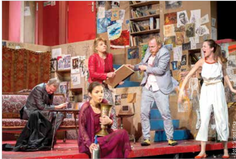
Black Comedy – tetőfokán a zűrzavar