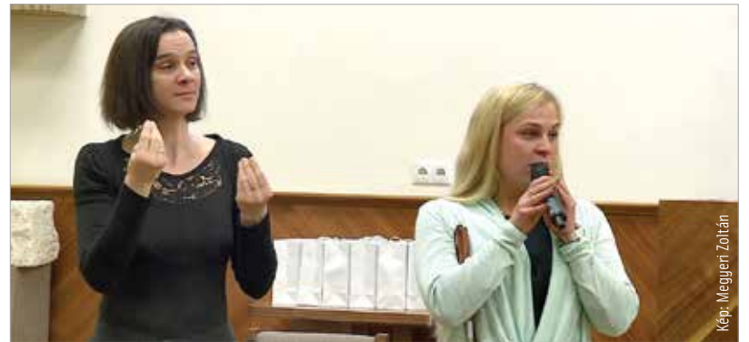
A konferencián a Vasvári Pál Gimnázium Gesztus nevű csoportja a Pál utcai fiúk ismert dallamaival örvendeztette meg a résztvevőket, akik ezután kisfilmeket láthattak a fogyatékosokkal élő gyerekek mindennapjairól

A konferencián fehérvári középiskolások, tanárai és civilszervezetek képviselői vettek részt. A Székesfehérvári Érzékenyítő Program, azaz a SZÉP elnevezés városunk polgármesterének ötleteként született meg, ezzel is jelezve, hogy a város szeretettel áll a nemes ügy mellé. A program üzenetét mindenkinek érdeemes megszívlelni: tanuljunk meg egymást elfogadni, hiszen csak együtt, elfogadásban lehet SZÉP az élet!