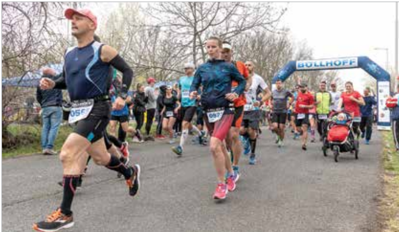
Az agárdi rajt – volt, aki babakocsival vágott neki a tó körnek

Nem verseny, nem is úgy indult – eredetileg egy baráti összejövetelként, amolyan baráti tó körként kezdődött. Vasárnap pedig közel ezren álltak oda a XIV. Böllhoff Tóparti Futóparti rajtjához, hogy teljesítsék a huszonnyolc kilométeres kört a Velencei-tó körül.