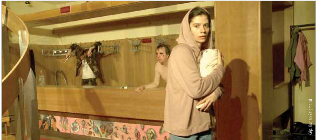
Fókuszban az emberi gyötrelmek