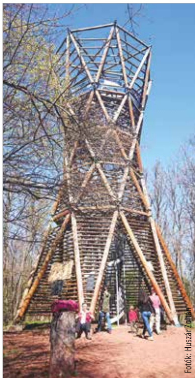
Az ingyenesen látogatható Kisfaludy-kilátó tetejéről körpanoráma tárul elének

A sárga jelzés mentén egy meredek lépcsősoron indulhatunk meghódítani a hegyet. A kaptató végén egy kis pihenő- és kilátóhelyet találunk, itt van a híres Rózsa-kő. A legenda szerint ha egy fiatal pár háttal a