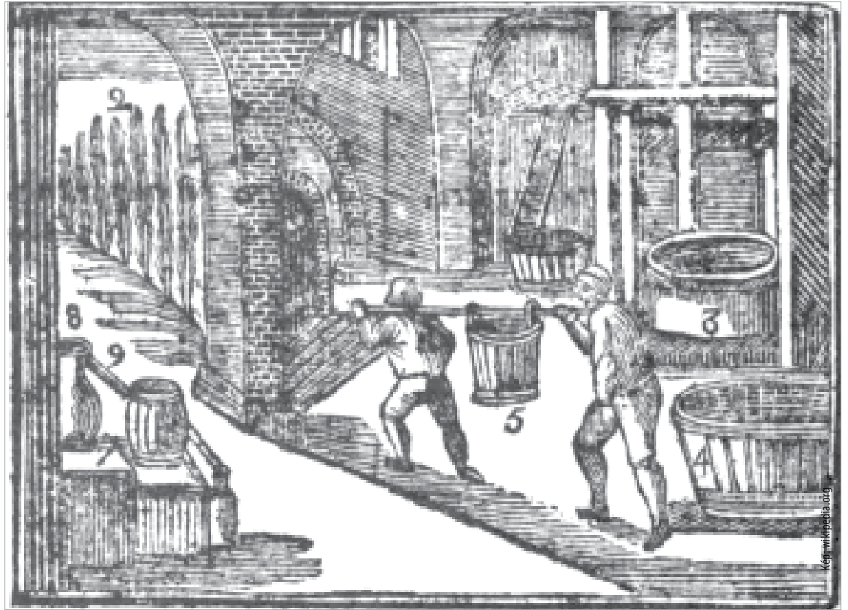
Jan Amos Komenský rajzán a serfőzés folyamata követhető nyomon. Baloldalon látszik a komlóültetvény, szemben, a létra fölött a malátát szárítják, jobbra hátul a főzőüst, azaz katlan, előtte a hűtőkád, középen a serfőző legények viszik a serlét a pincébe.

A ház mögött volt a pince, azzal átellenben, az út másik oldalán a vízimalom. Volt egy egyjágányú szárazmalom is, zsindegyel fedve és minden hozzávalóval ellátva. A molnár szalmatető házában lakott. Kézelfogható az a racionalitás, ami a serfőzőházat, a vízi- és szárazmalmot, a tégláégetőt, a kádárműhelyt és a mindezeket működtető mesterek lakását egy egységben kezelő gondolkodásként mutatja fel. Elképzelhetjük, ahogyan a molnárok őrlik a gabonát, a tégláégetők pakolják ki a kemencéből a téglákat, halljuk, ahogyan a kádár huzatókalapácsával üti az abroncsokat a készülő hordók dongái körül, s érezzük a főzött maláta kellemes gabonaillatát. A verpeléti sörház épületét