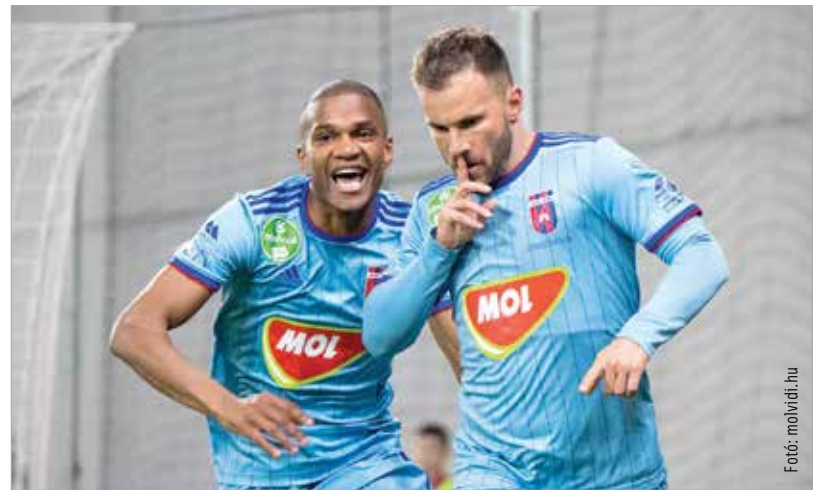
A hajrában nyerte a meccset a Vidi a Honvéd ellen

Győzelmi kényszerben sem lehet zavarba hozni a piros-kékeket, mert bizony Juhászék többnyire annak tudatában lépnek pályára a bajnokságban, hogy a Ferencváros már behúzta a három pontot. De tavaly a hajrában megborult ez az analógia, a Vidi-győzelmek mellett ezúttal is alapoznunk kell a Fradi vereségeire. Mindössze hat forduló – közte három hazai meccs – van hátra a bajnokságból, a Fradi nyolcpontos előnyét kell ledolgozni ezalatt. Szombaton az Újpest ellen is kötelező a győzelem.