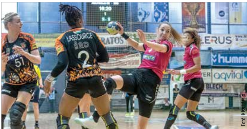
Küzdött az Érd ellen is a Fehérvár, de nem jött össze a pontszerzés