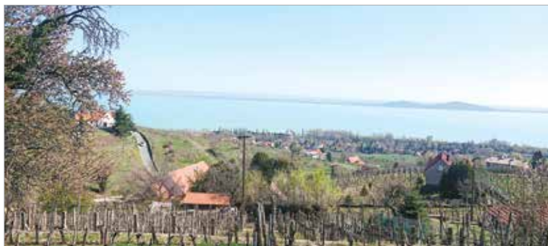
Mesés kilátás a hegyről, távolban a Balaton déli oldala a Fonyódi-hegygel

A kilátótól visszatérünk a kéktúra útvonálára, majd a lejtő aljában elkezdődik utunk legvadabb szakasza a Kőkapun keresztül. Két hatalmas bazaltszikla között, egy nagy kiterjedésű kőtenger mellett meredeken lejt a jól kiépített út. A bátrabbak néhol kimerészkedhetnek a kőtenger szikláira vagy a bazaltorgonák tetejére, hogy innen is megcsodálhassák a környék tanúhegyeit. A Kőkapu aljában lévő útkeresztezédsnél balra fordulunk a piros jelzésű Kuruc körútra. A