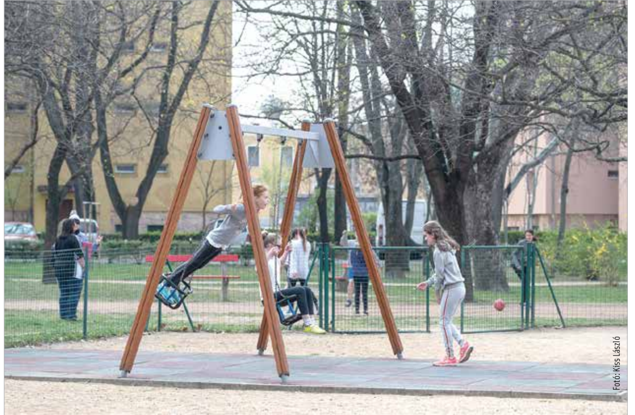
A parkokat, játszótéereket az iskolások is szívesen használják

Az egyik legnagyobb – mintegy kétszázmillió forintos – beruházás a Salétrom utca megújulása volt, mely Molnár Tamás szerint ma már sokkal inkább sétány. A régi, töredezett betonburkolat helyett a színes kockakövek, zöld szigetek és padok egy szellősen tagolt közösségi teret alkotnak. Amit nemcsak az itt lakók, hanem a környező iskolák és óvodák is szívesen használnak.