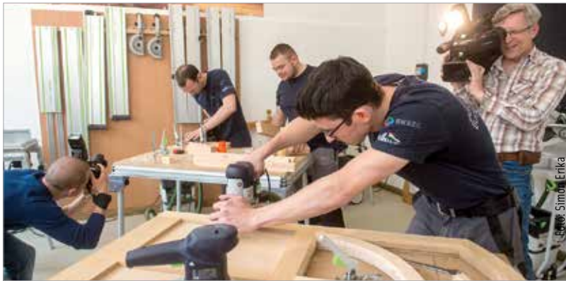
Átadták a Vörösmarty középiskola új asztalosműhelyét. Az újonnan kialakított tanműhelyben a legkorszerűbb kis- és közepüzemi technológiát sajátíthatják el a diákok.