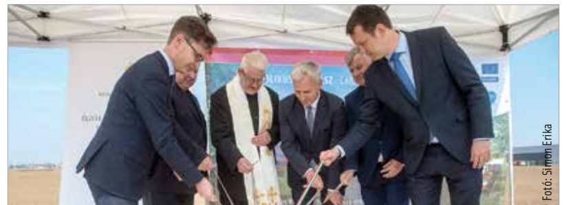
Az új raktárbázis a nyugati országgrész logisztikai és koordinációs központja valamint a helyi és környékbeli szociális feladatellátás és az önkéntesek bázisa lesz

A központok a Katolikus Karitás vészhelyzeti bázisaiként is működnek majd, ez nagy hatással lehet a hálózat jövőjére Spányi Antal megyés püspök, a Katolikus Karitás elnöke szerint, hiszen mint mondta: egy ilyen raktár megépítése és alkalmazása nagy jelentőségű a karitás jövőjét illetően. A karitás a város támogatásával vásárolta meg a területet, ahol felépíthetik a több száz négyzetméteres raktárat. Ezzel a telephellyel hatékonyan el tudják majd látni a rászorulókat. Székesfehérvár közel huszonegy milliárd forinttal támogatta a beruházást, mely 2020 áprilisáig valósul meg.