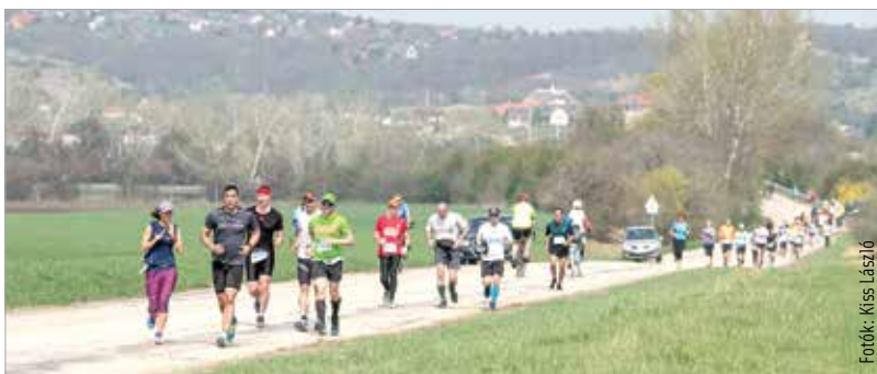
Túl a táv felén – egyre melegebb az idő, így ekkor már keveseknek volt őszi a mosolya