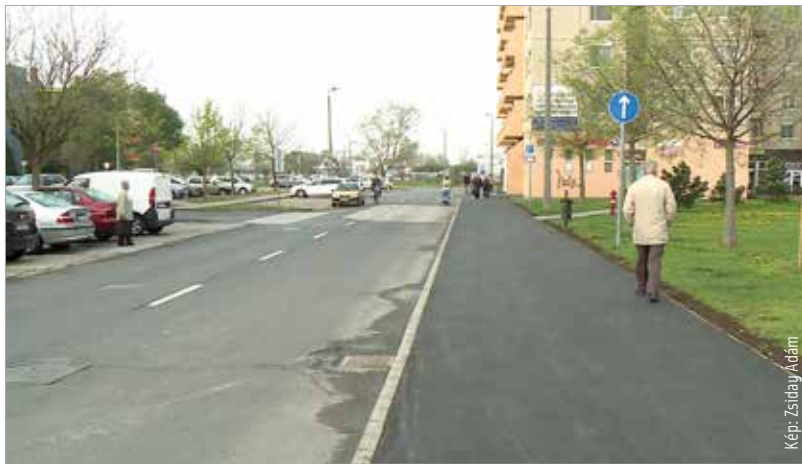
A Jancsár és a Sziget utca több szakaszán az elfáradt, elöregedett, repedezett burkolatot eltávolították és újra cserélték a szakemberek

A képviselő hozzátette: az évek során több mint kétszázmillió forintot fordított az önkormányzat a Palotavárosban a járdák rekonstrukciójára. Ezúttal a Jancsár utca 1-5., 39-41. és a Sziget utca 33-35. környékén újultak meg a járdák. A Sziget utca 41-es lépcsőházáig megújultak a belső utak, valamint a 47-51. közötti járda is új burkolatot kapott. A járdafelújítások tovább folytatódnak Palotavárosban.