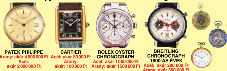
PATEK PHILIPPE Arany: akár 4 000 000 Ft Acél: akár 2 000 000 Ft

Keresek Angelus, Heuer, Marvin, Doxa, Bovet, Tavannes, Breitling, Vetta acél stopperos órákat 100 000–300 000 Ft-ig! (akár hibásat is)