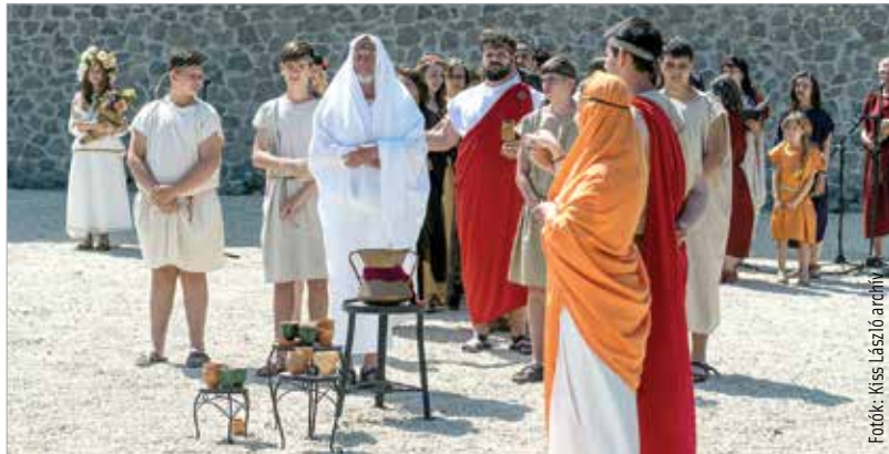
A Floralia leglátványosabb eseménye ebben az évben is a császár bevonulása lesz, mely Septimius Severus kétszázkettedik évi gorsiumi látogatását idézi meg

Megelevenednek az ókori birodalomban zajló események, megérkezik Septimius Severus császár, testközelből nézhetjük végig a gladiátorok harcát Tácon. A tavaszköszöntő rendezvény szombaton és vasárnap várja az időutazókat. A Floralia a Szent István Király Múzeum egyik legnagyobb rendezvénye, évről évre látogatók ezreit vonzza.