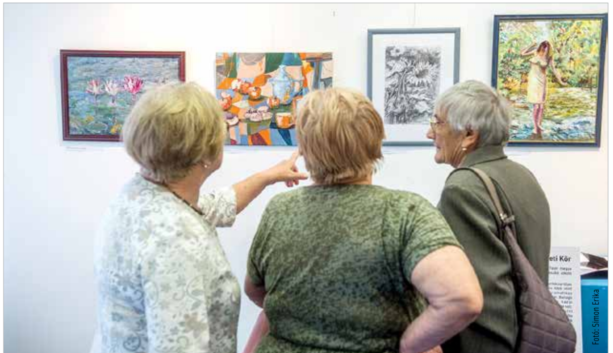
Idén is színvonalas alkotásokkal mutatkoztak be a kör tagjai