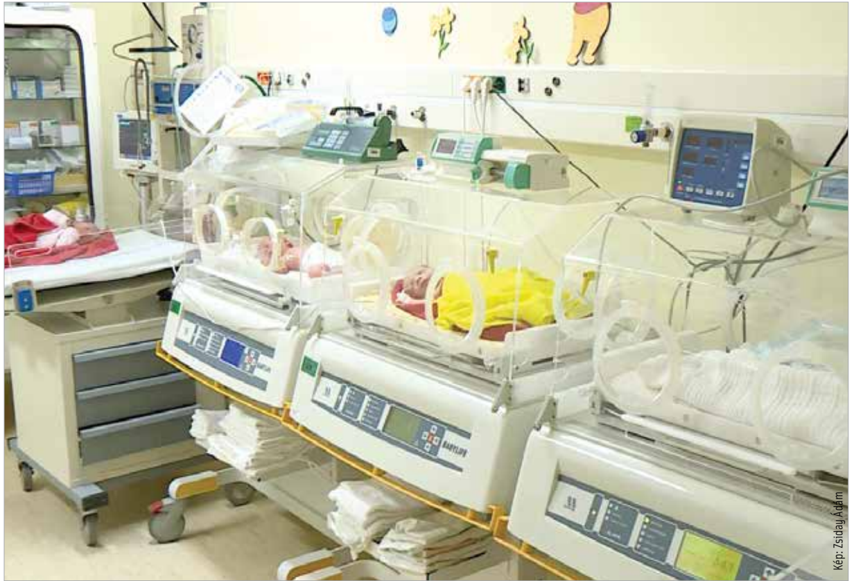
A Szent György Kórház szülészeti és koraszülöttosztálya nemrég a Családhaló díjat is elnyerte

A gyermekágyas osztályokon, ahol jelenleg két-, három- és négyágyas szobák vannak, szintén átalakítás lesz, két és lehetőség szerint egyágyas szobákat is terveznek. Cél, hogy az ellátás szállodai szintű lehessen, a kórtermekben televíziót, de igény szerint fotelágyat is biztosítanak majd. A szülészeti és a koraszülöttosztályon egy kétszázmilliós és egy nyolcvanmillió forintos infrastruktúrális eszközparkot javító fejlesztés valósul meg.