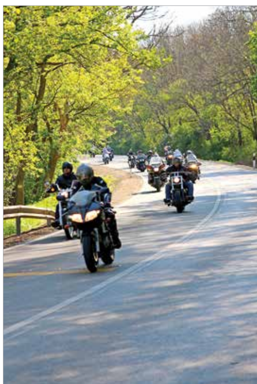
A különleges túra Székesfehérvárról indult, majd Lovasberényen, Alcsúton, Felcsúton, Csákváron valamint Gánton át Szababattyánig gurultak a járgányokkal