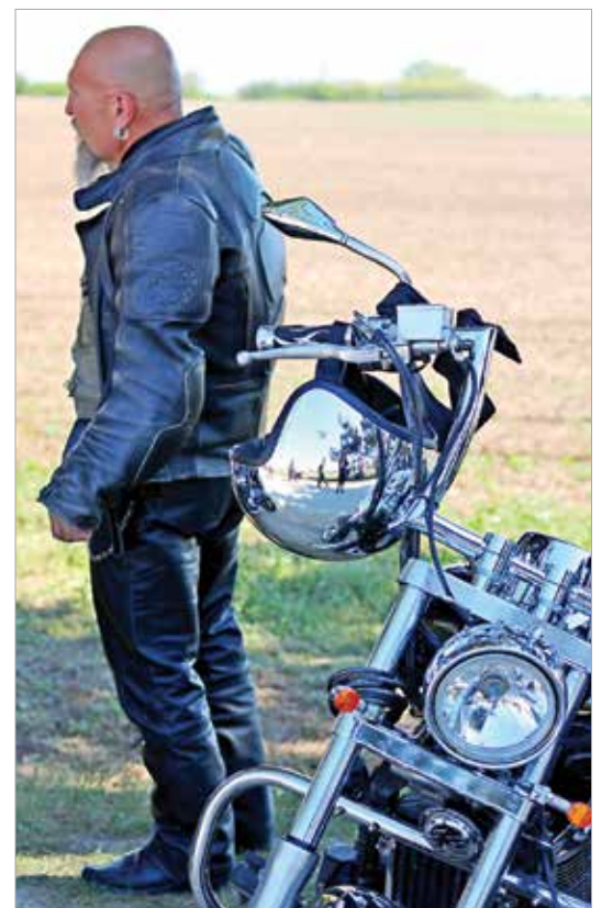
Sokan vallják, hogy a motor egyet jelent a szabadsággal