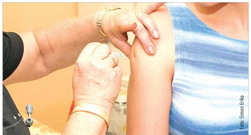
A teljes védettséghez két oltásra van szükség

A magyar védőoltási rend példaeértékű: a különböző fertőző betegségek elleni úgynevezett átoltottság nagyon jó, mintegy kilencvennyolc százalékos, ennek köszönhetően pedig azok is védve vannak, akik valamilyen egészségügyi ok miatt nem olthatók. A tájékoztató elhangzott az is, hogy a bárányhimlő a bejelentett fertőző megbetegedések felét adja. A bárányhimlő egyes esetekben maradványtünetekkel gyógyulhat. A betegséget komolyan kell venni. A szeptembertől kötelező bárányhimlő elleni védőoltást a 2018. július 31. után született gyerekek kapják meg két sorozatban, tizenhárom és tizenhat hónapos korukban. Müller Cecília hozzátette: a védőoltással megelőzhető fertőző betegségek mára szinte eltűntek, évente néhány, jellemzően behurcolt esetet jelentenek csak.