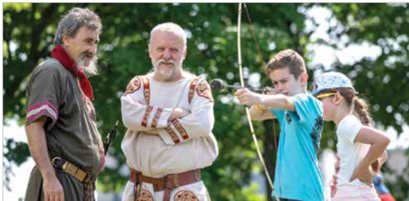
A fesztivál kicsiket és nagyokat egyaránt vár a gyönyörű természeti környezetbe