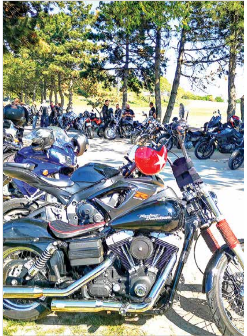
Egy ilyen találkozón nemcsak a motorosok, de a szebbnél szebb motorok is középpontba kerülnek