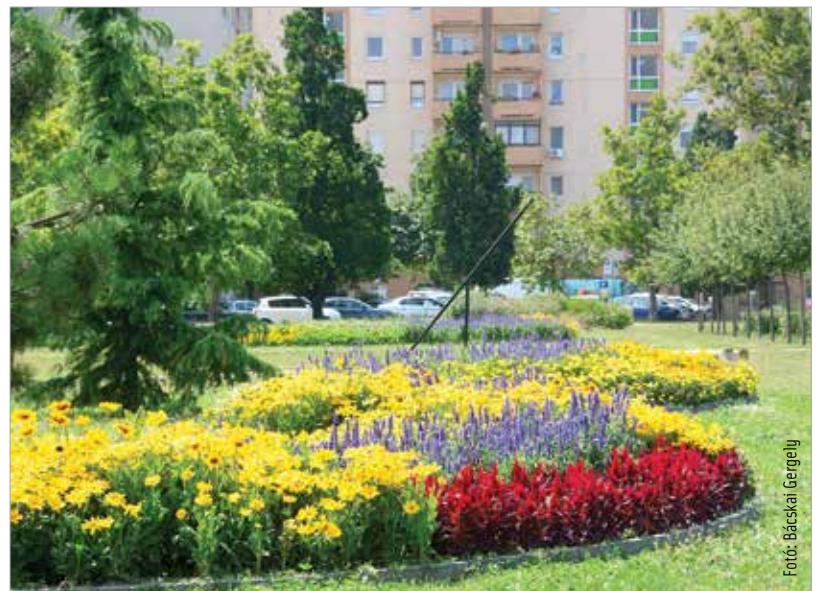
Lehetőleg magyar nemesítésű virágokkal dolgozik

mester úr indítja el, hívjuk a lakótelepen élőket, hogy csatlakozzanak. Növényeket is kapnak, mi azt kérjük, hogy ők gondozzák. A lakótelepi kővázakat is sokszor ápolják, locsolják a lakók – ezekre nem mindig jutna kapacitás a Város-