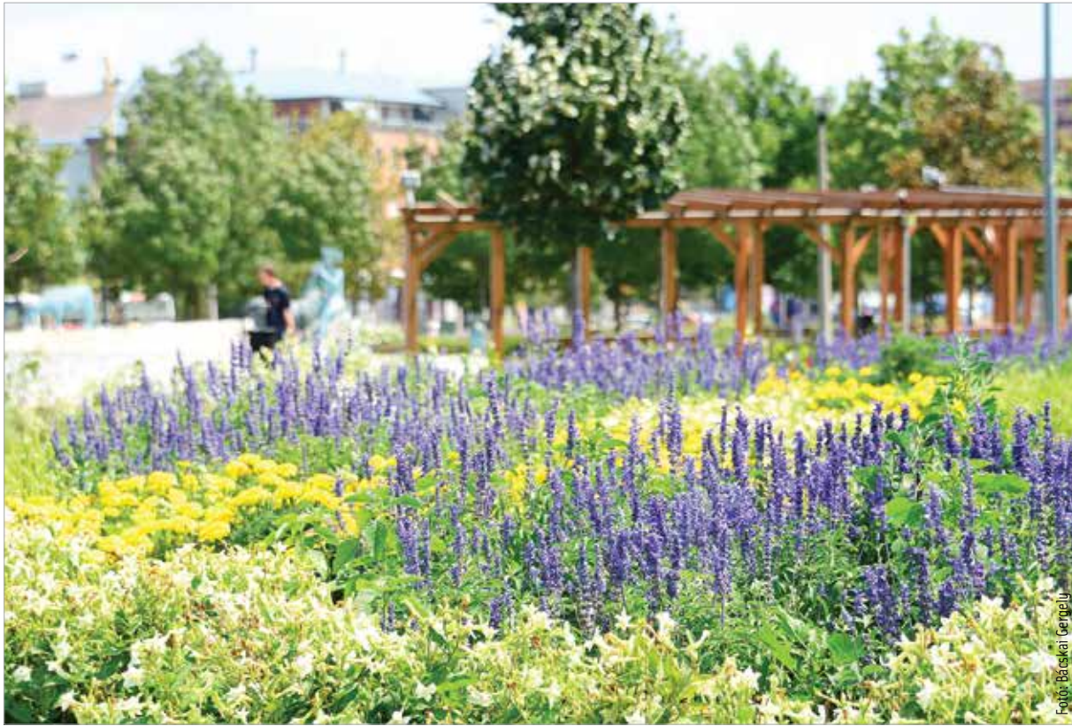
A Petőfi park

Remélem, hogy az vagyok, persze ezt inkább a körülöttem élők tudják megmondani. Nagyon szép