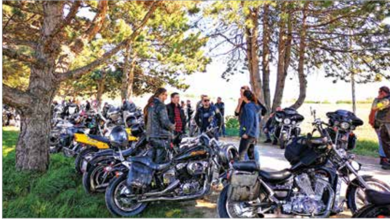
Gyülekező az Aranybullánál: soha nem voltak még ilyen sokan ezen a túrán

Felbőgtek szombat délután a motorok: több mint száz motoros gyűlt össze az Aranybulla-emlékműnél, hogy együtt guruljanak, üdvözölve a tavaszt, a megújulást, a húsvét ünnepét. A túrát hagyományteremtő szándékkal hívták életre négy évvel ezelőtt, hogy népszerűsítsék a motorozást és közösséget kovácsolhassanak a megyében a motorkedvelők körében.