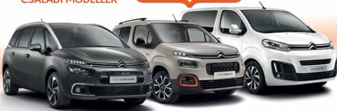
CITROËN GRAND C4 SPACETOURER