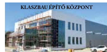
KLASZBAU ÉPÍTŐ KÖZPONT