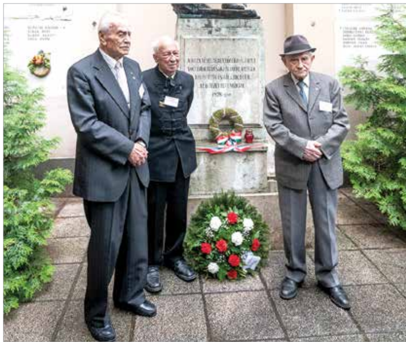
Minden évben koszorúznak az iskola épülete előtt