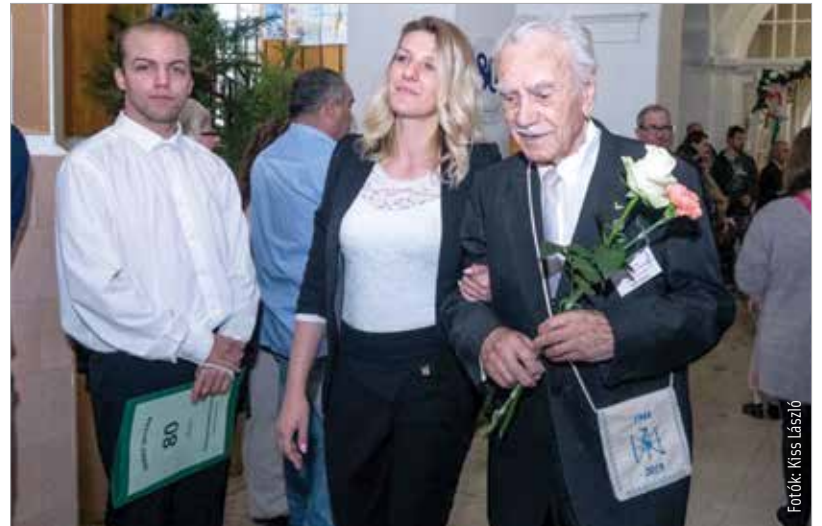
Részt vettek a ballagáson a most végzett diákokkal együtt