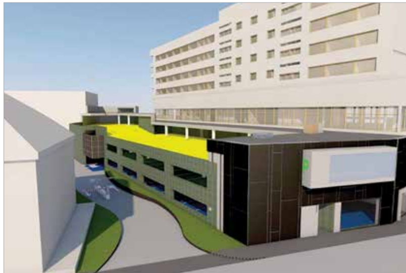
Mindkét oldalán lesz ki- és bejárat