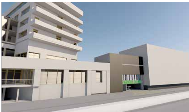
Elektromos autók töltésére is lesz lehetőség