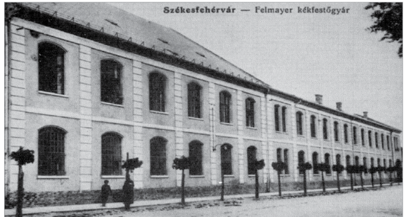
A Felmayer Kékfestőgyár

lakóhelye volt, de az egész külváros lakóinak többségét mindvégig magyarok alkották. Fényes Elek kiemeli 1846-os leírásában, hogy a Palotaváros iparosok lakóhelye, s különösen a vízigényes iparok telepedtek ide, hiszen a huszadik századig a víz még fedetlen csatornában (Malom-csatorna, Varga-csatorna, Szél-kanális, Tobak-csatorna) folyt. A rácok hagyományos iparokat űzték: vargák, csapók, szűrszabók voltak. Legjellegzetesebb iparág a tobakoké, akik a Tobak utca névadói is lettek. Eredeti-