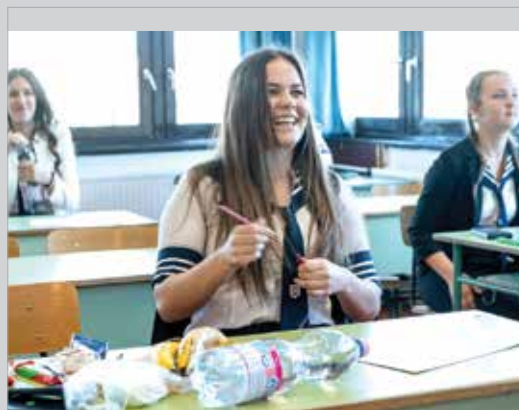
Még néhány perc, és kezdődik az írásbeli

Az érettségizőknek a szövegelemzésre hatvan percük volt, melynek keretében egy játékról szóló szöveghez tettek fel nekik kérdéseket. A második gyakorlati, szövegalkotásos részben két feladat közül választhattak: vagy régészeti témában írtak hivatalos levelet az önkormányzatnak vagy érveltek a filmek szinkronizálása mellett vagy ellen. A harmadik része a vizsgának műértelmezés volt. Az érettségizőknek vagy egy Mándy Iván-novellát kellett elemezni vagy összehasonlíthatták József Attila Kertész leszek és Radnóti Miklós Istenhegyi kert című versét.