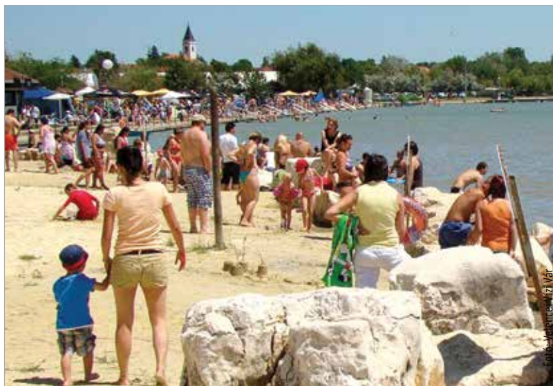
Velencén több gyermekbarát és kiváló vízminőségű strand is van

Bár az idei fagyosszentek jó hosszan villantják meg fogukat, a mostani közel sem strandbarát időjárás ne tévesszen meg senkit: néhány hét, és jól fog esni a hűsítő habokba merülni! Székesfehérvár földrajzi helyzete ilyen szempontból is szerencsés, hiszen a Balatonhoz sem kell órákat utazgatni, az első Velencei-tavi strand pedig alig tizenöt kilométernyire található. Az ÁNTSZ áprilisban már közzétette első idei minősítését, melyben a hazai természetes fürdővizek állapotát osztályozza. Szerencsére mind a Velencei-tavi, mind pedig a balatoni strandok többsége kiváló besorolást kapott, szóval akár gyermekkel is bátran megmerítközhetünk a habokban! Persze a vízminőség egy – bár kétségtelenül nagyon fontos – dolog, ám ha kisgyermekkel indulunk neki a strandolásnak, nem árt, ha a kiválasztott hely legalább nyomokban baba- és gyer-