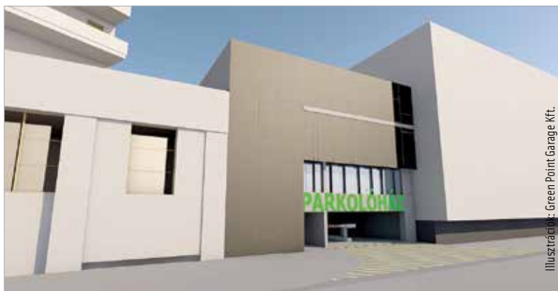
A parkolóház százharmincöt autónak és hat motornak ad majd helyet

szintes épületbe százharmincöt autó és hat motorkerékpár fér majd be. Lesz e-töltő is, és teljesen automatizált beléptetőrendszer engedi majd az autósokat a parkolóházba, ahol kamerák figyelik a területet. A közlekedést könnyíti majd, hogy az épület két bejáratot kap: a Vár körút és a Távírda utca felől is lehetőség lesz be- és kihajtani. Ez lesz a város első parkolóháza, de a jövőben egy másik építkezés is megindulhat a Palotai úton. Előbbi magánberuházás, utóbbi önkormányzati forrásból valósulhat meg.