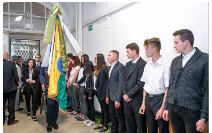
Az alsóbb évfolyamok sorfalat álltak a ballagóknak