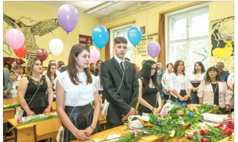
A végzősök virággal és lufikkal búcsúztak a középiskolai évektől

Nyomozást indított a BRFK, miután bejelentés érkezett az Oktatási Hivatalhoz, hogy egy internetes közösségi oldal zárt csoportjában a középszintű történelemérettségi feladatsorának esszétémáit a vizsga kezdete előtt közzétették. A hivatal ismeretlen tettes ellen feljelentést tett, ugyanakkor szerdán este bejelentették: nem kell újra vizsgáznunk a diákoknak.