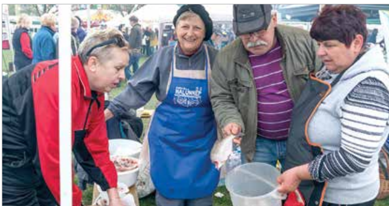
Nemcsak a palotavárosiak, de az egész város megszerette a Halünnepet

és az adományozásokkal járó sorban állás úgy veszem észre, szerencsére a lakókat sem zavarja.”