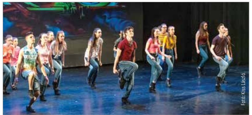
A születésnapos Megadance Táncegyüttes fergeteges estével ajándékozta meg a kortárs tánc barátait a Vörösmarty Színházban