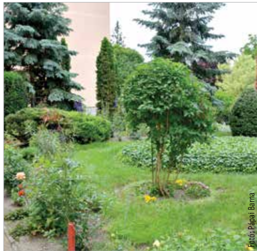
A második helyezett Fáy András-lakótelepi kert

A díjazottak június hetedikén, a kora esti órákban a Szent István Király Múzeum díszudvarán rendezett ünnepség keretében vehették át nyereményeiket és az elismerő okleveleket.