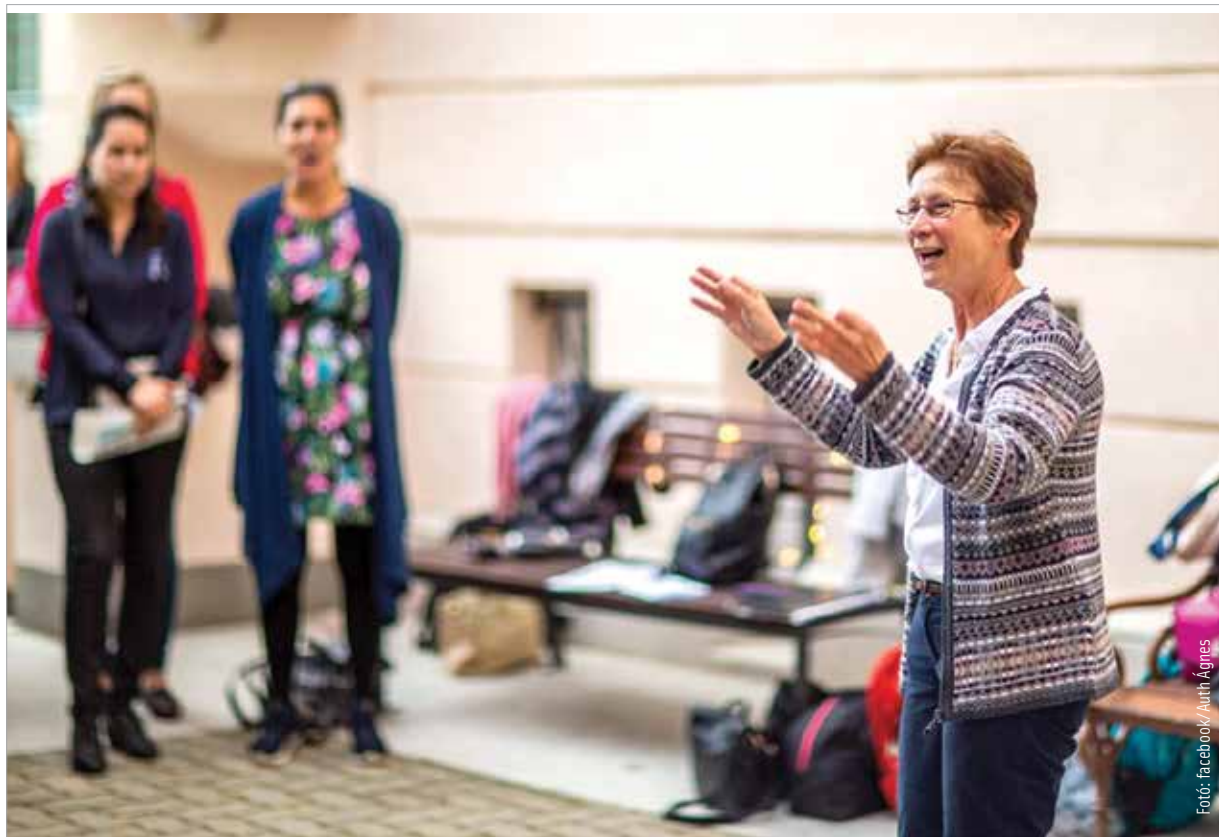
Ági nénitől a mostani és a régi tanítványai énekszóval búcsúztak

Abból indultam ki, amikor idekerültem a Telekibe, hogy okos, értelmes gyerekekről van szó,