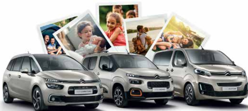
CITROËN GRAND C4 SPACETOURER