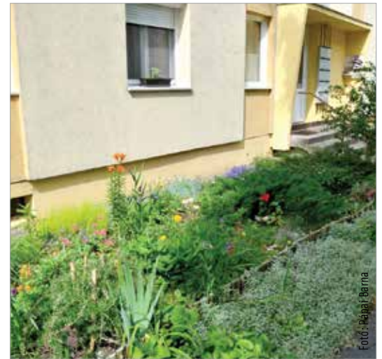
A másik harmadik helyezett a Szedreskerti lakónegyedben