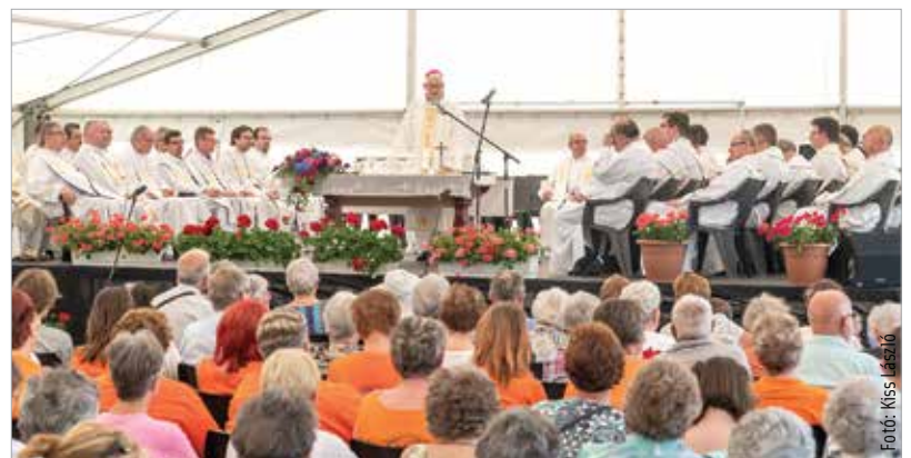
Az Egyházmegyei napon, a szentlélek kiadásának ünnepén Spányi Antal megyés püspök celebrálta a szentmisét