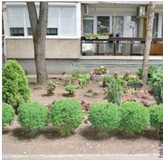
Az egyik harmadik helyezett a Fáy András-lakótelepen