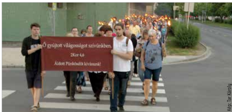
Fáklyák fénye és Istent dicsőítő énekek törték meg a belváros csendjét szombat este. Az evangélikus egyházközösség a baptista, a református és a katolikus hívekkel közösen fáklyás sétán egységben ünnepelte az anyaszentegyház születését.