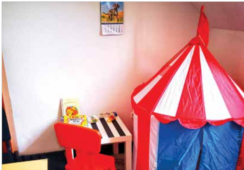
Új gyereksarok a Fehérvár Média centrum szerkesztőségében

Ha azonban a gyerek még kicsi a táborozáshoz, marad az óvodai ügyelet és a nagymama. Ötéves kor alatt a pedagógusok nem nagyon javasolják még a napközis tábor sem, a csemete számára ismeretlen felnőttek, gyerekek és adott