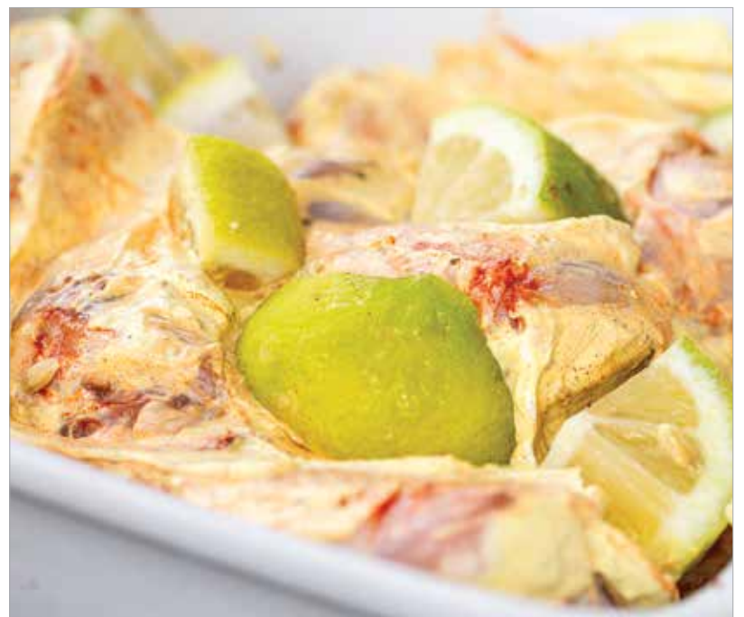
Minél többet pihen a hűtőben, annál jobban összeérnek az ízek

és teljesen átsütjük. Ez nagyjából húsz perc. Miután kivettük őket, hogy tökéletesek legyenek az ízek, alufólia alatt húsz percig pihentetjük. Néhány levél korianderrel, a raitával és – ha hozzájutunk vagy megsütjük magunk – naan kenyérral tálaljuk!