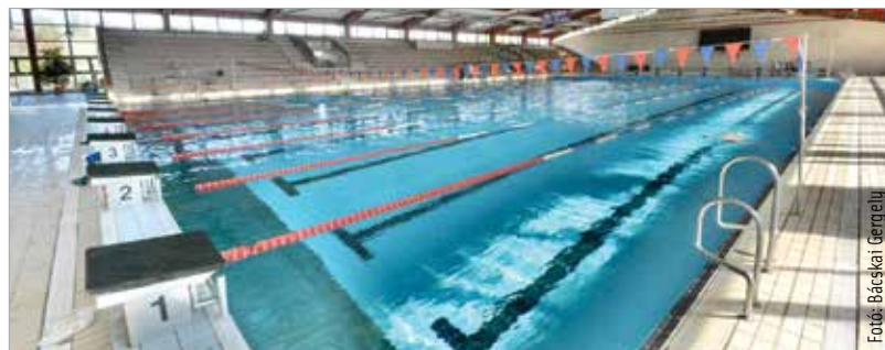
A mostanihoz hasonló nagymedence és egy kisebb tanmedence is szerepel a bővítési tervekben

Míg az uszoda nagy veszteséget termel – az üzemeltetési költségnek