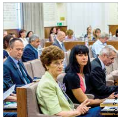
Intézményvezetői megbízásokról is döntöttek a képviselők

A közgyűlés oktatási programokról is döntött: létrehozzák a város első „okostanteremét” a Széna Téri Általános Iskolában, ennek kialakítása az Alba Innováron keresztül történik meg. Állami beruházásban valósul meg egy hasonló „okostanterem” a Széchenyi Szakgimnáziumban középiskolások számára. Az önkormányzat mindkét esetben összegyűjti majd a működési tapasztalatokat, hogy hosszabb távon minden iskolában meg lehessen valósítani ezeket az oktatásfejlesztési programokat. Az Alba Innováron mintegy negyvenmillió forintból felnőttképzés indul a digitális kompetenciák növelésére: „Fontos, hogy a munkavállalóink is tudjunk képzési lehetőséget kínálni. A cégekkel közösen