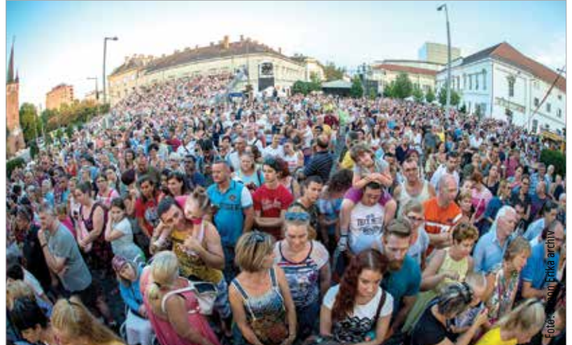
Tavaly is tömegeket vonzottak a programok

Idén is peregnek a dobok és zengnek a trombiták, harsonák és kürtök a belvárosban az augusztus 10-i Fehérvári Fúvósfesztiválon. A házigazda, a harmincéves Székesfehérvári Ifjúsági Fúvószenekar ezúttal a Várpalotai Bányász Fúvószenekart, a dunaujvárosi Pentele Bandet és a Martonvásári Fúvószenekart látja vendégül. A program a fehérváriak térzenéjével veszi kezdetét délután öt órakor