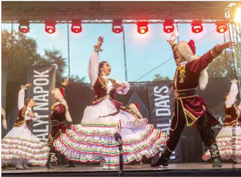
A Nemzetközi Néptáncfesztivált lassan negyed évszázada rendezik meg

17. és 19. között. Utóbbiban a Nemzeti Emlékhelyen IV. Béla koronázása elevenedik meg. A Királyi Napok keretén belül népesíti be a belvárost a VII. Fricsay Richárd Regionális Katonazenekari Fesztivál is augusztus 16-án Veszprém, Tata, Budapest és Székesfehérvár katonazenekaraival. Idén sem maradnak el a könnyűzenei koncertek a Zichy színpadon: augusztus 10-én a Budapest Bár, augusztus 17-én Rúza Magdi lép fel, a nyár lezárásaként pedig ugyanezen a színpadon köszönhetjük majd augusztus 29-én a Neoton Famíliát. Mindenről részletesen a kiralyinapok.szekesfehar.hu oldalon olvashatunk.