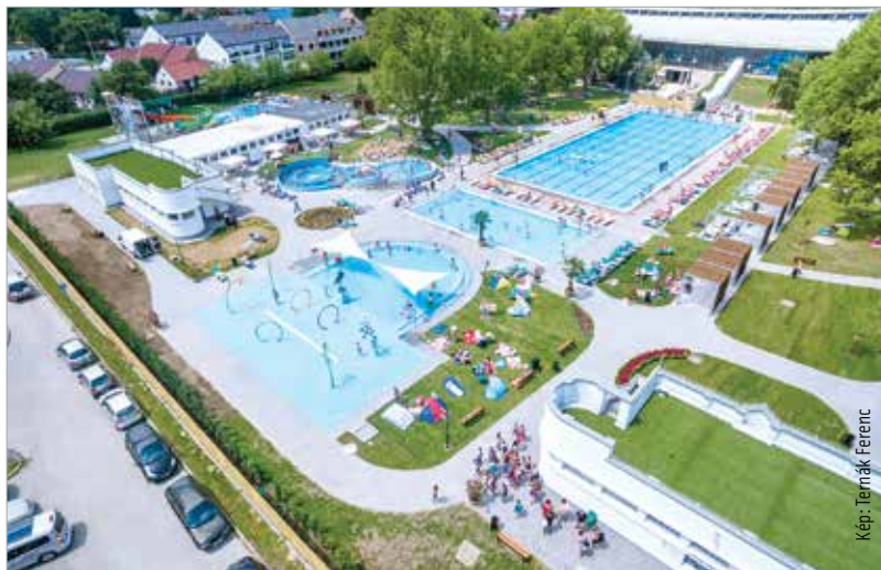
Az uszoda épületét a strand nagymedencéje melletti zöldterületen tudják növelni, megkétszerezve ezzel a most rendelkezésre álló vízfelületet