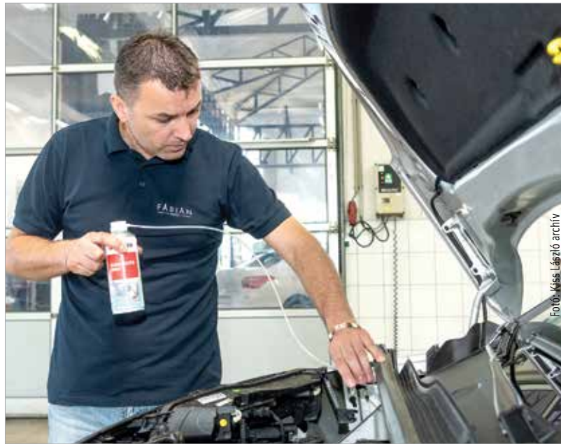
Fontos, hogy időben nézzessük át járművünket!

A klíma tisztítása évi rendszerességgel mindenképpen javasolt a pollenszűrő cseréjével egybekötve. „Itt oszlatnék el egy tévhitet, miszerint az eljárás után a légkondi hidegebbet fúj. A klíma tisztítása a légkondicionáló hatásfokára semmilyen hatással