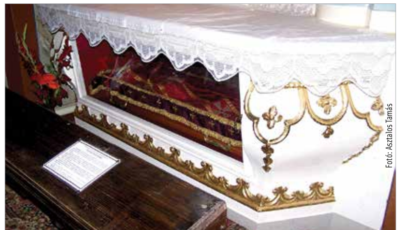
Romzsa Tódor ereklyéi az ungvári székesegyházban