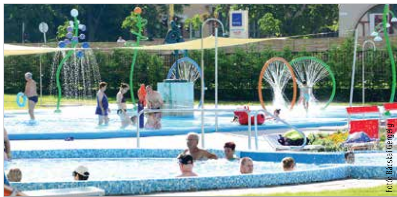
A városi strand minden generáció szórakozási igényeinek megfelel, de itt is várható még fejlesztés

csupán mintegy negyedét fedezi a jegybevétel – addig a strand nyereséget hoz: „Az uszoda és a strand alapvetően jóléti beruházása a városnak, így nem a profit a cél, de tény, hogy a nyereséget további fejlesztésekre lehet fordítani.” Terv az is, hogy ha az uszodabővítés megvalósul, a strand nagymedencéjét is élménymedencévé alakítják. Az elképzelés egy hullámmedence, tengerpartjellegű kiüléssel, ezzel a legnépszerűbb helyszínek zsúfoltsága csökkenne, miközben még több élményelem szolgálna a fehérváriak pihenését.