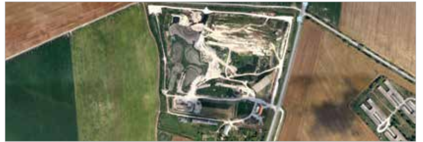
A vállalkozó Székesfehérvár önkormányzatához fordult, hogy bővíthesse telephelyét, az önkormányzat erre nemet mond

ményt adott ki: „Székesfehérvárnak nem érdeke, hogy máshonnan idehozott iszapot rakjanak le és hasznosítsanak, így ezt a tevékenységet az önkormányzat nem támogatja. Két kormányhivatal illetékes a Fehérvári Téglaiipari Kft. által végzett tevékenység engedélyezésében. Az engedélyt a Fejér Megyei Kormányhivatal adta ki – nem veszélyes hulladékok felhasználásával bányagödör-rekultivációra. A külföldről származó szennyvíziszap behozatalát pedig a Pest Megyei Kormányhivatal engedélyezte. A vállalkozó Székesfehérvár önkormányzatához fordult a Helyi Építési Szabályzat nagyarányú telephelybővítést engedélyező módosítására vonatkozó kéréssel. Az önkormányzat erre természetesen nemet mond.” – áll a közleményben. Szerkesztőségünk megkereste a két említett kormányhivatalt is, melyek tájékoztatást ígértek, de válasz lapzártánkig nem érkezett.