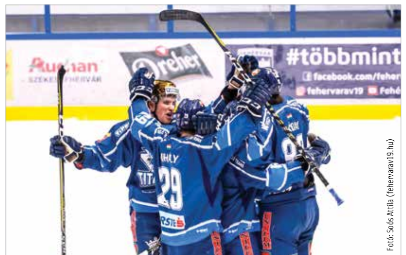
Ezután Győrben is hazai pályán ünnepelhetnek a Fehérvári Titánok hokisai

A hároméves megállapodás első ütemében a Fehérvári Titánok csapata legalább tizenkét hazai mérkőzését Győrben, a 2019-ben átadásra kerülő Nemak Jégcsarnokban rendezzi meg (ezekre indít majd szurkolói buszokat Fehérvárról a győri klub), majd a második évben a gárda összes hazai mérkőzésének helyszíné Győr lesz. Az együttműködés harmadik évére az együttes megjelenésében, megnevezésében is markánsan megjelenik a győri klub, emellett folyamatosan beépítik az erre szakmai értelemben alkalmas székesfehérvári és győri, saját nevelésű játékosokat is.