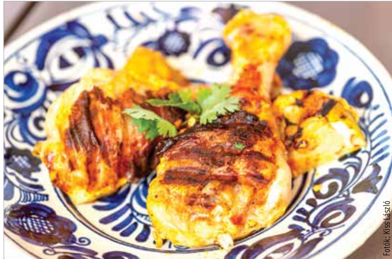
A joghurtos csirkét néhány friss korianderlevéllel tálaljuk

Barnás színű, általában csípős fűszerkeverék. Általában tesznek bele fahéjat, babérlevelet, római köményt, koriandert, kardamomot, borsot és szerecsendió-virágot, de létezik szexuális és fokhagymás változata is, ha csípős, akkor van benne valamilyen chili is. Az arányok családonként változnak. Ez a fűszerkeverék remekül illik zöldségekhez, például a cukkinihez és a padlizsánhoz.