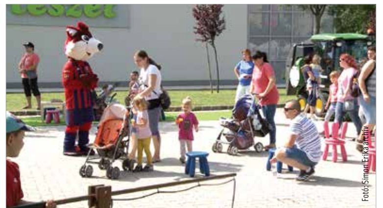
Az elmúlt esztendőben is ott volt a juniális a város apraja-nagyja

együttélés szabályait, ahol megismerik azokat a szervezeteket, akik értük dolgoznak a városban, akik a biztonságukat garantálják. Ezért is bővítettük ki ezt az ünnepet olyan szervezetek meghívásával, mint a katonaság, a rendőrség, a tűzoltóság és a mentők. Az a cél, hogy ezen a sűrűn lakott területen próbáljuk meg összehozni az embereket, hogy találkozzanak egymással és a gyerekeknek továbbadjuk hagyományainkat.” A bemutatók mellett néptáncműsor, játékos vetélkedők és bábelőadás színesíti a találkozót.