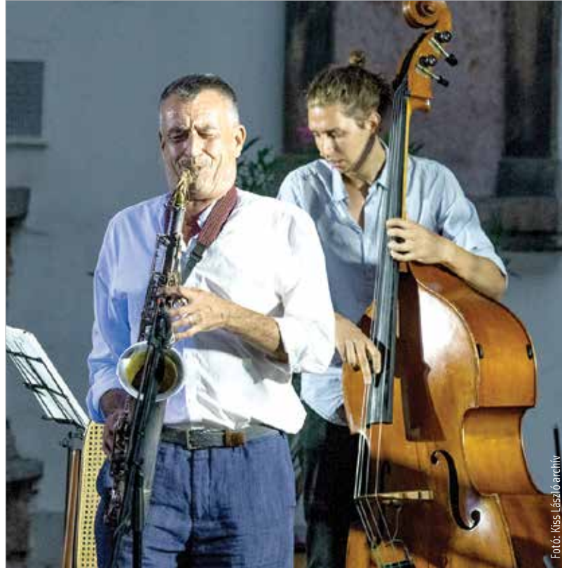
Alba Regia Feszt 2018-ban

Hagyományteremtő szándékkal rendezik meg első alkalommal július 26. és 28. között a Királyi Operettnapokat Székesfehérváron. A Feketehegy-szárazréti Közösség Központ szabadtéri színpadán a Királyi Operettgála, a Bob herceg valamint a Sybill operett látható és hallható majd. Az előadások előtt és után zenés-táncos műsorral, kabaréval ígérnek könnyed nyáresti szórakozást a szervezők. Az operettnapok felvezetőprogramjaként július második és harmadik hétvé-