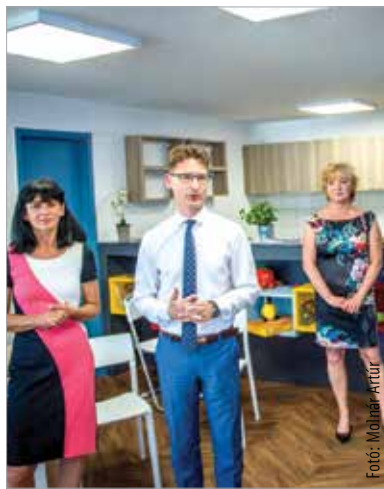
A közel húszmillió forintos fejlesztést Székesfehérvár önkormányzata saját forrásból valósította meg

Székesfehérvár önkormányzata saját forrásból vásárolta meg a (csalái) Fő utca 1/A. alatti ingatlant nyolc és fél millió forintért, továbbá a közösségi funkció kialakítása érdekében közel tízmillió forint értékű felújítást valósított meg. Az ingatlant a Szabadművelődés Háza