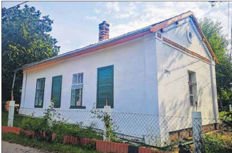
Az utcafronti változás látványos

részben vagy egészben eredeti funkciójában tartottak meg tulajdonosai, és akad olyan is, amelyik új feladatot kapott. Sajnos néhányukból évek múlva egészen biztosan csak sittkupa lesz, de szerencsére többségük most is présház feladatkörben, ékköként színesíti az utcaépet.