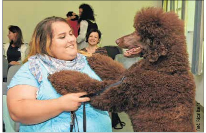
Derűs pillanat a Pata és Mancs Terápiás Egyesületnél