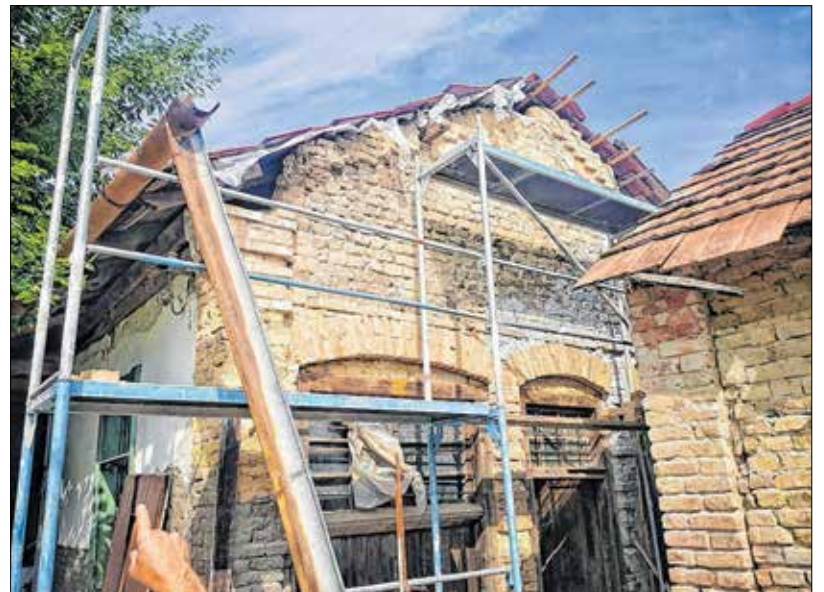
Még maradt bőven munka kint és bent is

És bár az elmúlt két évben tényleg óriási előrelépést tett a kőműves mester, azért rengeteg munka vár még rá, míg a Say család egykori nyaralója régi fényében tündökölhet.