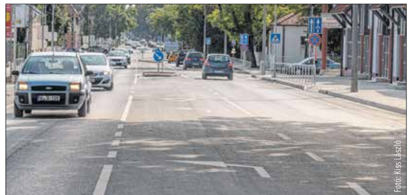
A megújult Berényi úton kanyarodó sávokat is kialakítottak