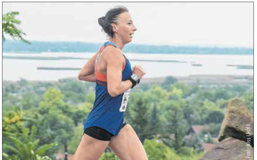
Látnivaló is lesz bőven a Bence-hegyi futáson