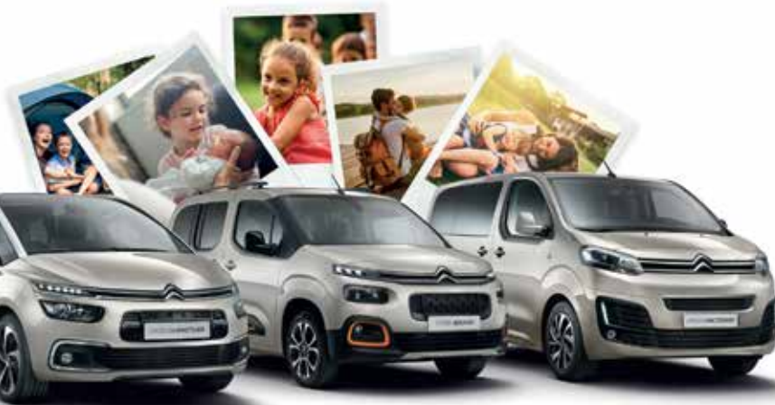
CITROËN GRAND C4 SPACETOURER