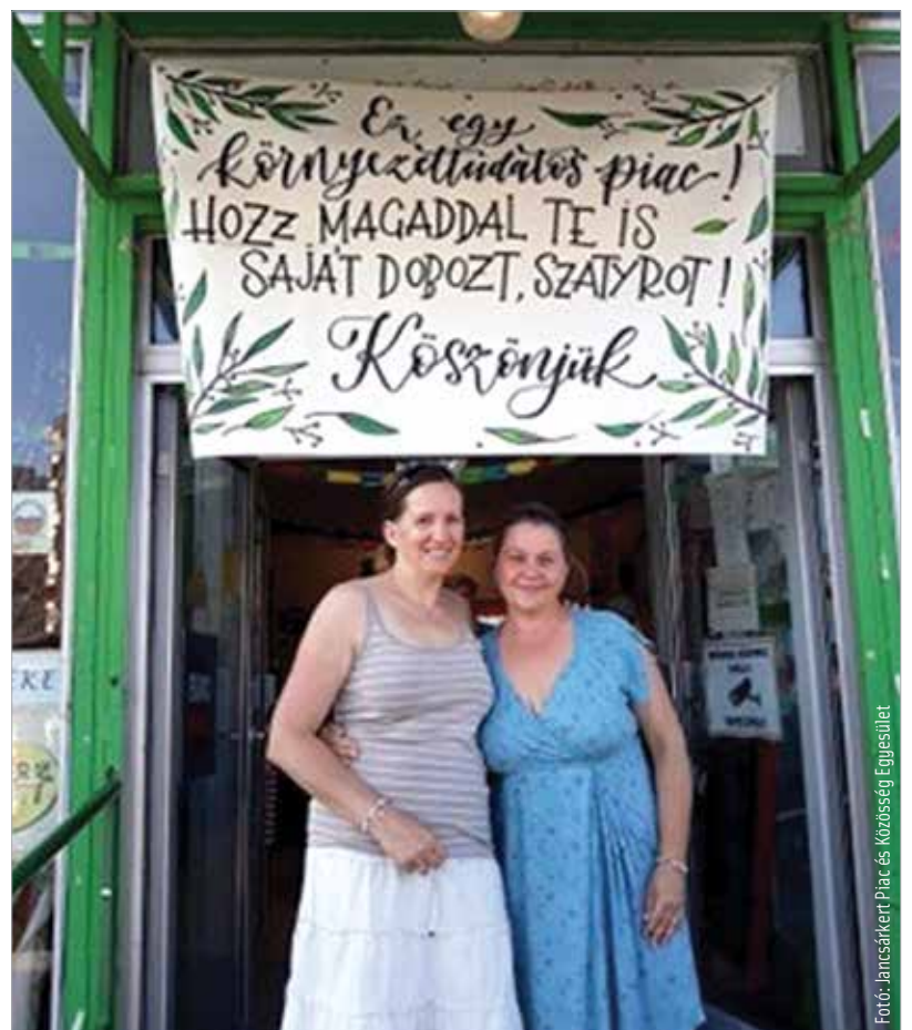
A Jancsárkertben nem csupán megengedik, hanem egyenesen kérik, hogy legyünk környezettudatosak

A Városi Piacon is pozitív volt a fogadtatás. „Már ezer éve, kedveském!” – jött a gyors válasz a kérdésemre, hogy otthonról hozott szatyorba is berakják-e a portékát. Sőt egy másik standnál áruoló hölgy még azt is hozzátette: kimondottan örül neki, ha saját zacskóval jön a vevő, mert akkor neki kevesebbet kell vennie. A Jancsárkertnél – lévén, hogy kézműves és termelői piac – nem volt kérdés, hogy mit szólnak a saját tárolóhoz: közösségi oldalukon ők kérik, hogy vigyünk saját szatyrot, dobozt a vásárláshoz.