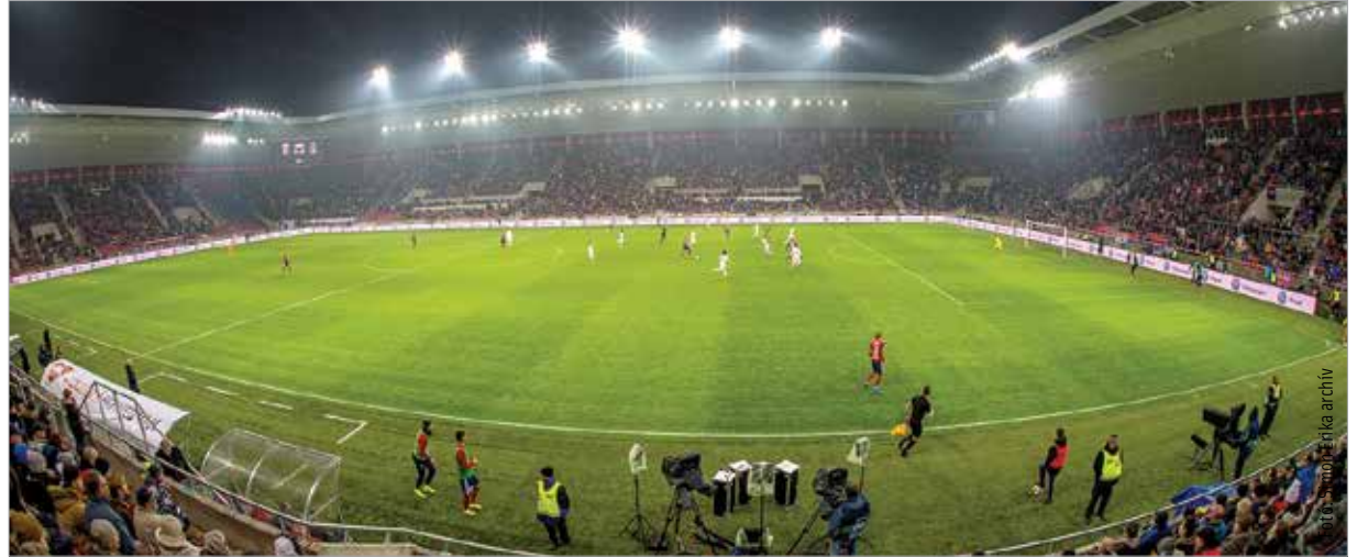
Jó lenne sok telt házas meccset látni a fehérvári stadionban!

Az új stadion építése alatt a Vidi mintegy három éven át a felcsúti Pancho Arénában illetve alkalmanként a Hidegkuti Stadionban és a Groupama Arénában játszotta hazai mérkőzéseit. 2018 végén, az Újpest elleni bajnoki keretében vehette birtokba új otthonát a csapat, és fél szezont át élvezhették a tényleges hazai pálya kényelmét. Idén júniusban aztán jött a hír: a stadion vízvezetékrendszerében megtelepedett baktérium miatt fertőzötté vált a víz a létesítmény egy részében, így nem lehetett meccseket rendezni. Az új szezont tehát megint Felcsúton kezdte a MOL Fehérvár, ahol két nemzetközi mérkőzést játszott: a Zeta elleni 0-0-s, továbbjutást érő döntetlent és a Vaduz elleni, Stopira korai góljával 1-0-ra megnyert odavágót egy héttel ezelőtt. Ennek visszavágója (amelyet lapunk megjelenése napján vív a Vidi a liechtensteini fővárosban) előtt érkezett a bejelentés, hogy ismét használatra alkalmas a sóstói aréna, ennek értelmében a hét-