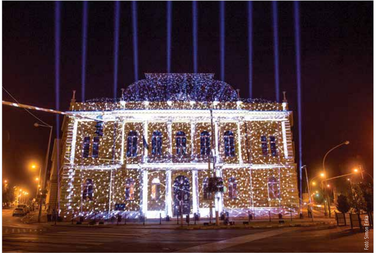
A tavalyi fehérvári produkció

Erről rengeteget tudnék mesélni. Vannak száraz statisztikai adataim: több mint negyven ország több mint hatvan városában volt vetítem, Braziliától Japánig. Nem is tudom, hogy csináltam végig. Az ausztrál projektem mérföldkö volt, mert a művészettörténet által jegyzett művészekkel (Bill Viola, Tony Oursler) szerepelhettem együtt az ottani fesztiválon. És természetesen mindegyik városhoz tartozik egy sztori. Vicces volt például, amikor felhívott a bankom, hogy biztosan én használom-e a bankkártyámat, mert ugyanazon a napon fizettem Budapesten, majd Párizsban és végül este Bejrútban. Emlékezetes volt az is, amikor annyira sűrű volt a programom, hogy az időeltolódást kiszámolva részt tudtam venni egy vetítésen New Yorkban, majd este Eindhovenben. Nem beszélve arról, amikor szervezési hibák miatt végül két projektem volt ugyanazon a napon, két különböző országban és ahhoz, hogy mindkét helyen ott legyek, kisrepülő kellett bérelnem. És hát az sem volt utolsó, amikor