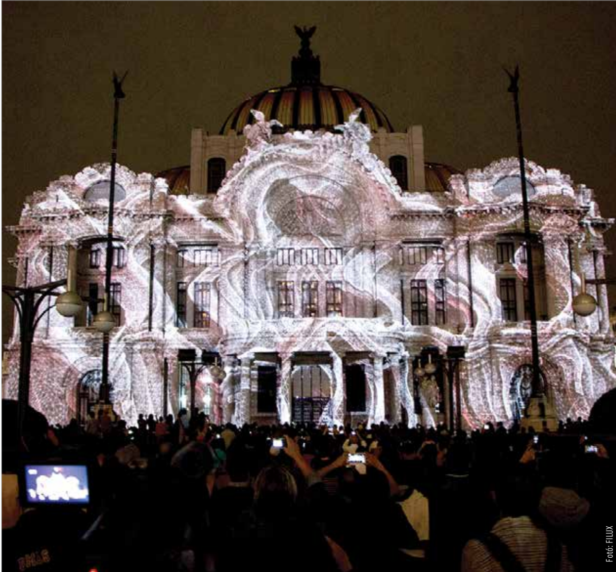
Mexikói vetítése különösen emlékezetes volt

Nagy tervek előtt állok. Egy projektorfejlesztésben is benne vagyok, és remélhetőleg még idén el tudok készülni egy felhővetítéssel Moholy-Nagy László emlékére, a Bauhaus századik évfordulója alkalmából. Jövőre pedig számos operaház foglalt le: a színházakban és főként az operákban egyre inkább jelen van a vetítés. És végezetül a sok nagyméretű vetítés mellett szoktam készíteni kisebb műtárgyakat is, ezeket egy egyéni kiállításon tervezem bemutatni.