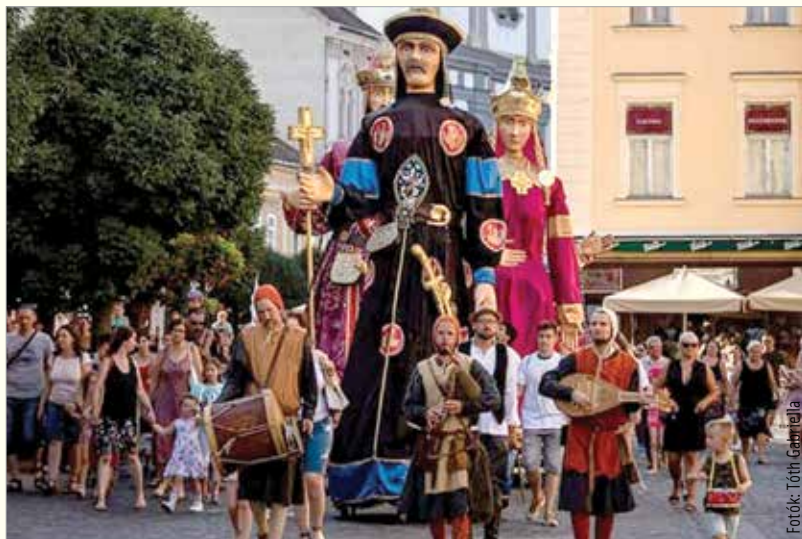
Egy fehérvári kisfiú minden fehérvári fellépésük alkalmával csatlakozik hozzájuk

Tetszik, hogy Székesfehérváron mindig van nyüzsgés, élet a belvárosban. Motiváló élmény ilyen környezetben játszani: a házak, az utcakövek, a templomok nagyon hangulatosak. Az akusztika is kiváló az épületek között. Különösen említésre méltó a szervezőkkel és a többi fellépővel kialakult jó kapcsolat. A Fehérvári Program-szervező Kft.-vel évek óta remekül működünk együtt, nagyon profi a szervezés és a kommunikáció a részükről. Van olyan esemény, ahol nem alakul ki szorosabb kapcsolat más fellépőkkel, de például itt, Fehérváron sok csapattal jó viszonyt ápolunk. A Szabad Színház társulatával nagyon jóban vagyunk, beépülünk a műsorukba, elvegyülünk a vásározkók között. Zenélünk vagy csak odaülünk kicsit, hogy javítsuk az utcaképet. Ez a városgyűjtőhelye a hozzánk közelebb álló előadóknak.