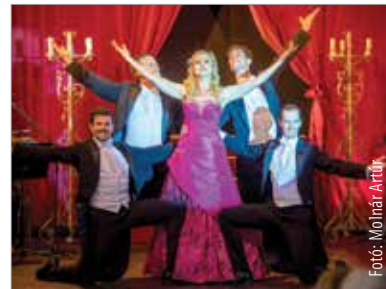
Primadonnák, bonvivánok, szubrettek – jövőre is visszatérő karakterek lesznek