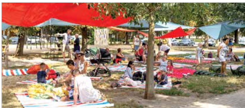
A Széna téri fák árnyékát kendőkkel egészítették ki

Fesztelen köztéri partit tartottak a Széna téren. Az első Pokrócpikniken minden korosztály megtalálhatta a megfelelő kikapcsolódást: a családi eseményen volt lehetőség sportolni, énekelni, táncolni, kézműveskedni és persze piknikezni is.