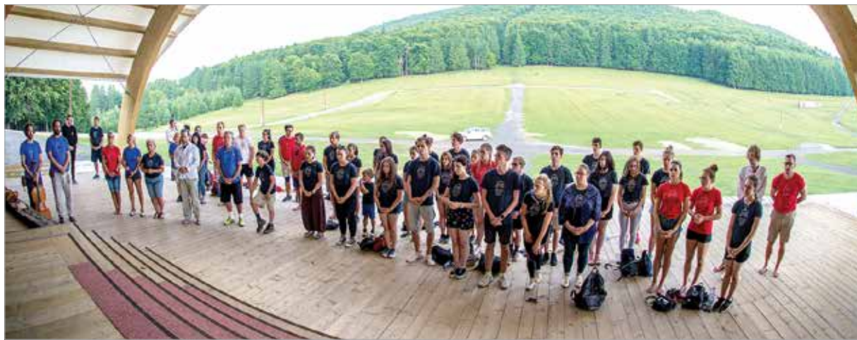
A fiatalok és a tábor szakmai vezetői szentmisén vettek részt a csíksomlyói Nyeregben