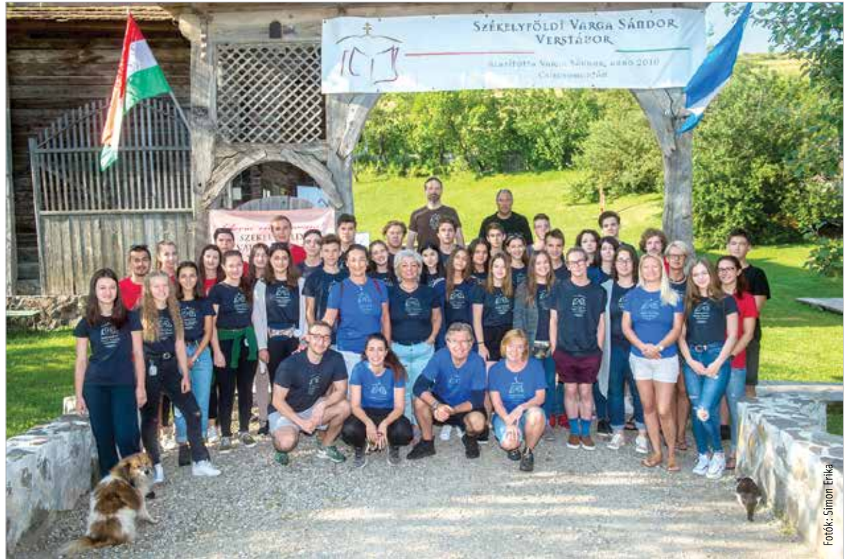
Az idei verstábor témája a szülőföld