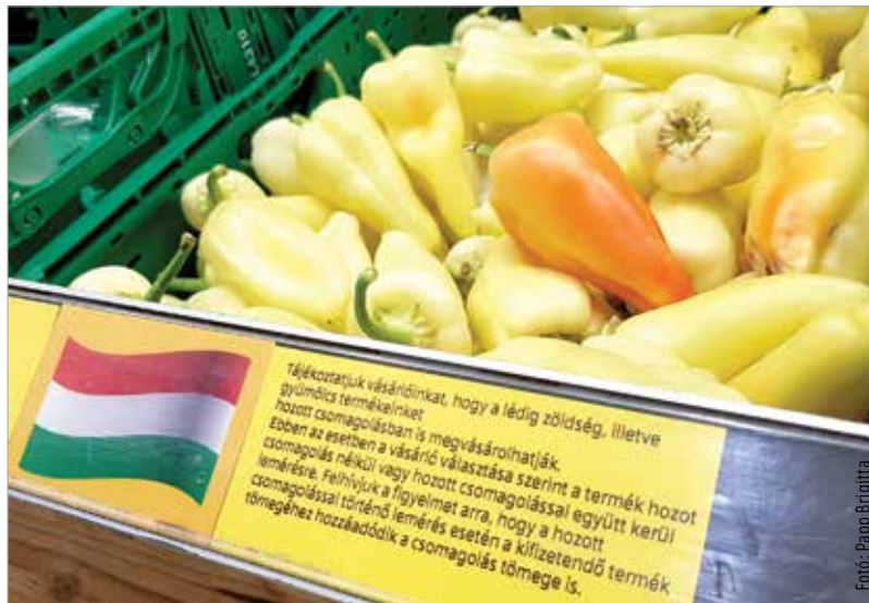
Van, ahol külön felhívják a figyelmet a saját szatyros lehetőségre

A honlapjukon van „Coop a környezetért” fülecske, ott azonban „csak” a használt étolaj gyűjtéséről, az energiahatékony fénnyforrásról, az energiatakarékos hűtőkről és a napenergia felhasználásáról kaptam információt. A fellelt központi számon több próbálkozás után sem jutottam emberig, a Coop Klub ügyfélszolgálatán elért hölgy pedig nem tudta a választ a kérdésemre, így maradt az úrlapos üzenetküldés. Leveletem szépen elküldtem, és rend-