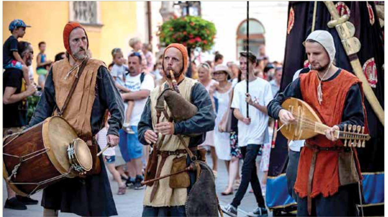
A Sub Rosa együttes Fehérvár belvárosában

Velem kezdődött, mert a középkori, azon belül kimondottan a 13. századi zene szerelmese vagyok. Régen egy szomszédom angol népzenei lemezein bukkantam rá néhány középkori dallamra, aztán amikor Angliában éltem, még jobban beleástam magam. Alapvetően tehát nem magyar hagyományörzéssel foglalkozunk. Magyarországon ebből a korból nem maradt fenn túl sok