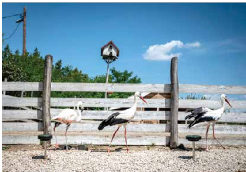
A Vadmadárkórház lakói számára igényük szerint alakítottak ki etető-itató helyeket, de a cikkünkben leírtak alapján otthon is készíthetünk madáritatót

Az itató kialakításnál több szempontot figyelembe kell venni: ne legyen túl mély a tál, mert abba belefulladhatnak a madarak. Ügyelni kell arra is hogy egyszerűen hozzáférjenek. Ugyanakkor könnyen más állatok áldozatává válhatnak a madarak, ezért az itatót fontos olyan helyre telepíteni, amelyhez a ragadozók nem férnek hozzá.