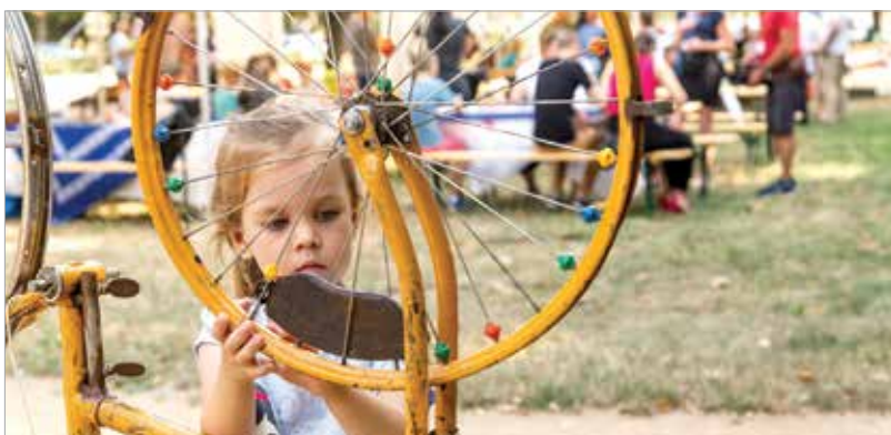
Különleges ügyességi játékokat próbálhattak ki a gyerekek