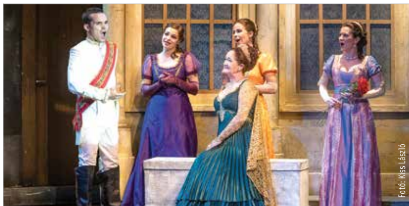
A klasszikus, komolyabb darabok is helyet kaptak a nyári gálaműsorban