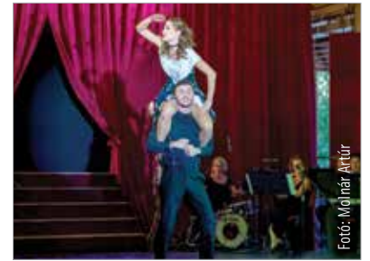
Látványos, szórakoztató, virtuóz – ezek a jelzők illettek leginkább a hétvégi operettgálára