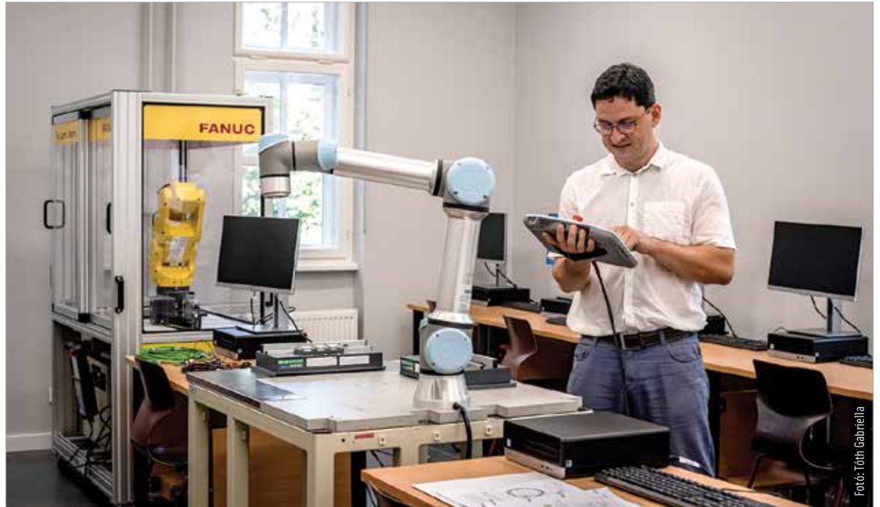
A fehérvári ipar meglehetősen heterogén, azaz sok lábon áll, mégis közös bennük, hogy a robotizáció egyre fontosabb szerepet tölt be a termelésben

„Szeretnénk tovább erősíteni az egyetemek súlyát és bővíteni a hallgatói létszámot. Ennek az eléréséhez a szakmai-tudományos tartalom infrastrukturális illetve a programok anyagi támogatásával nyújtunk segítséget, a hallgatók kezdeményezéseit is követve. Az itt tanuló hallgatók hitelesítik mindazt a törekvést, ami megvalósult, és értjük történelmi minden éppen folyó beruházás is: szól az ő jelenükről és jövőjükről, mely egyben ennek a régiónak, a városnak és az egyetemnek a jövőjét is jelenti. Hamarosan elkészül a Corvinus új épülete, az Óbudai Egyetemen pedig átadásra kerül a robotlabor.” – nyilatkozta lapunknak Cser-Pal-