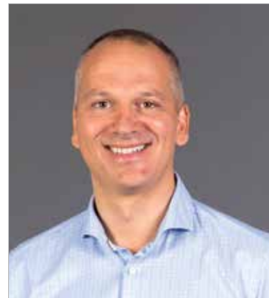
A Demokratikus Koalíció; Jobbik Magyarországért Mozgalom; Lehet Más a Politika; Mindenki Magyarországa Mozgalom; Momentum Mozgalom; Magyar Szocialista Párt; Párbeszéd Magyarországért Párt polgármesterjelöltje

Szeretem Székesfehérvárt és az itt élő embereket. Az a célom, hogy minden fehérvári jobban, egészségesebben és boldogabban élhessen. Ezért akarok Székesfehérvár polgármestere lenni. Sorsfordító választás előtt állunk! Két alternatíva közül választhatunk. Akik úgy gondolják, hogy minden rendben van Fehérváron és az országban, őket a Fidesz képviseli. Akik viszont minőségi közszolgáltatásokat szeretnének az egészségügy, a közlekedés és az oktatás területén, azoknak az erős ellenzéki egység, a közös jelöltek a jó választás! A fehérváriak életminőségét a közszolgáltatások radikális fejlesztésével tudjuk növelni. Egészségügyi Diagnosztikai Központot építünk, világszínvonalú diagnosztikai berendezésekkel felszerelve (CT, MR, lézeres mammográfia, ultrahangos képalkotó eszközök). Garantáljuk, hogy minden fehérvári állandó lakos szakorvosi beutaló alapján egy héten belül időpontot kap a neki javasolt diagnosztikai vizsgálatra, térítésmentesen. Megszüntetjük az életünket megkeserítő forgalmi dugókat, feloldjuk az indokolatlan sávszűkítéseket, megépítjük a hiányzó modern parkolási infrastruktúrákat, ésszerűsítjük a forgalomszervezést. Európai színvonalú buszközlekedést szervezünk és védett lakótelepi kerékpárgarázsokat építünk. A képzett, pályakezdő fiatal fehérváriak külföldre vándorlása súlyos probléma, ami azonnali