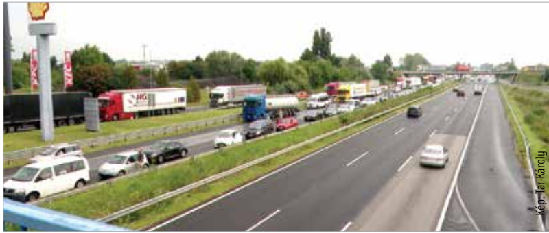
A délelőtti baleset után az autópályát lezárták, több mint tizenöt kilométeres dugó alakult ki. A forgalmat Fehérváron keresztül terelték el, ami késő délutánig megnehezítette a közlekedést a városban.

Vargha Tamás országgyűlési képviselő közösségi oldalán fejezte ki részvétét: „A magyar katonák fővárosa, Székesfehérvár emlékezni fog a mai nap áldozatára. Emlékét azzal az erővel és hecsülettel őrizzük, melyre egész Honvédségünk felelős. Részvételem nyilvánítom a fiatal katona családjának és a Magyar Honvédségnek!”