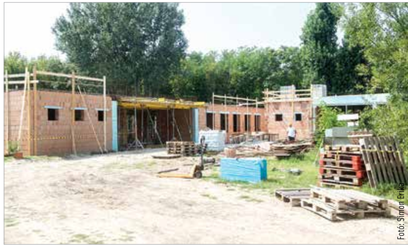
Jelenleg a szerkezetépítés befejező fázisa zajlik, várhatóan jövő februárban készül el az új épület és környezete

madarak is helyet kapnak, ahogy lehetőség lesz a veszélyeztetett fajok továbbtenyésztésére illetve a gyerekek és felnőttek természetvédelmi, természetismereti oktatására is. A helyszín különlegessége, hogy bárki betérhet majd, és akár a műtőben folyó munkába is bepillantást nyerhetünk – tudtuk meg Mészáros Attila alpolgármestertől, aki azt is elmondta, hogy a beruházás része az új közösségi központ megépítése is, mely Alsóváros, Sóstó és az Órhalmi szőlők lakóinak régi igénye volt.