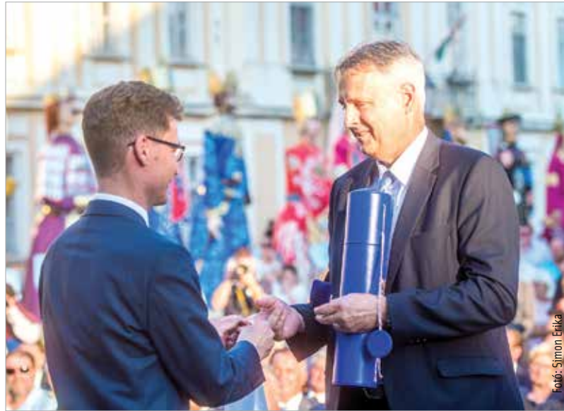
Hol legnagyobb a baj, legközelebb a segítség. A Fehérvár Travel Alapítvány sokat tesz a rászorulókéért.

A kilencvenes évek elején kezdődött meg az Ikarus hanyatlása. Természetes volt, hogy az ember másfelé is kikacsintott. Elkezdtem tanulni németül is, és egy újsághirdetésre jelentkeztem, ahol az IBUSZ keresett idegenvezetőket. A nyelvtudásom megvolt, emellett elvégeztem egy idegenvezetői tanfolyamot is. 1992-ben kaptam első idegenvezetői megbízást. Néhány éven keresztül másodállásban dolgoztam, a főállásom továbbra is a szoftverfejlesztői munka volt. A hétvégeken illetve a szabadság