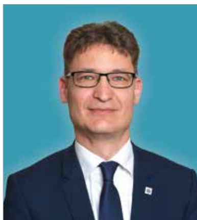
A Fidesz - Magyar Polgári Szövetség polgármesterjelöltje

Amikor gyerekkoromban Székesfehérvárt láttam a nyolcadik emeleti lakásunkból a Rákóczi úton, körvonalazódott bennem a kérdés: „Mitől különleges a város, ahol élek?” Hiszen a Királyok Városa jelzöt nem kaphatja meg akármilyen hely, az emberek ok nélkül nem lehetnek ilyen büszkék arra, ahol élnek. A válasz nem csak ezeréves történelmünkben vagy sikereinkben keresendő, ennél egyszerűbb, mégis sokkal több: Székesfehérvár az otthonunk. Amikor 2010-ben először kaptam bizalmat a fehérváriaktól, az otthonunk bajban volt. Székesfehérvárt az adósság, a munkanélküliség és a kiüresedés fenyegette. 2014-ig tartott, míg lendületbe hoztuk a várost: kormányzati segítséggel és fegyelmzett gazdálkodással ledolgoztuk a 18 milliárd forintos adósságot és megerősítettük a város költségvetését. A munkanélküliség megszűnt, immár alig van magyar település, mely közelebb lenne a teljes foglalkoztatáshoz, mint Székesfehérvár. Újra békés, biztonságos városra tettük az otthonunkat, hiszen negyedére szorítottuk vissza a bűnözést. Ezek az alapokon kezdhettük rendbe rakni Székesfehérvár útjait, közttereit, közműeit, hozhattunk létre játszótereket, parkokat. Am nem csak a gazdasági teljesítmény vagy az infrastruktúra teszi a várost. A város szíve a közösség. A közösség,