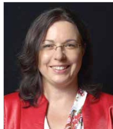
A Szövetségben Fehérvárért Egyesület polgármesterjelöltje

A Szövetségben Fehérvárért Egyesület polgármesterjelöltje vagyok. Az elmúlt 5 évben képviselőként, családügyi tanácsnokként mindig az volt a legfőbb kérdés számomra, hogy egy adott döntéssel mennyire szolgálom városunk hosszú távú fejlődését. Azért mérettetem meg magam az önkormányzati választáson, mert alternatívát kívánok nyújtani mindazok számára, akik sem a Fideszt, sem az alkalmi társulásként működő balliberális tömörülést nem szeretnék a város élén látni. Nem vagyok tagja, szimpatizánsa, aktivistája egyetlen pártnak sem. Ez nem jelenti, hogy szövetségesek nélkül indulok a választáson, hiszen civil szervezetek, szakmai csoportok és két országos párt a MIÉP és a Mi Hazánk Mozgalom támogatását is bírom. Van programom, amely részletesen tartalmazza a város jövőjével kapcsolatos elképzeléseimet. Itt ebből csak néhány részlet felvillantására van lehetőségem. Egészségügy: a háziorvosi rendszer megerősítése a célom, a fiatal orvosok bevonására mentor programot indítanék, alapvető diagnosztikai eszközöket szeretnék a háziorvosi rendelőkbe, ahol több orvos is használhatná azokat, tehermentesítve a kórházat néhány vizsgálat esetében. Példaként a legegyszerűbb eset: a háziorvosnál is lehetne vért venni, nem kellene a kórházban órákat várni. Mindehhez