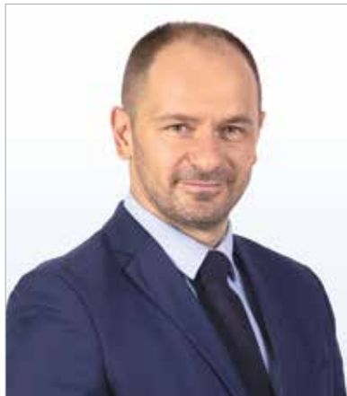
A VÁLASZ Független Civilek Fehérvárért Egyesület polgármesterjelöltje

Közülünk sokan hosszú évek óta civil szervezeteket vezetnek. Jól tudjuk mennyire fontosak a közösségek. A civil és kisebb sportegyesületek