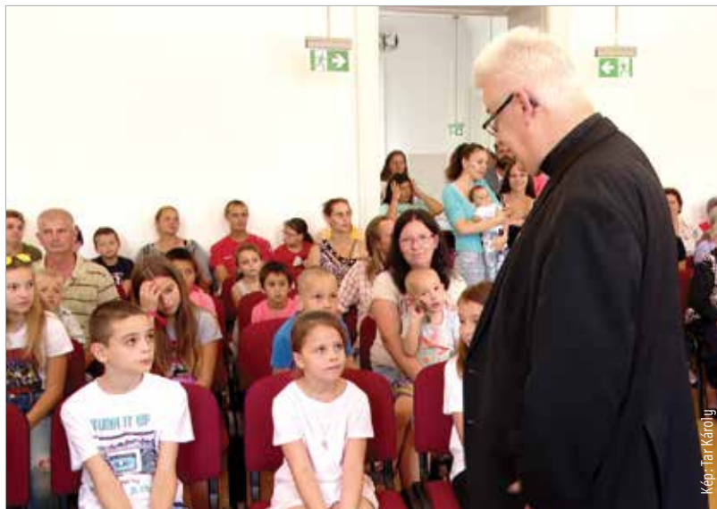
Az adományokat Spányi Antal megyés püspök adta át a családoknak

a határokon túl élő gyermekek is részesülnek majd a tanszerekből. Kőrösmezőn, Kárpátalján, az egyik legmesszebb lévő magyarok lakta területen harminchat diák kap majd a perkátaihoz hasonló tanszer- és iskolatáska-csomagot. A Katolikus Karitás akciójához szeptember 15-ig lehet még csatlakozni a 1356-os adományvonalon keresztül – ez hívásonként ötszáz forintos támogatást jelent – vagy akár közvetlen átutalással is segítheti bárki a legrászorultabbak tanévkezdését. Bővebb információ a gyűjtésről a Katolikus Karitás weboldalán található.