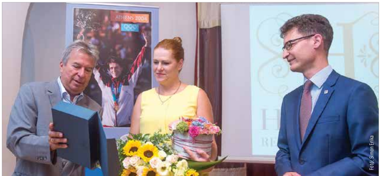
A klubelnök, az ünnepelt és a polgármester, hátul pedig egy tizenöt éves fotó

„Már tudtam, mire számítsak egy olimpián, tanultam azokból a hibákból, amik 2000-ben rossz irányba vittek. Úgy voltam vele: most vagy soha! A lövészetel versenyben maradtam, és mindegyik számra igaz volt, hogy hoztam, ami joggal elvárható volt tőlem. A riválisok ellenben hibáztak, így lényegében egyedül maradtam a végén a futópályán. A lovaglás után már tudtam, hogy a dobogó biztos, amikor pedig kiderült, mekkora előnyöm van, azt is tudtam, ha ki nem töröm a bokám, megvan az aranyérem!” – idézte fel legnagyobb sikerét a jubileumi fogadáson.