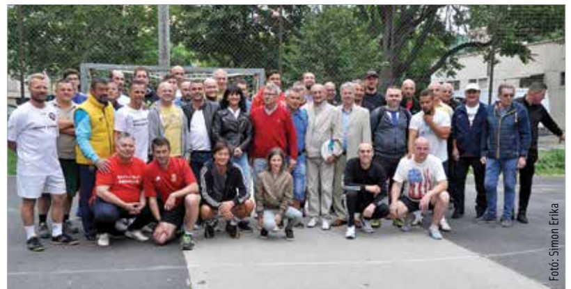
Együtt egymásért – barátokkal a hagyományos „Mancz-focin”

Székesfehérvár Megyei Jogú Város Önkormányzat Közgyűlésének Gazdasági Szakbizottsága