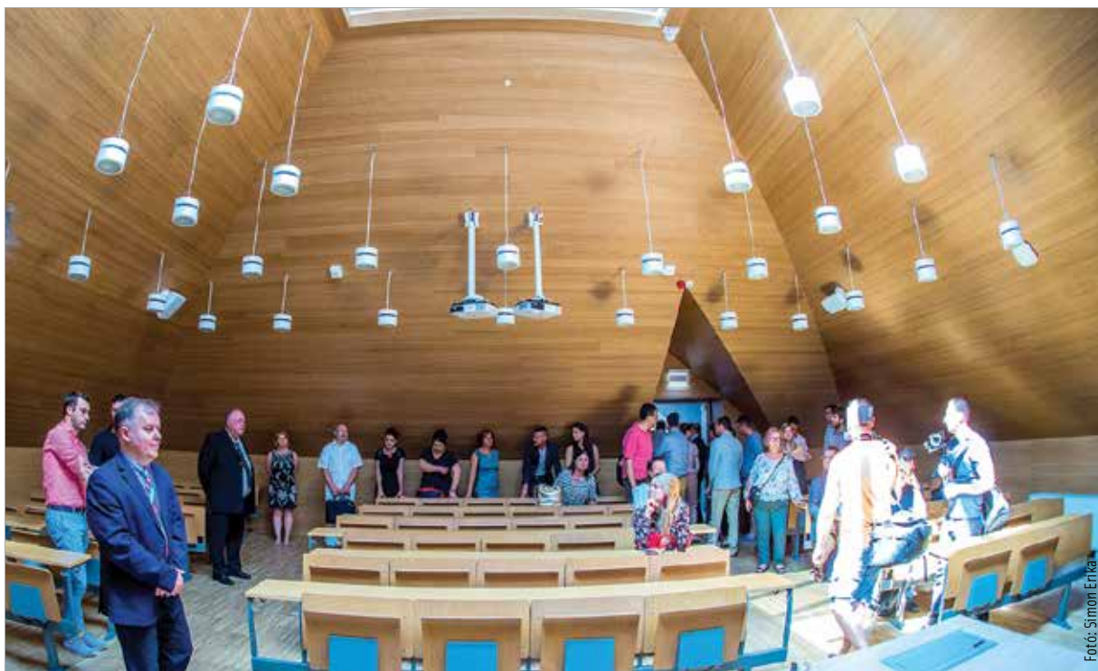
A Corvinuson azt szeretnék, hogy a campus szerves, élő egységként kapcsolódjon be a város életébe

A partnerség egyik fontos lépéseként augusztus végén együttműködési megállapodást írt alá az önkormányzat, a Prosperis Alba Kutatóközpont Kft. és az Óbudai Egyetem, melyben közös célként határozták meg, hogy a jövőben olyan kutatások valósuljanak meg, amelyek hozzájárulnak Székesfehérvár fenntartható fejlődéséhez. Kovács Levente, az Óbudai Egyetem rektora kiemelte, hogy a város támogatásával egy robottechnikai központot hoztak létre Székesfehérváron, amely korszerű robotokkal és az elvárt eszközparkkal van felszerelve: „Már a beruházás előtt is az volt a közös kiindulópont, hogy úgy újuljon meg az Alba Regia Műszaki Karunk, hogy az a mai digitalizációs trendeknek megfelelő laborral, lehetőségekkel várja a hallgatókat. Egy olyan jellegű együttműködési megállapodás előkészítésében indultunk el, amely a város oldaláról kérné fel az egyetemet, hogy a településen milyen, a jelenlegi technológiai vívmányoknak megfelelő fejlesztések jöhetnek létre. Másik oldalról pedig, ha ezek az