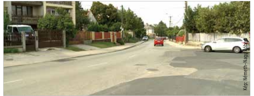
Most még elsőbbséget élvez, aki a Zsolnai vagy a Pozsonyi út felől érkezik a kereszteződésbe

A járdaszakaszcsoz felújításának határideje szeptember kilencedike, így az ideiglenes körforgalom kialakítására várhatóan a kilencedikét követő héten kerül sor.