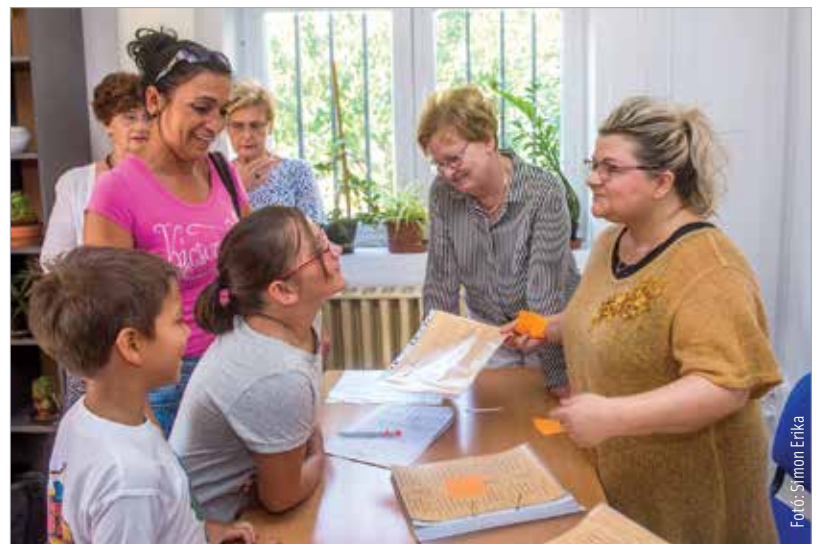
A támogatás a legjobbkor érkezett a rászoruló családoknak