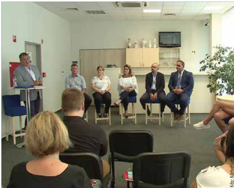
Tájékoztatót tartottak a programról

modellnek. Esetünkben a kosárlabdáról és a kézilabdáról van szó. A program ovis és kisiskolás korban az ügyességfejlesztésre fókuszál, szakképzett edzők tartanak órát a gyerekeknek. Középiskolában már a tehetségek vehetnek részt plusz edzéseken. Az egyetemen pedig már a profi korosztályban sportoló fiatalok rugalmasabb „beosztást” kapnak, valamint a vizsgaidőszakokban ráadás-toleranciát. Jelenleg tizenegy általános iskola, négy középiskola és két egyetem részese a programnak.