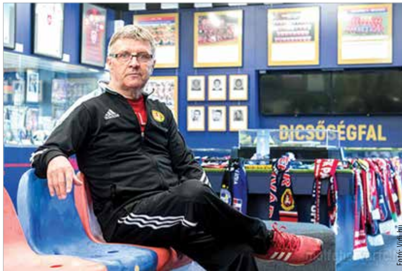
Méltó helyen, a dicsőséggal előtt

Aztán jött a fiatalemberek akkori sorsa, megjött a behívód, mégpedig az ország legjobb katonacsapatához.