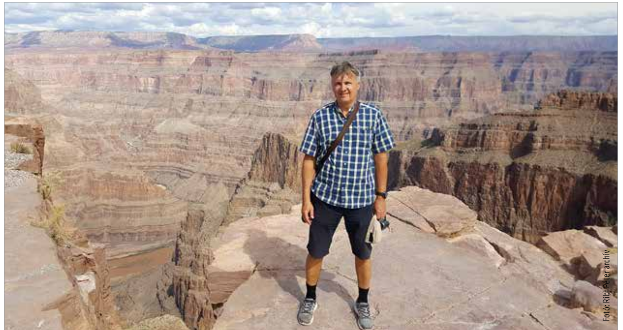
Fehérvárról a Grand Canyon is elérhető!

Nagy meglepetés volt számomra, nagy megtiszteltetés, hogy ebben a városban, ahol születtem, ahol iskolá-