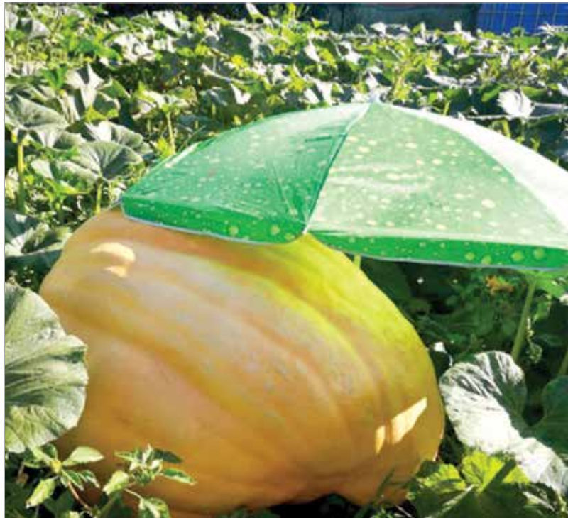
Panka és napernyője

világ legjobb óriásnövény-termesztői között tartásuk számon. Utóbbira szerinte néhány éven belül esélye is lehet: „Az elmúlt években leginkább tapasztalatot gyűjtöttem, de legkésőbb két év múlva már ötszáz kilós vagy nagyobb tököt szeretnék növesztetni. Ezzel felkerülnék végre a világranglistára is!”