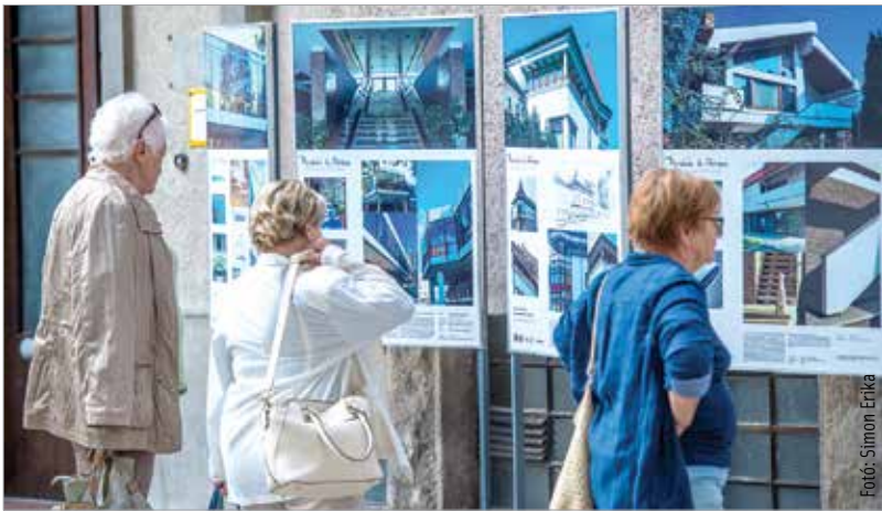
A Pordán Horváth Ferenc által tervezett épületek kiállták az idők próbáját

kenységét: „Pordán Horváth Ferencre érdemes emlékezni, mert nagyon szerény ember volt, és egy kicsit az utókor emlékezete is szerény. Ezt szeretnénk áttörni! Talán a legfontosabb, amit építészetéről mondhatunk, hogy azok az épületek, amelyek jellemzőek rá, amelyekről köztudott, hogy ő tervezte – akár a Brunszvik óvoda, akár a Béke téri iskola bővítménye – bármennyire is hihetetlen, hatvanéves épületek! Hatvan évvel ezelőtt felépíteni valamit úgy, hogy ezek két emberöltőnyi idő után is modernnek, frissnek, örökérvényűnek hassanak, a tehetség és a jó ízlés mértékadó, tanulságos példája a ma építészeti számára is.”