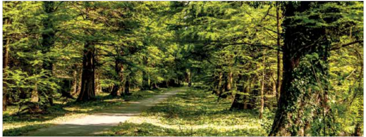
Az erdő megvéd és energiával tölt fel

Ha a Székesfehérvártól mintegy másfél órányira található Hévíz felé vesszük az irányt, az imént felsorolt élmények mindegyikét megtalálhatjuk. Nemcsak a világhírű termálfürdő, hanem a tavat körülvevő természeti környezet is hívogató. A tavat egy úgynevezett véderdő veszi körül, melynek nevéhez hűen védelmi funkciója van: a levegőben terjedő szennyeződésektől és zajtól valamint a szélétől, a kihűléstől is