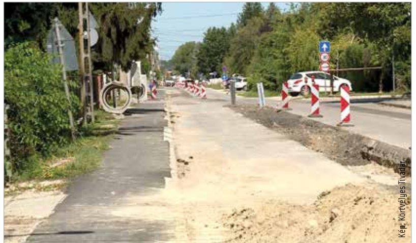
Sávlezárás a Fiskális úton: megéri türelmesnek lenni, hiszen korszerűbb lesz az út és kerékpársávot is kialakítanak