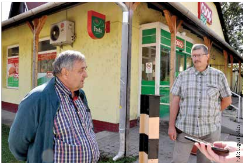
A városrész lakossága hatezer fő, ennyi embernek kicsi a posta mai helyisége