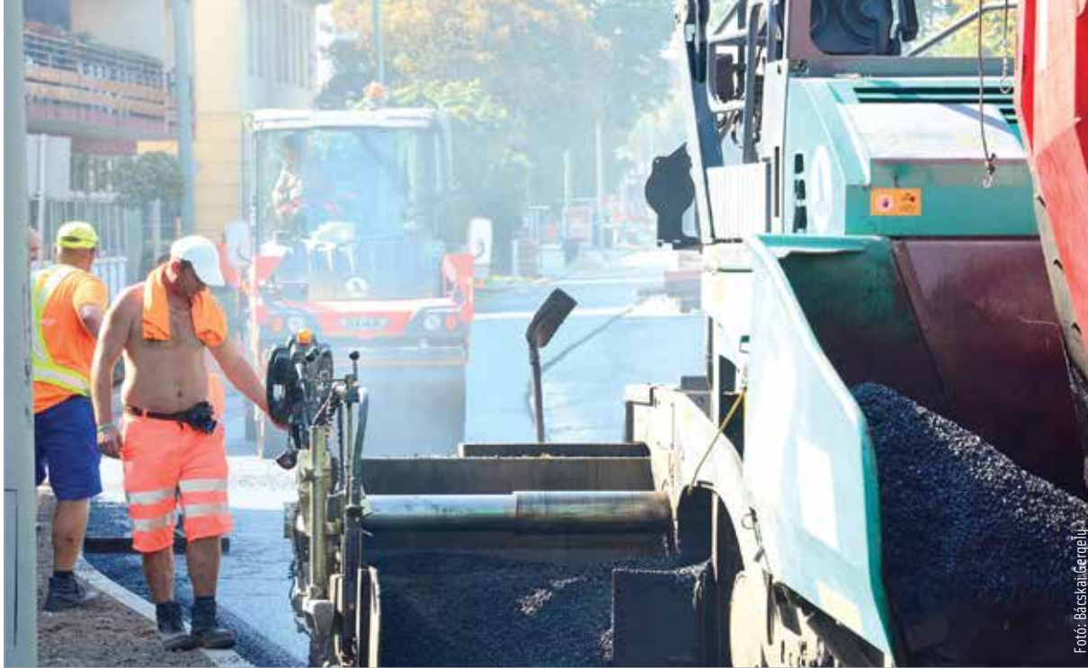
Az álláskeresőknél a férfiak futnak neki magabiztosabban

cég meg fog szűnni, 27 százalékuk pedig úgy gondolja, hogy nincs elég szakember illetve a cég nem találja meg a megfelelő kollégákat. Közel egyharmaduk (29 százalék) azt jósolja, hogy nagy eséllyel leépítés várható, amelynek során töle is megválnak.