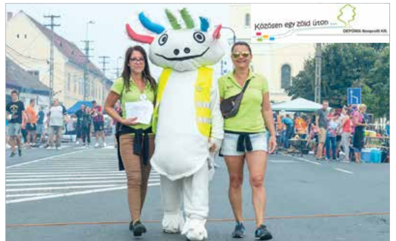
Gyűjti és csapata a Lecsófőző Vigasságon is jelen lesz

tájékoztatóval, mely leírja, hogy mi az, amit a sárga zsákba lehet helyezni. A Depónia kabalája, Gyűjti napközben többször is körbejár a rendezvényen és megnézi, melyik csapat miként gyűjt. Az a csapat, amelyik jól végzi a szelektálást, „Ön jól Gyűjti!” matricát kap. A látogatás alkalmával a résztvevők beszélgethetnek, feltehetik kérdéseiket a szelektív gyűjtésről, Gyűjti és csapata szívesen válaszol.