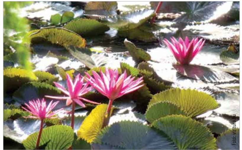
Több mint kétszáz éve pompáznak a tündérrózsák a tavon

óvja a tavat. Az erdő telepítése I. Festetics Györgynek köszönhető, ő csapoltatta le a tavat körülvevő mocsarat és lehelte életet az első erdősávba. Ma már több mint kétszáz éves platánokban gyönyörködhetnek az erre járók, és számos más őshonos faj mellett olyan különlegességekben, mint a mocsári ciprusok. A 2010-ben átadott Berkli tanösvényt bejárva megismerhetjük a tavat, az azt körülvevő láprétet, a berek növény és állatvilágát.