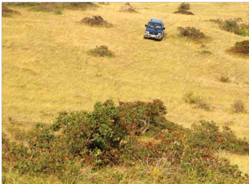
Jól teljesített az eddigi teszteken az autó, már csak néhány apróbb módosítást terveznek

A Budapest–Bamako a kezdetek óta jótékonyági célt is szolgál, minden csapat adományokkal felszerelve érkezik. Erre is készülnek a fehérváriak, hiszen szeretnének részesei lenni a karitatív eseménynek.