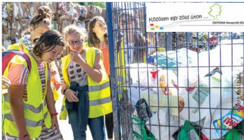
A hulladéklerakó telepen rácsodálkozhattak a fiatalok a nagymennyiségű hulladékra

a Depóniánál. Legutóbb óvodások és kisiskolások érkeztek a hulladéktelepre, ezúttal pedig felső tagozatosok valamint középiskolások voltak a vendégek.