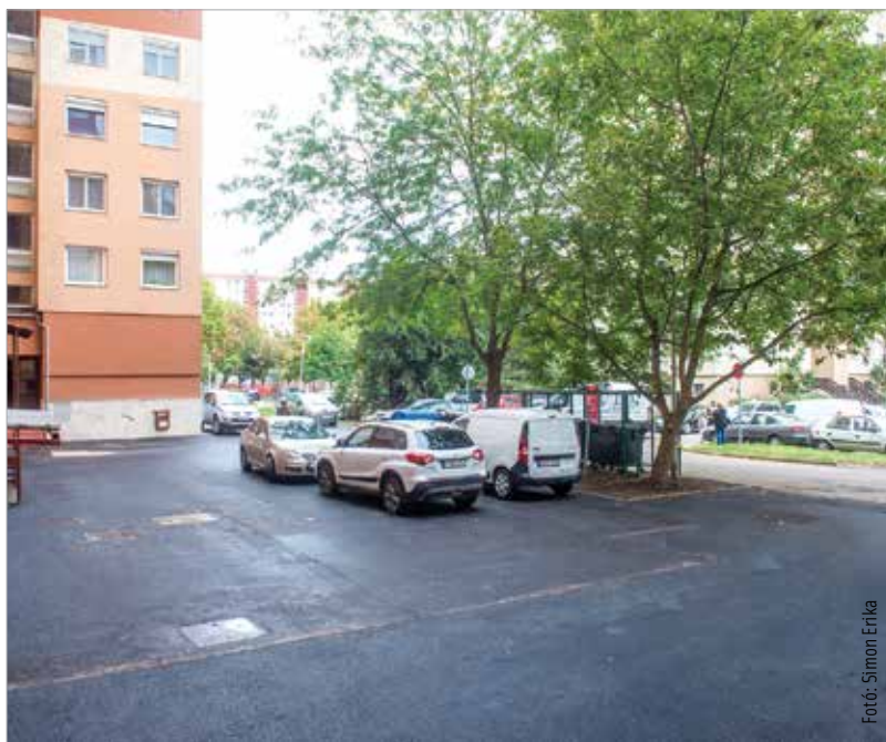
A beruházás tízmillió forintba került