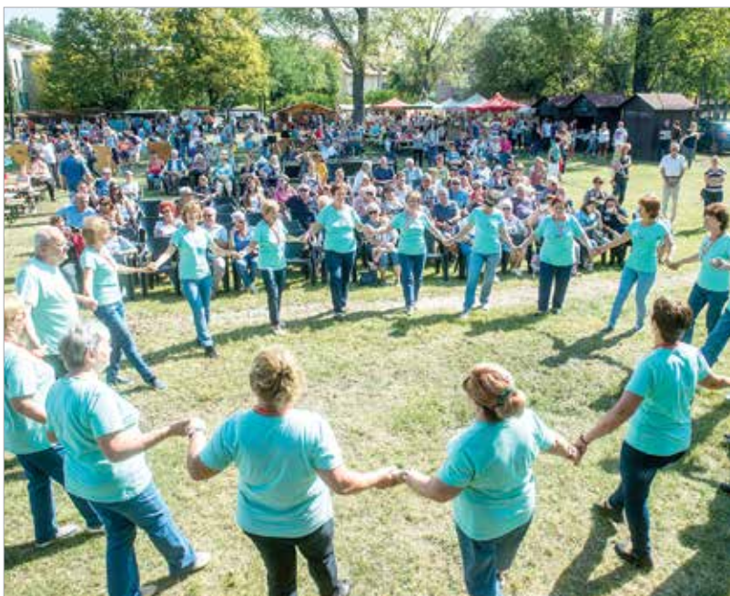
A senior csoport tánca is fokozta a jókedvet