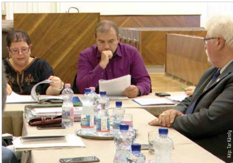
A Helyi Választási Bizottság a benyújtott képviselőjelölti és polgármesterjelölti adatok hitelességét is vizsgálta