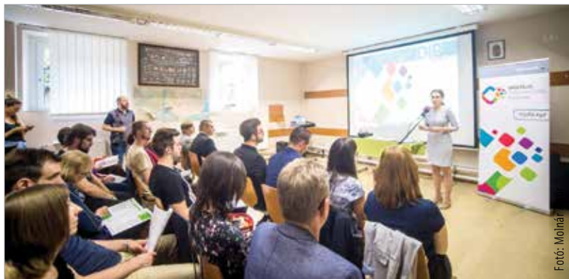
A fiatalok fele egy napig bírja okoseszköz és internet nélkül

A munkálatok befejezését követően az üzletek könnyebb megközelíthetősége érdekében a bejáratok elé várakozni tilos jelzést festenek fel illetve mozgáskorlátozottak számára parkolókat alakítanak ki.