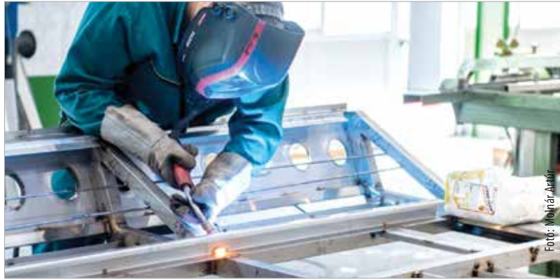
A feldolgozóipar folyamatosan várja a munkaerőt

Bár tizenkét hónap alatt közel hat-ezren helyezkedtek el a feldolgozóiparban – ahova a kulcsfontosságú autógyárak és egyéb, az ágazathoz köthető beszállítók is tartoznak – évek óta itt a legmagasabb az üres álláshelyek száma. Arányait tekintve látható, hogy mennyire magas: 2019 elején 18 640 betöltetlen álláshelyet regisztrált a Központi Statisztikai Hivatal a feldolgozóiparban, míg a második legtöbb dolgozót váró humán-egészségügyi és szociális ellátás területén feleannyi, vagyis 9382 betöltetlen álláshely volt országwide. Ám míg az előbbi területen valamelyest csökkent a munkaerőhiány, addig az utóbbin nőtt: egy éve ugyanis 7811-en hiányoztak a pályáról. A KSH adatai alapján csökkent viszont