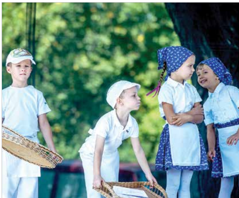
A maroshegyi ovisok nagy sikert arattak

A színpadon a művészcsoportok mellett felléptek az óvodások és az iskolások is. A nap meghívott vendégművésze Polyák Lilla volt, zárásként pedig az LGT-emlékzenekar élő koncertjén nosztalgizhattak a résztvevők.