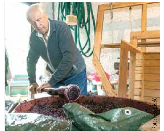
Már kádban a szőlő!

A valamikori szőlőskertek akkor váltak építési telekké, amikor Székesfehérvár lakossága a gazdasági fellendülésnek, a gyárak idetelepülésének köszönhetően megkétszereződött. Sokféle ember sokfelől költözött ide, s bár van iskola, óvoda, posta, kultúrház, meg kell találni azt az alapot, amire közösséget lehet építeni.