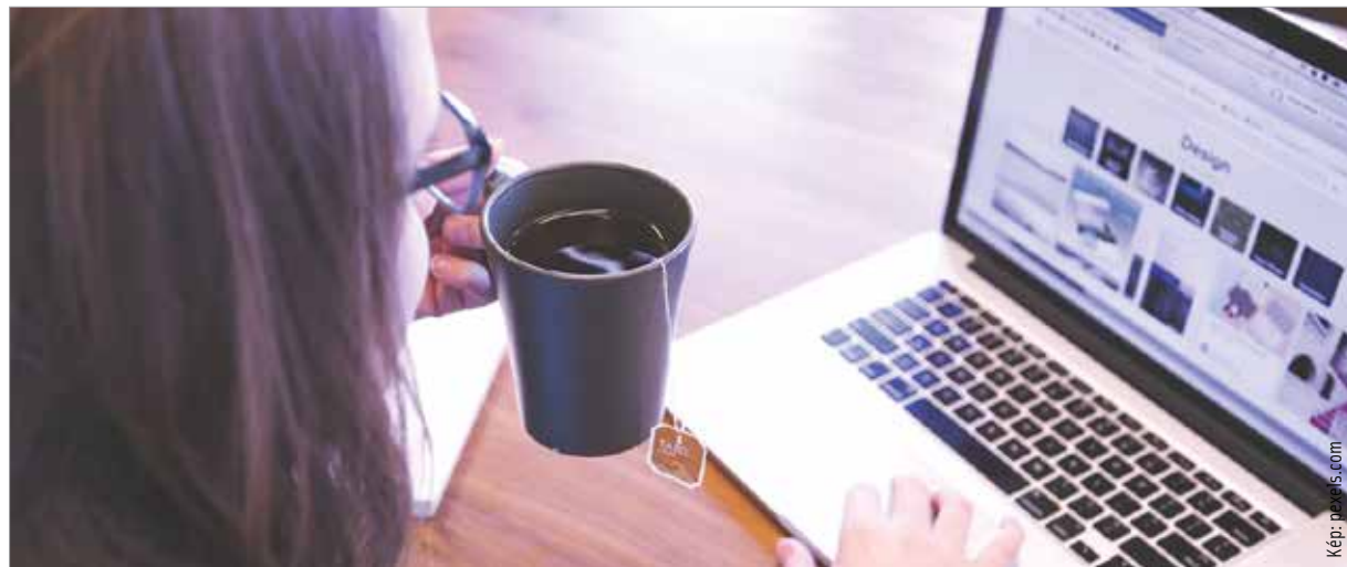
Az otthoni munkához önfegyelemre van szükség

Az otthoni munkavégzéssel a munkáltató is jól járhat. Főleg akkor, ha a munkavállaló vagy gyermeke éppen annyira beteg, hogy már nem tanácsos közösségbe menniük. Az alkalmazott ilyenkor otthonról tud dolgozni. Nem kell senkinek sem helyettesítenie, és a határidőkkel sem csúszik el. Ugyanakkor a home office-hoz önfegyelemre és precíz munkabeosztásra van szükség: reggel neki kell állni, és este tudni kell abbahagyni a munkát! Akik számára ez nehézséget okoz, azok-