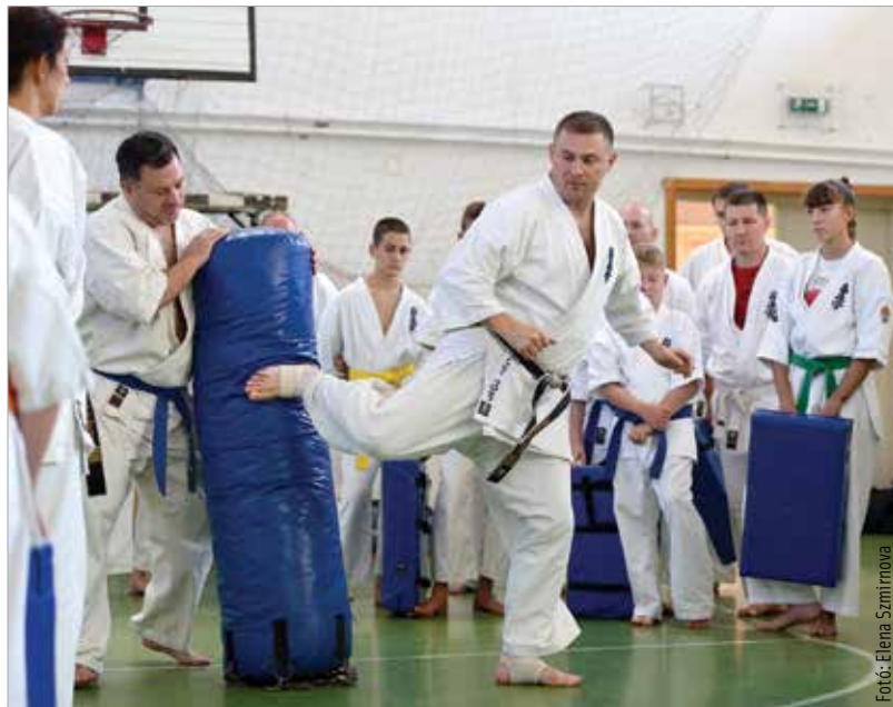
Gorohov mester nem csak magyarázott, minden gyakorlatot be is mutatott

érzés látni ezt a fejlődést. Akár tegnapról mára: amit tegnap mutattam nekik, ma már viszontlátom az edzésen. Mi mind egy különleges nyelvet beszélünk: a karate nyelvén bármit át tudunk adni egymásnak. Ebben a pár napban is nagyokat lépnek előre a tanítványaink. Igen, ilyenkor az én tanítványaim is!” A Fehérvár Karateakadémiánál bíznak benne, hogy nem utoljára járt náluk Alekszej Gorohov, hiszen ezúttal is sokat tanultak a kyoukushin egyik legtapasztaltabb mesterétől.