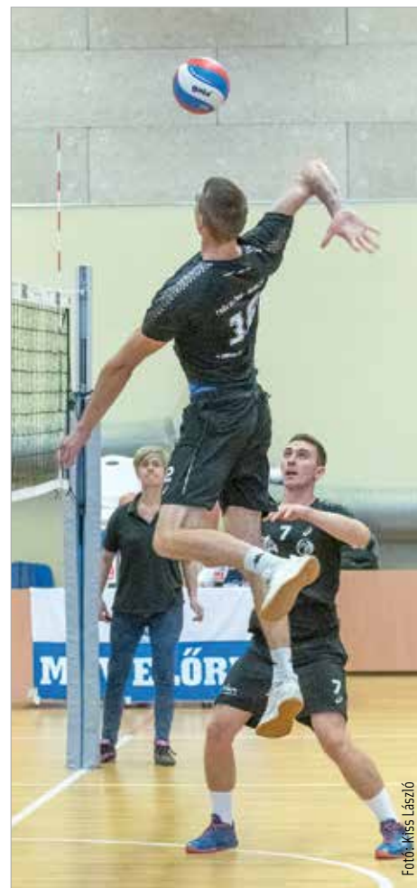
A férfi csapat már rutinosnak számít az NB I-ben, a női gárda most teheti le a névjegyét az első osztályban

Az új szezonban a felnőtt férfi mellett az immár NB I-es női csapat is a Jáky középiskolában játssza mérkőzéseit.