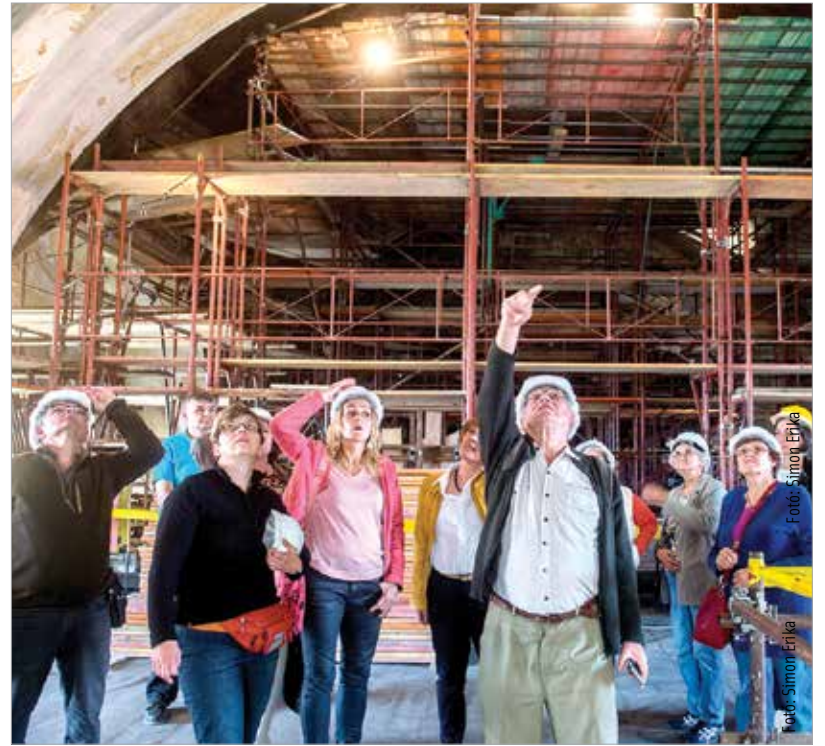
Közel a tető: némi munkavédelmi oktatás után a rekonstrukció alatt álló bazilika freskóit az állványokról nézhették meg az érdeklődők. S bár a székesegyház nem éppen a szórakoztatás tere, kulturálisan mindenképpen élményt jelentett a látogatás.