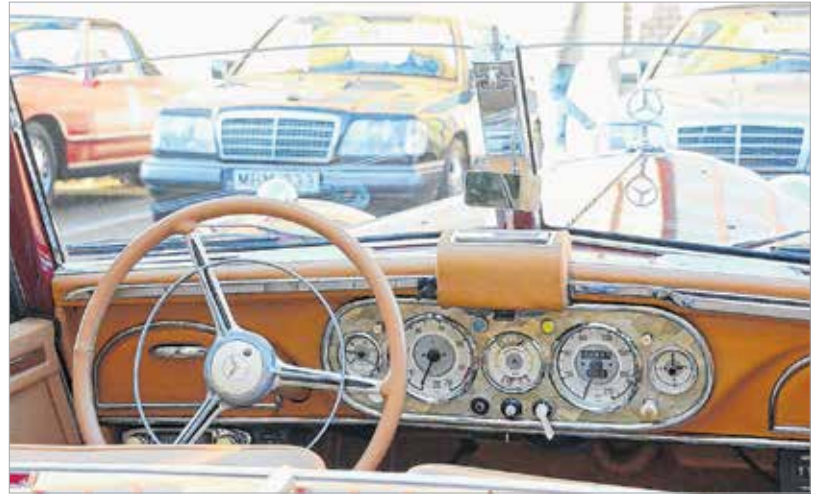
Mintha most gördült volna le a gyártószalagról