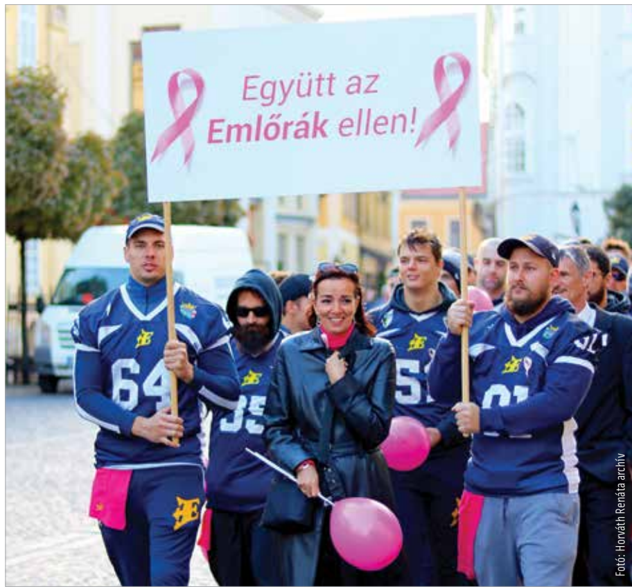
A program háziasszonya és fővédnöke idén is Závodszy Noémi színművésznő

Évente körülbelül haterzer nőnél diagnosztizálnak rosszindulatú emlődaganatot hazánkban, akik közül több mint kétezret veszítünk el. Eppen ezért fontos felhívni a figyelmet a szűrővizsgálatok és az önvizsgálat fontosságára. Városunk tizenegyedik alkalommal csatlakozik az országos mozgalomhoz, hiszen ahogy a szakemberek fogalmaznak: az idejében felfedezett betegség gyógyítható! Ugyanakkor a szűrővizsgálatokon való részvétel még mindig nagyon alacsony: „Megyei szinten száz hölgyből negyven megy el a szűrővizsgálatokra, így csak negyven százalékuk adja meg magának az esélyt, hogy időben felfedezhető legyen az esetlegesen kialakuló daganat.” – mondta el lapunk-