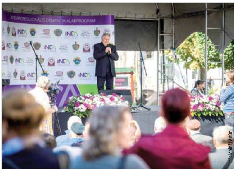
A világnapi rendezvény egyik előadója és párfogója Koltay Róbert színművész volt, aki maga is átéli a betegséget, igaz, csak színpadon, egy demens idős emberről szóló darabban

„Sok a rejtőzködés és a tabu a betegség kapcsolatban, mert az emberek nem nagyon beszélnek róla, ha van ilyen beteg a családban. Ezt a falat át kell törnünk, több okból is. Egyrészt, hogy ne legyenek egyedül az érintettek és a gondozott családtagjai, másrészt pedig, hogy aki nem érintett, az tudjon tenni annak érdekében, hogy ne is legyen.” – összegezte a célkitűzést Radnainé Egervári Ágnes. A rendezvényt szervező és a problémával komplexen foglalkozó Katolikus Szeretetszolgálat főigazgatója kiemelte, hogy Székesfehérváron indítják útjára és hat városban szervezik meg a DIÓ (demencia információs órák) nevű programot, ahol a betegek családtagjai kaphatnak tájékoztatást a gondozásról.