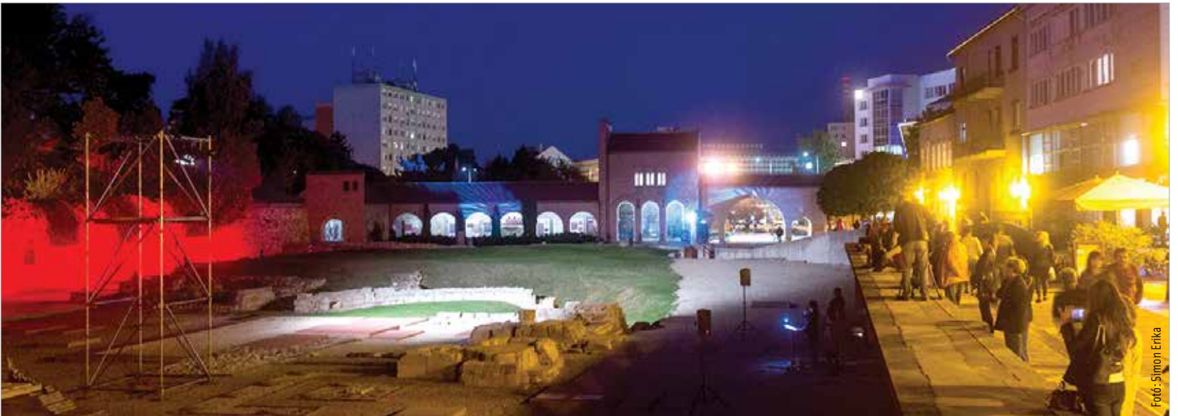
Különleges hangulata volt a Nemzeti Emlékhelynek, amelyet ezúttal este is lehetett látogatni