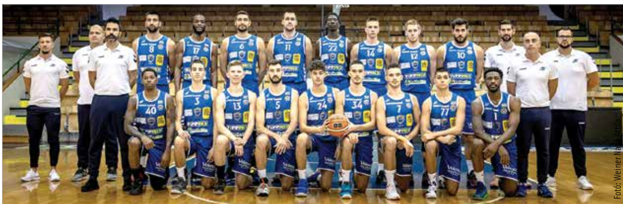
Ők várják a feldobást: légiósok, rutinos magyarok és fiatalok az Alba Fehérvár 2019/20-as keretében

Az biztos, hogy az erős karakterjegyekre hamar szükség lesz, mert a bajnokság elején nehéz meccsek várnak az Albára, egy jó rajt pedig komoly önbizalmat adhatna ehhez a csapatnak.