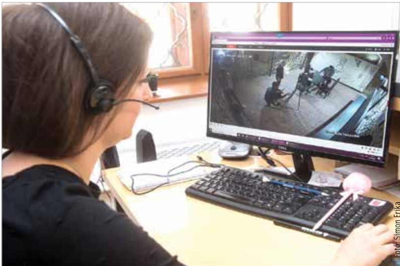
Vigyázó szemek: így figyelnek a szabadulók biztonságára a Hiemer-házban