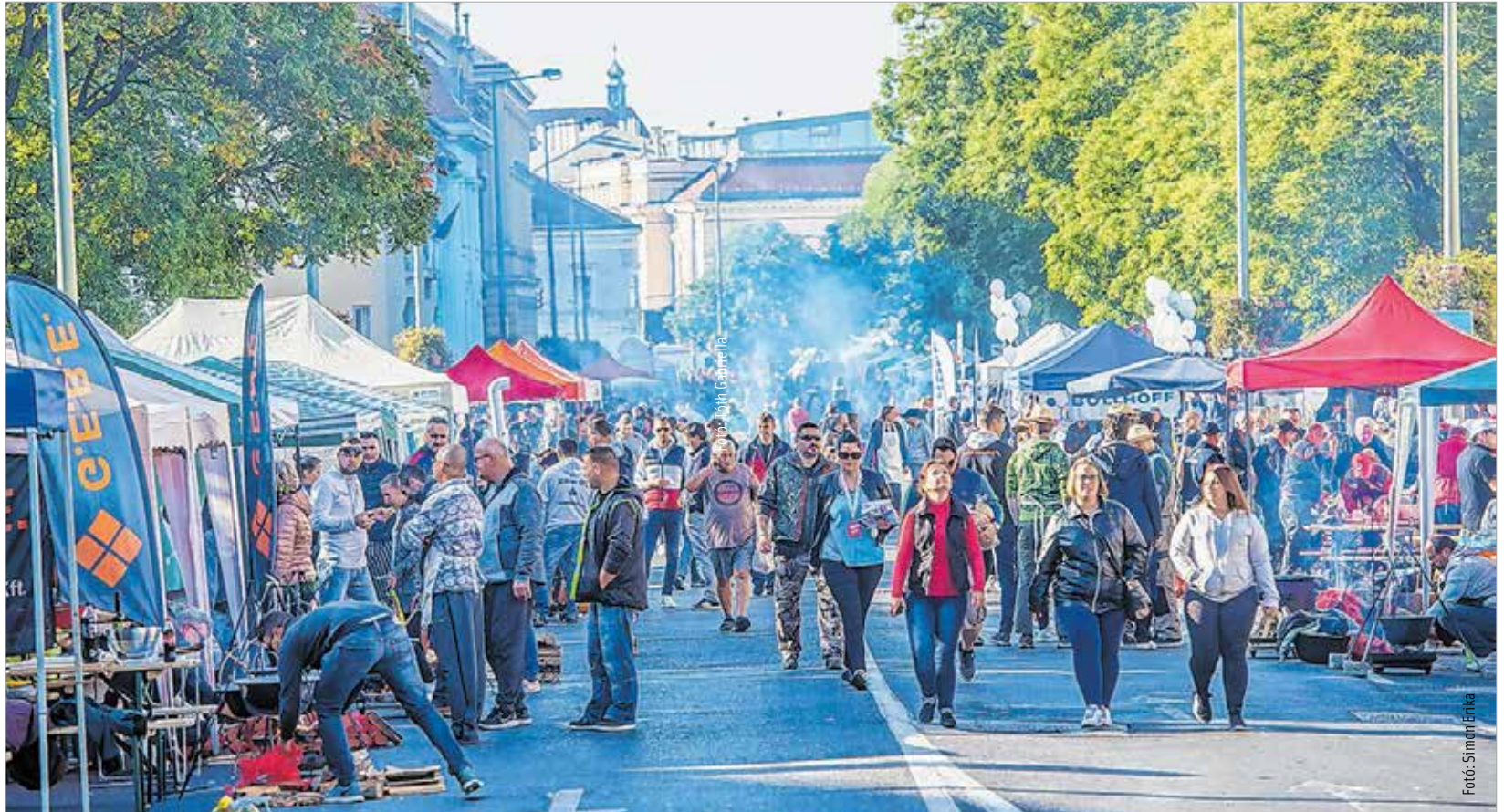
Füst az út felett...