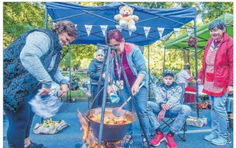
Már majdnem kész!