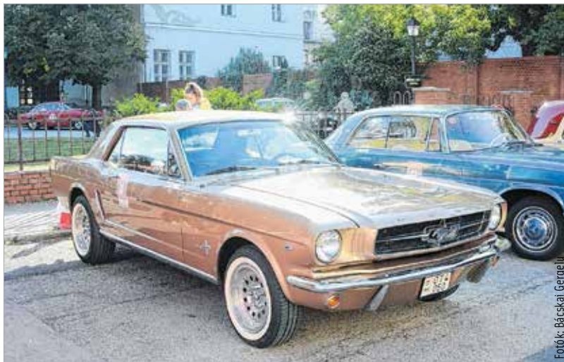
James Bond sosem ülne amerikai autóba, de talán ezzel a Mustanggal kivételt tenne...