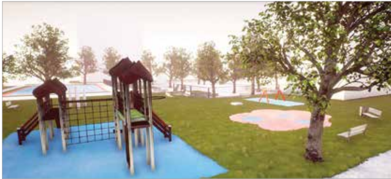
Ilyen lesz a vízivárosi szabadidőpark. A régóta hiányzó sportpályára, játszótérre, pihenőparkra és újabb parkolókra már nem kell sokat várni, az építkezés egy jelentős része még az idei évben véget ér.

Még ebben az évben megépül a sportpálya, kialakítják a parkolókat és novemberben elültetik a nagy körméretű fákat is a jelenlegiek mellé. A játszótérre a kombinált eszközöket, a játszóvárat illetve a padokat jövő tavasszal telepítik majd a Városgondnokság szakemberei. A parképítés is ekkor lesz. Az új közösségi tér egy részét a helyi iskolaépület udvarából nyerik. Az iskola ugyanis sokkal kisebb intézmény lett, mint amikor azt eredetileg tervezték. Így az udvara is kihasználatlan, területe érdekesélem nélkül csökkenthető, és az ezzel felszabaduló részt visszakapadják a környéken élők.