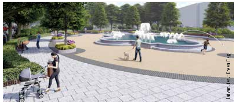
Látványterv: Green Flag

Jövőre a Zichy liget is megújul. A Fő utca felőli végére egy százhatvan négyzetméter alapterületű vízmedencés szökőkút épül, körülötte a burkolat korszerű, vízáteresztő lesz. Biciklitárolós, korszerű utcabútorok kerülnek majd az új szökőkút köré. A liget intenzív használata során sok helyen kitaposták a növényzetet, amit további növénytelepítéssel pótolnak. Egyetlen fát sem vágunk ki a ligetben, ültetnek azonban további hét fát a szökőkút köré. A szökőkút a régi hajós szobor helyére kerül, ahol a Zichy színpad szokott állni.