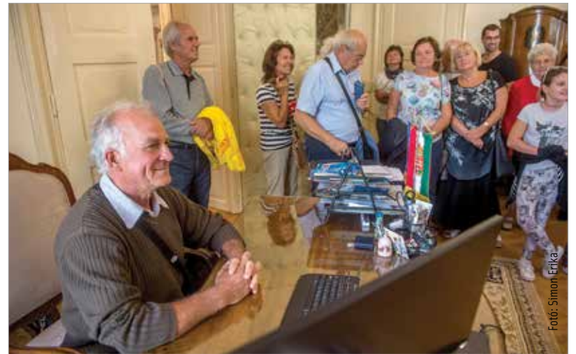
A polgármester szemszögéből: a Városháza különlegességei között a legvonzóbb a polgármesteri iroda volt