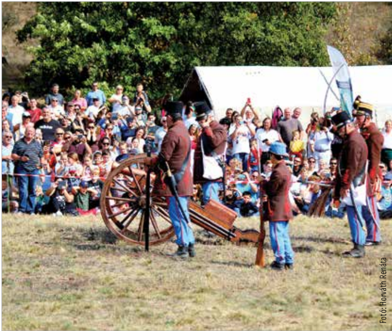
Vasárnap a honvédfesztivál keretében a pákozdi csata elevenedett meg

Szeptember utolsó hétvégéjén a százhetvenegy évvel ezelőtti események tiszteletére ünnepséggel, koszorúzással valamint a Magyar Huszár- és Katonai Hagymányórzó Szövetség és az Ifjú Nemzetőrök közreműködésével a csata megelevenítésével emlékeztek a szervezők Pákozdon, a Katonai Emlékparkban.