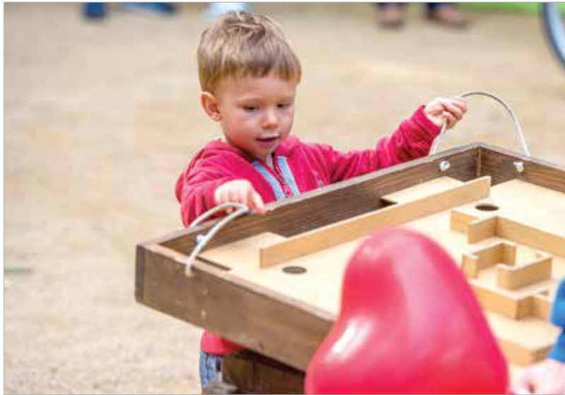
A játékos feladatokat a legkisebbek is élvezték

készítéssel, hangszer- valamint kisállat-bemutatóval is készültek. „Fontos, hogy évről évre köszönetet mondjunk a civilszervezeteknek, hiszen nem nagyon van olyan terület, amit nem fednek le a városban működő szervezetek.” – mondta köszöntőjében Cser-Palkovics András polgármester, aki felhívta a figyelmet arra is, hogy jó lehetőséget ad