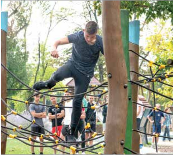
Időre ment a verseny, de nem volt könnyű gyorsnak is lenni és fent is maradni az akadályokon

egyre ügyesebben teljesítette a feladatokat. A csapatokban legalább egy lánynak is lennie kellett, és az egyéni képességek mellett az is számított, hogyan osztják el a különböző számokat, mennyire működnek együtt csapatként. A gömbfutás, pókhálójárás vagy éppen alagútban kúszás sikert aratott, így alighanem teljesül a szervezők szándéka, és lesz még fixatlonverseny a Koronás Parkban!