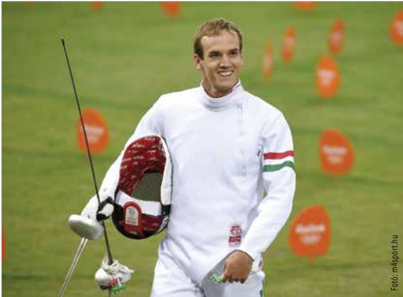
Különösen nagy élmény, ha élőben versenyezhet a fehérvári közönség előtt

A pályafutásomnak már a közepevége felé tartok. Legszívesebben a sport területén maradnék, mert úgy érzem, sokat tudnék segíteni és ez az, ami boldoggá tesz. De nem alapozhatok csak erre, nem olyan sportág ez, aminek elég biztos a jövője. Az öttusa az elmúlt időszakban kicsit megingott az olimpiai programban, volt már róla szó, hogy leveszik. Amíg ez nem történik meg, a sportág létjogosultsága biztosítva van. Ha mégsem alakulnak jól a dolgok, akkor más irányba lépek. Hamarosan befejezem Dunaújvárosban a műszaki menedzser szakot, logisztikai területen is el tudom magam képzelni. Bár nem tanultam, de nagyon érdekel a sportrendezvények szervezése. Sőt a katonaság felé is kacsingatok! De úgy érzem, akár még egy olimpiára is kijuthatok, ha az egészségi állapotom és a lendületem engedi. Még szívesen folytatnám!