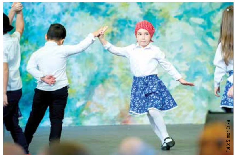
A délután a százrétí ovisok és iskolások műsorával kezdődött