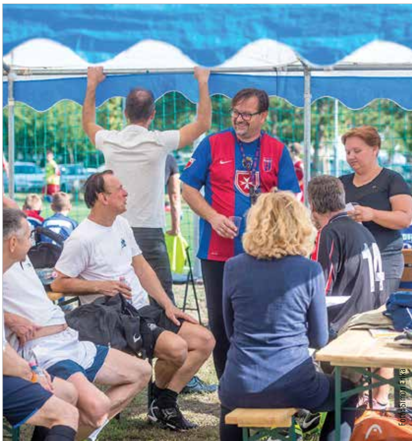
Futballtornát és családi napot szervezett szeptember utolsó vasárnapján az Alapítvány a Székesfehérvári Fogasztóvédelemért Palotavárosban, a Csapó utcai játszótéren, ahol a kicsik és nagyok egyaránt jól szórakoztak. K. T.