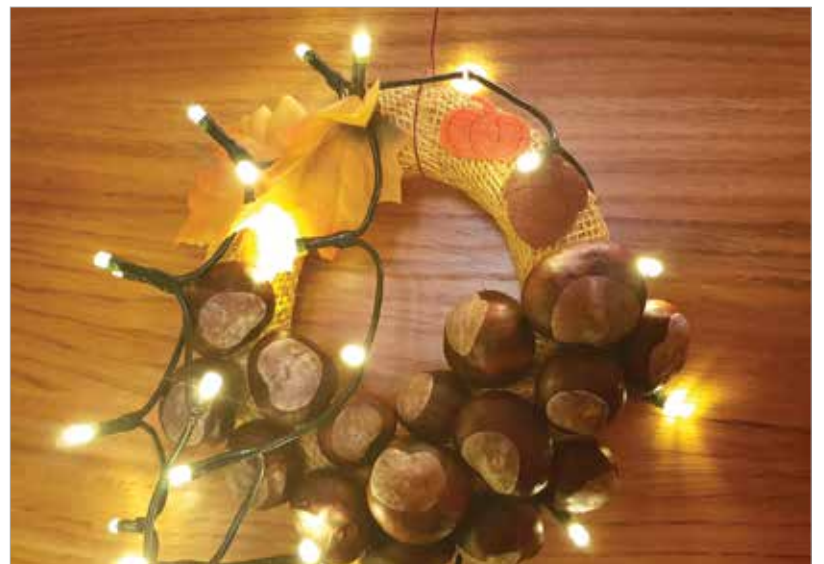
Az őszi ajtókoszorút is kivilágíthatjuk

Őszi ajtódíszit szintén nem nagy ördögösség készíteni. Szalma vagy moha koszorúalapot a piacon, a virágosnál és a nagyáruházak kertészeti részlegén is találunk, de ha például teljesen be szeretnénk borítani egy színes szalaggal, akkor a hungarocellból készült karika is megteszi a hobbiboltból. Ragasztópisztoly vagy drót segítségével tűzdeljük tele őszi termésekkel, majd tekerjük körbe egy égősorral. Lehetőleg elemeset válasszunk, akkor nem kell még arra is ügyelnünk, hogy olyan helyre akasszuk a koszorút, ahol konnektor is van.