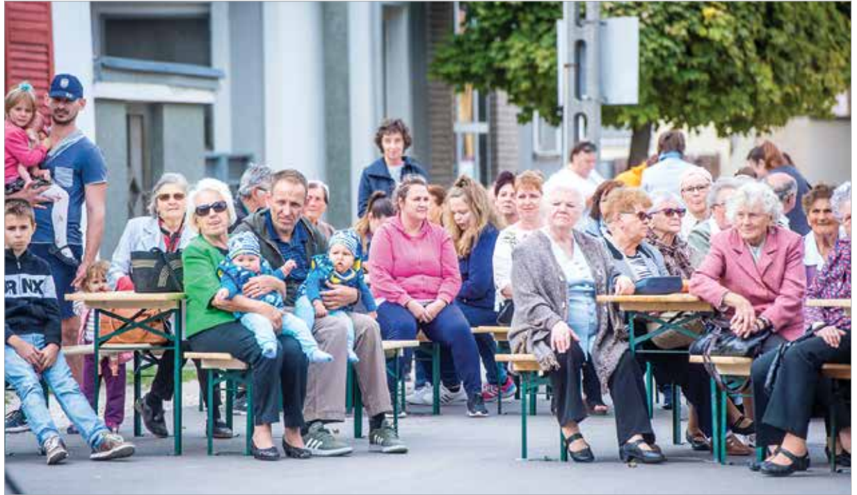
A házatóra összegyűlt Felsőváros apraja-naguja

A régi tárgyakat főként az idősebbek őrzik, a gyerekek már nemigen, a régieknek meg a szívük szakad meg, hiszen a múltjukat, örömeiket, bánataikat, történeteiket, fiatalságukat őrzik ezek a tárgyak. A Kertalja utca 8. tehát nem múzeumnak készült, hanem az élő emlékezetnek, ahová a berendezést, a tárgyakat a helyiek viszik be, és a következő generációnak csupán annyi dolga van, hogy megőrizze, továbbadja a hagy-