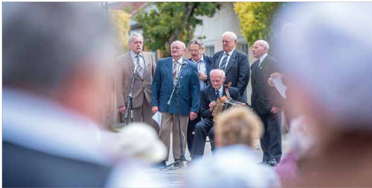
Míg a fiatalok csak tanulják, addig az idősek őrzik a helyi hagyományokat