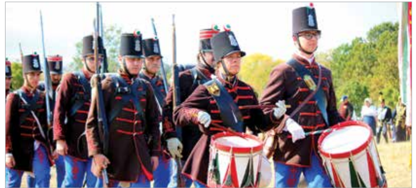
Kész a csatára a sereg!