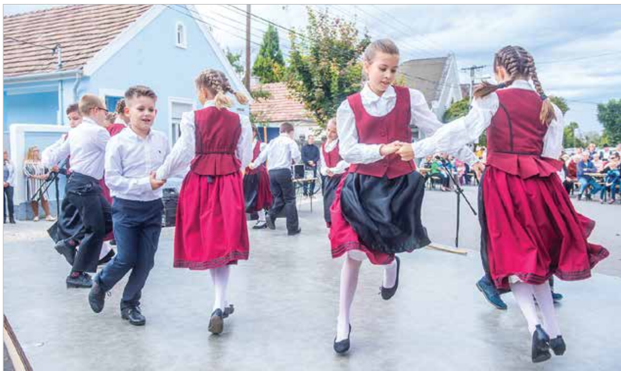
A Felsővárosi Általános Iskola diákjai ma már tanórán ismerkednek a városrész történetével, hagyományaival, táncaival és énekeivel

Az épületet kívül-belül felújították, terei azonban még üresek.