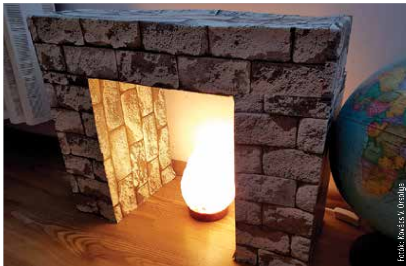
Hangulatos kandalló papírdobozból

A gyerekek szobáját (vagy ha úgy tetszik, a nappalít) a hideg hónapokban feldobhatjuk egy alkandallóval. Nem kell megijedni: ha nem értünk a gipszkartonozáshoz, ennek akkor is bátran nekiállhatunk: nem lesz másra szükségünk, csak egy jó adag cipősdobozra vagy más hasonló kartondobozra. Meg persze valamilyen hangulatos