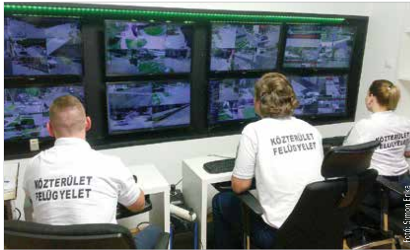
Non-stop felügyelet: ide futnak be a városi közterületi kamerák képei

Az Alba Plaza előtti verekedésnél illetve a Városház téri lovasszobor megrongálásánál a térfigyelő kamerák felvételei segítettek a közterület-felügyelők és a rendőrök munkáját. Míg 2010-ben csupán huszonnégy, 2019-ben már százötvenegy térfigyelő kamera működik a városban. A korábbi tízhez képest pedig huszonnégy közterület-felügyelő teljesít szolgálatot, közülük tizenketten a kameraközpontban – tudtuk meg Nagypál Róberttől. A városi közterület-felügyelet irodavezetője hozzátette, hogy a bekamerázandó helyszínek kiválasztásában szorosan együttműködnek a rendőrséggel, de az önkormányzati képviselőknél kereszttől a lakosság véleményét, tapasztalatait is figyelembe veszik: „Az ő lakóközösségük védelme érdekében kerül ki a kamera, azonban sokszor nem pont ott és olyan