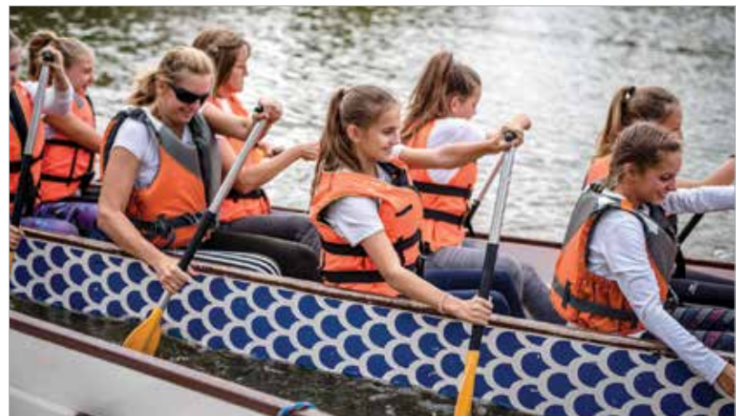
Pénteken a nebulók ragadtak evezőt

Batman, a Tóparti Gimnázium 9.BÉ és a kápolnásnyéki Vörösmarty Mihály Általános Iskola és Gimnázium csapatainak szurkolhattak a nézők. A szombati nap folyamán pedig a felnőttek volt a fő. A sárkányhajósok által méltán kedvelt koronázóvárosi versenyhelyszín most is különleges kihívást jelentett a résztvevő csapatok számára, hiszen a sprintverseny és a kétezer méteres futamok a sok kanyar miatt nagyon látványos küzdelmekre adtak lehetőséget.