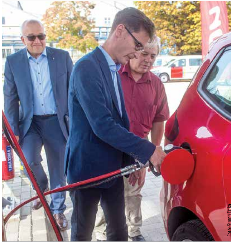
A CNG-t benzinüzemű és Diesel-motorokban is lehet használni