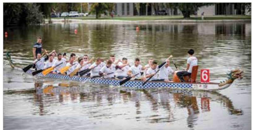
A Csónakázó-tó remek helyszíne