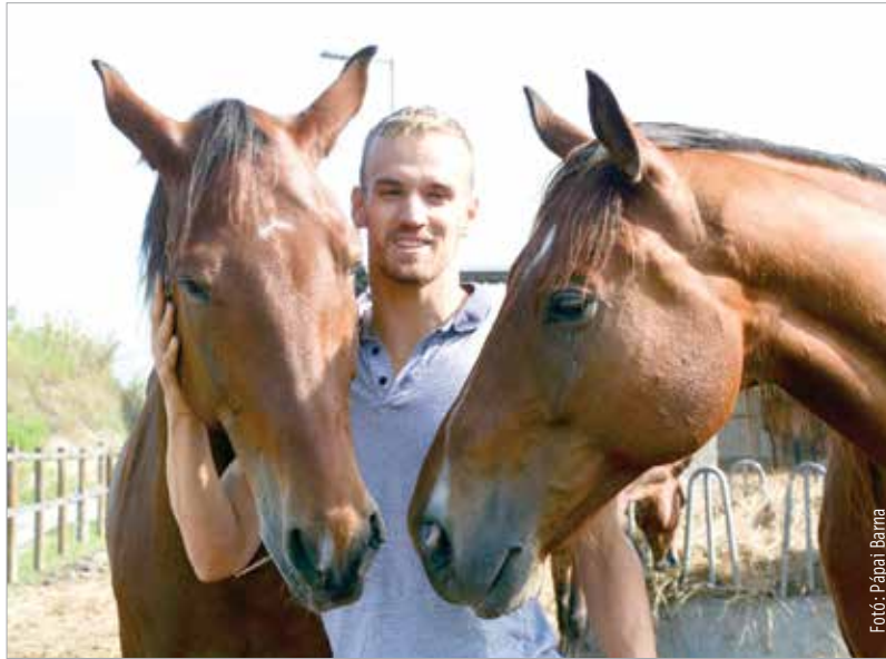
Gyerekként még tartott a lovaktól, ma már az egyik kedvenc száma a lovaglás

Vitt magával a tehetséged... Mondhatjuk, hiszen a korosztályos versenyeken úszásban, futásban