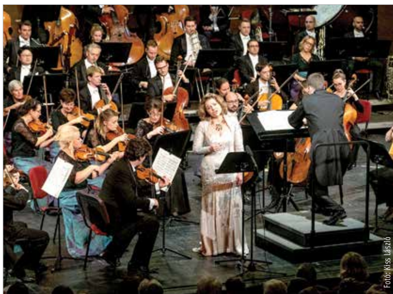
A hangversenysorozat november huszonötödikén folytatódik: A szerelem madarai című esten Ránki Dezső zongoraművész lesz a zenekar vendége

Pasztircsák Polina, aki Mirella Freni tanítványaként a világ operaszínpadainak ünneplte sztárja, ezúttal is bizonyította kivételes kvalitásait: „Nagyon örültem a meghívásnak, boldogsággal tölt el, hogy részese lehettem ennek a koncertnek! Mahler a szívem csücske, így ez valóban nagy kihívás volt számomra.”