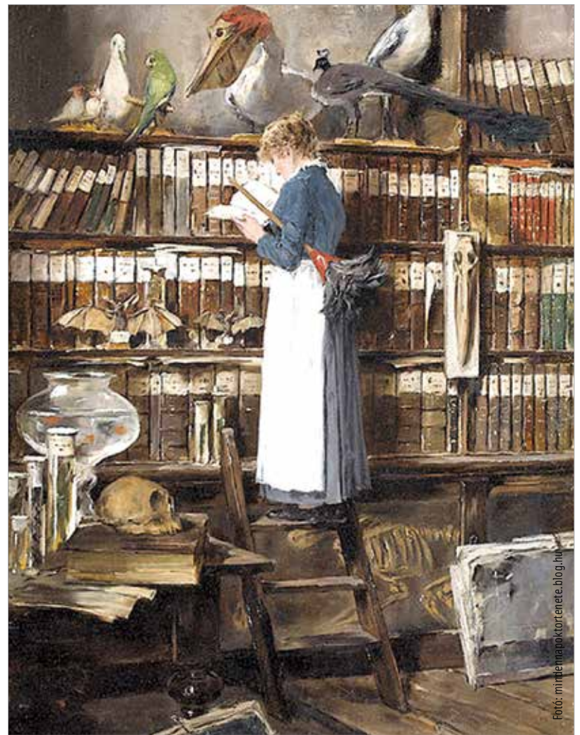
Edouard John Mentha: Olvasó cseléd a könyvtárszobában, 1915 előtt

A cseléd is felmondhatja a szerződést, ha a kialakított bért a gazda a cseléd felszólítására sem fizetné pontosan, vagy a cseléd házasság által önállóságra tehetne szert, melyre a szolgálati idő letöltése esetén nem lehetne kilátása. Felmondással élhet továbbá, ha kimutatja, hogy jelenléte szüleinél a család fönntartására nélkülözhetetlenné vált, ha a gazda a lakását más községbe állandóan teszi