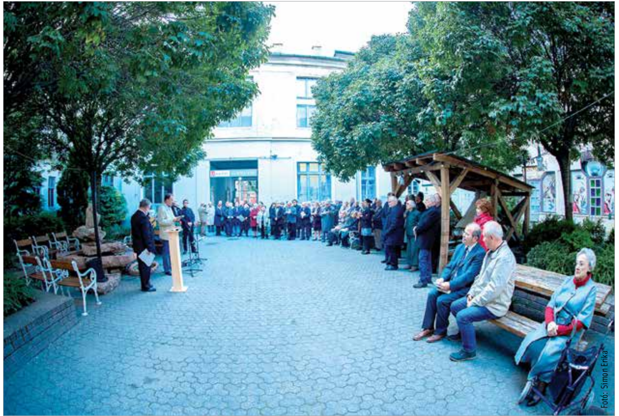
A megnyitón a résztvevők megemlékeztek az aradi vértanúkról és a trianoni nemzeti sorstragédiáról is