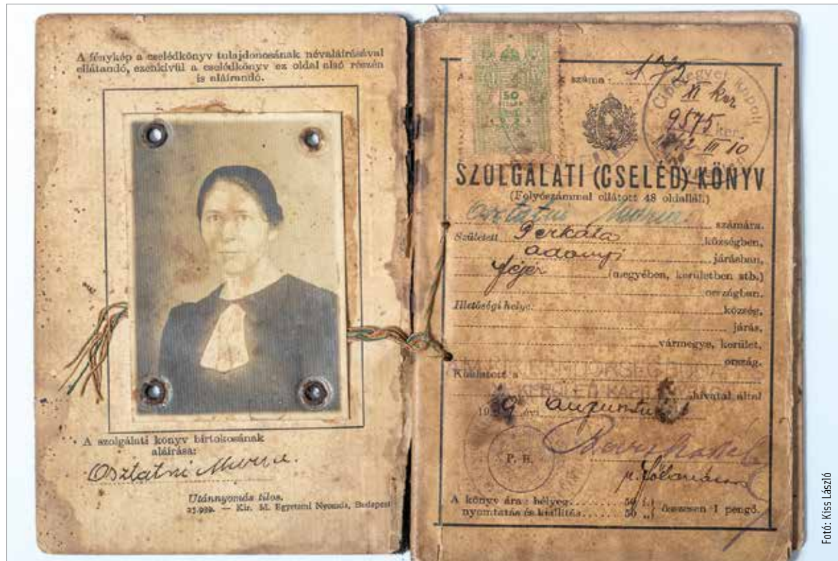
Cselédkönyv a harmincas évek végéről

Aki cselédként akar szolgálatba állni, annak saját személye fölött szabadon kell rendelkeznie. Ha atyai hatalom vagy gyámság alatt álló egyén akar beszegődni, arra az atya vagy gyám beleegyezése szükséges. A beleegyezést a cselédügyben illetékes elsőfokú hatóság pótolhatja, ha az atya vagy gyám a beleegyezést alapos ok nélkül megtagadja. Fennmarad azonban az atya vagy gyám fellebbezési joga. Férjnél lévő