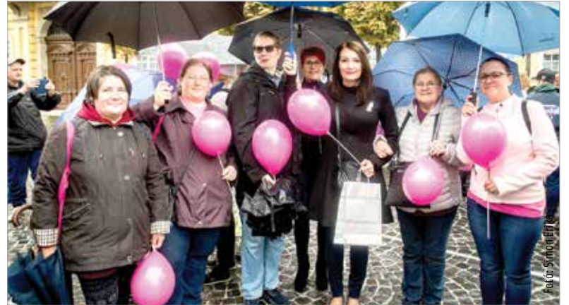
Anyák, nagymamák, túlélők vonultak fel a mellrák elleni sétán a megelőzés érdekében

kái, nagymamá. Inkább választatok azt a pár perces vizsgálatot, mint a betegséggel járó lelki, anyagi, testi nehézséget! Vegyétek a fá-