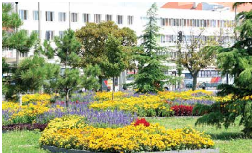
A Petőfi park növényzete nem csupán a látvány miatt fontos, de a közeli busz- és autóforgalom környezetszennyezésének hatását is enyhíti