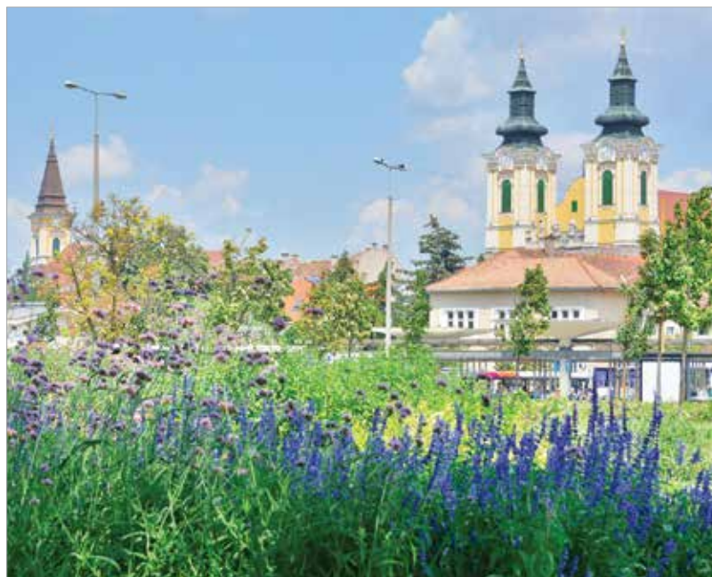
Csodálatosak az egyvári növények a város parkjaiban!