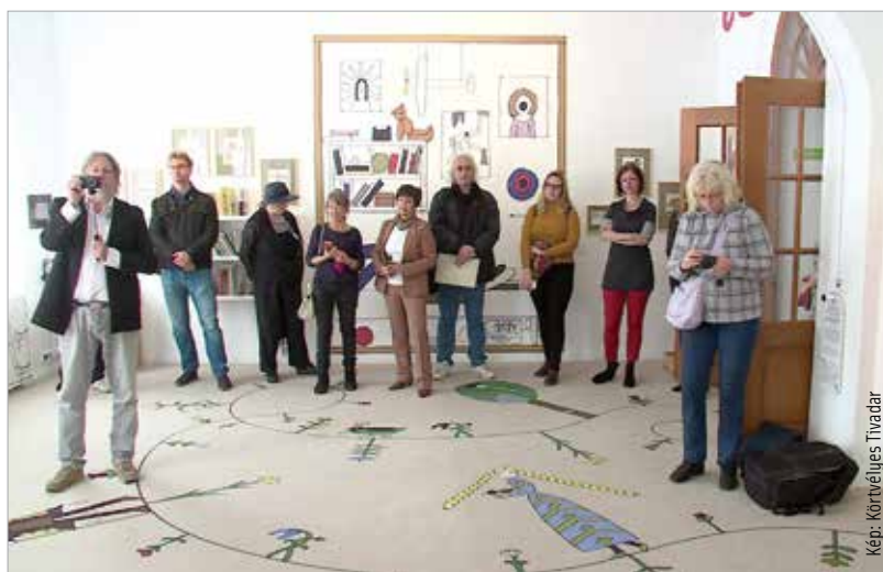
A Vonalba zárt történetek című kiállítást is megismerték a résztvevők