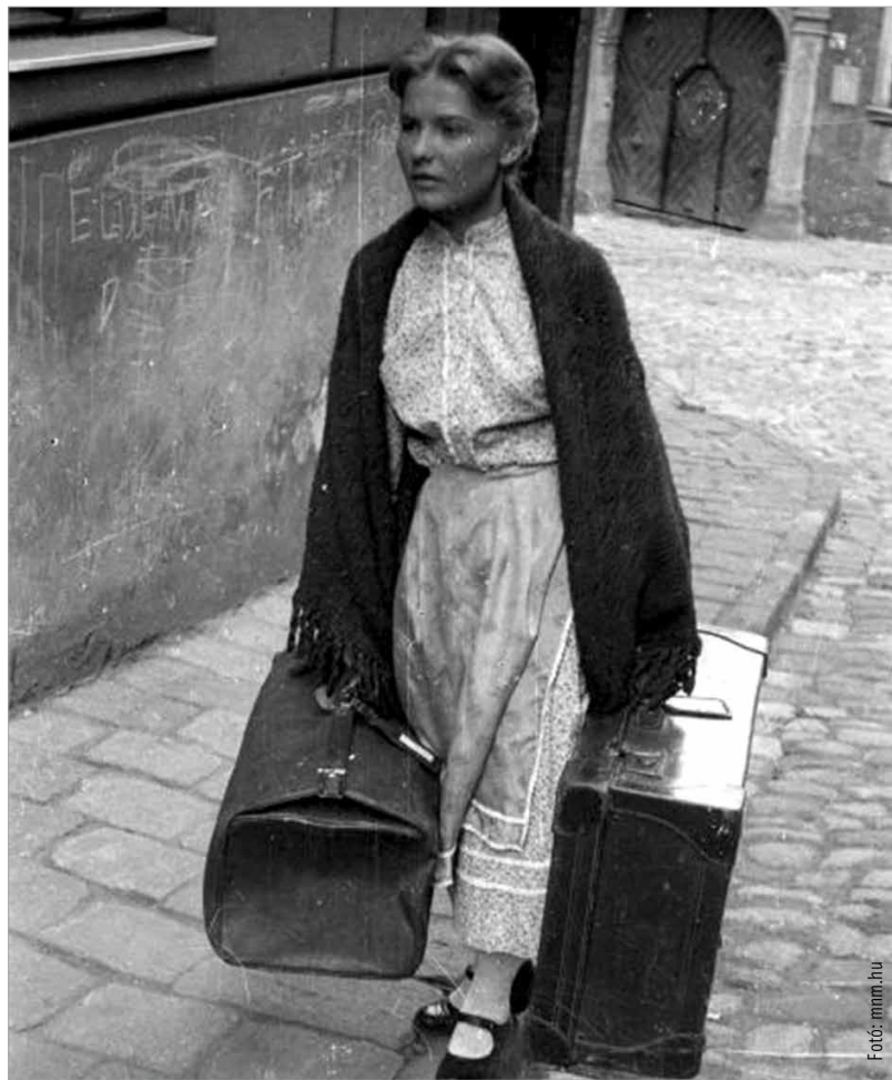
A magyar irodalom leghíresebb cselédje, Édes Anna

A szerződés megkötése után nem köteles a cseléd szolgálatba állni, ha időközben oly betegségbe vagy állapotba esik, amelytől a szolgálatra képtelenné teszi – ha a nő cseléd férjhez megy és a férj a