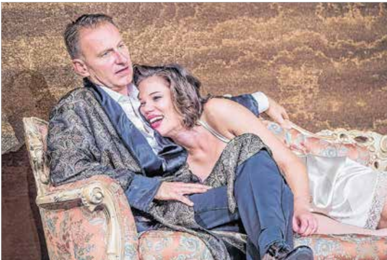
Hogy lesz ebből happy end?