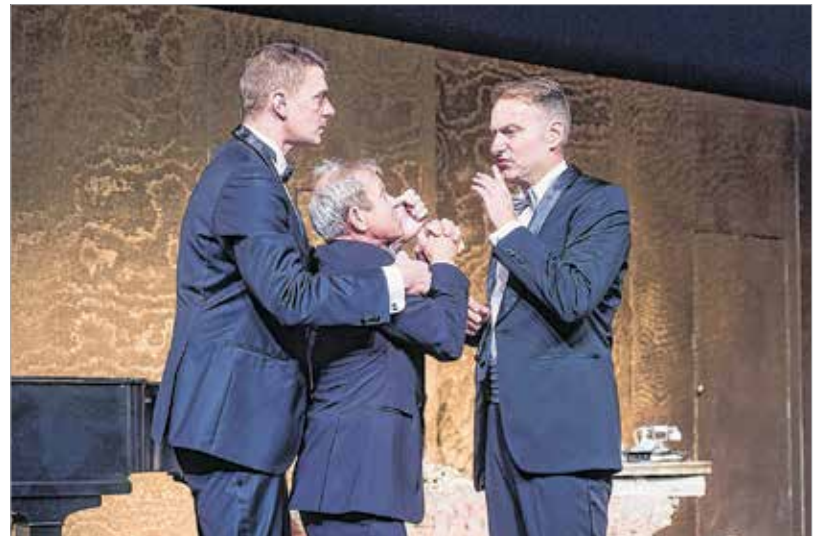
Nyugalom, ura vagyok a helyzetnek!