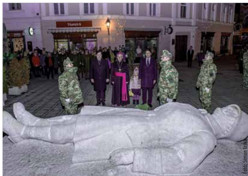
Százegy évvel ezelőtt ért véget az első világháború