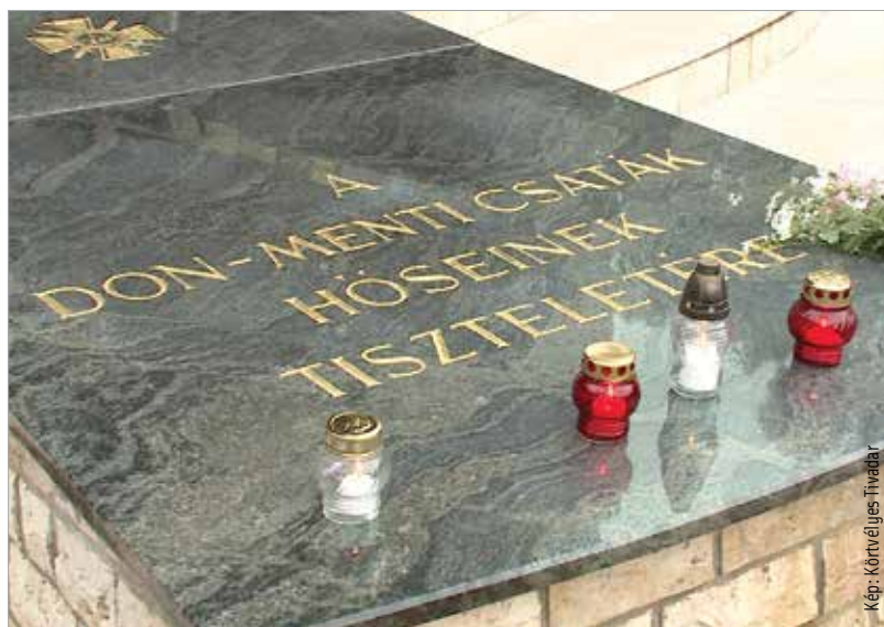
A doni hősök és a civil áldozatok emlékműve örök mementő