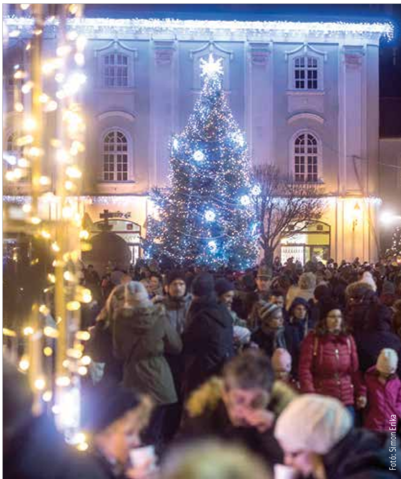
Esténként ragyogó fényben úszik a belváros

Káprázatos ragyogás, lélekmelengető dallamok és hosszú baráti beszélgetések egy pohár forralt bor mellett – megnyílt az adventi vásár a belvárosban. Ezenkívül városzerte ünnepi kézműves foglalkozásokkal, műsorokkal és meghitt gyertyagyújtással hangolódnak a fehérváriak a már nem is olyan távolinak tűnő karácsonyra.