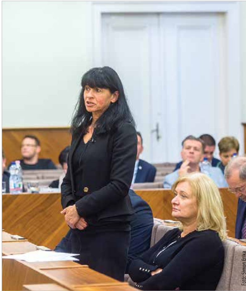
A közgyűlés többsége elfogadta azt a határozatot, mely kimondja, hogy fehérvári magánszemélyek a következő években sem fizetnek helyi adót