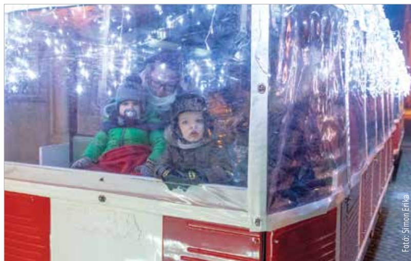
A kisvonat is ünnepi fényben tündököl