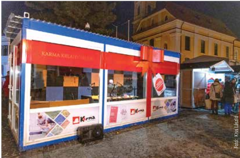
A Vörösmarty Rádió látványstúdiója is ünnepi díszbe öltözött a Karma Kreatív Stúdió jóvoltából