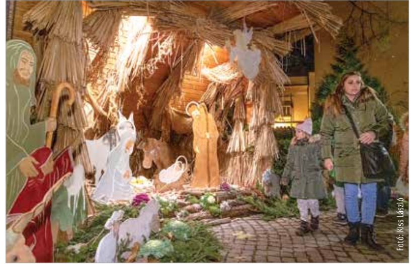
Az első ünnepi hétvégén kinyitott a Püspöki Palota kertjében a hagyományos Adventi udvar, ahol betlehemmel, interaktív karácsonyi sarokkal és kézműves vásárral várják a látogatókat