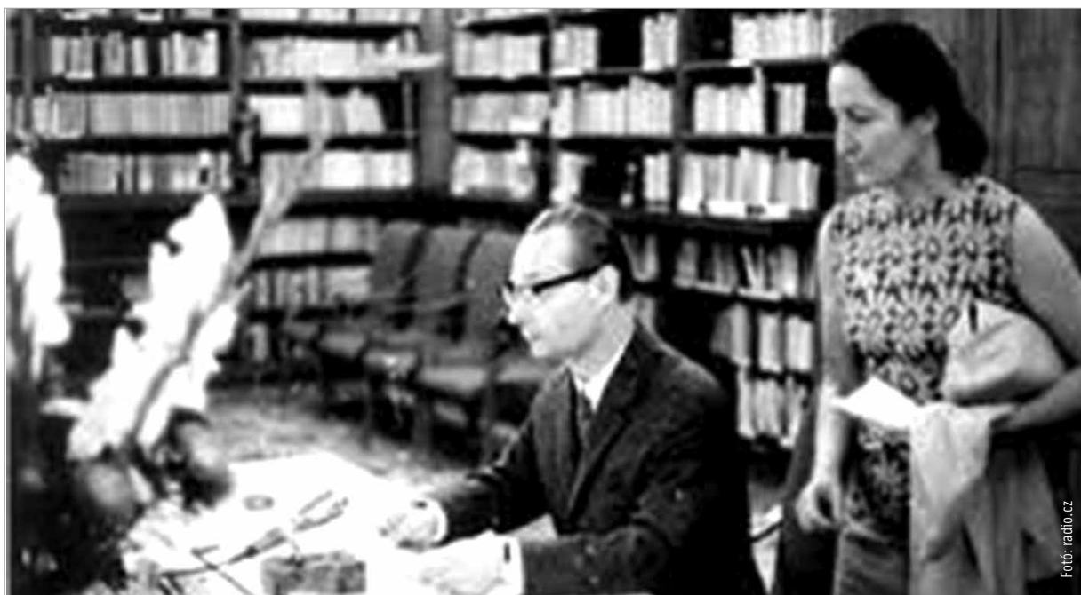
Alexander Dubček (1921–1992) 1968-ban Prágában, a rádióban beszél

kelet-közép-európai országokban négy-öt évtizeden keresztül. Lényegében a kommunizmus ideológusai egy idillikusan működő világot foglaltak meg, miközben a hatalmat megszerző élcsapat börtönországokat hozott létre szerte a világon, azaz csúnyán rászédtek az embereket. A totális kommunista hatalom kiépülése politikai koncepciók perек lefolytatásával, ártatlanul elítélt milliók sinylődésével, tönkretett