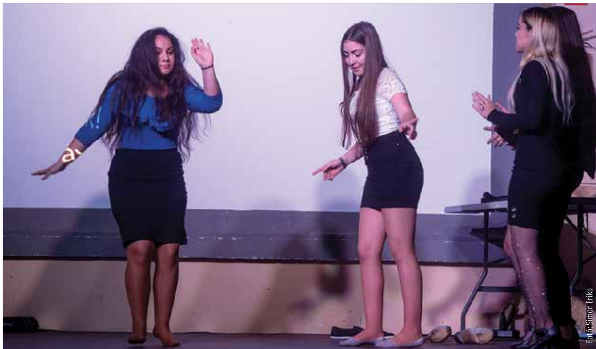
Vers, jelenet, film a döntőn – a végső fordulóban egy kreatív versenyművet kellett készíteniük a fiataloknak

– hangsúlyozta Pásztor László, a vetélkedő szervezője. A cél tehát évek óta változatlanul az, hogy játékos, szórakoztató