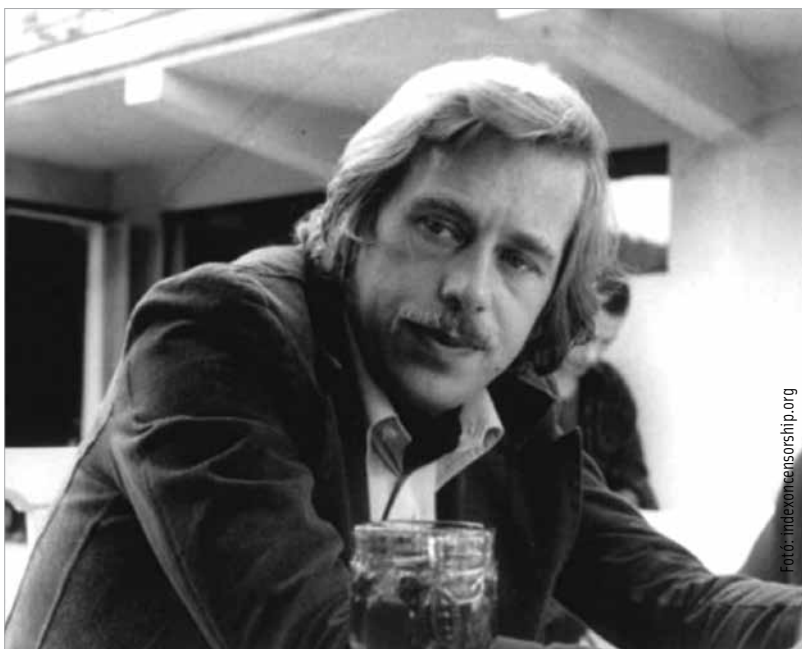
Václav Havel (1936–2012), a Charta '77 szóvivője

A világ történelme akkor még messze volt ettől a szegyeteljes eseménytől, s szerencsére azokban az években nagyobb formátumú