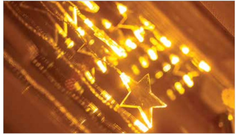
A lakás adventi hangulata az ablakdíszszel kezdődik

éreltük a napon! Kotorjuk elő a felső szekrényből a karácsonyfadíszeket, és válogassunk kisebb-nagyobb színes, fényes vagy matt gömböket! Szórjuk bele mindet az