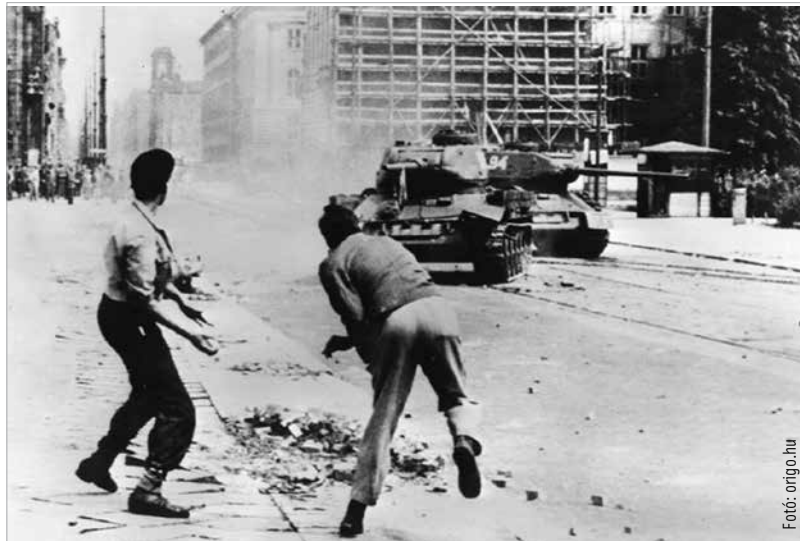
Német felkelők a szovjet hadsereg ellen (1953. június 15-17., Kelet-Berlin)

A marxizmus és a leninizmus elmélete keletkezésük idején kétségtelenül nagy hatást gyakorolt a társadalom különböző rétegeire. A kommunista ideológia segítségével hatalomra kerülő pártok azonban – miután megszerezték a politikai hatalmat – az elméletben megkonstruált tételeket figyelmen kívül hagyták. Ennek egyik oka az volt, hogy azokat az elméleteket igazából nem is lehetett volna átültetni a gyakorlatba, mert arra alkalmatlanok voltak. Számtalan példa hozható e kijelentés igazolására, de talán