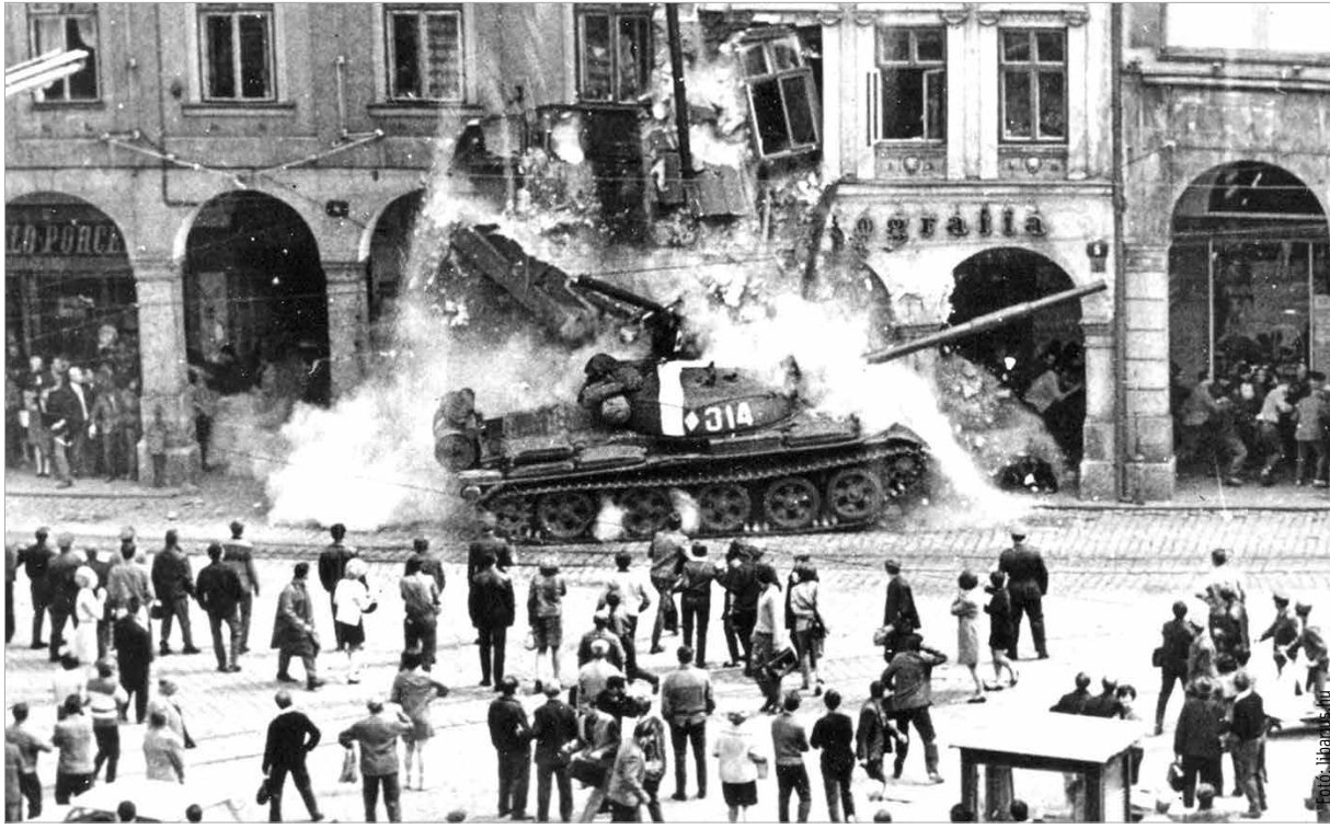
A csehszlovákiai invázió egy pillanata (1968. augusztus 21., Prága)

der Dubček került Csehszlovákia élére. Az új főtitkár az „emberarcú szocializmus” megteremtése programjával lépett a politika frontvonalába. Kísérletét azonban nem nézte jó szemmel sem a „nagy testvér”, sem a sorsközösségben osztozó többi szocialista ország pártvezetése. A Varsói Szerződés csapatai hatszáz ezer katonával augusztus 20-án éjjel megindították a támadást Csehszlovákia ellen. Az invázióban a szovjet csapatok mellett a lengyel, a magyar, a bolgár és a keletnémet haderő is részt vett. A „Prágai tavaszt” a baráti országok tankjai fojtották vérbe. A harcok során száznyolc „csehszlovák” ember esett áldozatul. A mindennapi küzdelmeket leszámítva, csupán a nagy eseményeket szemlélve, a szovjet típusú kommunista rendszer lebontása Lengyelországban folytatódott. Azonban az 1980 augusztusában