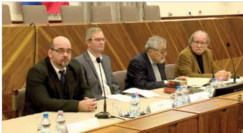
Az irodalomtörténészek egyetértettek abban, hogy Sík Sándor gondolatai a magyarság sorskérdéseiről ma is megállják a helyüket