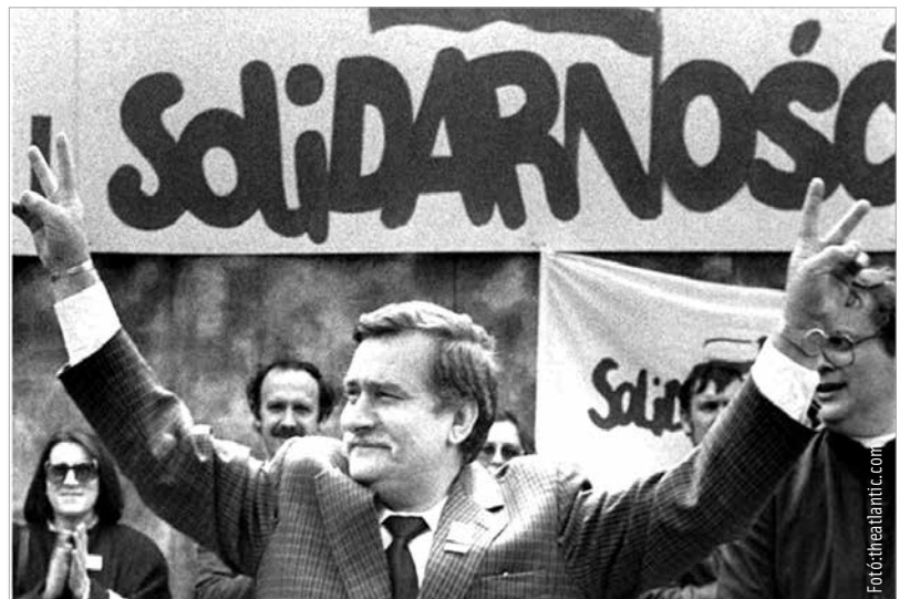
Lech Wałęsa (1943–) a Szolidaritás szakszervezeti mozgalom vezetője

lat tevékenységének. A rendszer brutalitását és egyben csődjét mutatta, amikor 1984. október 19-én a belügyminisztérium utasítására különös kegyetlenséggel meggyilkolták Jerzy Popiełuszko atyát, „a Szolidaritás lelkészét”. Közel