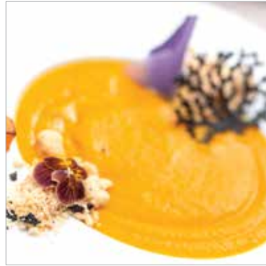
Sütőtökrémleves polentachipsszel, violaburgonya-szirommal és árvácskával

A séf szerint a legfontosabb tanács, amit a nagy ünnepi főzés előtt adhat a háziasszonyoknak, az az, hogy ne vállalják túl magukat és ne akarjanak mindenkinek megfelelni! Világmegváltás helyett inkább jól begyakorolt ételeket készítsenek! Legfeljebb ezeket dobják fel egy kis vörös borral, citrom- vagy narancshéjjal, vagy ahol lehet,