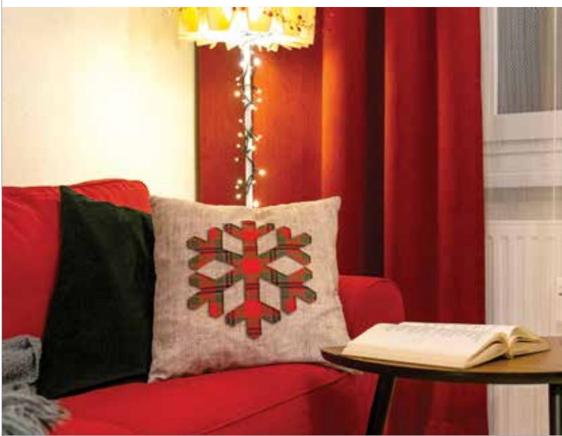
Kényelmes kanapé, meleg színek, hangulatlény és egy jó könyv. Mi kell még?