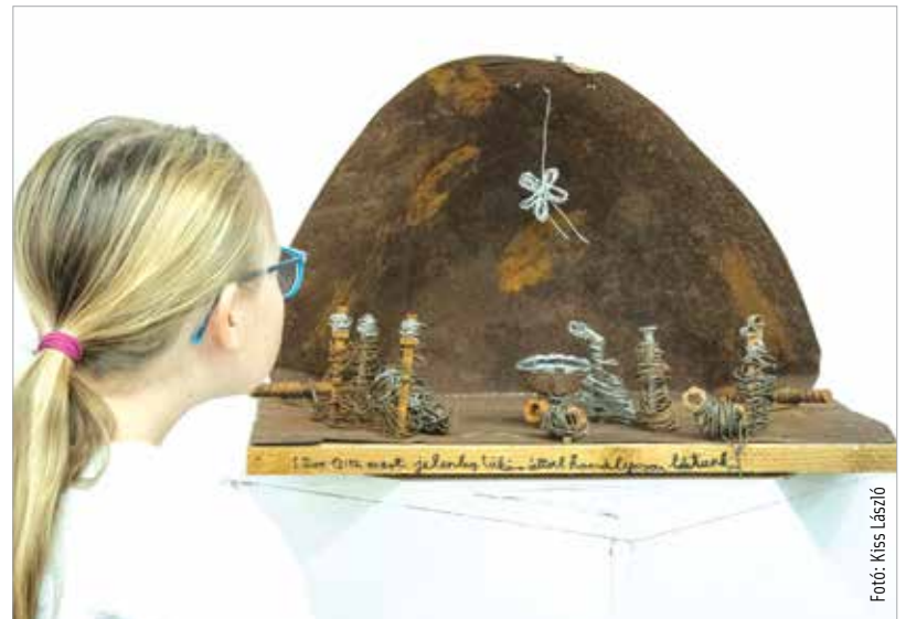
Szombaton nyílt meg a Szent István Hitoktatási és Művelődési Házban a XVII. Betlehemi szép csillag kiállítás. Az ötvennél is több pályamű annyira eltérő anyagokkal és formanyelven mutatja be Jézus születését, hogy idén helyezettiket nem hirdettek, de a különleges alkotásokat díjazták. A tárlat december huszonketedikéig látogatható.