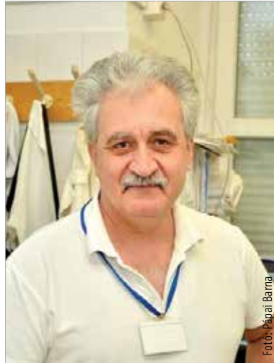
Minden napját a munkának szenteli