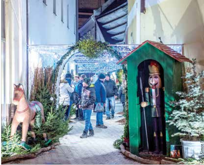
Az idei programsorozat egyik újdonsága a mesesikátorra vált Vasvári Pál utca