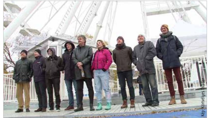
A magyar történelem kerekének mozgatói a Zichy ligeti óriáskeréknél találkoztak

– igaz, vér és mocsok közepette – századokra kijelöli a magyarság további útját. Szabó Magda színműve a magyarság ezeréves útkeresésének és sorsfordító „rendszerváltásainak” máig ható természetrajzát tárja elénk – 994 őszén azt a szép, fényes napot, amikor Vajk, Géza fejedelem fia keresztelése előestéjén összegyűltek Európa keresztény királyságainak követői a magyar fejedelmi udvarban, hogy tanúi legyenek a magyar nép kereszténységhez való csatlakozásának.