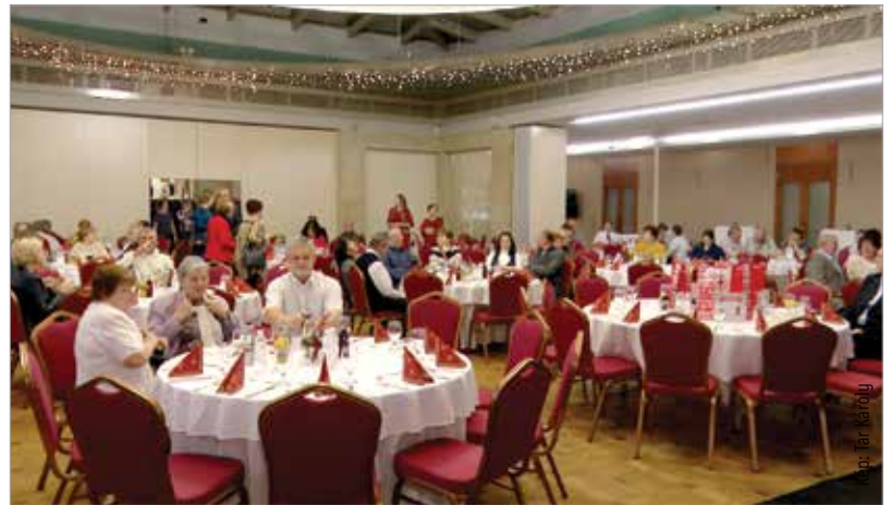
A mindennapi hősök rengeteg alkalommal adtak vért, s mentettek meg ezzel háromszor annyi életet

„Igazán megérdemlik ezt a véréadóink, hiszen szervezetünk az év háromszázhatvanöt napján segítséget kér a rászoruló emberek nevében. Lennie kell legalább egy napnak, amikor mi is adni tudunk valamit a köszönő szavakon túl!” – fogalmazott a megyei igazgató.