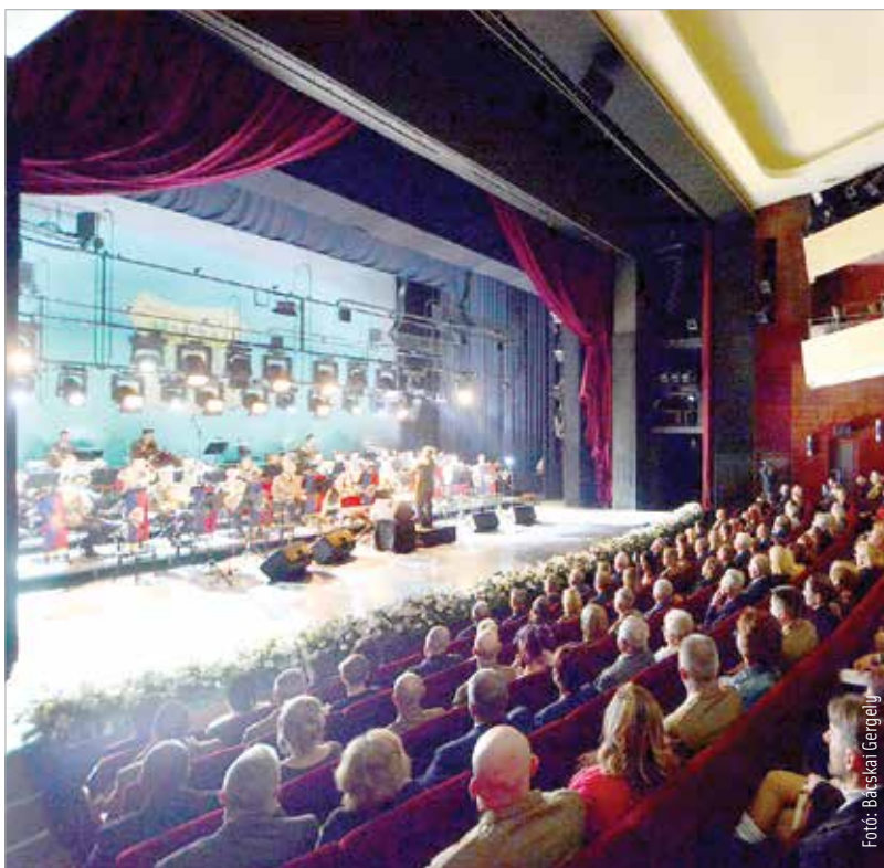
A Vörösmarty Színházban szombat este tartotta meg a honvédség adventi gálaestjét. A meghitt és szeretetteljes hangulat mellett a műsorba csempészték egy kis humort és nevetést is, hogy az átdolgozott hónapok után felszabadultabban tekinthessenek vissza az idei évre.