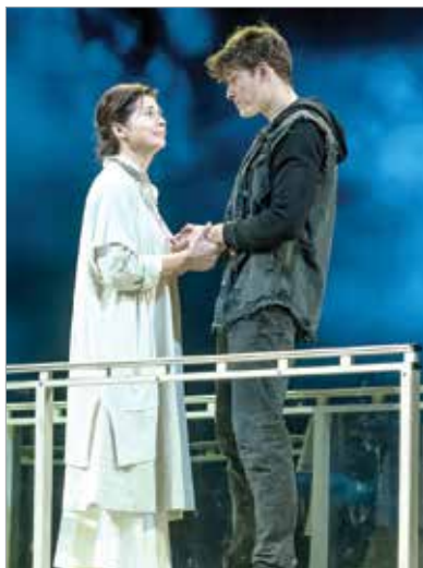
A Dajka szerepében a Rómeó és Júliában