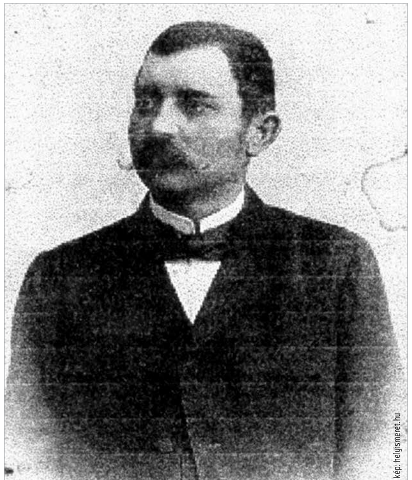
Babay Kálmán író, református lelkész