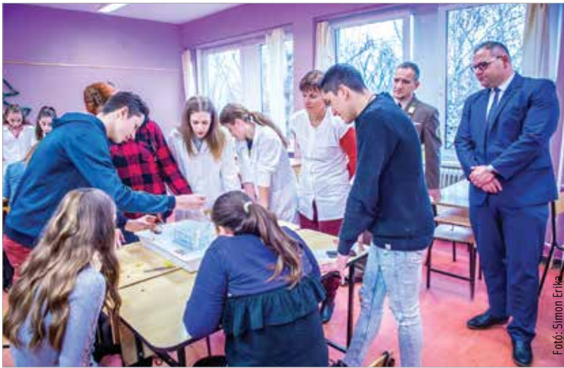
A vetélkedőn tizenhat csapat mérte össze tudását

feladatokkal várta a végzős általános iskolás diákokat a megyéből. E két profil, melyet az intézmény képvisel, a város számára is kiemelten fontos – mondta el Mészáros Attila alpolgármester: „Ha csak arra gondolunk, hogy akár az alapellátásban, akár a szakellátásban milyen fontos, hogy legyen utánpótlás, vagy hogy a környezetvédelem napi kérdés városunkban is, akkor nyilvánvaló, hogy ezek a képzések mennyire fontosak. Ahogy az is, hogy a fiatalok figyelmét felhívjuk ezeknek a szakmáknak a jelentőségére.”