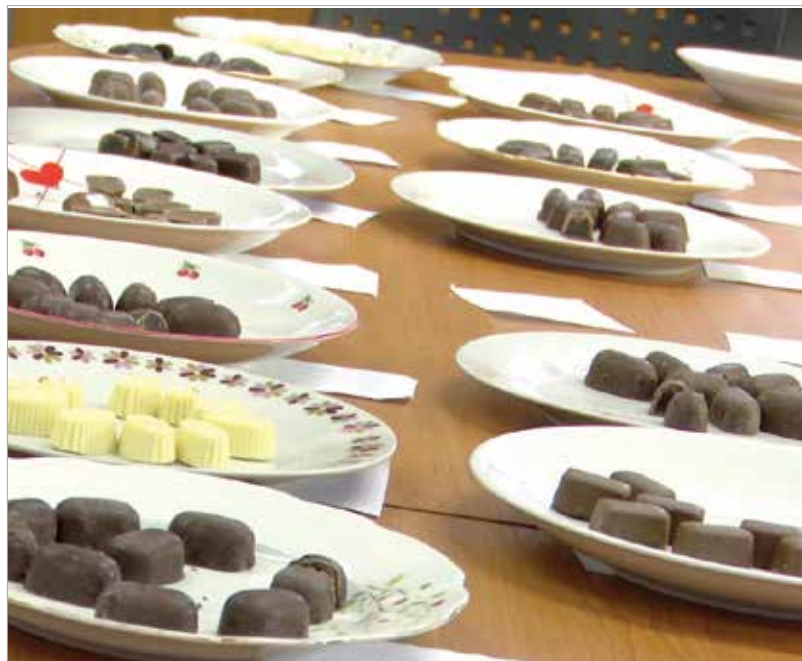
Szaloncukrokat tesztelt az fmc.hu szerkesztősége

Először bekötött szemmel kóstoltunk, hogy egyáltalán felismerjük-e az ízt. Nem árulok el nagy titkot, ha azt mondom, hogy volt szaloncukor, melynek nyomokban sem emlékeztetett az ízvilága arra, amit