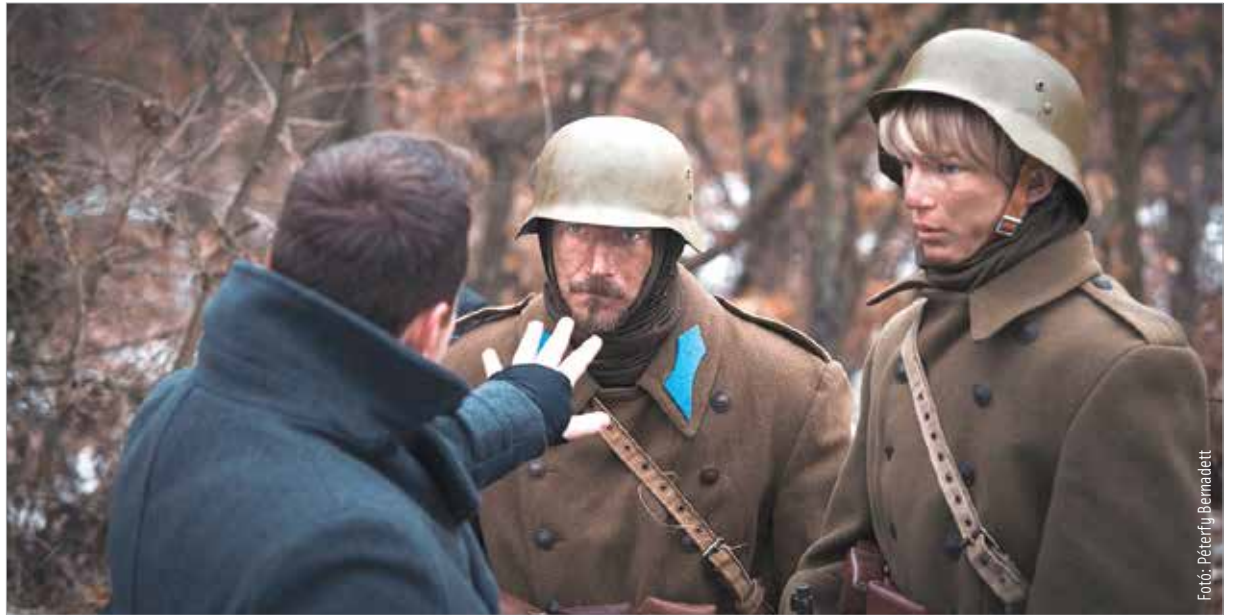
A film négy magyar katonáról szól, akik beássák magukat a lövészárokbba

A film főszereplői fiatal katonák, akik a II. világháború idején szolgálnak, akkor, amikor a szovjet