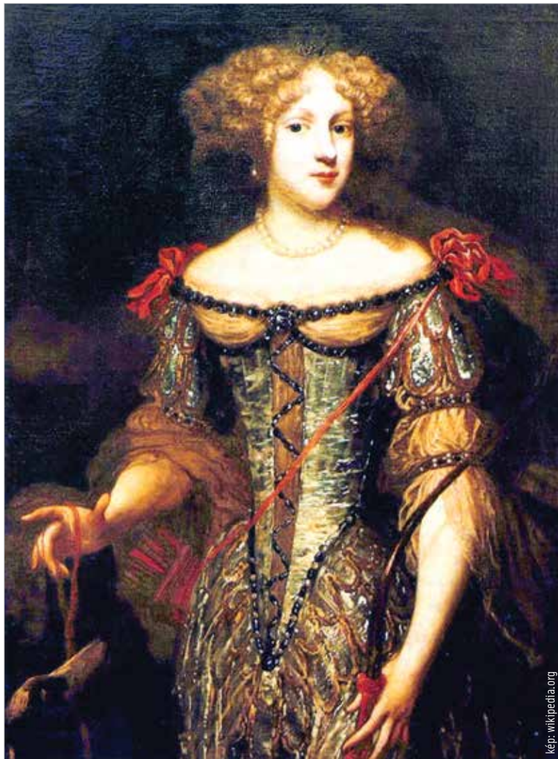
Liselotte von der Pfalz

Erzsébet Sarolta pfalzi hercegnő, azaz Liselotte von der Pfalz (1652–1722), a Napkirály öccsének második felesége kiterjedt levelezést folytatott. A zömében németül, kisebb részben franciául írt hozzávetőlegesen hatezer leveléből mintegy ötezer fennmaradt. A hercegnő hagyatékában található egy 1708-ban keltezett levél, melyben a heidelbergi kastélyban töltött gyermekkoráról számol be. Leírása szerint az 1660-as években a Neckar-parti város kastélyában gyertyával ékesített fenyőfát állítottak karácsonykor. Jelenlegi tudásunk szerint e leírásban találkozunk először a fenyőállítás említésével. E bensőséges szokás a német tartományok udvaraiban hamarosan elterjedt. A szorbok által is lakott szászországi Zittauban például 1737-ben annyi feldíszített, gyertyás karácsonyfát állítottak, ahány megajándékozott személy volt a családban. Lukács László a következőképpen ír a karácsonyfa elterjedéséről: „Az ajándékokat a karácsonyfák alá helyezték. Goethe még diákkorában, 1765-ben Lipcsében ismerkedett meg a karácsonyfával. Ennek a német nyelvterületen való gyors elterjedésében a Werther szerelme és halála című,