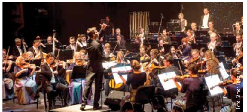
A professzionális működés állami támogatással is jár

ban már huszonnyolc álláshellyel és 258 milliós önálló költségvetéssel – ebből mintegy 245 millió forint önkormányzati támogatással – kezdtek a szimfonikusok az évadot. 2019 áprilisában már harmadhatan, augusztustól pedig negyvenöt dolgoznak a zenekarnál. A többéves munkának köszönhetően a zenekar minden jogszabályi követelménynek megfelelt, így január elsejétől a minősített zenekarok „klubjába” fog tartozni – ez komoly állami támogatást is jelent. Cser-Palkovics András polgármester a város önkormányzata és a közönség nevében is megköszönte mindenki munkáját, akinek része volt az Alba Regia Szimfonikus Zenekar minősítésének elérésében. További sok sikert is kívánt a tagoknak, akiket karácsonyi hangversenyükön, majd az új évet köszöntő koncerten hallhat legközelebb a közönség.