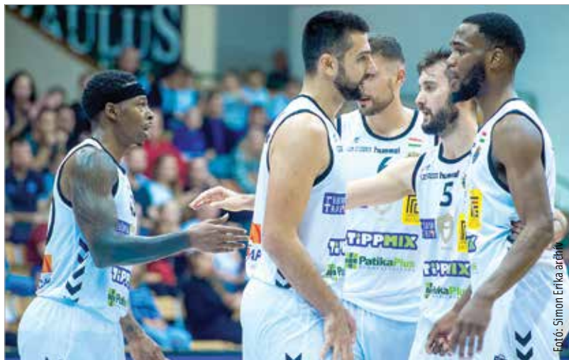
Nekirugaszkodnak az utolsó két meccsnek, jó finisben bízva