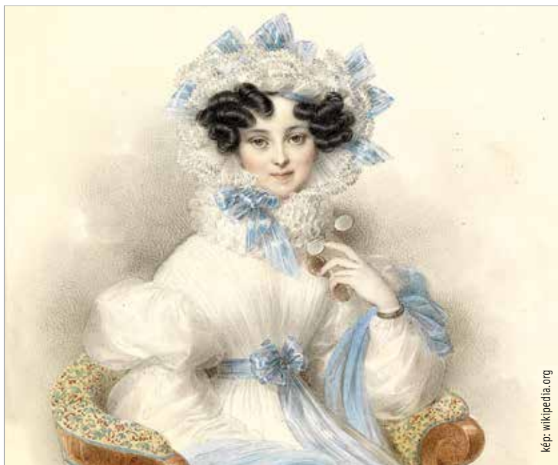
Henriette von Nassau-Weilburg

Podmaniczky Frigyes naplójában arról is tanúskodik, hogy szülei honosították meg Magyarországon a karácsonyfa-állítás szokását, ami – pesti házuk és aszói kastélyuk látogatói révén – az 1840-es évek már általánosan elterjedté vált: „Elérkezvén karácsony napja, hat órakor háromszoros csengetés hirdette a mi karácsonyfánk megérkezését. Mi, gyermekek – öten voltunk – egy szoba közepén elhelyezett nagy asztalon, mindegyikünk külön megtalálta karácsonyfáját s az a körül csoportosított különféle