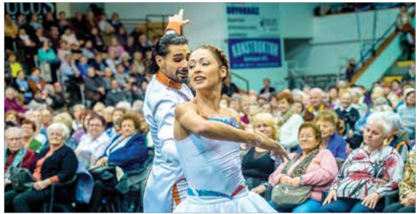
A Székesfehérvári Balettszínház a Diótörő egy részletét adta elő

A karácsonyi műsor idei vendége Poór Péter, a magyar zenei paletta egyik legsokoldalúbb művésze volt. A Magyar Televízió 1967-es táncdalfesztiválján tűnt fel az Utánam a vízözön című dallal. A magyarországi fellépéseken kívül végigtornázta Európa sok országát.