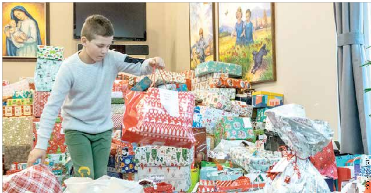
Az ajándékok között vannak játékok, ruhaszárító, gördeszka, edények, játékmaci, drón, étkészlet és sok minden más