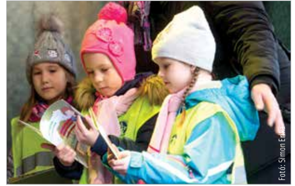
Fotó: Simon Erőss