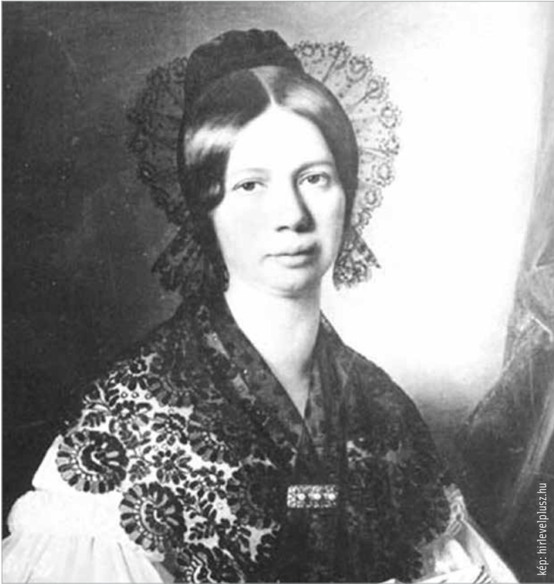
Mária Dorottya Württemberg hercegnő

ajándékokat. Még most is előttem lebeg e szeretetteljes kép, az apánk komoly, áhítatos magatartása, az anyánk jószágos tekintete, a repeső öröm a gyermekarcokon, melyeknek pírján megtört a viaszgyertyák halvány fénye. Az est azzal telt el, hogy mindegyikünk apróra megvizsgálta a nyert ajándékokat,