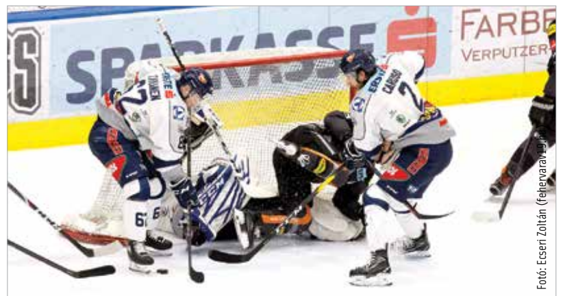
Ellenállhatatlan teljesítménnyel hangolt az év utolsó meccseire a Volán