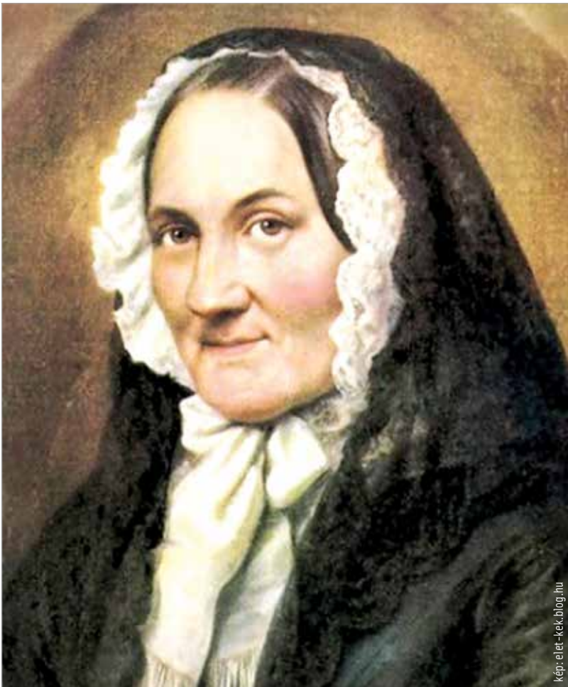
Gróf korponai Brunsvik Teréz (1775–1861.) a magyar reformkor kiemelkedő személyisége, az első magyarországi óvodák, azaz kisdédóvók megalapítója, a magyar nőnevelés támogatója

Ennek jegyében kívánok minden kedves olvasónknak áldott ünnepet!