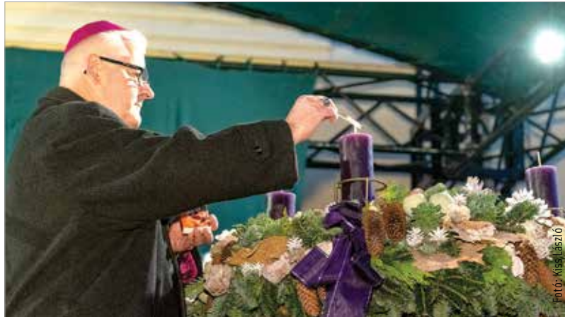
„Az Istentől kapott lelki öröm akar másokat is örvendezőnek látni”

A megajándékozott ember örömeivel akarunk másoknak örömet szerezni, benső gazdagságunkból akarunk másokat is részesíteni. Túlsorduló örömünk éri el társainkat. Az Istentől kapott lelki öröm akar másokat is örvendezőnek látni. Itt már nincs semmi kényszerűség, semmi számolgatás, semmi aggodalom: ki ne felejtsek valakit! Itt öröm van és az öröm áradása. Csodálatos tapasztalat! Jó látni az arcokon megjelenő mosolyt, a kisimuló ráncokat, a megenyhülő tekinteteket. És jó tudni, hogy Isten karácsonyi ajándéka, hogy mi az ő szeretetét adhatjuk tovább. Sugározzuk Isten szeretetét mindenkire a lélek igaz örömeivel, hogy életünk Istennek dicsőségére, embernek örömére és békességére legyen. Mert karácsony ünnepe küldetést jelent, egy életformát és nem pusztán egy szép ünnepet, egy évben egy-két szép napot az