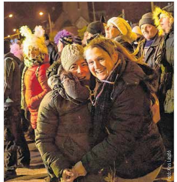
Volt zene, de volt tánc is!