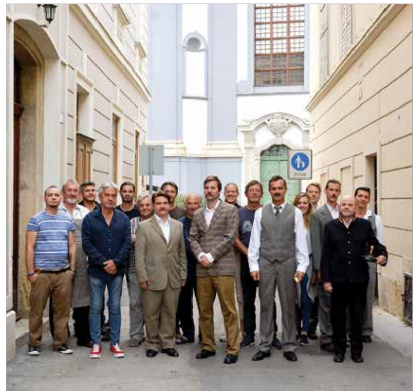
A stáb egy része, köztük sokan fehérváriak

Székesfehérvár önkormányzata támogatja a filmet, azonban ahhoz, hogy el tudjuk készíteni, még szükség van támogatókra. Bizakodó vagyok, mert azt hiszem, ez egy fontos téma, és fontos, hogy beszéljünk róla, hogy a következő nemzedéknek is át tudjuk adni nagyszüleink, dédszüleink történetének legfontosabb, legmeghatározóbb mozzanatait.