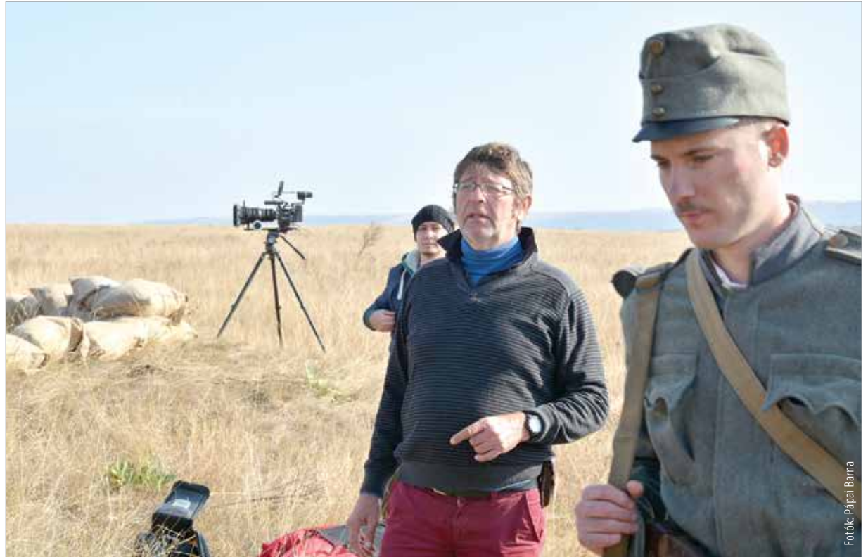
A film már forog, a rendező pedig bizakodik, hogy további támogatások segítségével be is tudják fejezni

anon és a bemutatót is 2020. június negyedikére tűztük ki, a békediktátum századik évfordulójára, bizony azt tapasztaltam, hogy ez a tény nehezítette a támogatók megnyerését. Pedig nincs benne állásfoglalás. A filmből megtudjuk, hogy Magyarország vasútállomásai – így a fehérvári is – tele voltak olyan vagonokkal, ahol ideiglenesen elszállásolták a környező országokból kiutasított vagy elmenekült magyar nemzetiségű embereket – mindez még a trianoni békediktátum előtt. A film záróakkordja pedig az a kávéházi jelenet, amikor a harctéri veteránok megtudják, hogy az ország nagy részét elcsatolták. Állnak tanácsalanel, és ekkor azt mondja Sipos Gyula, a tizenhetesek egykori parancsnoka, aki akkor már befejezte katonai pályafutását, hogy nem tehetünk mást, mint imádkozunk. Ekkor elkezdti imaként szavalni a Himnuszot.