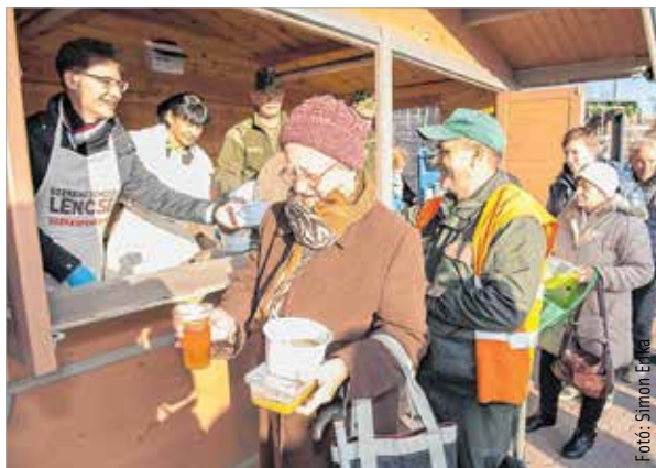
A hagyományokhoz híven egy tál lencsefőzelékkel és meleg teával várta, kínálta a fehérváriakat az Alba Plaza előtt Cser-Palkovics András polgármester valamint a város és a megye önkormányzati képviselői