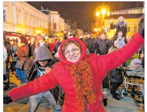
Volt, aki maskara helyett csupán a jókedvét hozta a Fő utcára