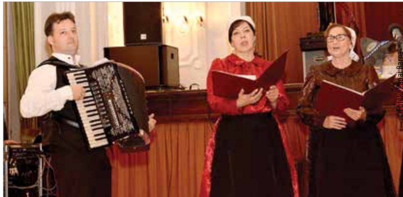
Szári és mányi német nemzetiségi csoportok léptek fel az esten

Szombat este találkoztak a megye sváb hagyományait őrző bálozók a Szent István Hitoktatási és Művelődési Házban. A sváb batyus bált kilencedik alkalommal rendezték meg.