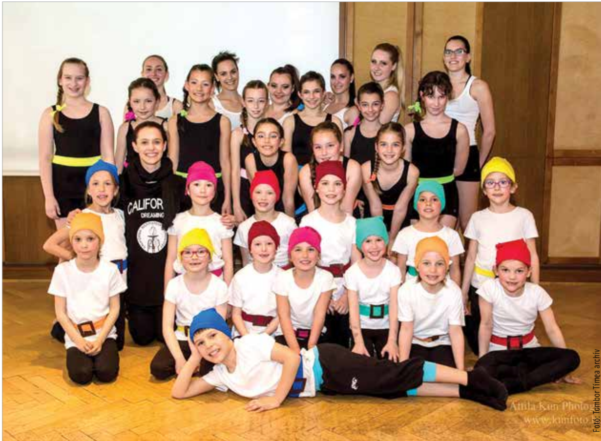
A táncot nem lehet elég korán kezdeni!

táncot. Viszont ha lazábbak egy kicsit az órák, akkor könnyedebbek a fiatalok és egysze-