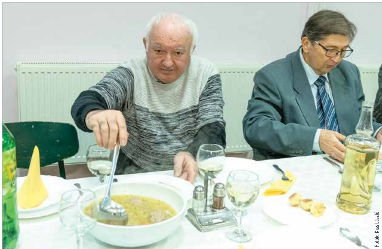
A malacragulevesnek nagy sikere volt

Az asztalokat a nagyteremben precíz sorokba rendezték és megterítették a gondos férfizek, hogy a mise után már csak ünnepelni kelljen. A beszélgetés morajlását csak a poharak csilingelése törte meg. Ahogy az idősebbek mondták: a szódában nincsen nóta, ezért fogj jobban a bor és a pálinka! „Nemcsak az egyedülálló, hogy egy közösség manapság még tartja a népszokást, hanem az is, ahogyan ezek