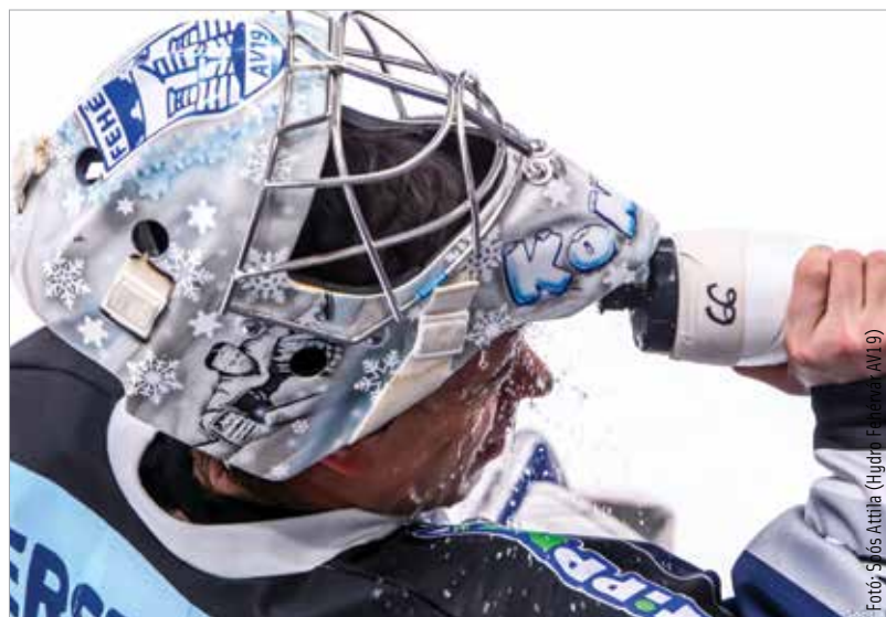
Fel kell frissülnie a Volánoknak a középszakaszra, a rájátszás eléréséhez kiegyensúlyozott teljesítmény kell!