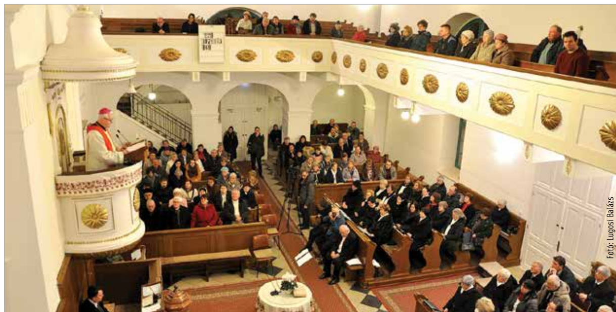
Isten szeretete formál bennünket – hangzott el az Ökumenikus imahét záróeseményén

Másnap a Baptista imaházban kerekasztal-beszélgetéssel folytatódott a programsorozat, melynek a reménység volt a témája. A harmadik napon az Evangélikus templom telt meg, ahol istendicsőítést és zenés istentiszteletet tartottak. De énekszó csendült fel vasárnap este a Széchenyi úti református templomban is, ahol az ökumenikus imahét záróeseményét tartották, és ahol a város katolikus, református, evangélikus és baptista lelképásztorai imádkoztak együtt a hívőkkel.