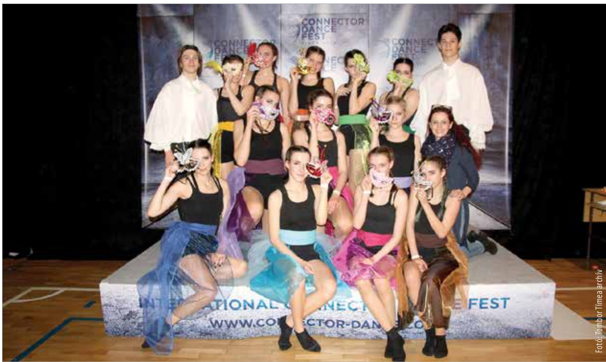
A siker kulcsa az elhivatottság

Kell, mert ha nem jó a technika, muszáj, hogy javítson rajta a