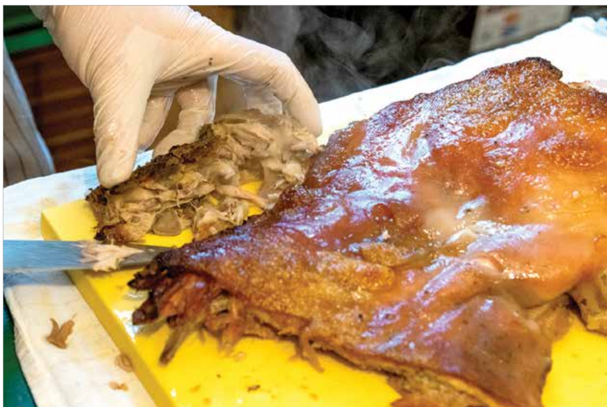
A kemencében sült malac bőre olyan ropogós volt, mint a Dobos-torta tetején a karamella

József először a kemencében fedő alatt – vagy ha az állat nem fér be, akkor fólia alatt – süti három-négy órát. Közben sörrel locsolgatja és a pompa kedvéért egy kis szalonnával is átkeni. Az utolsó lépés a piritás, ami nagyjából húszperces-félórás művelet. A húshoz párolt