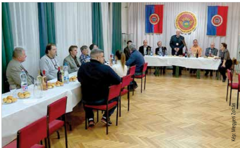
A Vince-napi mustra az év első borrendi eseménye