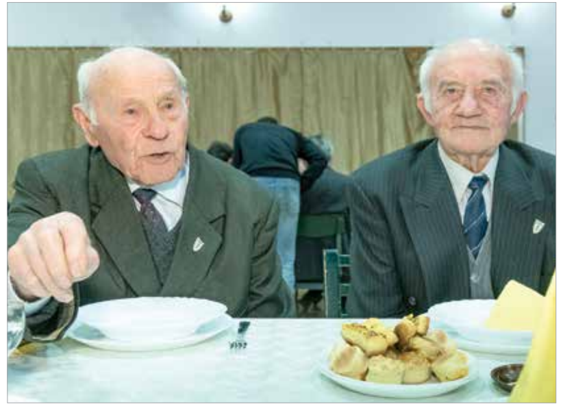
Az asztal mellett a régi történetek szinte életre keltek