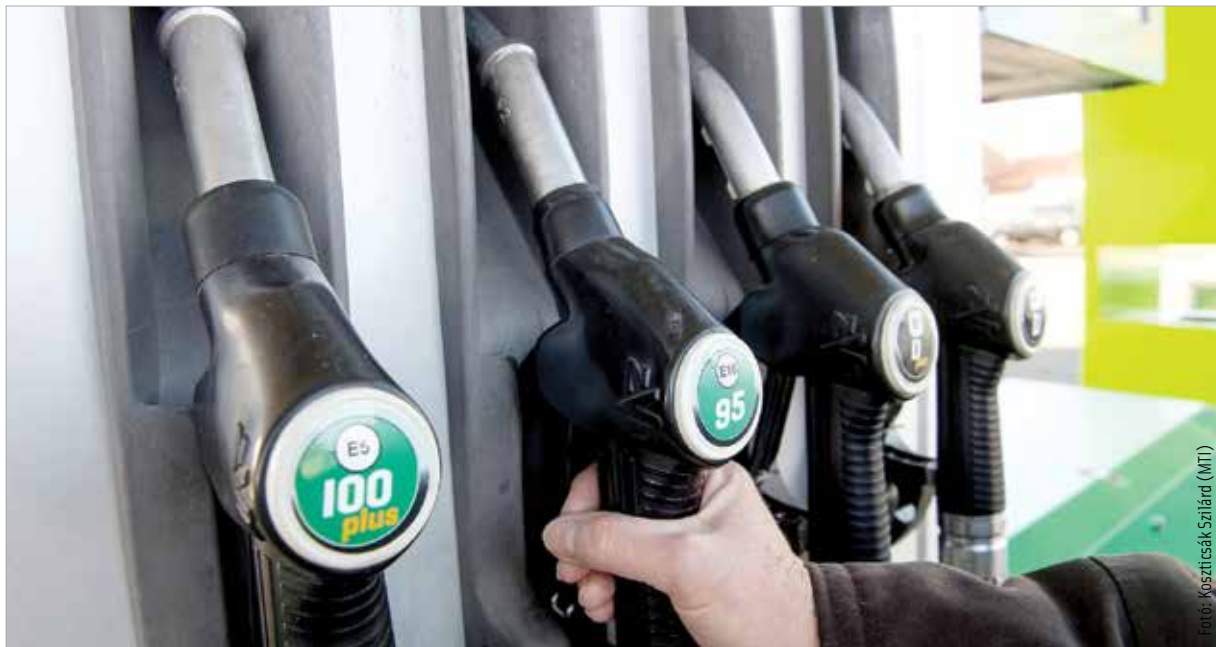
A magasabb bioetanol-tartalmú, E10-es üzemanyag főleg a régebbi autóknál okozhat problémát