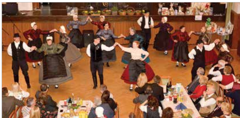
Német zenével, tánccal és étellel csábított a Szent István-terem