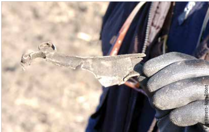
Nor-pannon szárnyas fibula az első századból. A ruhakapcsoló tűt a terület őslakosai, az eraviszkusz törzshöz tartozó kelták használták.

Több mint tíz éve volt az utolsó nagyobb legális keresés a szabadbattyáni területen, mely Seuso feltételezett palotájaként vált ismertté. Tizenháromezer négyzetméteres római kori épületkomplexumot rejt a föld, az épületnek a feltárás során nem került elő a vége, így további érdekességeket rejthet még a lelőhely. Fejér, Pest és Veszprém megye múzeumbarátai, régészei és fémkeresős önkéntesei végeztek kutatást a közösségi régészeti nap keretében. „Felmérjük, hogy az elmúlt tíz, húsz, harminc évben milyen károk érték az illegális fémkeresők által ezt a lelőhelyet. Szeretnénk a leleteket megmenteni: van egy ilyen megelőző célja is a kutatásnak, hogy az anyag valóban közkinccsé váljon, bekerüljön a múzeumokba, kiállításokon, különböző kiadványokban mindenki által megismerhető legyen. Ne