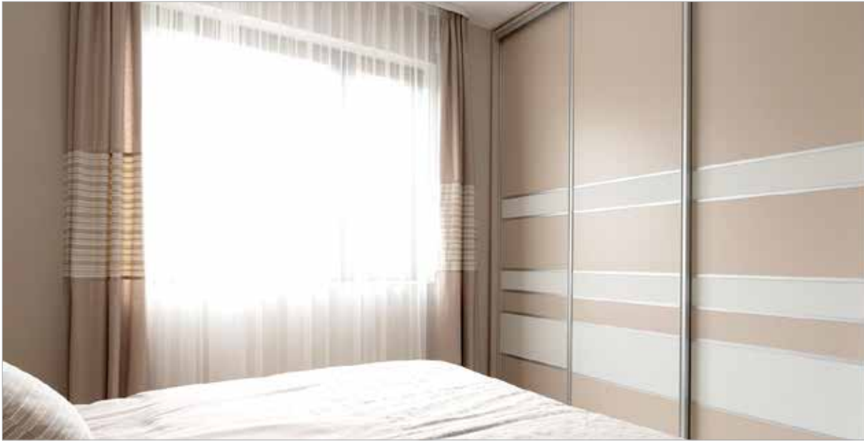
A földszínek és a matt felületek jöttek divatba

Előbbiben sok fehérnemű elfér, utóbbiba pedig tehetünk akár munkásruhát, pulóvert: „Azért fontos, hogy a szabványos gardróbmélység, a hatvan centi meglegyen, hogy a vállfára akasztott ruhák teljesen elférjenek benne.”