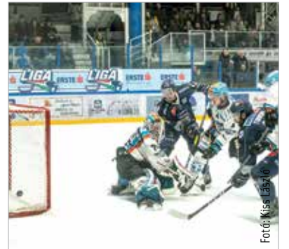
Ellenállhatatlanul kezdte a középszakaszt a Volán, a Linz ketrecébe háromszor is bejuttatta a pakkot

A jó formát itthonra is átmentették: a hatszapos csoport papíron egyik legerősebb együttesét, a Linzet fektették két vállra az Ifjabb Ocskay Gábor Jégcsarnokban. Simábban alakult a meccs, mint idegenben, végig vezettek a mieink, végül 3-1-re győztek. Hét pontjával (ebből kettő bónusz) az alsóház harmadik helyén áll a Volán, ami negyedöntős tagságot ér. A válogatottak programja miatt csak a jövő héten folytatódhatnak az EBEL küzdelmei.