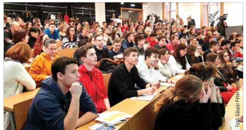
Január végén több száz leendő hallgató vett részt a Corvinus nyílt napján