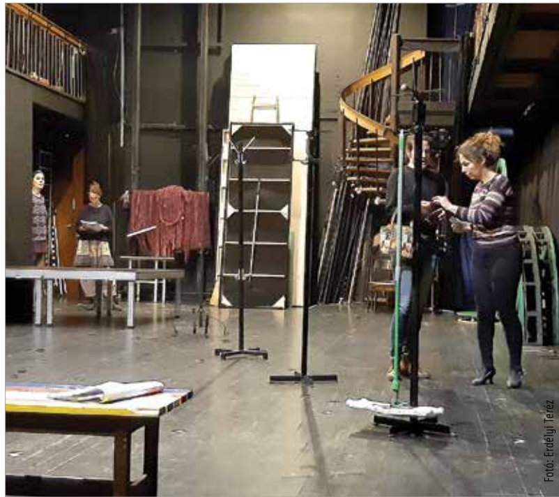
A különleges környezetben játszódó történet huszonegyedik századi problémákra keresi a választ

„Igazából most érte utol a történelem magát a darabot illetve a társadalmi fejlődést. Ez a darab nagyon keményen beszél a nők helyzetéről, a nők elnyomásáról, arról, amit mostanában divatos szóval Stockholm-szindrómának szoktunk nevezni: hogy az áldozat