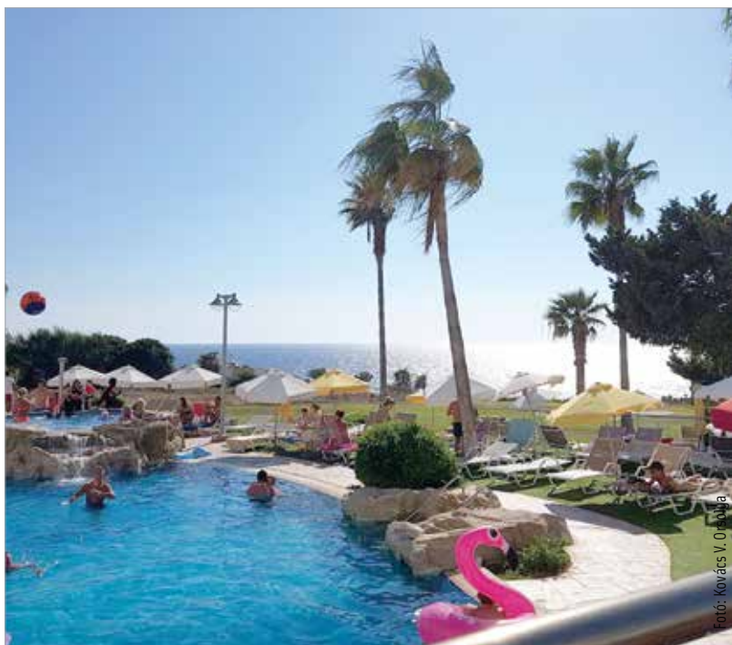
Ciprus a kedvelt úti célok között szerepel

zó napsütés, azürkék tenger – a legtöbben ilyen látványra vágyunk a vakáció ideje alatt. Népszerű úti cél a görög szigetvilág, a török riviéra, de sokan utaznak Egyiptomba és a Kanári-szigetekre is. Érdemes ezeket az utakat előre lefoglalni, hiszen akár harminc százalékot is meg lehet spórolni, ha előre gondolkodik a család! Bár az előfoglalási szezon első periódusa véget ért, később is számíthatunk még akciókra, kedvezményekre.