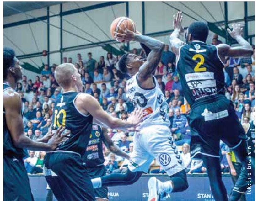
A Falco Szombathelyen is túlerőben volt az Alba Fehérvárral szemben