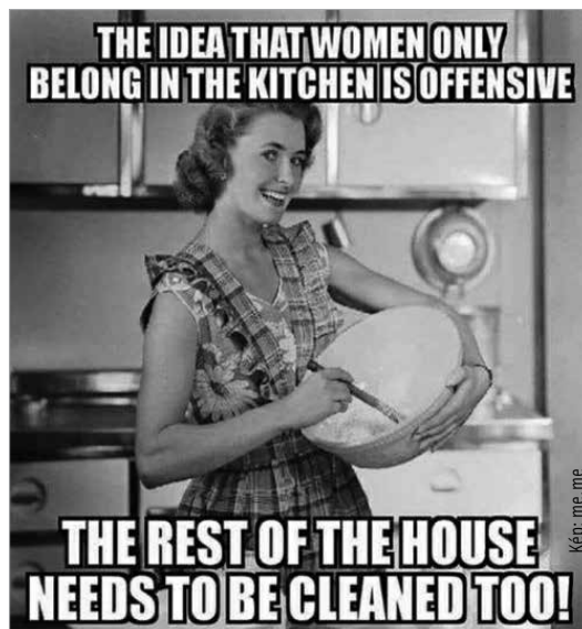
Az a gondolat, hogy a nőnek a konyhában a helye, sértő: a ház többi részét is ki kell takarítani! – hirdeti ez az internetes mém a közösségi oldalakon

Ideáljuk a modern nő, akinek elsődleges a család és a férj jóléte, kiszolgálása. Eszményképük az ötvenes évek nyugati társadalma, ahol a feleség nem a munkahelyen, hanem otthon, a háztartásban és a gyermeknevelésben teljesedett ki. Szerintük ezt az életstílust ma is meg lehet honosítani, az pedig, hogy nem az egyéni karriert választják, nem jelenti számukra az olvasás, a művelődés vagy a közéleti kérdésekben való állásfoglalás hiányát. A Tradwife követői szerint a válások növekvő számának egyik fő oka a nők munkavállalása. Ezt az oxfordi székhelyű European Sociological Review által készített tanulmány is kimutatta: a dolgozó nők háromszor nagyobb valószínű-