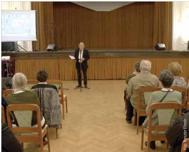
A Csoóri Sándor Társaság gondozza a költő hagyatékát