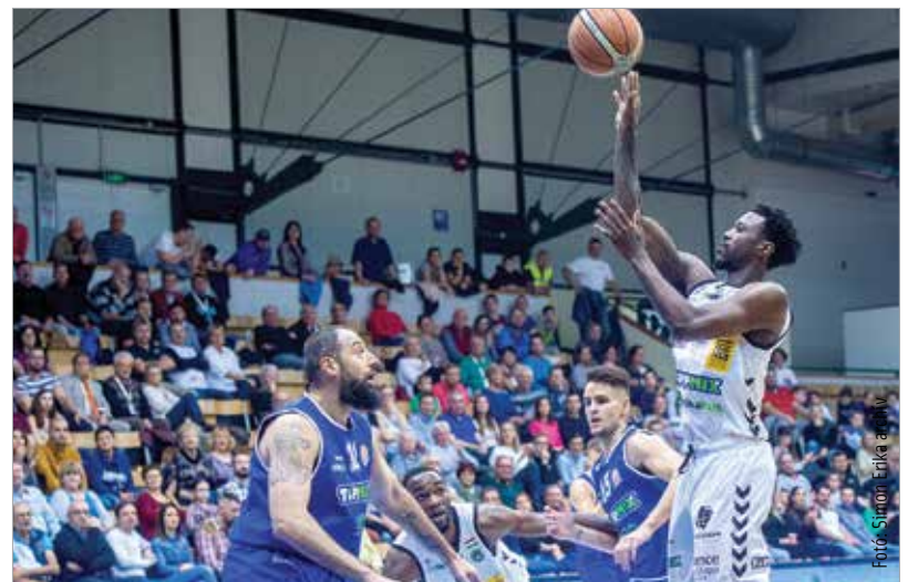
Itthon jól ment a Jászberény ellen, ez a cél idegenben is

pedig jó ráhangolás lenne, ha a jászberényi csarnokot győztesen hagyná el az Alba. Ősszel 107-72-re verte a sereghajtót Fehérváron, ez volt az egyetlen(!) meccs az egész szezonban, amelyen az ellenfél nem dobott legalább nyolcvan pontot. Azóta a Jászberény változott, edzőt cserélt, a folytatásra pedig nyilván alaposan rákészült. Reméljük, játékban és főleg védekezésében az Alba is fejlődött a szünet alatt! Kell a stabilitás, mert most aztán intenzív program kezdődik: márciusban hét bajnoki vár Ljubicsecsikra, akik a hónap végére alighanem már tudni fogják, reálisan vágy-nak-e a legjobb öt közé az alapszakasz végén.