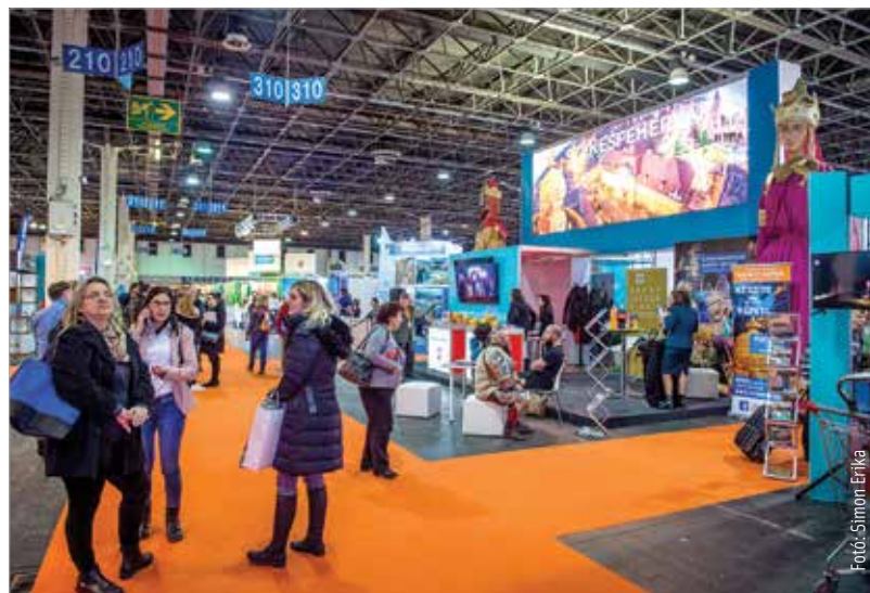
Látványosan nagy standdal és kínálattal várta a látogatókat Székesfehérvár