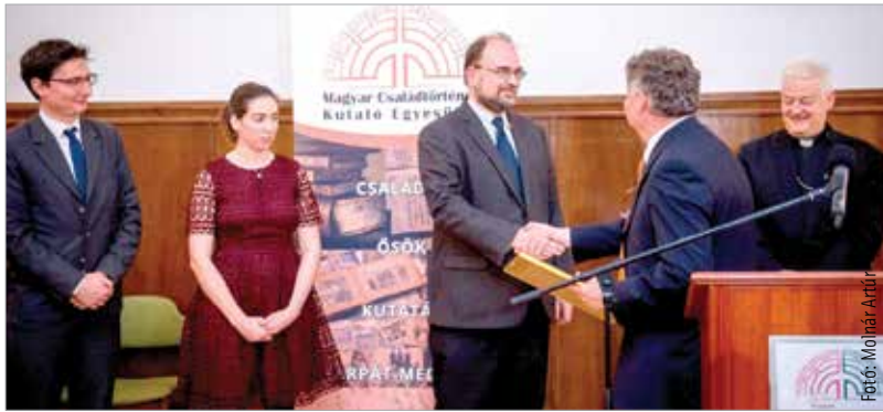
A kutatási intézmények fontos szerepet töltenek be korunkban is

„Sokan sodródnak szerencsét és megélhetést keresve a távolba – s közben elveszítik saját gyökereiket. A kelet-közép-európai népek különösen veszélyeztetettek e téren, hiszen évtizedekig szenvedtünk olyan hatalom alatt, amely a „múltat végképp eltörölni” akarta. Ez gyengítette a társadalomban a hagyományok ismeretét. A harminc éve hirtelen nyakunkba szakadt szabadság pedig talán sokkal többeket indított szerencsevadászatra, mint másutt.” – tette hozzá Spányi Antal megyés püspök.