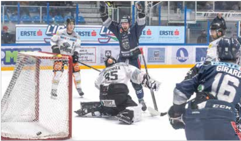
Szeptemberig kell várni az újabb gólörömrre