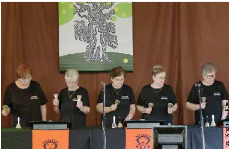
A legtöbben csoportosan neveznek

Két, reggeltől estig tartó bemutatónapot tartanak, ennek keretében ad műsort a több mint kilencven csoport és egyéni jelentkező. A legtöbben csoportosan neveznek. Őket még egy bemutatónapon, majd a gála keretében láthatja-hallhatja a közönség Székesfehérváron.