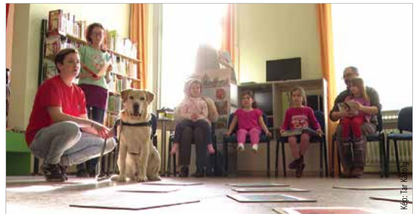
Fontos, hogy minél fiatalabb korban elsajátítsák a gyerekek a helyes állattartás alapjait

A foglalkozások ezzel még nem értek véget, hiszen az egyesület tagjai tervezik a kutyás délutánok folytatását.