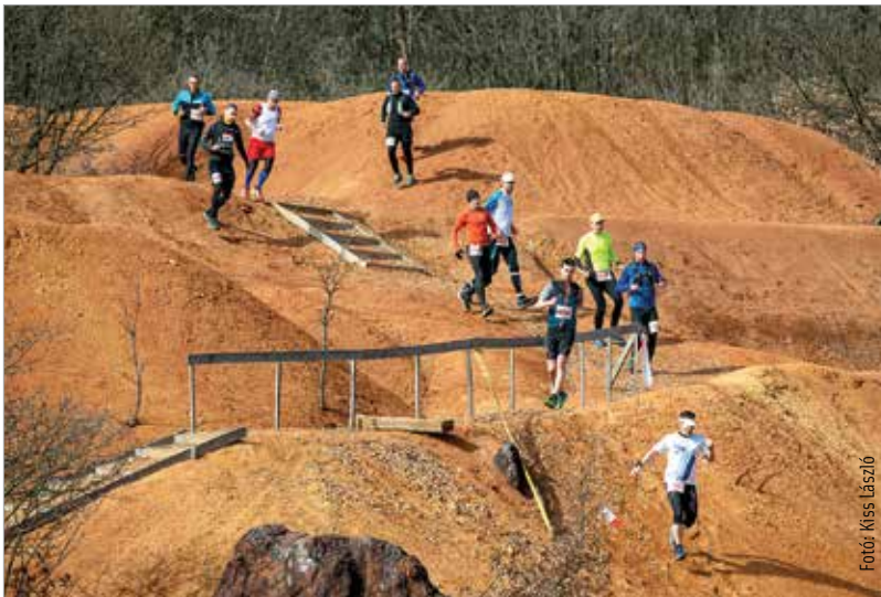
A gánti verseny útvonalának leglátványosabb része a hajdani bauxitbánya területén vezetett

zott kirándulólhelyen le-fel kocogni a vörösgyagyas dombokon olyan élmény, ami máshol az országban nem adatik meg. Ezt még élvezték is a futók, ám az erdei kapaszkodókat és lejtőket már nem feltétlenül. Tizenhárom vagy huszonöt kilométert futottak az indulók, a gyerekeknek és családoknak rövidebb, három kilométeres táv volt a kedvcsináló. Befutóérem természetesen mindenkinek járt. Ráadásul az Alba Triatlon, mint versenyszervező gondoskodott róla, hogy meleg étel és ital nélkül senki ne maradjon, így a több mint ötszáz futó valóban teljes élménnyel gazdagodott.