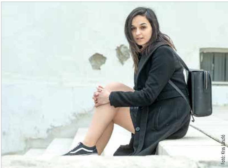
Fotó: Kiss Jászó

Óvatosan fogalmazva is egyértelműen jó véleményt kaptatok A dal döntőjében a közönségtől, hiszen a Mostantól című számotokat ítélte a közönség a legjobbnak. Ez a diadal viszont idén először nem jelenti azt, hogy részt vesztek az Eurovíziós dalfesztiválon. Az is nagy lehetőség, hogy támogatást kaptunk a folytatásra, építke-