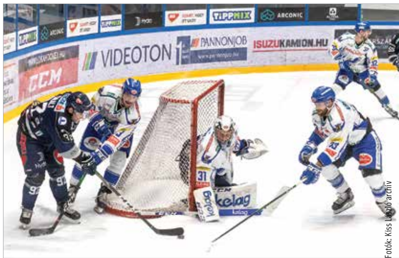
Tekintettel az ellenfelek költségvetésére, nem rossz teljesítmény, hogy csak három ponttal maradt le a rájátszásról a Volán az EBEL-ben. De tény, hogy többet vártunk!

A probléma az, hogy nagy volt az amplitúdó, mert meglepő pofonokba is beleszaladt az együttes – a Magyar Kupa döntőjében például a Ferencváros intézte el csúnyán a Volánt. „Természetesen senki sem mentesül a felelősségvállalás alól! A klubvezető, a szakmai vezető, az edző és a játékos együttesen felelős a szezonért. De tény, hogy vannak olyan dolgok, amelyek inkább a játékosok fejében és a munka iránti elkötelezettségében, hozzáállásában dőlnek el. Természetesen a vezetők felelőssége kiterjed arra, hogy egy problémára időben tudnak-e reagálni.” Utóbb kiderült, egy, a volt vezetőedzőt érintő körülmény is kedvezőtlenül hatott: „El kell ismerjem a felelősségünket abban, hogy, amikor kiderült, hogy az alapszakasz végén leváltott vezetőedző, Hannu Järvenpää nagyon komoly családi problémákkal