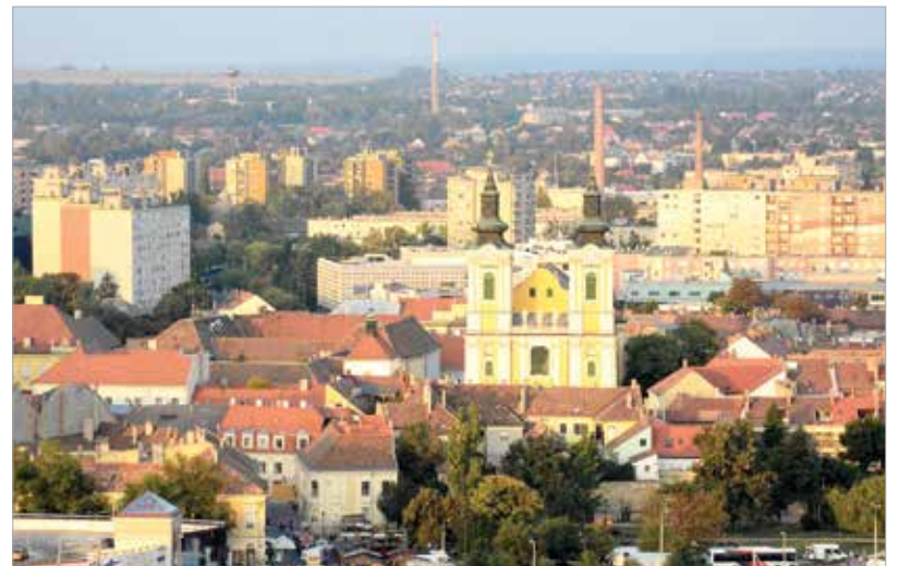
Fontos feladatot jelent a történelmi belvárosban a lakók és a vendéglátó egységek közötti feszültség csökkentése

együtt a körzetekre vonatkozó fejlesztési elképzeléseinket. Ezek teljesülése nagyban függ a város gazdaságának alakulásától, és fontossági sorrend alapján kerülnek be a következő évek költségvetésébe. A belvárost és tágabb környezetét is érintő nagy intézményfelújítás is kezdődött az elmúlt hónapokban. Elindult a Szent István Király Múzeum Fő utcai épületének teljes felújítása, amely az Árpád-ház-program keretében valósul meg Székesfehérváron. A kormányzati támogatással létrejövő modern múzeumi tér elsőként a Királyok és szentek – az Árpádok kora című kiállításnak ad majd otthont várhatóan 2022-ben. A belváros és környéke az egész város szempontjából kiemelt terület, azonban itt is nagyon sokan élnek együtt a városközpontok jellemző problémáival. Nagyon fontos feladatot jelent a történelmi belvárosban a lakók és a vendéglátóhelyek – valamint