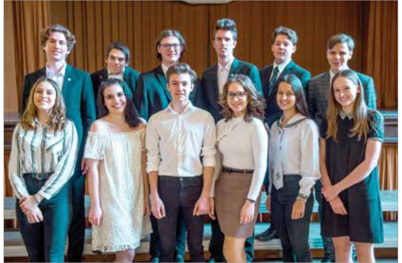
Tizenketten jutottak a döntőbe, ők április tizennyolcadikán újra megmutathatnak valami fontosat önmagukból

Ez a fajta önkifejezés a versmondás műfaja által nyújtott egyik legszebb lehetőség. Akár leendő színészeknek, előadóknak, akár más irodalomkedvelőknek – talán ezzel lehetne összefoglalni leginkább a verseny hangulatát. „Elmélyülésre ad alkalmat, befelé figyelésre, csendre, amire nagy szükség