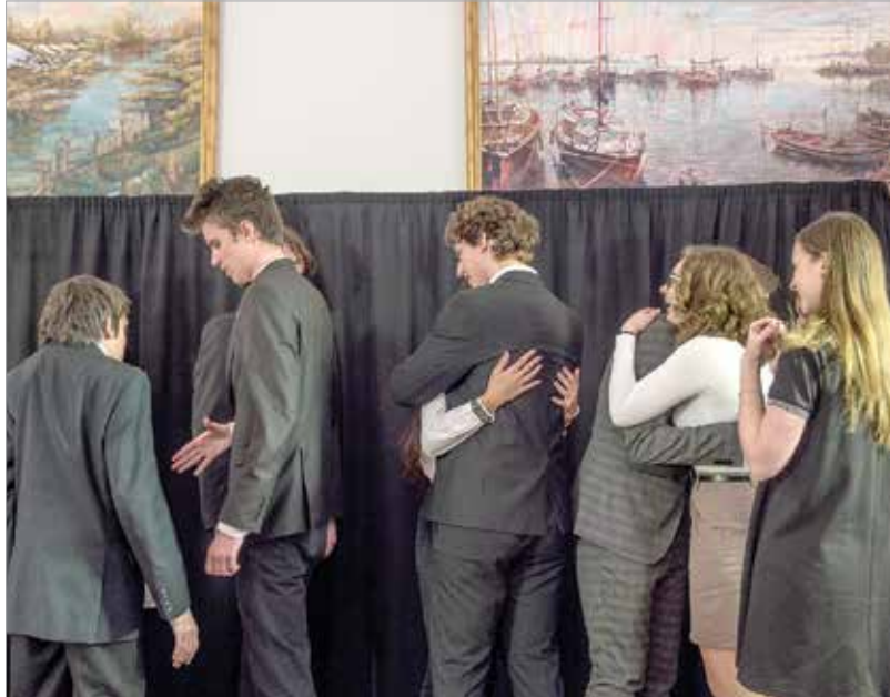
Egymásnak is drukoltak a fiatalok

Őn is megismerheti a versmondókat: a XI. Fehérvári Versűnnep elődöntőjét a Fehérvár Televízió március 13-án, pénteken este 20.40-kor, majd ismétlésben március 15-én, vasárnap 14.40-kor tűzi műsorra.