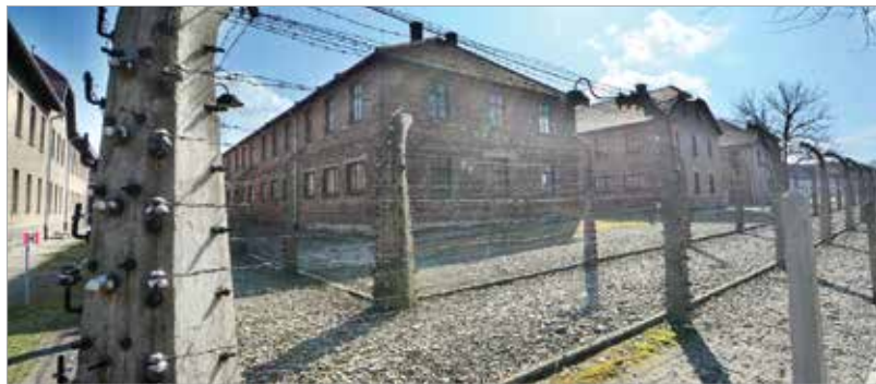
A fehérvári zsidó lakosság töredéke tért csak haza: százharmincegyen vergődtek vissza a koncentrációs táborokból, száztizenkilencen pedig a munkaszolgálatból

polgárait is, székesfehérvári embereket, egész családokat kisgyermektől a nagyszülőkhöz. Fontosnak tartottam, hogy Auschwitz felszabadításának hetvenötödik évfordulóján a város teljes közössége nevében ezen a megrázó helyen hajtsak fejet emléküik előtt. Az emlékezés virágai és a holokauszt áldozatainak fehérvári emlékművétől hozott kövek elhelyezése kifejezése annak, hogy a veszteség városunk egészét érte. Személyes jelenlétemmel pedig elkötelezettségünket szeretném kifejezni amellett, hogy az áldozatok emlékét nem felejtsük. Nyugodjanak békében!”