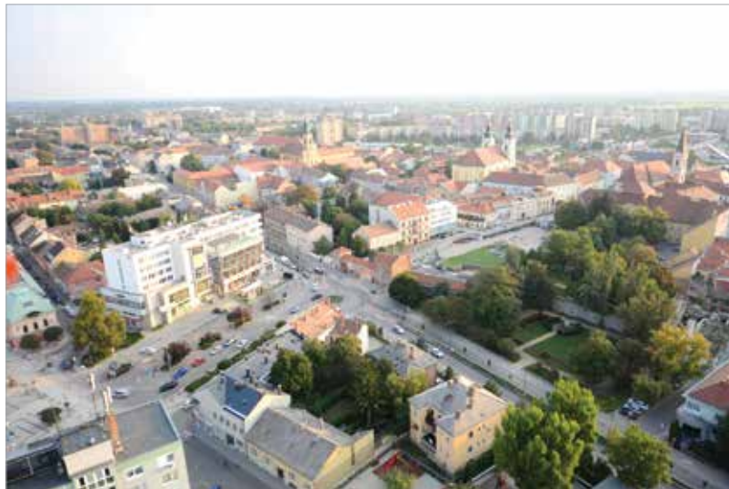
A parkolási rendelet módosításával próbálják tehermentesíteni a belvárost

A képviselői hivatás megkívánja az állandó jelenlétet, de szeretném a hétvégéket úgy szervezni, hogy az unokáimmal is lehessenek. Ugyan már nagyobbak, de szerencsére sokszor töltik nálunk a hétvégéket. Van továbbá egy több mint kétezer négyzetméteres kiskertünk, ahol az unokáknak termelünk vegyszermentes zöldségeket a férjemmel, és persze nyáron a befőzés is sok feladatot ad majd!