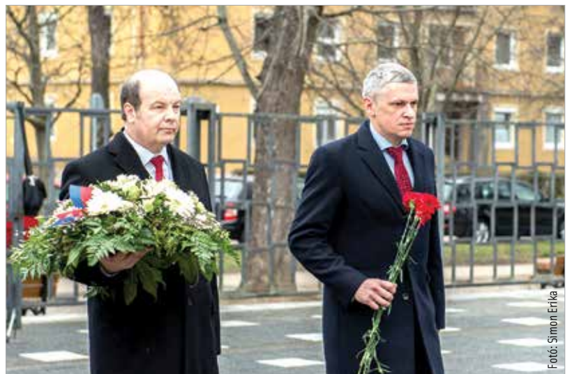
Székesfehérvár alpolgármestere és a nagykövet a Béke téri katonai temetőbe is ellátogatott, ahol koszorút illetve virágokat helyeztek el a sírkert központi emlékművénel a belarusz áldozatok tiszteletére

Panamarov nagykövet hozzátette: „Nagyon sok lehetőség van a két ország regionális együttműködésének erősítésére. A hivatalos látogatáson találkozhattam a város vezetésével és a gazdasági szereplők képviselőivel is.”