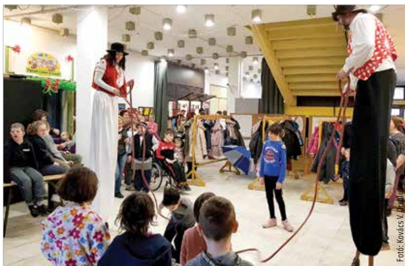
Elbűvölték a gyerekeket