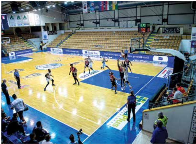
A nézők hiánya a sport halála, de egyelőre úgy tűnik, folytatódik a bajnokság