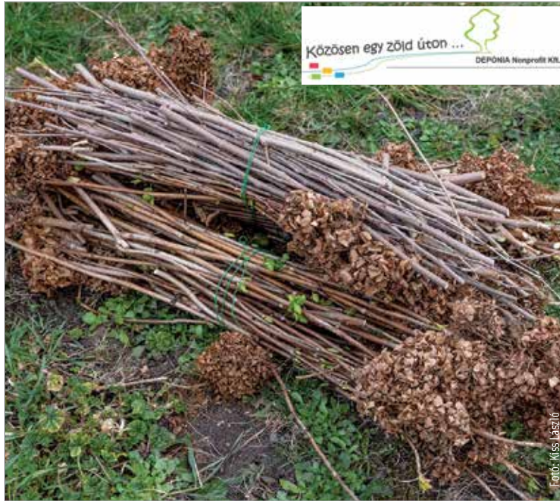
Érkezik a tavasz, kezdődnek a tavaszi munkák a kertben. A zöldhulladék hasznosításáról gondoskodnunk kell!

„Nem kell mást tenni, mint aprítani, összegyűjteni, levegőztetni és megfelelő állagúvá alakítani. A mikro-szervezetek elvégzik a folyamatot. Végül egy olyan szerkezetet kapunk, amit a növények könnyen felvesznek. Ez javítja a talaj vízmegkötő képességét,