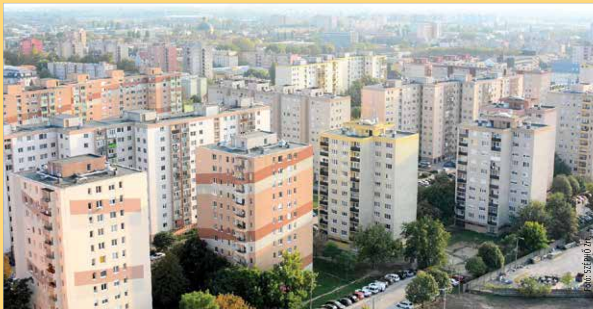
A fehérvári lakások nagy részében a Széphő Zrt. biztosítja a meleget

Számlavezető bankjánál igényelheti a csoportos beszedési megbízást. Az ügyintézéshez szükség lehet a SZÉPHŐ Zrt. Giro-azonosítójára (A11103413T207) valamint az ön nyolcjegyű vevő- (fizető-) azonosítójára, amely a számla harmadik oldalán található.