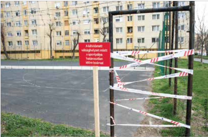
Fehérvár otthon maradt

Gábor történeteit hallhatják és láthatják a Fehérvár Televízió nézői és az fmc.hu oldalra látogatók. Újra megismerkedhetünk öreg néne özikéjével, a kiskondással, az özvegyasszony tehenével, megtudhatjuk, hogyan neveljük a szüleinket, a matematikatanárt, mi újság Mufurccal és Sírós Frukkal. A művészek – csatlakozva a Maradj otthon! felhíváshoz – megfogalmazták kérésüket, hogy lehetőség szerint vigyázzunk családunkra, önmagunkra, környezetünkre!