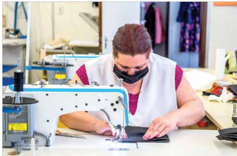
Az önkormányzathoz rengeteg felajánlás érkezik. Az Árpád szakképző ruhaipari szakoktatói egyszerű használatos illetve mosható maszkokat varrnak a kórház számára.

Az önkormányzat a védekezésre és a járványhelyzet kezelésére a költségvetésből 629 millió forintot csoportosított át, valamint a Szent György Kórházban szakmai gyakorlatukat folytatató rezidensek és szakorvosjelöltek részére lakhatási támogatást nyújt több mint tízmillió forint értékben.