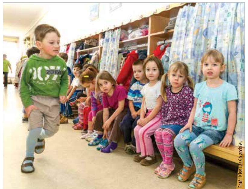
Ha nem körzeti óvodát választunk, akkor április tizenhetedikéig kell a választott intézménynek jelezni a szándékunkat telefonon vagy e-mailben