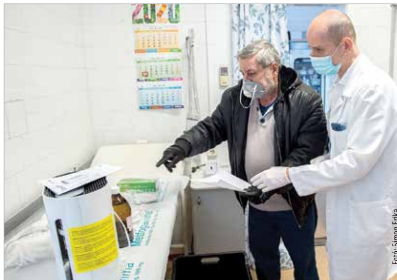
A fehérvári háziorvosok is megkapták a védőfelszerelést és a levegőtisztító gépeket

A Polgármesteri Hivatal a hét minden munkanapján folyamatosan ellátja az ügyfelek tájékoztatását. A koronavírus-járvány miatt kialakult helyzetben, a közösség érdekében személyes ügyfélfogadásra csak szerdai napokon, az Ügyfélszolgálaton van lehetőség 8 és 12 illetve 13 és 16 óra között. A hét többi munkanapján telefonon és e-mailben érhetőek el a hivatal munkatársai a 22 537 200-as számon illetve az ügyfélszolgálat@pmhiv.szekesfehervar.hu címen. Az alábbi irodák csak telefonon vagy e-mailben kereshetők: Adóiroda: adoiroda@pmhiv.szekesfehervar.hu Anyakönyvi és Vállalkozásigazgatási Iroda: 22 537 128, 22 537 209, 22 537 222, 22 537 239, anyakonyv@pmhiv.szekesfehervar.hu. KCR Iroda: 22 537 162, 22 537 175, kcr@pmhiv.szekesfehervar.hu. Környezetvédelmi Iroda: 22 537 133, 22 537 163, környezetvedelem@pmhiv.szekesfehervar.hu. Igazgatási Iroda: 22 537 109, igazgatas@pmhiv.szekesfehervar.hu.