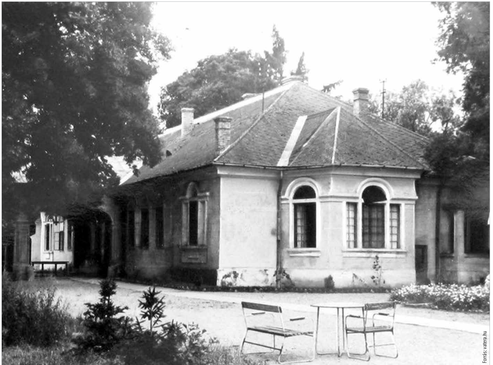
A Salamon-Voinovich-kúria egy ideig SZOT-üdülő volt – ezen a régi képeslapon is ebből a korából láthatjuk