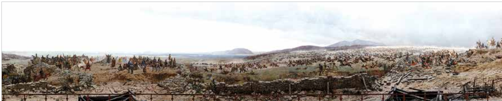
A magyarok bejövele

lódés mellett 1894. május 13-án, százhuszonhat esztendővel ezelőtt mutatták be. A magyarok bejövele című monumentális alkotás 1995-től az ópusztaszeri Nemzeti Emlékparkban teszi lehetővé az érdeklődők számára, hogy behelyezkedhessenek eleink életébe, s jelen legyenek azokban a pillanatokban, amikor a hon foglalása már csak egy karnyújtásnyira van. A körképen ábrázolt táj a Munkáctól keletre található Kendereske mellett emelkedő dombról azonosítható. A helyszínen 2013-ban lepleztek le egy emlékművet, a körkép kicsinyített, kőbe gravírozott másolatát.