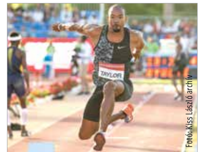
A tavalyi versenyen a kétszeres olimpiai és háromszoros világbajnok Christian Taylor negyedszer nyert hármassugrásban

A szervezők közleménye szerint „az újra-éledő nemzetközi atlétikai versenyprogram egyik első eseménye lesz Székesfehérváron a Gyulai István Memorial – Atlétikai Magyar Nagydíj.” A versenyre eredetileg július hetedikén került volna sor. A szervezők az új időpont kiválasztásánál figyelembe vették az elmúlt időszak történéseit, a koronavírus-járvány hatásait, a hazai és nemzetközi versenynaptár alakulását és a nemzetközi szövetség (WA) ajánlásait a nemzeti bajnokságok időpontja tekintetében. A WA áprilisban jelentette be, hogy idén az augusztus 8-9-i hétvégét teszi szabaddá a nemzeti szövetségek számára, hogy megrendezzék országos bajnokságaikat. Forrás: MTI