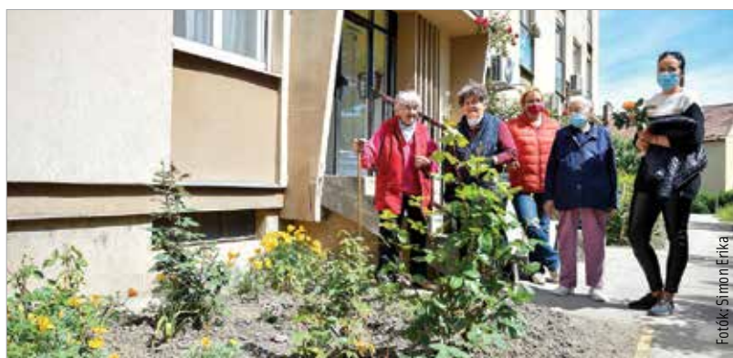
A kertrendezés elindult, de a szedreskertiek még több növényt fognak ültetni a Virágos Székesfehérvár program segítségével