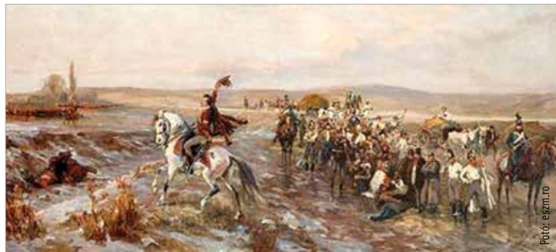
Bem és Petőfi Styka körképén