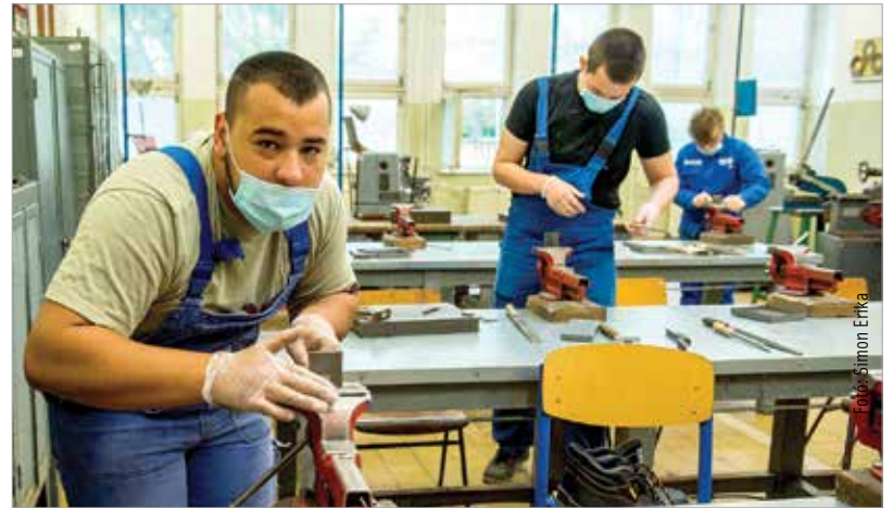
A héten már megkezdődtek a szakmai vizsgák a Székesfehérvári Szakképzési Centrum intézményeiben. Kedden a Bugátban, a Váciban, a Deákban és a Jákiban vizsgáztak a jövő szakemberei.

Az adatokból kiderül, hogy az előző év azonos időszakához képest egyelőre csak mérsékelt emelkedés tapasztalható az álláskereső számában. Fehérváron eddig közel ezer fővel nőtt az álláskereső száma a veszélyhelyzet meghirdetése óta – tudta meg lapunk Cser-Palkovics Andrástól. A meghirdetett veszélyhelyzeti települési támogatás keretében járó