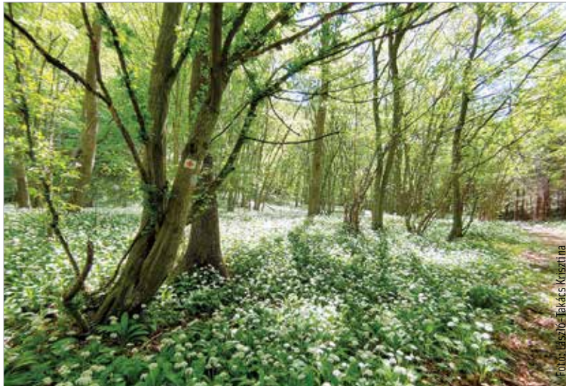
Ilyen meseerdő is van Fehérvár környékén!

Az arborétum és a vadaspark május nyolcadika óta szintén várja a látogatókat, bár a nyitvatartása