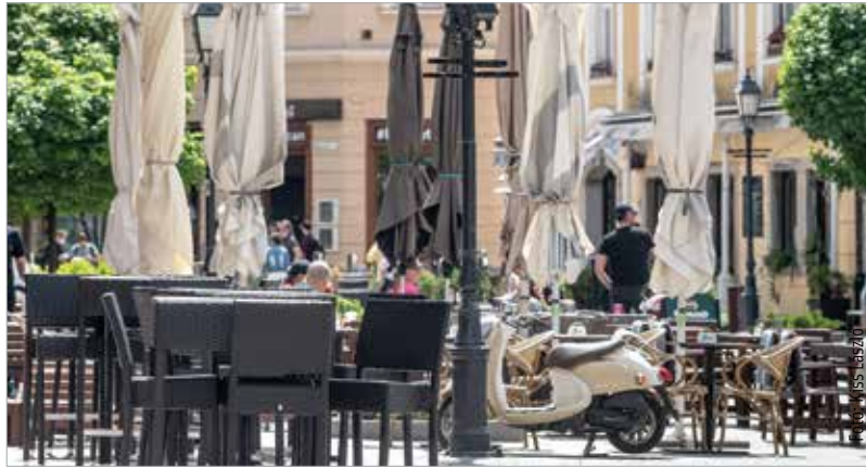
„Elsősorban a munkahelyek védelme érdekében nyithattak meg a teraszok” – olvasható az online fogadóóra egyik válaszában

A polgármester ezúttal rendhagyó módon kérdés nélküli választ, afféle közleményt is közzétett az online lakossági fórum alatt, ahol a város gazdasági helyzetéről az alábbiak szerint írt: „2010 óta polgármesterként azt vallom, hogy kiemelten fontos a hiteles tájékoztatás. Kihasználva a mostani közmegehallgatást, szeretnék egy rövid tájékoztatást adni a város jelenlegi költségvetési helyzetéről. Természetes, hogy a járványhelyzet első szakaszában minden más szempontnál fontosabb volt az emberi élet és egészség védelme. Így van ez természetesen május 4. után is, de emellett szembe kell néznünk a járványból fakadó társadalmi és gazdasági következményekkel is. Ezen belül az önkormányzatok, így Székesfehérvár költségvetési helyzetével is. Ezt a munkát ráadásul nemcsak 2020-ra, hanem 2021-re vonatkozóan is érdemes már most, legalább tervezési szinten elvégezni. A mostani számok természetesen