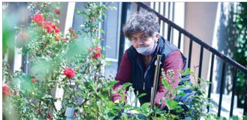
Az éppen nyíló rózsák különleges hangulatot adnak a társasháznak