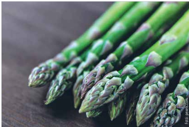
Spárgából mindig frisset vegyünk!

Mindig friss spárgát vegyünk! Ezt a legkönnyebben úgy tudjuk megállapítani, ha a csomóba kötött spárgákat egymáshoz dörzsöljük: ha nyikorgó hangot hallunk, akkor friss! Továbbá a spárgának van egy természetes töréspontja az aljához közelebb eső végén. Ha letörjük, és közben roppanó hangot hallunk, az is arra utal, hogy a növény friss. (Arra természetesen senkit nem biztatunk, hogy a boltban vagy a piacon nekiálljon letörögetni a spárgák alját, nem biztos, hogy elnyernék ezzel az árusok rokon-