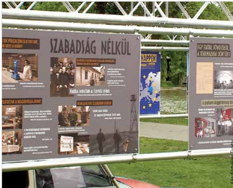
A kiállítás méltó emléket állít a rendszerváltó időszak eseményeinek

Az odavezető út is olyan volt, amire emlékeznünk kell!