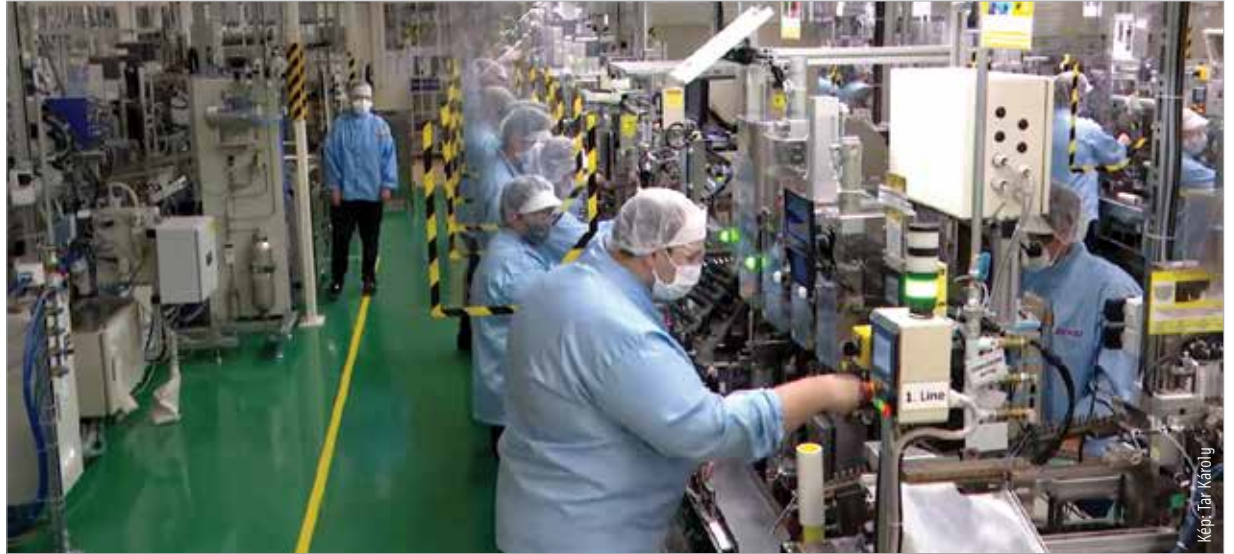
A kormányzati támogatásnak köszönhetően közel négyezer munkavállaló érezheti magát biztonságban a Densónál

A Densónál március végén állt le a termelés a járvány miatt, most már azonban kezd visszaállni az élet a normális kerékvágásba. A cég céljai között különösen fontos szerepet játszott a vírushelyzetben, hogy minél több ember munkája megmaradjon. A gépjárműalkatrész-gyártó vállalat háromezer-nyolcszáz dolgozójának munkahelyét védte meg a Gazdaságvédelmi Akcióterv keretében a kormány által nyújtott vissza nem térítendő támogatás. Palkovics László miniszter úgy fogalmazott: „Magyarország nem szeretné feladni az elveit, hogy hazánkban ne segélyből, hanem munkából éljenek meg az