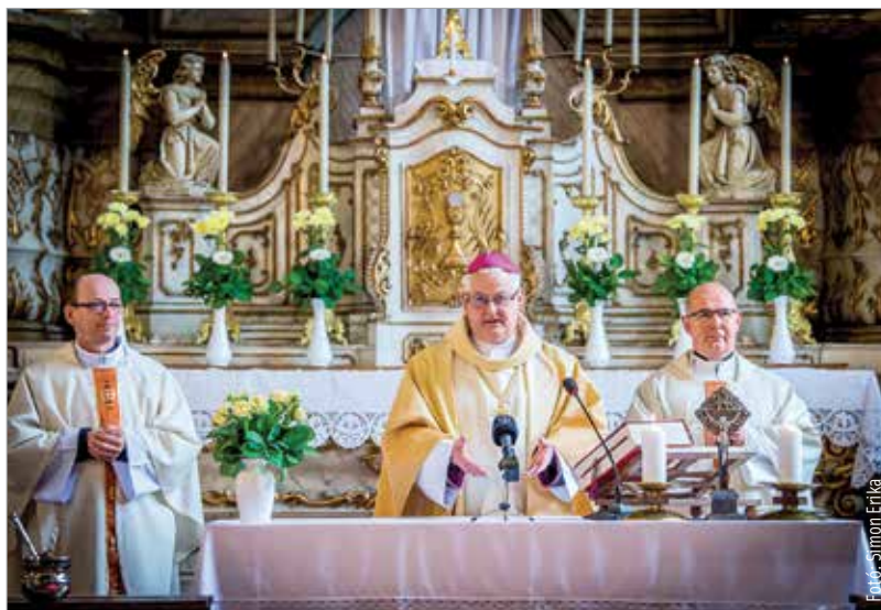
A közösség jelesre vizsgázott a járvány idején – emelte ki a főpásztor

A hívek számára nagy öröm, hogy újra közösségben élhetik meg hitüket, és a papságnak is sokat jelent, hogy találkozhatnak a közösség tagjaival: „Nehéz volt megélnünk érzelmileg is azt a helyzetet, hogy a hívek előtt nyitva volt az ajtó, betekinthettek a templomba, de a liturgiába nem tudtak bekapcsolódni. A szentésekben nem tudtak részesülni úgy,