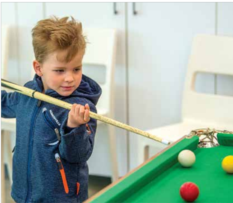
A királyi kaszinóban nem volt korhatáros a belépő, a kicsik is guríthattak nagyot

téssel és a Hetedhét Játékfesztivál legszebb pillanatait felelevenítő történetekkel készült vasárnapra a Hetedhét Játékmúzeum. Mindeközben a Koronás Parkban kézműves foglalkozások, királyi kaszinó, baba-mama sarok, a Fő utcán pedig bohócok várták a családokat.