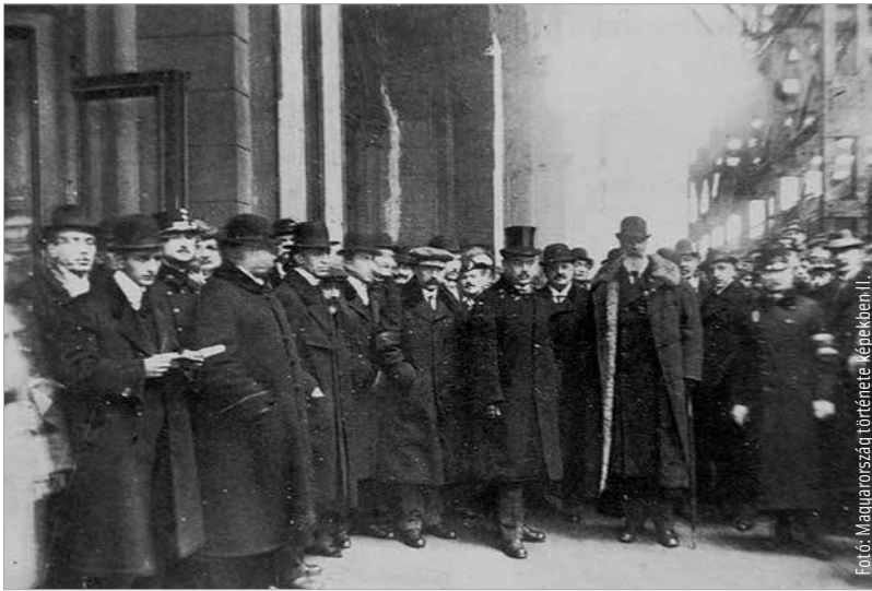
Az Apponyi Albert vezette delegáció elutazása 1920. január ötödikén

Keserű pirula június negyediké mellett november tizenharmadika is, amikor az aláírt békediktátumot a Nemzetgyűlés becikkelyezi és ratifikálja. Egy olyan helyzetből kellett felállni, ami példa nélküli. Ez a tönkretett, agyongyalázott, megcsönkített Magyarország talpra állt, és a húszas évek második felére gyakorlatilag túlszárnyalta az 1914-es gazdasági mutatóit. A gazdaság, a mezőgazdaság helyreállítása, a pénzügyi stabilizáció, az egyre aktívabbá váló magyar külpolitika, a beilleszkedés az európai rendbe, hazánk felvétele a Népszövetségbe mind komoly eredmény! Nem felejthetjük ki a kultúrpolitikát sem, melynek alapjait Klebelsberg Kunó és Hóman Bálint fektette le. Soha nem volt a magyar költségvetésben olyan kiemelt részesedése a kultúrának és az oktatásnak, mint a húszas és harmincas években. Új egyetemeket kellett létrehozni, hiszen a korábbiakat elvették. Ha azt mondjuk, hogy a tatárjárás után fel kellett építeni egy második Magyarországot, akkor kijelenthetjük, hogy Trianon után a magyar politikának egy új honalapítást kellett végigvinnie!