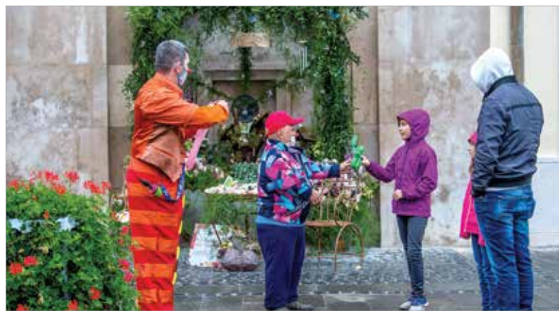
A pünkösdi virágdíszbe öltözött Fő utcán sétálva a legkisebbeket két bohóc lepte meg