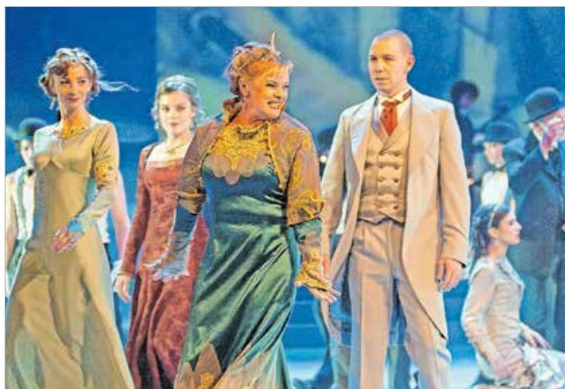
Jelenet a Bizáncból

Igen. Azzal, hogy ezt a szakot akkreditálta a Színházművészeti Egyetem, legalizálta is. Azóta eltelt tíz év, és már a harmadik osztály indul. Olyannyira ott van ez a köztudatban, hogy sok fiatal kifejezetten erre a szakra jelentkezik. A folyamatnak a Vörösmarty Színház is sokat köszönhet, hiszen a fiatalok egyéni