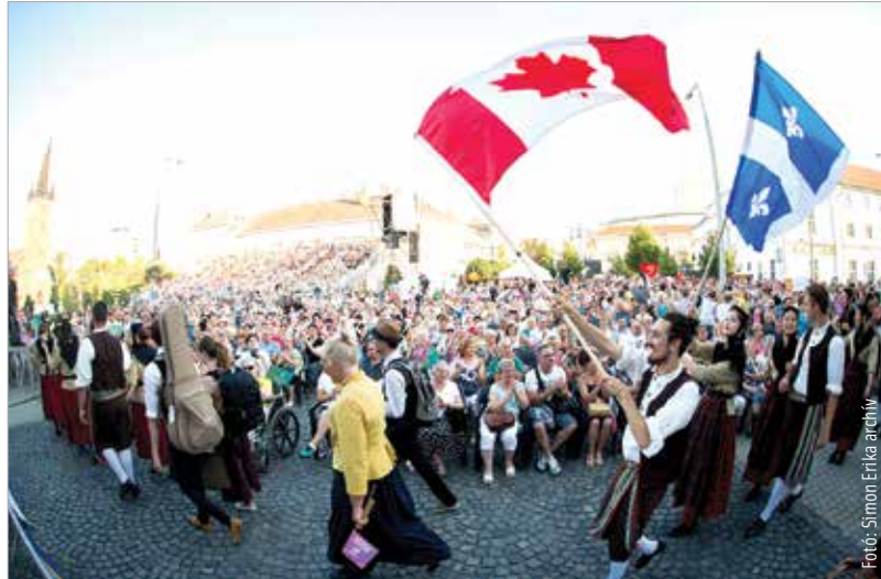
Idén elmaradnak a külföldi táncosok, de látványos műsorban, programban most sem lesz hiány

A 24. Királyi Napok Nemzetközi Néptáncfesztivál végén elkezdődtek a 25. találkozó szervezését. Már megvolt a nyolc csoport a világ minden tájáról, akiknek elküldtük a jubileumi fesztiválra a meghívót. Az élet közbeszólt, és egy köszönőlevél kíséretében sztoriztuk az idei fesztiválra szóló meghívásokat, azzal, hogy viszontlátásra 2021-ben! A járvány ideje alatt azonban a Táncház és az Alba Regia Táncgyűlés dolgozói sem tétlenkedtek: elvégeztük napi feladatainkat, megírtuk pályázatainkat, elvégeztük az elmaradt rendezvények átcsoportosítását. A táncosok pedig otthon gyakorolták a készülődésben lévő koreográfiákat. Az együttes számára nagy érvágás volt, hogy két gálaműsor is elmaradt. Ezért is született meg bennünk a gondolat, hogy néptánchangulatot varázsoljunk