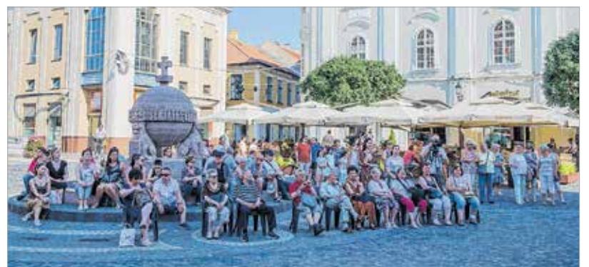
Az Országfalma volt a Művészkorzó központi helyszíne