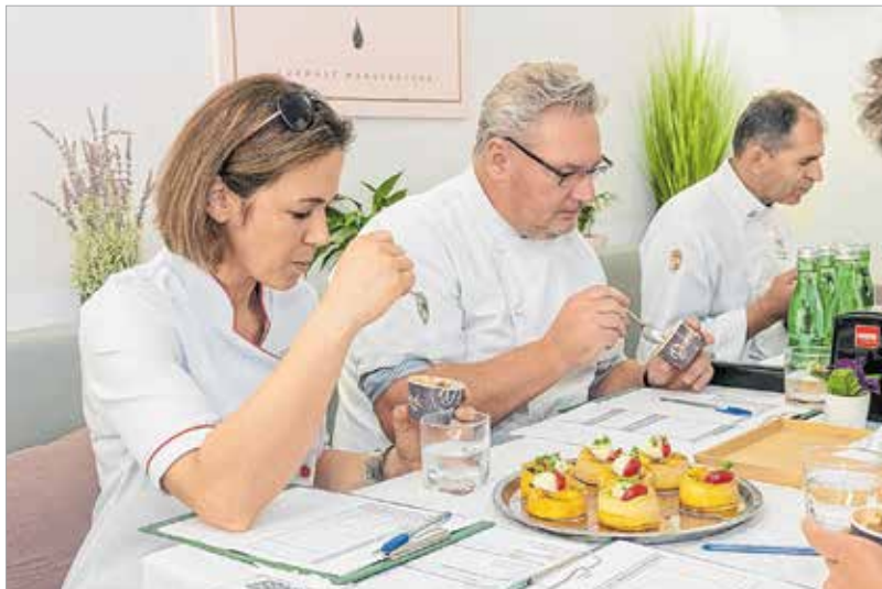
Kemény munka tíz fagyit egymás után véleményezni!

ból készített fagylaltot keresnek, de a kreativitás, egy-egy meglepő csavar vagy íz a végeredmény szempontjából előnyt jelent. Az ötfős zsűri nem sokkal reggel kilenc után állt neki a munkának. Csak a fagylalt sorszámát ismerték, semmi más. Nem volt könnyű dolguk, hiszen szoros volt a verseny, ráadásul a fehérvári selejtező után indultak tovább Dunaföldvárra, a másik régiós döntőre. Két nap alatt összesen negyvenhárom fagyiból kellett kiválasztaniuk a legjobbat.