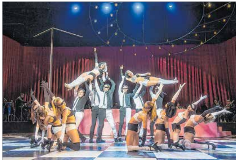
A Chicago tavalgy elnyerte a Színkritikusok Díját

Sosem szerettem előre beszélni egy előadásról, főleg, hogy a koronavírus-járvány elvágta a lendületet: az olvasópróba másnapján megállt a színházi élet. De tény, hogy van egy nagyon masszív és igényes zenei alap: ez az operett egyik nagy, kultikus műve, amihez fel kell nőni. Ezt kell kiszolgálni nekem rendezőként és koreográfusként. A darabban van egy egyszerre elgondolkodtató és nagyon szerethető történet, amit szintén szolgálnom kell. Igyekezem a lehető legjobb formámat elővenni, hogy legyen hozzá humorom, szívem, lelkem, hogy úgy komponáljam meg az előadást, ahogy azt elképzeltem, ami remélhetőleg elnyeri a fehérvári közönség tetszését is!