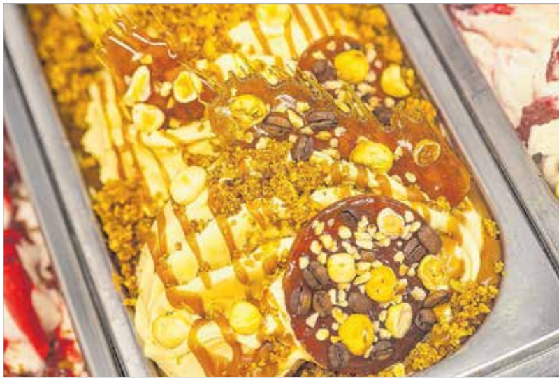
A tonkababos-mogyorós affogató játék a különféle textúrák között

tonkababos fagylaltja az olasz kávékultúra előtt tiszteleg: „Az olaszoknál van egy hagyomány, hogy a vaníliafagylaltra ráöntenek egy adag eszpresszót. Az affogató