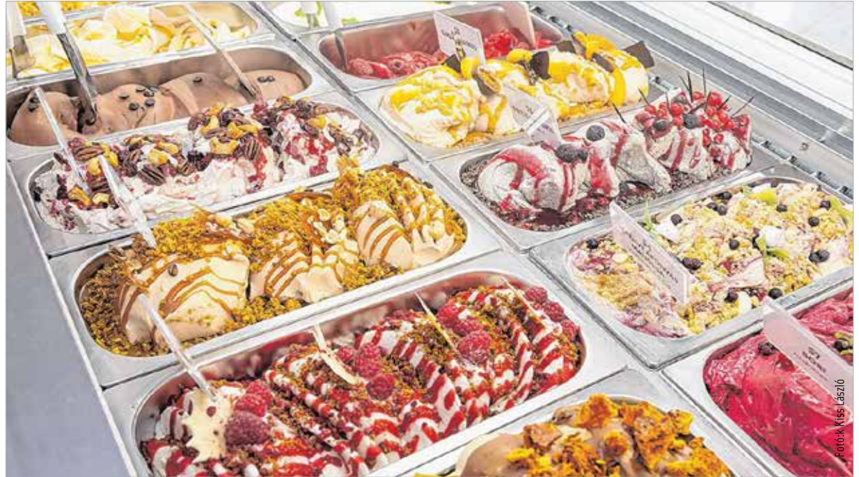
Tíz versenyző a Fehérvári Nagydíj rajtrácsán

Az idei régiós megmérettetésen a szakértő zsűrinek a málnás túrótorta fűszeres ropogóssal, a törökmézes vanília, a ribizlis máktorta, a Hunyadi krónikája, a