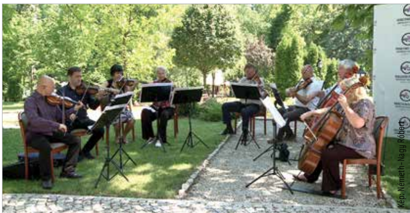
A vonósokból álló kamarazenekar számos más helyszín mellett Gárdonyban, Révfülöpön, múlt vasárnap pedig Balatonfüreden, a Vaszary-villa kertjében játszott. Műsorukon két derűs darab, Mozart D-dúr, majd F-dúr divertimentója szerepelt, végül Mendelssohn egyik vonós oktettje zárta a sort. Vasárnap délután négykor érdemes lesz Székesfehérváron a Zichy liget környékén sétálni, mert ezúttal a Magyar Rádió kamarakórusa készül meglepetésprodukcióval a fehérváriak részére! Aki lemarad róla, este hétkor Pákozdon, a Hősök terén pótolhatja az élményt.

Országjáró koncertsorozatba kezdtek a Magyar Rádió Művészeti Együttese. A zenészek és kórus-tagok kamarafarmációkat alakítottak, és szabadtéri örömmel várják a közönséget. Fehérvárra is ellátogatnak.