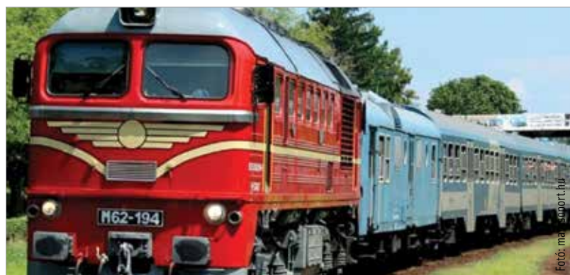
A hatvanas és hetvenes éveket több, a korszakhoz illő színű mozdony és kocsi is megidézi, amelyekkel ezen a vonalon csak ilyenkor találkozhatunk!

lett pedig egy zöld színű személyvonat is bemutatkozik. Az újjászervezett Utasellátónak köszönhetően a régi és a modern idők fedélzeti vendéglátásával is találkozhatnak az utasok az étkezőkocsikban. További információ és menetrend a MÁV honlapján!