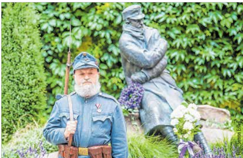
„Csak egy éjszakára küldjétek el őket. Gerendatörésnél szállka-keresőket.”

A ma emberének tudnia kell ezt, hiszen a történelmi tények megerősítik: Gyóni Géza és honvéd bajtársai a hazát szolgálva szenvedték meg az első nagy világégés poklát. Hol vannak a katonák? – kérdezi a világháborús dal szerzője, s a választ tudnunk kell: a harcterek jelöletlen sírjaiban és a hősi temetőben.