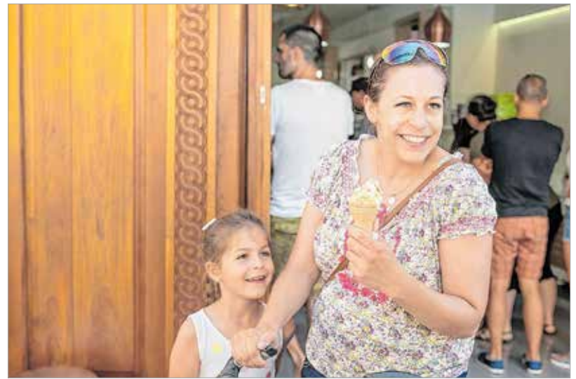
A zsűri után a fehérváriak is megkóstolhatták a finomságokat