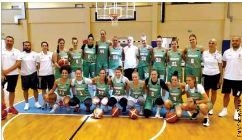
Hosszú idő után Fehérváron találkoztak újra a válogatott tagjai

Ebben az időszakban fiatalokat is igyekeznek beépíteni a keretbe, de a következő négy hét nem csak az edzésekről fog szólni: a pályán kívül csapatépítő programok is várnak a lányokra. A csoportjában egy-egy győzelemmel és vereséggel álló válogatott a jelenlegi ismereteink szerint novemberben folytatja szereplését a jövő júniusi Európa-bajnokság selejtezőjében.