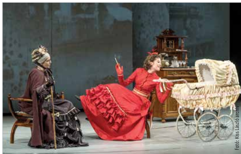
A Tasnádi Csaba által rendezett történet visszarepíti a múltba, ahol hasonló problémákkal küzdöttek Szabó Magda hősei, mint a mostaniak, csak szebb ruhákban. Az 1830-as évektől követi nyomon négy nemzedék életét, egy család történetét tele fájdalommal, szeretettel, együttléttel, különválással.

Hétfvégre újra online programot kínál a Vörösmarty Színház: a Facebookon és Youtube-csatornájukon július harmadikán, pénteken este hét órától vetítik a Szabó Magda Régimódi történet című művéből készült előadást.