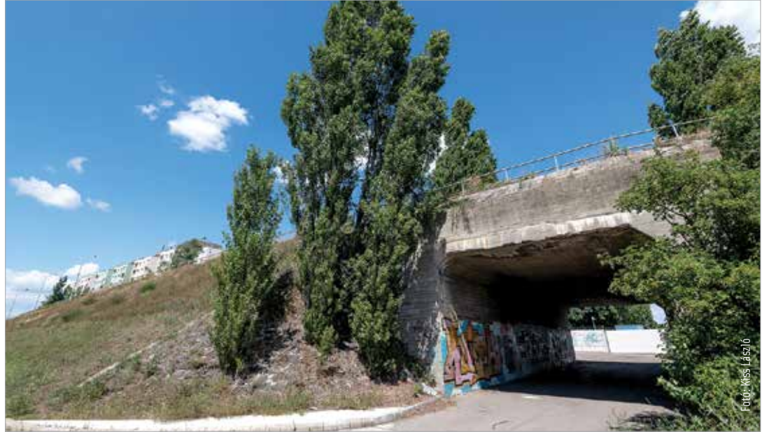
Augusztus végéig nem használható a felüljáró, de az iskolai tanítás kezdetére a tervek szerint befejezik a felújítást

„Komoly megerősítése történik a szerkezetnek, magának az útpályának. Új burkolatot, szegélyeket és vízelvezetést kap. Újraépül a járdarendszer, ami toldása volt a felüljárónak, hiszen eredetileg nem volt rajta. Szakemberek szerint itt van a legnagyobb probléma: a szerkezet megy szét.” – mondta el Székesfehérvár polgármestere.