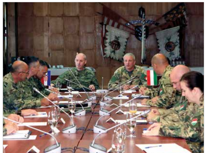
A parancsnokság augusztustól már a horvátokkal kiegészülve nemzetközi katonai szervezetként folytatja feladatait

parancsnokság és egy regionális különleges műveleti parancsnokság létrehozását, amire több mint hárommilliárd forintot biztosít a magyar kormány. A székesfehérvári központtal felálló parancsnokság feladata a térség stabilitásának, a békének a megőrzése, ha pedig a térségben bármilyen konfliktus kialakulna, akkor irányítaná a műveleti tevékenységet. Létszáma várhatóan hetven fő körül lesz.