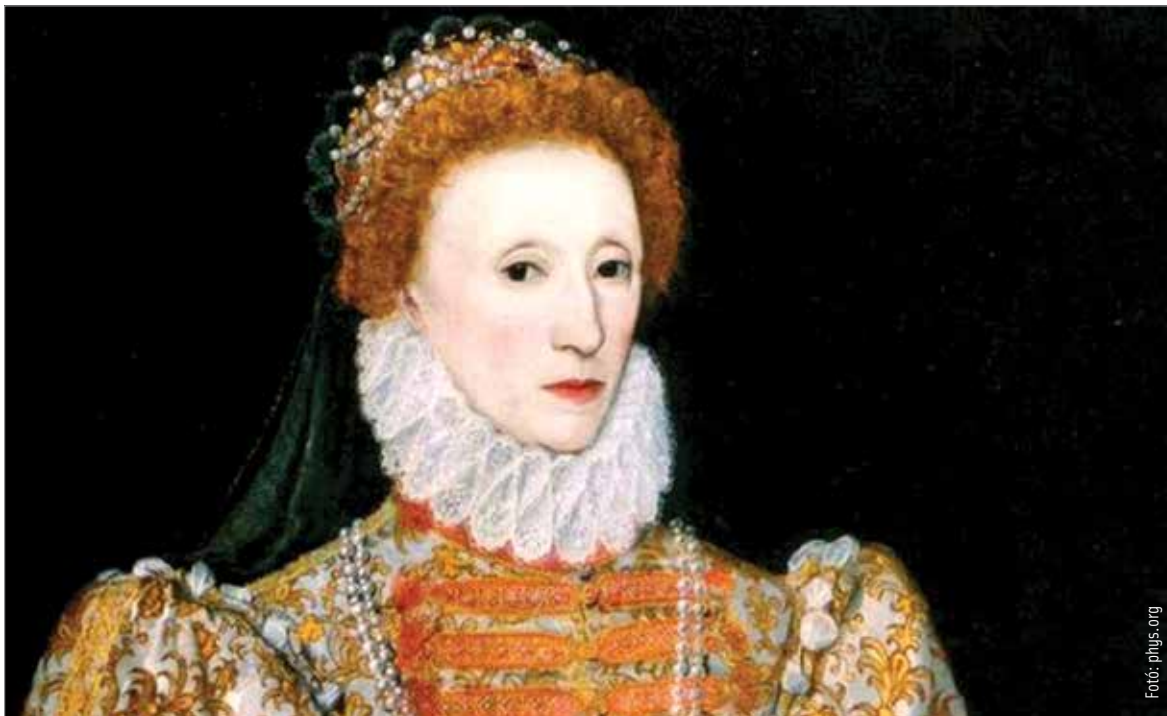
I. Erzsébetet minden képen sápadt-fehérnek ábrázolták

a fogorvosoktól való félelme ahhoz vezetett, hogy fogai tönkrementek és kihullottak, emiatt a külföldi diplomaták nehezen értették a beszédét. A kozmetikai olommérgezésnek azonban csak 1760-ban lett először dokumentált áldozata: egy ír nemesasszony, Marie Gunning, aki híres volt porcelánszerű bőréről. Habár bizonyítottá vált, hogy a fehérség elérése érdekében használt oldat hosszú távon halálos, a trend sokáig nem változott, s a készítmények sem újultak meg.