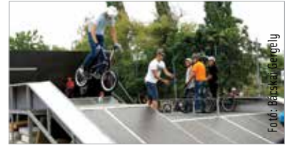
A pályán a sisak kötelező, és erősen ajánlott a különböző védőeszközök használata is!

Kiseb felújítás után újra várja az extrém sportok kedvelőit a Bregyó közti sportcentrum BMX- és gördeszkapálya. A Városgondnokság szakemberei az elemek borítását cserélték ki, ahol szükséges volt. A pálya a nyári szünetben minden nap reggel kilenc és este kilenc között tart nyitva.