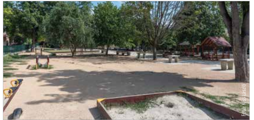
A Hétvezér udvarát is felújítják

Vizesblokkokat, udvarokat és játszóeszközöket újítanak meg, cserélnek le a város iskoláiban a Városgondnok-