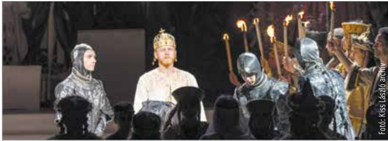
A rendhagyó körülményekre való tekintettel teljesen új helyszínen a Koronázási szertartásjátékot is megtekinthetik majd az érdeklődők

Székesfehérváron több lehetőség is lesz augusztusban a kikapcsolódásra. Ha minden a tervek szerint alakul, akkor a Királyi Napok programjában az Oreghegyi Mulatság, a Fricsay Richárd Regionális Katonazenekari Fesztivál, a Zichy ligeti színpadon pedig az István, a király rockopera koncertváltozata várja a látogatókat.