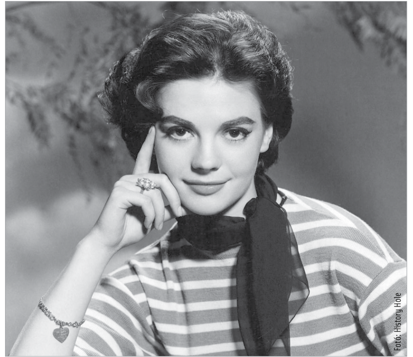
Coco Chanel Gabrielle Bonheur Chanelként született 1883. augusztus 19-én egy vidéki francia városkában, Saumurben. Legendássá vált vezetékneve onnan ered, hogy születése bejegyzésekor az anyakönyvvezető kifelejtett egy s betűt, így lett Chasnelből Chanel

Gyagilev oldalán elkezdte mecénási pályafutását. Megtudta, hogy Sztravinszkij súlyos anyagi gondokkal küzd. Meghívta feleségével és négy gyermekével együtt elegáns villájába, és két éven át gondoskodott a teljes ellátásukról. Ez idő alatt a házat betöltötte a zeneszerző fenségesen áradó muzsikája. Nagylelkű támogatását kiköltözésük után is, még hosszú évekig élvezték.