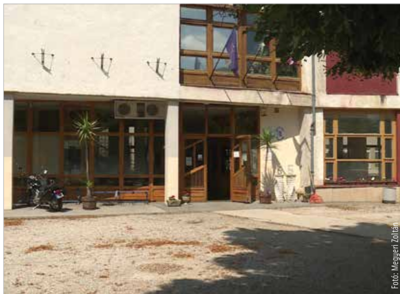
Szeptembertől a Vörösmarty Mihály Technikumban és Szakképző Iskolában is iskolaőr segíti a rendfenntartást szeptembertől. Az intézményben leginkább a terület nagysága miatt van szükség a szolgálatra.

A főigazgató hozzátette: több iskolában működik bűnmegelőzési tanácsadó, így nem jellemző, hogy