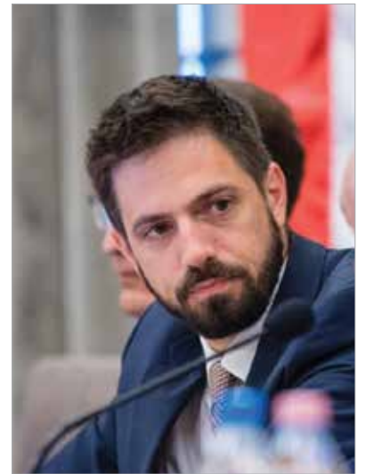
Magyar Levente külügyi államtitkár szerint a magyar gazdaság gerincoszlopát a megyei jogú városok hálózata adja

„A kormány direkt módon is kompenzálja a városok elmúlt hónapokban elszenvedett veszteségeit, de nem azzal a filozófiával, hogy segélyt adunk, hanem azzal, hogy az elvesztett munkahelyek helyett újakat hozunk létre.” – hangsúlyozta Vargha Tamás, városunk országgyűlési képviselője. Hozzátette: eddig mintegy tizenötmilliárd forintnyi támogatás érkezett a városba, ami háromezer-öttszáz munkahely megtartásában segített.