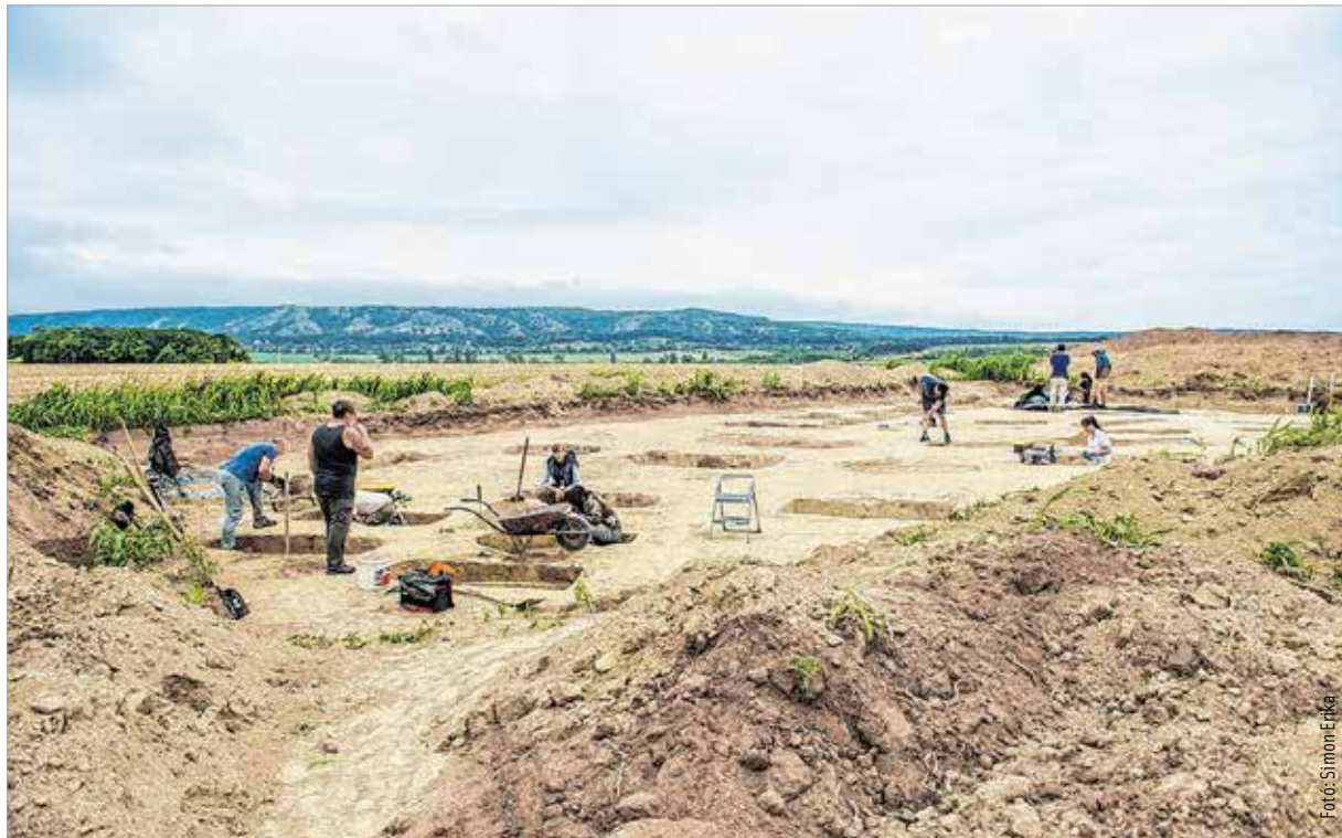
A feltáráson augusztus nyolcadikáig dolgoznak a régészek és az önkéntesek