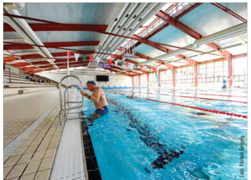
A medencékben minden feltétel adott a biztonságos úszáshoz, edzéshez

A medencékben minden feltétel adott a biztonságos úszáshoz, edzéshez. Különböző adalékanyagok, vírusölők lehetővé teszik a biztonságos használatot. Folyamatosan ellenőrzik a víz minőségét, a felületeket rendszeresen fertőtlenítik. Az uszoda pénztáránál érintésmentes kézfertőtlenítőt helyeztek ki, itt kötelező a másfél méteres védőtávolság betartása. A létesítménybe a sportolók is visszatérhettek, az uszodát rendszeresen igénybe vevő nyolc fehérvári sportegyesület is tart már edzéseket.