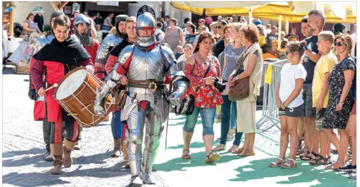
Idén augusztusban is megelenevedik a középkor a belvárosban, és az óriásbábkokkal is lehet majd találkozni

Augusztus harmadikán, hétfőn este a polgármester közzétette, hogy az Operatív Törzs ajánlása