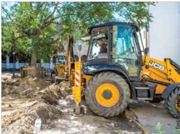
Jövőre vehetjük birtokba a megsépült Bartók Béla teret

Rövidesen igazi közösségi téré varázsolják a teret a beruházók: megkez-