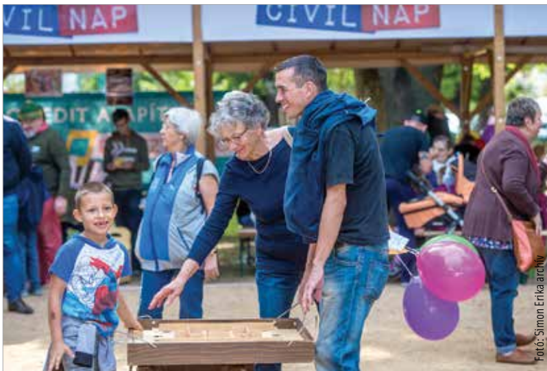
Szeptember tizenkettedikén lesz az idei Civilnap

A rendezvényt szeptember 12-én, szombaton 9 és 15 óra között a Zichy ligetben rendezik meg. A megnyitáskor közös fotó, civiltabló készül, majd 10 órától kezdődnek a színpadi bemutatkozások. Az idei évben a Civilnapon való részvétel jogosultsági feltétel lesz a székesfehérvári szervezetek működési költségeinek támogatását célzó, ősszel kiírásra kerülő önkormányzati pályázatnál. Jelentkezni augusztus 17-én, hétfőn 12 óráig lehet. A kérelmet papíron, zárt borítékban, hivatali időben lehet személyesen benyújtani a Polgármesteri Hivatal Kulturális, Stratégiai és Civilkapcsolatok Főosztályán.