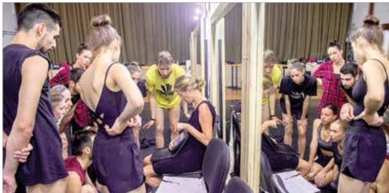
A próbafolyamatban minden pillanat fontos

segítség, hiszen olyan fontos részletekre tudok figyelni, amire esetleg más esetben nem maradt volna idő.