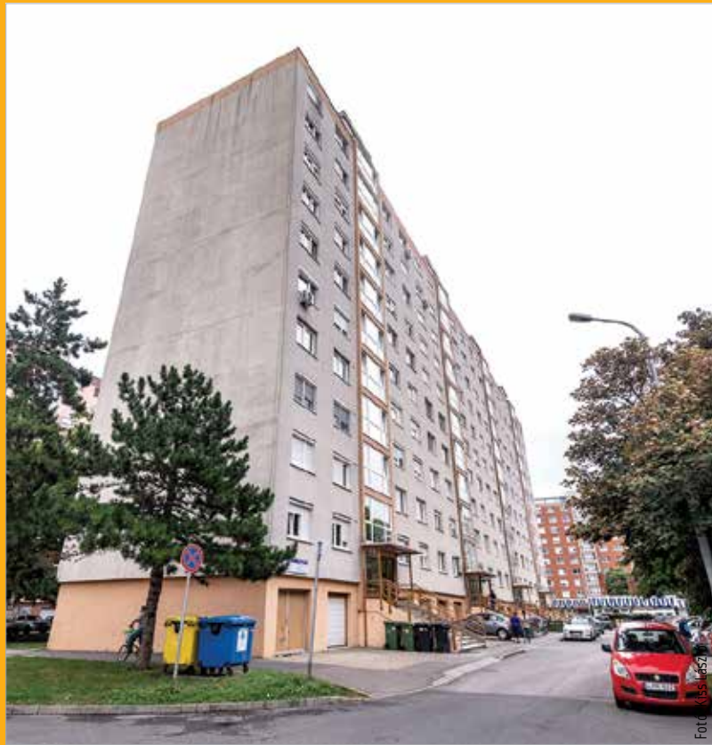
Közel huszonnégyezer lakás fűtését biztosítja városunkban a Széphő Zrt.

Erre azért van szükség, mert a rossz vagy hiányos szerelések