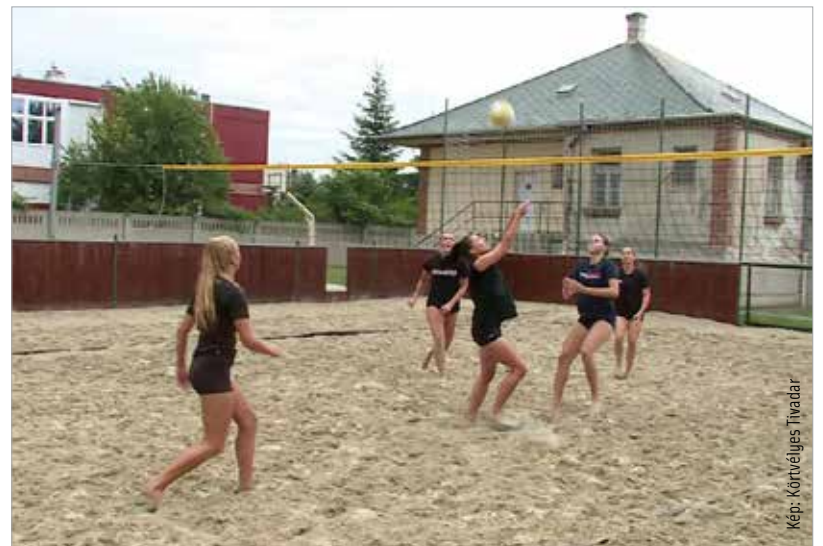
Strandröplabdával hangoltak a lányok a teremszezonra

A csapat szeptember 26-án itthon kezd a bajnokságot a Debrecen ellen.