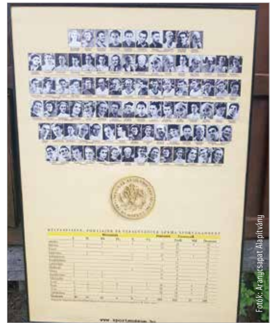
Az olimpiák történetének arany lapjaira kívánczik 1952.