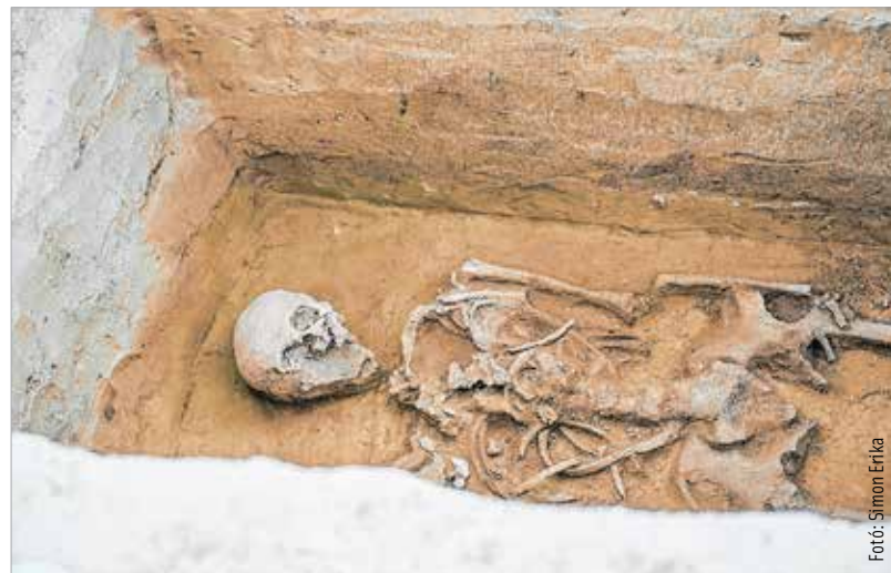
Harmincöt sírt szeretnének feltárni a mostani ásathoz. Az már kiderült, hogy meglepően magas a gyereksírok száma az avar kori temető ezen részén.