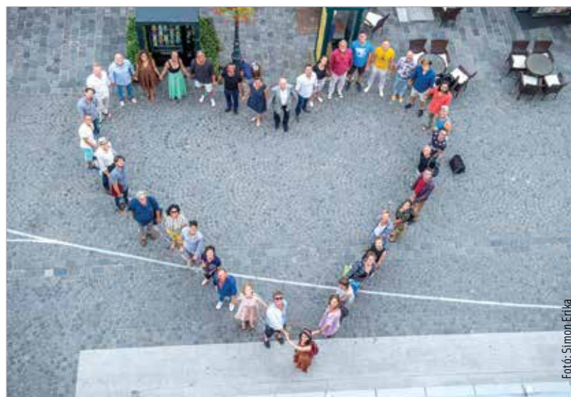
A társulat szívalakban állt össze a Vörösmarty Színház előtt