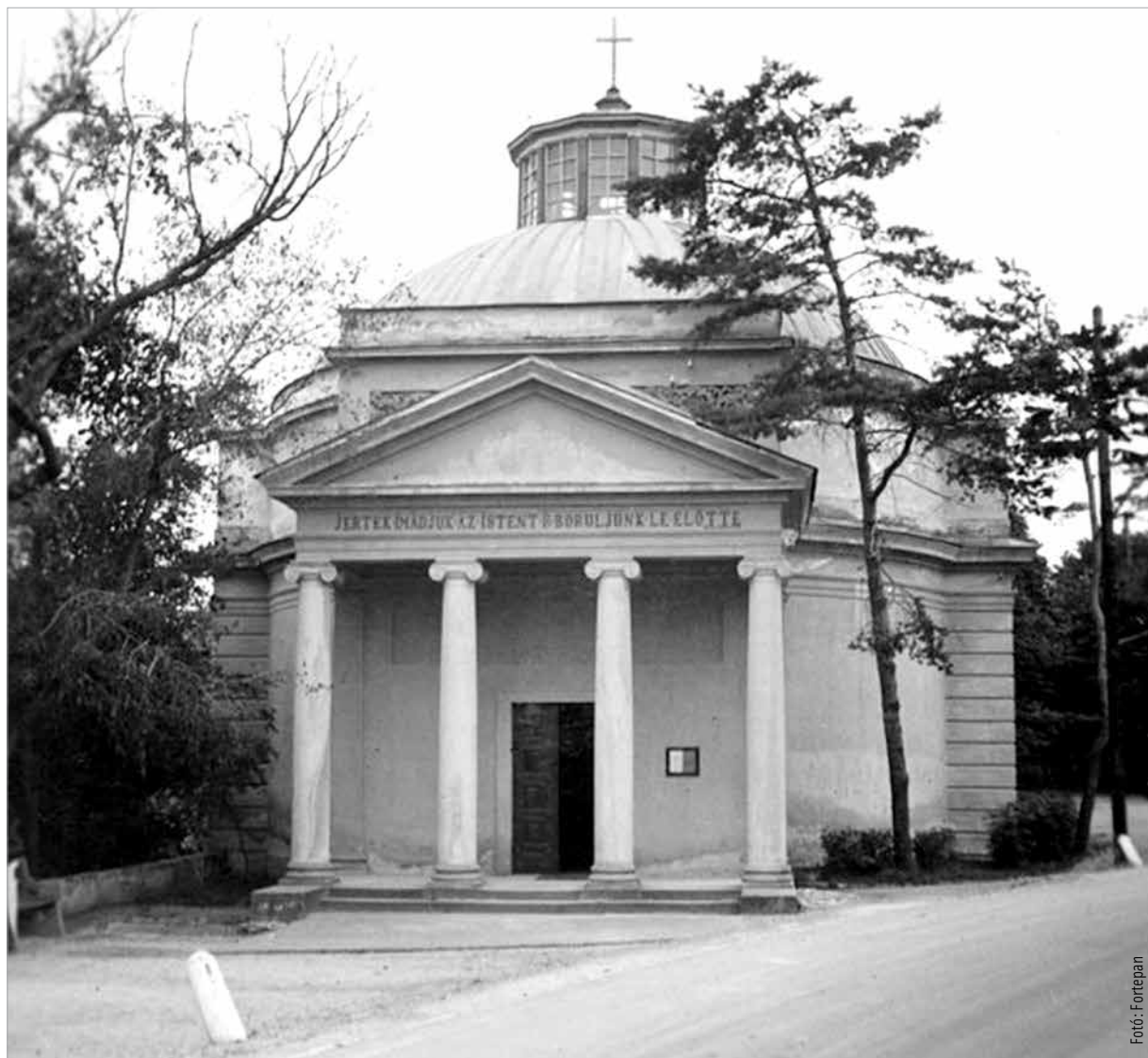
A balatonfüredi Kerek-templom 1846-ra készült el