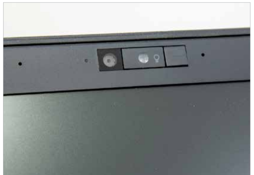
A webkamera ma már alapfeltétel

Online órán webkamera nélkül nem lehet részt venni, de ha nincs a gépben, mostanában bizony nehézkes a beszerzése, hiszen a koronavírus-járvány kitörése óta alaposan felment az ára: „Különálló webkamerát negyvenezer forint alatt nem kapni, nehezen is beszerezhető, használtan sem túl olcsó. A Windows 10-es számítógépekre nem is biztos, hogy megfelelően telepíteni tudunk egy régebbi kamerát. Ami opció lehet még, ha nincs webkameránk, egy olyan