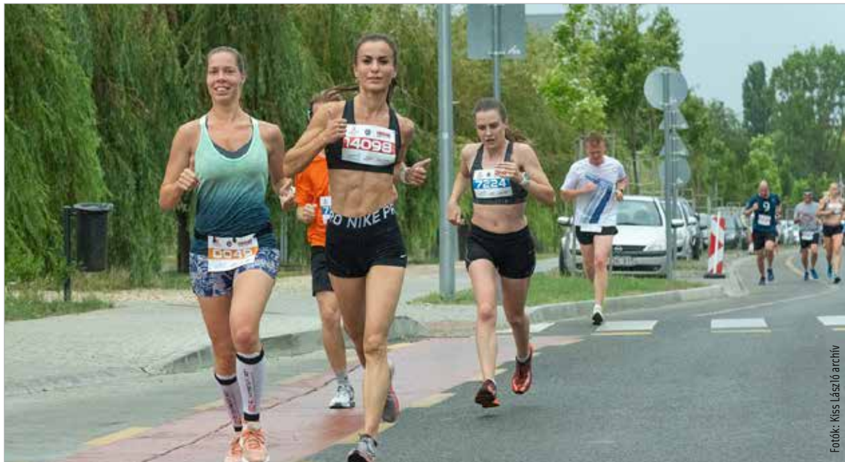
Az izomláz elkerülhető, még a hosszabb távú edzések esetében is