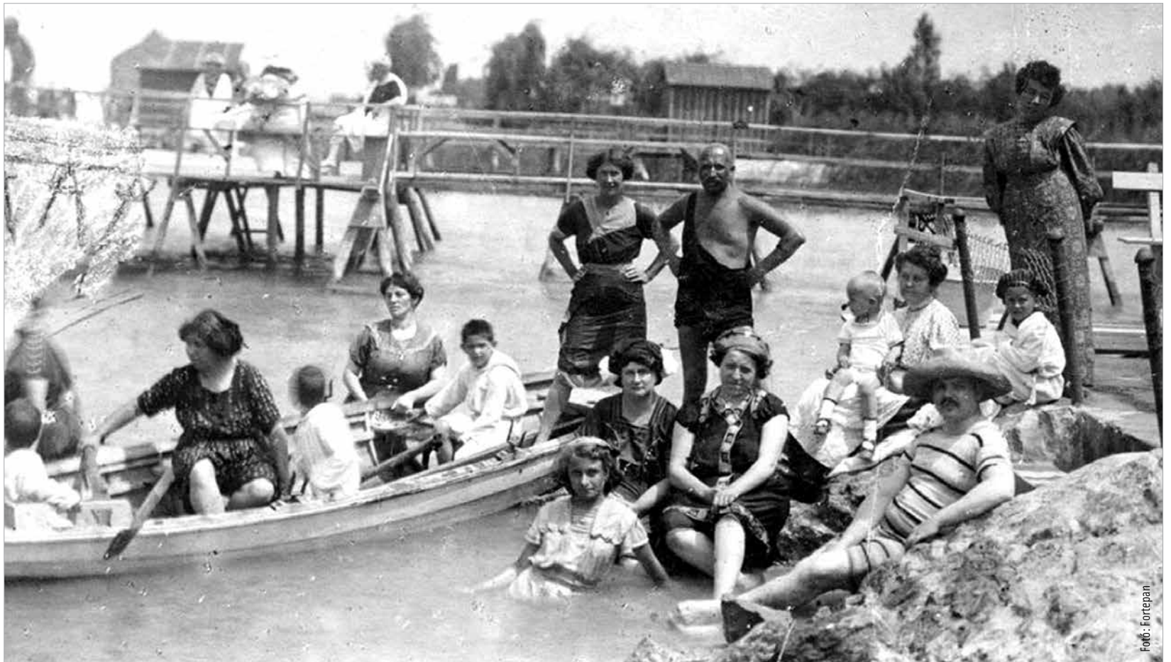
Balatonfi fürdőzők a huszadik század elején

kálást a templom környékén. Az összeverődő gavallérok most már azon vetélkedtek, hogy ki küldje el leghamarabb párbajsegédét a kemény főbíró nyakára ... öklelő bajszú tűzmesterek feszítették mellüket a savanyúvizes kút körül, a postaszekér tucat számra hozta a megrendelt pisztolyokat. De a főbíró nem engedett... Blaháné mosolyában élt a magyar női lélek. Blaháné mosolya volt generációnként át minden magyar nőnek, ha tetszeni akart, így mosolyogtak a grófnők, akiket az oregebb Andrássy Gyula porgetett az udvari bálokon és így mosolyogtak Tisza Kálmán idejében a Szervita téren a virágáruslányok, akik majdnem grófnék lettek. Sok színész nő röp-pent fel a színpaddeszákra, amíg Blaháné hetven esztendő lett. Sokan egyeztettek a botrányt és egyéb feltűnőséget tehetségükkel, hogy