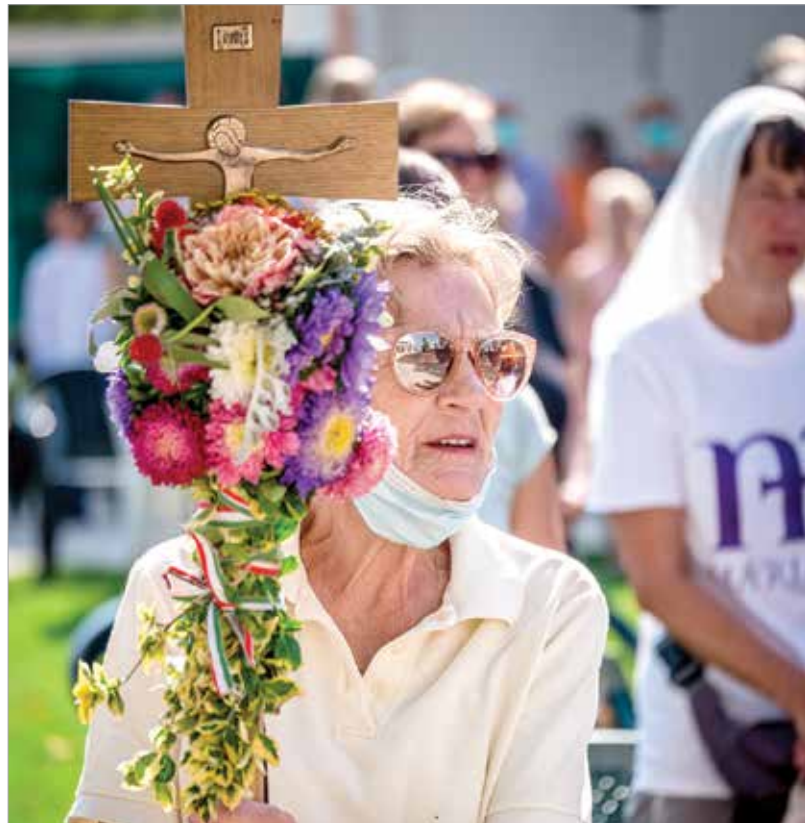
A bodajki búcsú több évszázados hagyomány