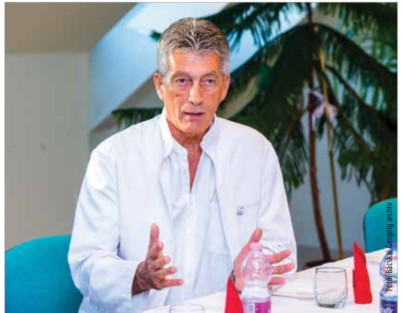
A bizottság feladata a továbblépés kidolgozása: hogyan folytatódjon a családbarát szülészeti programot folytatott évtizedes munka

A bizottság feladata a továbblépés kidolgozása: hogyan folytatódjon a