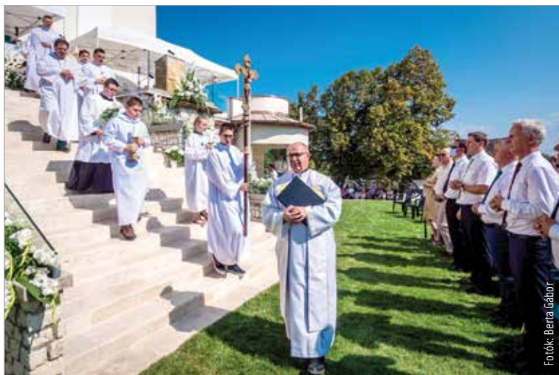
Magyarország legősibb kegyhelye a bodajki, ahol a krónikák szerint már Szent István király és családja is imádkozott