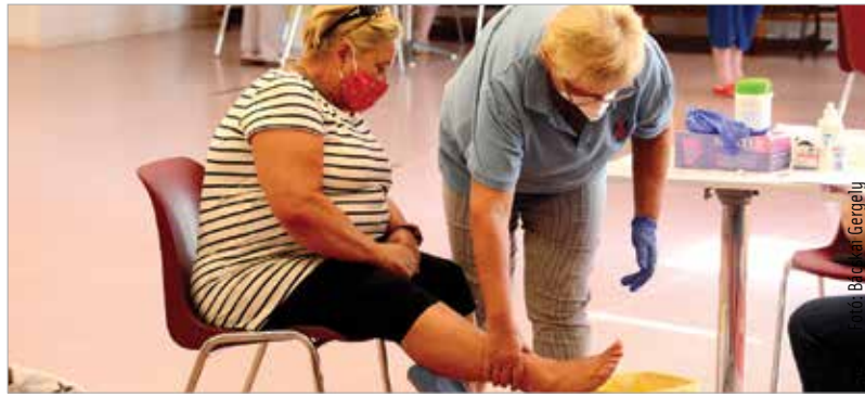
Legközelebb a Kőfém-lakótelepre érkeznek az Egészségfejlesztési Iroda munkatársai a különféle vizsgálatokkal

„Sokan jelentkeztek, hamar beteltek az időpontok. A járványhelyzetre