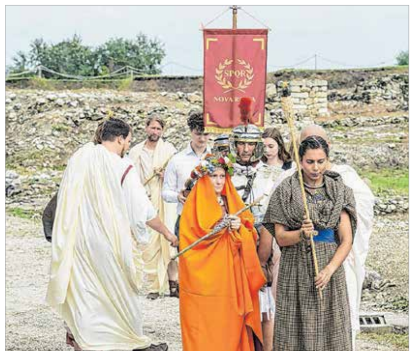
Fáklyás ifjak, díszes menet kíséri az újdonsült házaspárt

A szertartás első eleme az auspicium, azaz a madárjóslás volt. Ilyenkor felosztották az eget égtájakra, és meg volt szabva, hogy mely