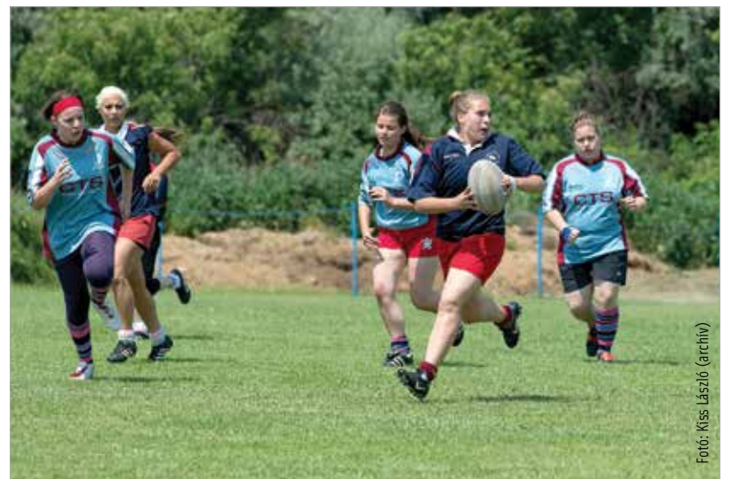
A fehérvári rögbi a lánycsapataira is büszke lehetett az elmúlt évtizedekben