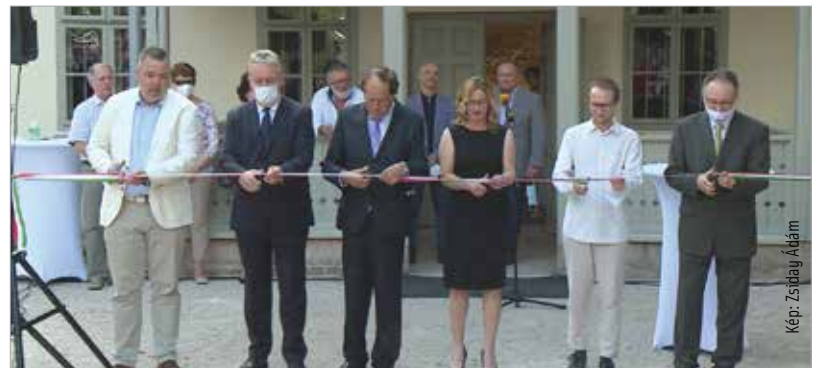
Az emlékház méltó a Szózat költőjéhez