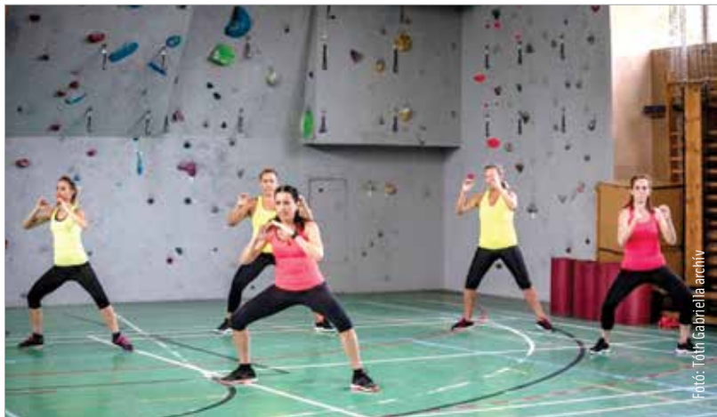
Mozogjunk minden nap!

Ha edzésre, tornára, testmozgásra gondolunk, elsőként a fogyás, a formásabb, tónusosabb test rémlik fel előttünk, mint motiváció. Lehet akár ez is a cél, de ennél sokkal