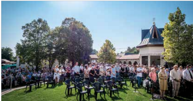
Bodajkra, az ősi zarándokhelyre minden évben ellátogatnak a hívek. Múlt hét szombaton az Öreghegyi plébániáról indult a harmincöt kilométeres zarándoklat. A testi-lelki töltékezést segítő túra résztvevői Fehérvárcsurgón kaptak szállást, majd vasárnap érkeztek meg Bodajkra, a szentmisére.

család tematikus zarándokútjának, hiszen ez a legrégebbi Mária-kegyhely, amit Szent István is rendszeresen látogatott, és aki államalapító szerepe mellett a magyar keresztények oltalmazójaként van jelen történelmünkben. Ezért olyan fontos ma is a bodajki Segítő Szűz Mária-templom. Mint Soltész Miklós államtitkár az ünnepi misét követően kiemelte: ma is fontos a kereszténység védelme, ennek jegyében az elmúlt tíz évben a Kárpát-medencében összesen több mint háromezer templom újult meg, és százharminc új templom épült a kormány támogatásával. A székesfehérvári püspökségen őrzött Szent István-fejereklye egy darabját helyezte el a megyés püspök a megújult oltárban, a restaurálást követően megáldott kegytemplomban.