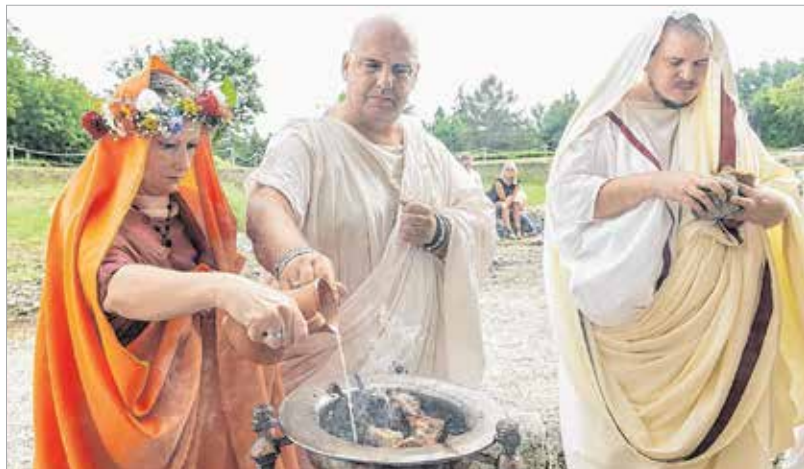
Boldogító igen római hagyományok szerint

„Ulbi tu Gaius, ego Gaia!” – hangzott el a jelentőségteljes kijelentés. A Gaius és a Gaia a leggyakoribb római férfi és női személynevek. Ennek elhangzásával fejezték ki, hogy ők egyazon személy mostantól kezdve, egyazon személynek a férfi és a női oldala, egységbe forrva. Ezzel pedig mindenki tudomásul vette a férj és a feleség szándékát, hogy ők egymásban meglelték életük párját.