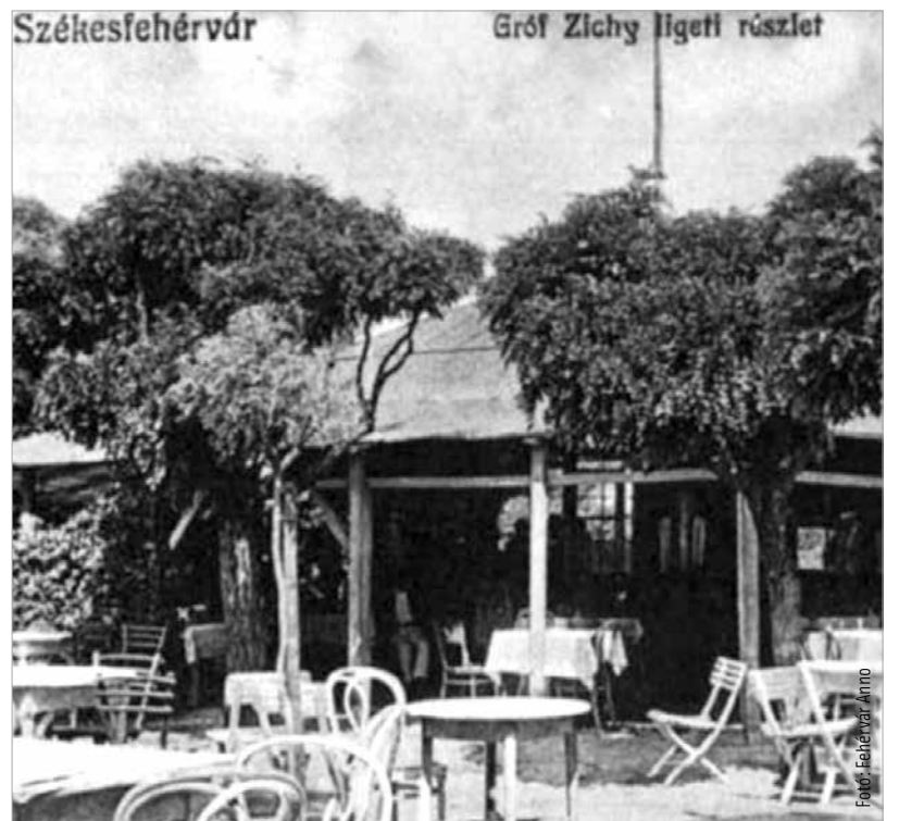
Az örömlányok mozgását szabályozták. Nem mehettek például közparkokba.