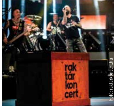
A koncertek már elérhetők a raktarkoncert.hu oldalon

A hazai könnyűzenei ipar támogatására indított koncertsorozat, a Raktárkoncert felvételei már augusztus közepe óta zajlanak. A közönség szeptember 21-étől már teljes egészében láthatja a digitálisan közvetített rendezvény-sorozatot. A projektet koordináló Lounge Group-nál hatalmas apparátus dolgozik azon, hogy a projekt bevonuljon minden idők legnagyobb magyarországi koncertjeinek csarnokába.