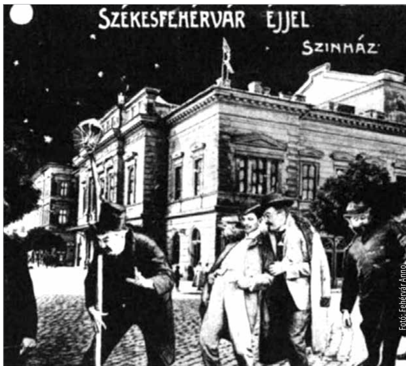
Egy humoros képeslap a fehérvári éjszakai életről

Minden tiltakozás ellenére azért az I. világháború utáni román megszállásakor nem volt rossz dolog, hogy a városban működtek piros lámpás házak. A román tiszték hírhedtek voltak kicsapongásaikról. Egyik este a Magyar Királyban vacsoráztak, amikor az est hevében azt követelték a fehérvári rendőröktől, hogy hozzanak nekik hölgyeket, mert különben a lányokat, asszonyokat fogdossák végig. A rendőrkapitány gyorsan megoldotta a kérdést: felkereste az egyik bordélyt, és hozta is a kéjnököt, akik, ha közvetetten is, de megmentették a fehérvári lányokat, asszonyokat.