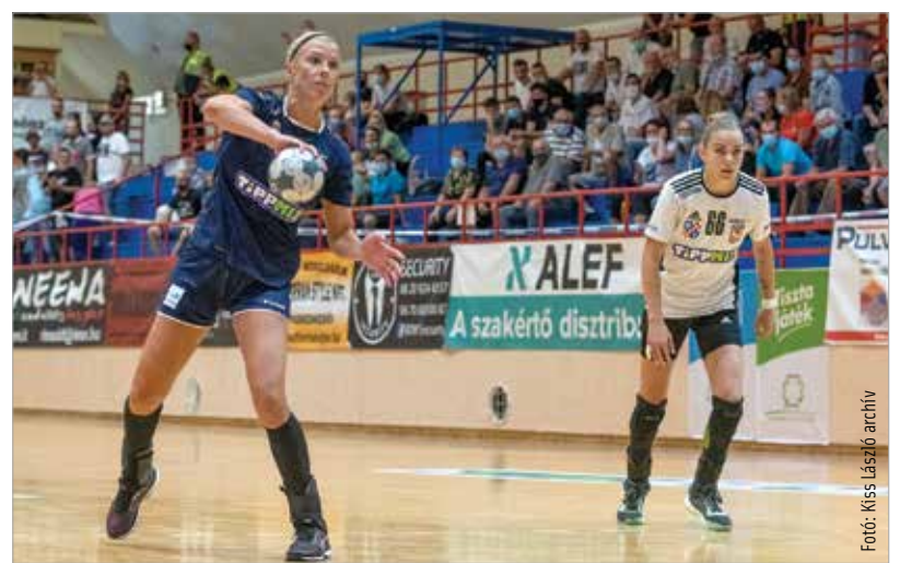
A fehérvári lányok csütörtökön Balatonbogláron javíthatnak!

A fordulás után a vendégek sokkal jobban védekeztek, és Herczeg kapus is remek védekeket mutatott be. Ez el is bizonytalanította a fehérvári lövőket, így a hajrára olyan előnnyel érkeztek a vendégek, hogy nem volt kérdés Tilingerék győzelmé: végül 31-27-nél érte a dudaszó a csapatokat. A játék képe alapján a fehérváriak jövője egyáltalán nem kilátástalan, egy-két mozaikdarabnak kell még a helyére kerülnie elől és hátul is ahhoz, hogy jöjjenek az eredmények. Ebből csütörtökön, a Boglári Akadémia-SZISE otthonában a remények szerint látszik is már valami!