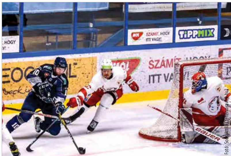
A miskolciak ellen jól ment a góllövés, reméljük, az Ice-ligában is így lesz!