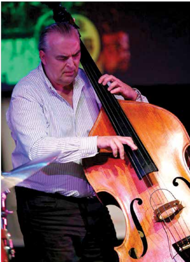
Nagybőgő nélkül nincs dzsesszmuzsika

Volt már olyan, hogy csalódtam, és ez nemcsak szakmai, hanem emberi kérdés is. Egy zenekarnak nagyon fontos, hogy jó emberek alkossák, nem elég, ha valaki csak jó zenész. Ilyen a mi utunk!