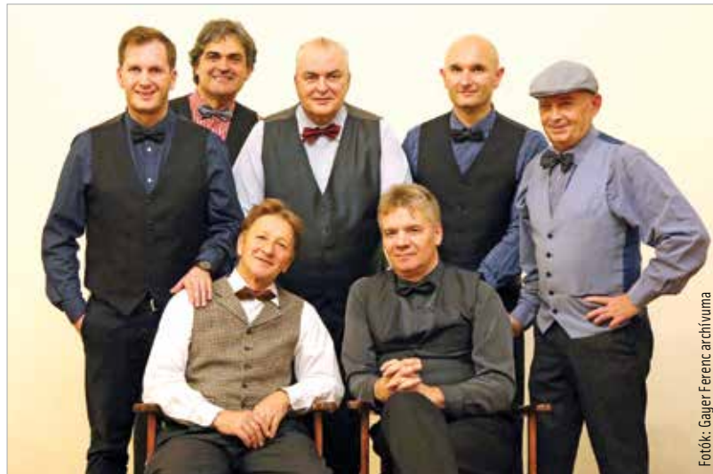
A Budapest Ragtime Band nemcsak jó zenészekből, hanem jó emberekből áll