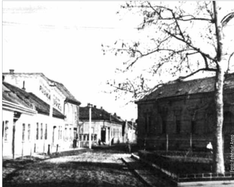
Az Ósz utca a 1930-as években

A történeti hűséghez hozzátartozik, hogy addigra a hölgyek már nem űzhették hivatalosan a legősibb mesterséget, de az kétségtelen,