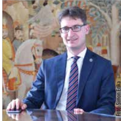
Tíz éve látja el a polgármesteri feladatokat Cser-Palkovics András

Ahogy arról már előző lapszámunkban is olvashattak, a legutóbbi közgyűlésen három kiemelt fejlesztés ügyében is döntött Székesfehérvár képviselő-testülete. Ekkor határoztak arról is, hogy a város él a Volánbusz ajánlatával, és további nyolc buszt hívnak le, így összesen huszonhárom vadonatúj csuklós autóbusszal gyarapodik a közösségi közlekedés városunkban. A Fehérvár Televízióban a polgármester arról is beszélt, hogy jövőre ezt a programot szeretnék folytatni: a szólóbuszok arányát szeretnék javítani, hiszen az minden szempontból hatékonyabb, környezetkímélőbb is. A tervek szerint a beszerzendő huszonöt busz vagy gázüzemű vagy elektromos lesz. Mindez nagy előrelépést jelentene a biztonság és a komfort szempontjából. A város a menetrendet is érintő változtatáson is dolgozik, ami rövid