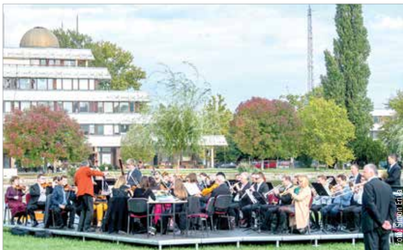
Méltó helyszín volt a Csónakázó-tó a szimfonikusok koncertjéhez

nem tudjuk elindítani a Partitúra bérletsorozatunkat az ifjúság számára. Az oka, hogy a koronavírus-járvány időszakában az iskolák nem tudják elhozni a gyermekeket a koncertekre a Vörösmarty Színházba. Ezért döntöttünk úgy, hogy a szabadban, a Csónakázó-tó szigetén fogunk találkozni, és klasszikus zenével örvendeztetjük meg őket. Karakterdarabokat játszottunk a koncerten, melyeket egy olyan témakör köré fűztünk, ami mindenkit érdekel és érint: az otthon és a család. A darabokban egy család életét jelenítettük meg zenés formában.”