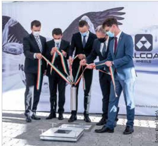
Alapkövetétel a Howmet-Köfém Kft.-nél. Kilencmilliárdból épül az új gyáregység.

Negyvenhat magyar kis- és középvállalkozás külpicra jutását támogatja a kormány a huszonötmilliárd forintos Nemzeti Exportvédelmi Programon belül meghirdetett kétmilliárd forintos keretösszegű pályázatnak köszönhetően. A Szabadbattyánban működő LogSol Kft. ennek keretében vehetett át szintén hétfőn támogatói okiratot. A cég azért igényelte a támogatást, hogy a török piacokon sikeres lehessen. A külpici projekt volumene több mint harmincmillió forint, amihez a magyar állam tizennyolc és fél milliós támogatást nyújt.