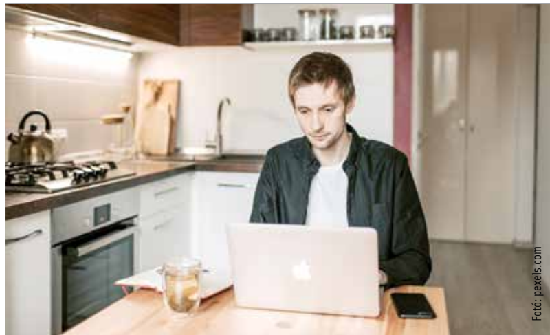
A távmunkások aránya Budapesten és Pest megyében a legnagyobb

Magyarországon nem jellemző a távmunka. Az Eurostat kimutatása alapján Magyarországon 2018-ban az alkalmazottak hat százaléka dolgozott otthonról kisebb vagy nagyobb mértékben. Ez az arány jóval alatta van a tizenöt százalékos európai uniós átlagnak. Hogy mi ennek az oka? Kaziné Ónodi Annamária, a Budapesti Corvinus Egyetem docense egyik műhelytanulmányában úgy fogalmazott, ennek az oka vagy a