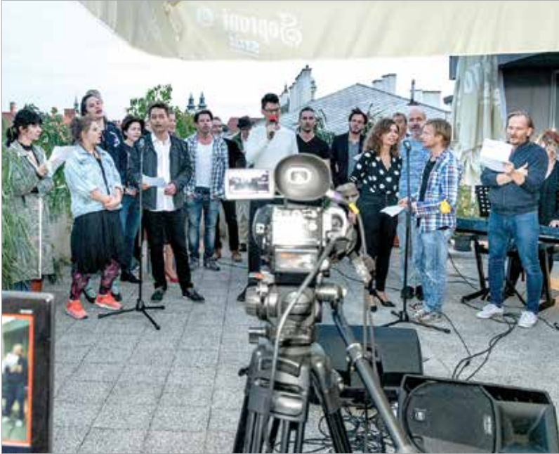
Miénk itt a grund! Az est végén a Pál Utcai Fiúk legendás dala csendült fel az összetartozásról.

A Vörösmarty Színház hivatalosan is megkezdte új évadát a Boeing, Boeing – Leszállás Párizsban című vígjáték bemutatójával. Az újrakezdést a fehérvári színházbarátokkal ünnepelte meg a társulat, mégpedig rendhagyó módon: a teátrum emeleti teraszán készült egy egyedi, zenés műsorral. A kultúrára éhes közönség végre részesülhetett a régóta várt élményekből a Hargitai Iván rendezte Legyünk újra együtt! című könnyed kavalkád jóvoltából.