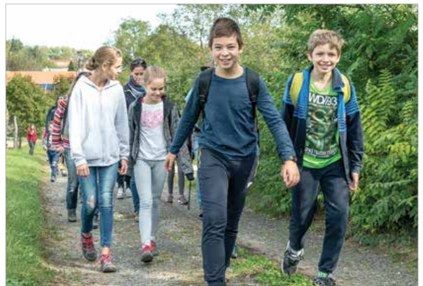
Szaporán szedték a gyerekek a lábukat, mert nemcsak tizennégy kilométer volt előttük, hanem egy mini erdei koncert is