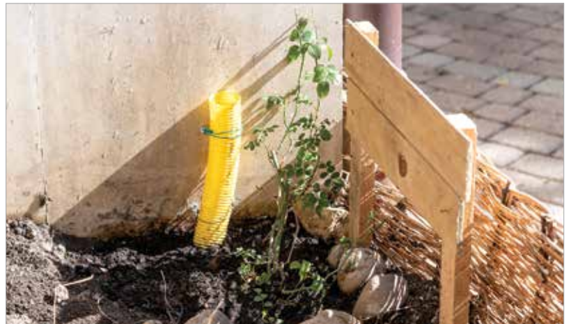
A dréncsővön keresztül kapja a rózsza a tápanyagpótlást