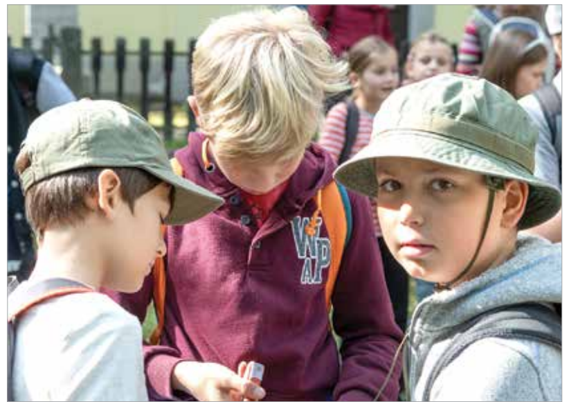
Találkozó a gánti templom előtt