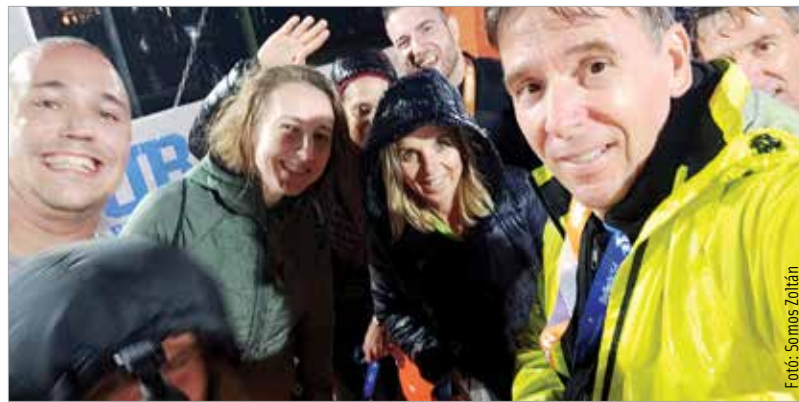
Diadalittas célba érés zuhogó esőben

Szerdán este volt az a pont, amikor először fáradtságot éreztem, pedig volt egy hétvége, amit végigfutottunk, végigszorkoltunk alvás nélkül. Jó, mondhatjuk, hogy dolgozott az adrenalin, felbolydult a szervezetem, felszabadultak az örömhormonok, és ez mind igaz is. Ezzel együtt is úgy érzem, felszabadult bennem az az érzés, amit a már sokszor elcsépelet közösség szóval tudnék leírni. Elviselni egymást fáradtan, fejfájósan, izgatottan, örömben, félelemben, izzadva, fázza, éhesen és jóllakottan – bárhogyan. Egy külön világ ez, olyan lendület, ami azóta minden nap kihúzza a parkba, hogy még egy és még egy kört fussak, mintha még mindig ott lennék sokadmagammal az északi vagy a déli parton. Van-e azóta stressz a mindennapokban? Lehetne, de nincs. Ha mégis úgy érzem, futok még egy kört!