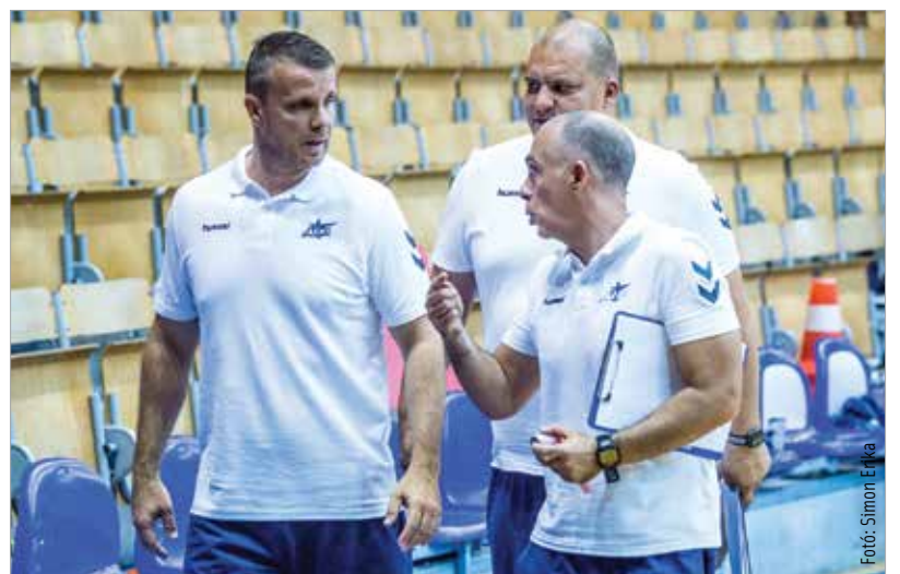
Egyelőre nem a taktika megvalósítása a legnagyobb gondja az Alba Fehérvár edzői stábjának