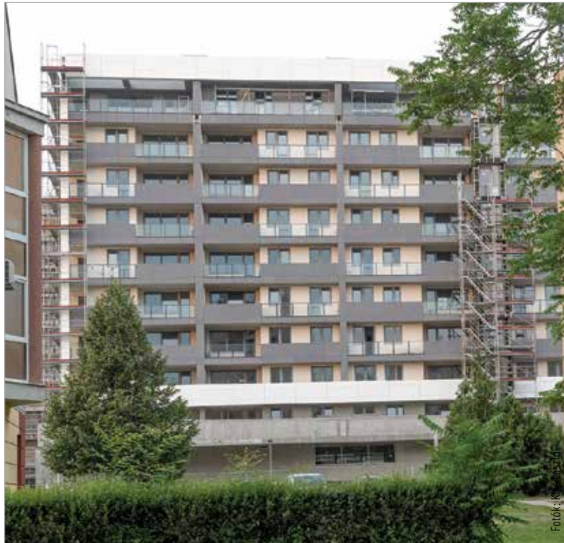
Fehérváron nagyon sok új építésű ingatlan van, a kedvezményes áfa hatására még több várható

A kormány előzőleg 2015 decemberében döntött az új lakások