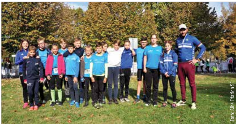
A balatonboglári országos duatlonbajnokságon összesen huszonöt versenyző képviselte az Alba Triatlon és Székesfehérvár színeit