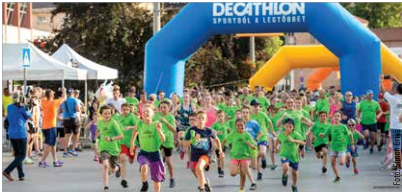
A virtuális térbe költözött a Depónia és az ARAK rendezvénye, de futni továbbra is a valóságban érdemes!